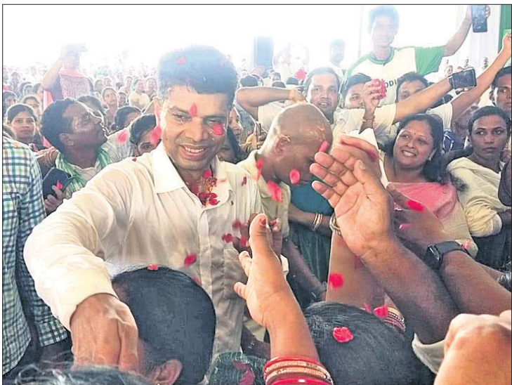
ବ୍ୟାସନଗର ରାଜ୍ୟ ପଡ଼ିଆଠାରେ ଶୁକ୍ରବାର ଅନୁଷ୍ଠିତ ଅଭିଯୋଗପତ୍ର ଗ୍ରହଣ କାର୍ଯ୍ୟକ୍ରମରେ ୫-ଟି ସଚିବ ଭି.କେ. ପାଣ୍ଡିଆନ ଏବଂ ଉପସ୍ଥିତ କର୍ମସାଧାରଣ।