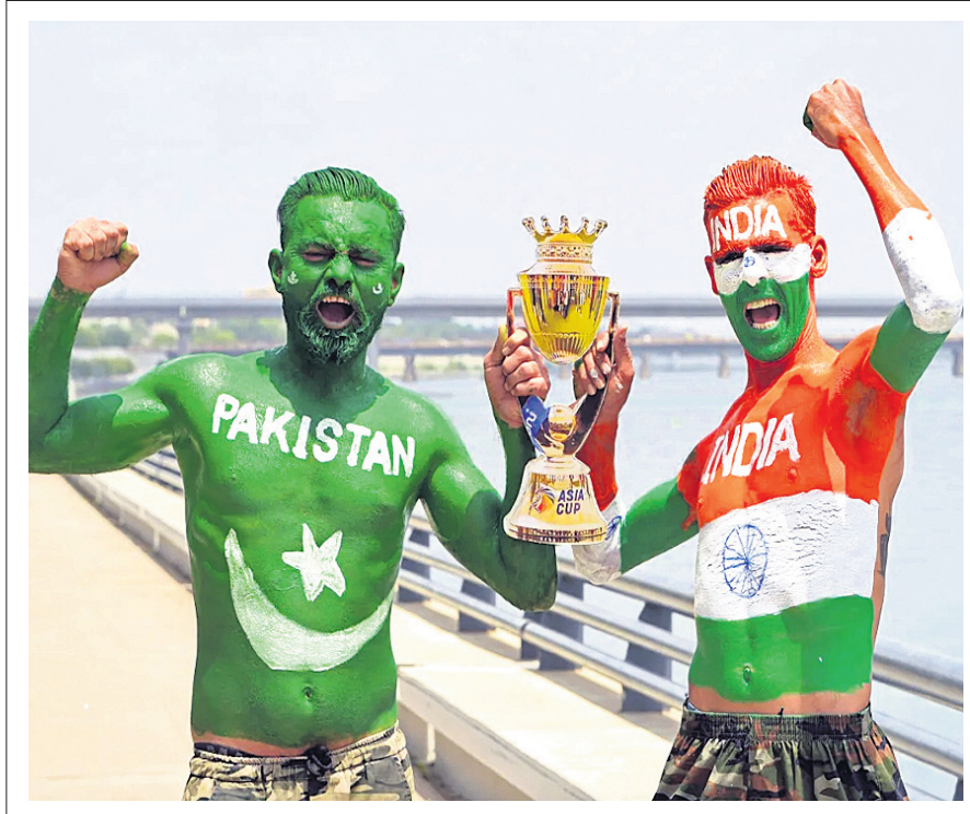
ଶ୍ରୀଲଙ୍କାର ପାକିସ୍ତାନରେ ଭାରତ-ପାକିସ୍ତାନ ଏସିଆ କପ୍ ଟ୍ରିକେଟ ମ୍ୟାଚ ପୂର୍ବରୁ ଶୁକ୍ରବାର ଅହମଦବାଦରେ ଉଭୟ ଦଳର ଦୁଇ ପ୍ରଶଂସକ।