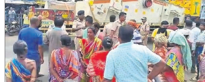
ବ୍ୟସ୍ତ ଛକରେ ଦୋକାନୀମାନେ ପ୍ରତିବାଦ କରୁଛନ୍ତି।