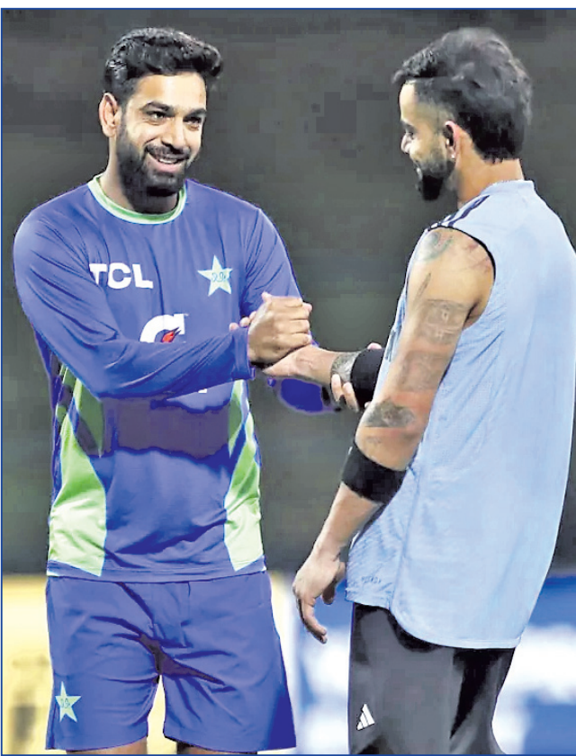
ଶୁକ୍ରବାର ଅଭ୍ୟାସ ଅବସରରେ ଏକ ବିଶେଷ ମୁହୂର୍ତ୍ତରେ ପାକିସ୍ତାନର ହାରିସ ରୌଫ ଓ ଭାରତର ବିରାଟ କୋହଲି।

ଏସିଆ କପ୍ ଟ୍ରିକେଟ ଚୁନାମେଣ୍ଟରେ ଶନିବାର ଭାରତ ଓ ପାକିସ୍ତାନ ମଧ୍ୟରେ ମ୍ୟାଚ ଅନୁଷ୍ଠିତ ହେବ। ଦୁଇ ପାରମ୍ପରିକ ପ୍ରତିଦ୍ୱନ୍ଦ୍ୱୀ ଦଳ ବିପକ୍ଷ ମ୍ୟାଚ ସମ୍ପର୍କରେ ଚର୍ଚ୍ଚାରେ ରହିଥାଏ। ଏଥର ମଧ୍ୟ ଏହି ମ୍ୟାଚ ଉପରେ ସମସ୍ତଙ୍କ ନଜର ରହିଛି। ଏଥିରେ ପୁଷ୍ପାଞ୍ଜର ଭାରତର ଚପ୍-୩ ବ୍ୟାଟର ରୋହିତ ଶର୍ମା, ଶୁଭମନ ଶିଲ୍ଡ, ବିରାଟ କୋହଲି ଏବଂ ପାକିସ୍ତାନର ପେୟୁସ୍ତୁନ ହାରିସ ରୌଫ, ଶାହିନ ଶାହା ଆଦି ଓ ନସିମ ଶାହାଙ୍କ ମଧ୍ୟରେ ପ୍ରକାଶିତ ହେବ। ଆଗକୁ ଦିନିକିଆ ବିଶ୍ୱକପ୍ ଆୟତ୍ତୀକାରୀ ଏହି ମ୍ୟାଚ ଉପରେ ଟ୍ରେସ ରିହାଳିଆ ଓ ଆହୁରି ଅଧିକ କିଛି ହେବ। ଅଷ୍ଟ୍ରେଲିଆରେ ଅନୁଷ୍ଠିତ ଗତ ଚିତ୍ର ୨୦ ବିଶ୍ୱକପ୍ରେ ରୌଫଙ୍କ ବକ୍ତୃତା ପରାସ୍ତ ହୋଇଥିଲା ରୋହିତ। ତେଣୁ ଆଗାମୀ ମ୍ୟାଚରେ ଏହାର ଜବାବ ଦେବା ପାଇଁ ତାଙ୍କ ନିକଟରେ ସୁଯୋଗ ରହିବ। ଏସିଆ କପ୍ ଏଥର ୫୦ ଓଭର ଫର୍ମାଟକୁ ଫେରିଛି। ତେଣୁ ଅଂଶଗ୍ରହଣକାରୀ ୬ ମଧ୍ୟରୁ ୫ ଦଳ ଏଥିରେ ଭଲଭାବେ ନିଜକୁ ପ୍ରସ୍ତୁତ କରିପାରିବେ। ଭାରତ-ପାକିସ୍ତାନ ମ୍ୟାଚ ବର୍ଷା ଯୋଗୁ ପ୍ରଭାବିତ ହୋଇପାରେ ବୋଲି ପୂର୍ଣ୍ଣନୁମାନ ରହିଛି। ତେବେ ଶାହିନ, ରୌଫ ଏବଂ ନସିମଙ୍କ ବିପକ୍ଷରେ ହୋଇଥିବା ଚର୍ଚ୍ଚା ଓ ଗୋଟିଏ ବିଶେଷତା ବ୍ୟତିତ ପାଇଁ ପ୍ରସ୍ତୁତ ଥିବେ ବୋଲି ଭାରତୀୟ ପ୍ରଶଂସକ ଆଶାରେ ରହିଛନ୍ତି। ଓଭରକାଷ୍ଟ କର୍ମିଷ୍ଟମାନଙ୍କୁ ପାକିସ୍ତାନ ଦ୍ରୁତ ବୋଲର ନିଷ୍ଠିତ ଫାଇଦା ଉଠାଇବାକୁ ଚାହଁବେ। ବିଶେଷ କରି ପାଞ୍ଜିରପୂର୍ଣ୍ଣ ଭାବରେ ଭାରତର ଚପ୍-୩ ସେଟ୍ ହେବା ପୂର୍ବରୁ ସେମାନେ ମ୍ୟାଚକୁ ନିୟନ୍ତ୍ରଣକୁ ନେବା ଆଶାରେ ରହିବେ। ଉଭୟ ଭାରତ ଓ