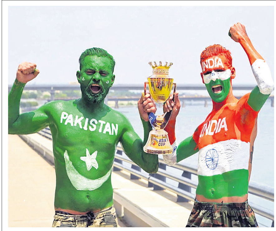
ଶ୍ରୀଲଙ୍କାର ପାକିସ୍ତାନରେ ଭାରତ-ପାକିସ୍ତାନ ଏସିଆ କପ୍ ଟ୍ରିକେଟ ମ୍ୟାଚ ପୂର୍ବରୁ ଶୁକ୍ରବାର ଅହମଦାବାଦରେ ଉଭୟ ଦଳର ଦୁଇ ପ୍ରଶଂସକ।