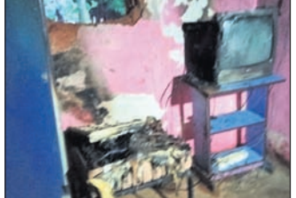
ନନ୍ଦାହାଣ୍ଡି, ୧୮୯ (ପ୍ରତାପ କୁମାର ଦାଶ)

ନବରଙ୍ଗପୁର ଜିଲ୍ଲା ନନ୍ଦାହାଣ୍ଡି ବ୍ଲକ୍ ପଡ଼ାଳଗୁଡ଼ା ପଞ୍ଚାୟତ ଅଧୀନ ପୁରୁଣାପାଣିଗୁଡ଼ାରେ ଆଦିବାସୀକୋଲମ୍ବୀରେ ସୁନା ସୁନାକ ଘରେ ନିଆଁ ଲାଗି ଯାଇଛି। ଘରର ଆସବାପତ୍ର, ୩୦୦୦ ଟଙ୍କା, ଜମି ପତ୍ତା, ପେନସନ ଖାତା, ଚିଠି, କୁଳର ଆଦି ସମ୍ପୂର୍ଣ୍ଣ ଜଳି ପାଉଁଶ ହୋଇଯାଇଛି। ଅଗ୍ନିଶମ ବାହିନୀ ଆସିବା ପୂର୍ବରୁ ଗ୍ଲାନାଟର ଲୋକେ ନିଆଁକୁ ଆୟତ୍ତ କରିବାରିଥିଲେ ମଧ୍ୟ ଘରେ ଥିବା ବହୁ ମୂଲ୍ୟବାନ ଜିନିଷ ନଷ୍ଟ ହୋଇ ଯାଇଛି। ସୂଚନା ପ୍ରକାରେ ଦିନ ୧୧ଟାରେ ସର୍ବ ସକ୍ରିୟ ଘରେ ନିଆଁ ଲାଗିଥିବା ବେଶ୍ ସୁନ୍ଦରୀ ଗ୍ରାମବାସୀଙ୍କୁ ଜାଣିଥିଲେ। କିଛି ବର୍ଷ ପୂର୍ବେ ସୁନ୍ଦରୀଙ୍କ ସ୍ୱାମୀଙ୍କ ମୃତ୍ୟୁ ହୋଇଯାଇଥିଲା। ଏବେ ସେ ଡିଆ ଏବଂ ୩ ନାତି ନାତୁଣୀଙ୍କ ସହ ରହୁଛନ୍ତି। ଘର ଜଳି ଯାଇଥିବାରୁ ପରିବାର ଲୋକେ ଚିନ୍ତାରେ ଅଛନ୍ତି।