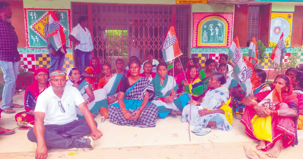
ଝରିଗାଁ ବୁକ୍ କଂଗ୍ରେସ୍ କର୍ମୀମାନେ ଧାରଣା ଦେଉଛନ୍ତି।

ବୁକ୍ରେ କୌଣସି କାର୍ଯ୍ୟ ନ ହୋଇ ଲକ୍ଷାଧିକ ଟଙ୍କା ହଠାତ୍ ଅଭିଯୋଗ କରି ଶୁକ୍ରବାର ଝରିଗାଁ ବୁକ୍ କଂଗ୍ରେସ୍ ବୁକ୍ କାର୍ଯ୍ୟାଳୟ ଘେରାଇ କରିଛି। ଏଫିଲିଏନ୍ଆରଭିଏସ୍ରେ ଏକାଧିକ ଦୁର୍ଗତି ହୋଇଥିବା ନେଇ ଚିଠା ପ୍ରସ୍ତୁତ କରି ବୁକ୍ କଂଗ୍ରେସ୍ କର୍ମୀ ବିତିଓଙ୍କୁ କାର୍ଯ୍ୟାଳୟ ସମ୍ମୁଖରେ ଦାୟିତ୍ୱ ହେବ ଆପେକ୍ଷା ଭବାନୀପାଟଣାକୁ ବିଶାଖାପାଟଣା ଯାଉଥିବା ଏକ ଟ୍ରକ୍ (ଟିଏନ୍-୫୨ଏବି-୨୨୩୭) ପତି ଯାନୀଙ୍କ ବାମ ଗୋଡ଼ ଉପରେ ଚଢ଼ିଯାଇଥିଲା। ମଇଦଳପୁର ପୋଲିସ୍ ଘଟଣାସ୍ଥଳରେ ପହଞ୍ଚି ଗ୍ଲାନାଟର ମୁଚକଙ୍କ ସହାୟତାରେ ପୋଲିସ୍ ଗାଡ଼ିରେ ପାପଡ଼ାହାଣ୍ଡି ଡାକ୍ତରଖାନାକୁ ନେଇଥିଲେ। ପତିଙ୍କ ସ୍ୱାସ୍ଥ୍ୟାବସ୍ଥା ଗୁରୁତର ଥିବାରୁ ତାଙ୍କୁ ନବରଙ୍ଗପୁର ଜିଲ୍ଲା ମୁଖ୍ୟ ଚିକିତ୍ସାଳୟକୁ ଗ୍ଲାନାଟର କରାଯାଇଥିଲା। ସେଠାରୁ ତାଙ୍କୁ କୋରାପୁଟ ମେଡିକାଲକୁ ପଠାଯାଇଥିବା ସୂଚନା ମିଳିଛି। ପୋଲିସ୍ ଟ୍ରକ୍ ଜବତକରି ତଦନ୍ତ ଜାରି ରଖିଛି ବୋଲି ଥାନାଧିକାରୀ ନବର ନନ୍ଦ ସୂଚନା ଦେଇଛନ୍ତି।