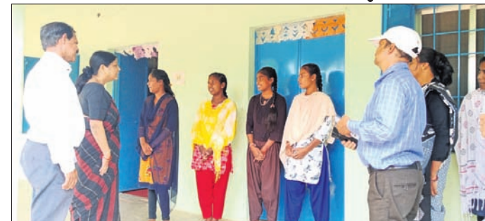
ନବରଙ୍ଗପୁର, ୧୮୯ (ସେବାଶିବ ପ୍ରହରାଜ)

ରାଜ୍ୟସ୍ତରୀୟ ଯାତ୍ରା ଦଳ ନବରଙ୍ଗପୁର ଜିଲ୍ଲାର ବିଭିନ୍ନ ଶିଶୁଗୃହ ପରିଦର୍ଶନରେ ଯାଇଥିଲେ। ଏହା କିପରି ଭବିଷ୍ୟତରେ ଜିଲ୍ଲାର ବିଭିନ୍ନ ଗୃହ ପରିଦର୍ଶନ କରିଛନ୍ତି। ମହିଳା ଓ ଶିଶୁ ବିଭାଗର ନିର୍ଦ୍ଦେଶକ, ଅସହାୟ ଶିଶୁମାନଙ୍କ କିପରି ସୁସ୍ଥ ଅତିରିକ୍ତ ସର୍ବିସ, ଓଡ଼ିଶା ରାଜ୍ୟ ଶିଶୁ ଅଧିକାର ଓ ସୁରକ୍ଷା ଆୟୋଗ ସଦସ୍ୟ, ଓଡ଼ିଶା ରାଜ୍ୟ ଶିଶୁ ସୁରକ୍ଷା ସମାଜ ସଦସ୍ୟ, ନବରଙ୍ଗପୁର ଜିଲ୍ଲାର ଅତିରିକ୍ତ ସ୍ୱାସ୍ଥ୍ୟ ଜିଲ୍ଲାରେ ଏକ ଆଦର୍ଶ ଶିଶୁ ଗୃହ ହେବ ଆଦର୍ଶ ଅନୁପାଦନ କରାଯାଇଛି।