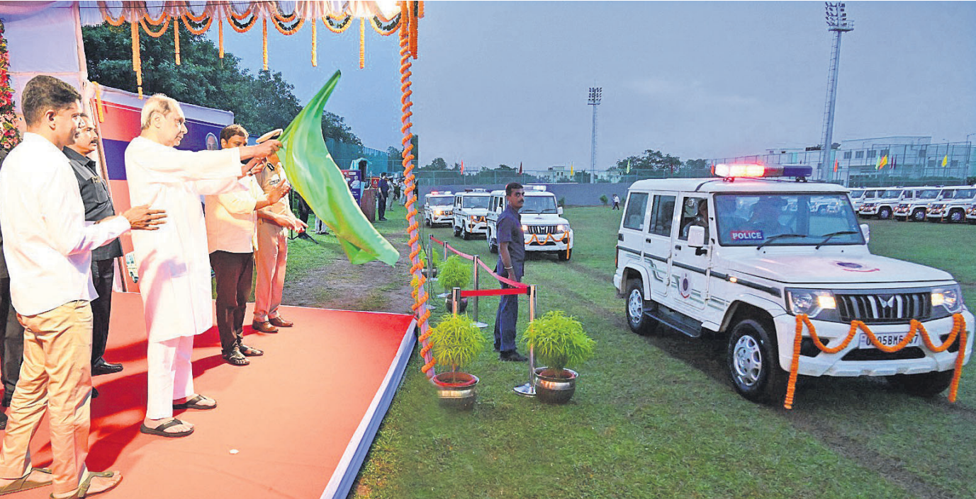
ପୃଷ୍ଠାମନ୍ତ୍ରୀ ନବୀନ ପଟ୍ଟନାୟକ ଶନିବାର ଭୁବନେଶ୍ୱର ଓଏସ୍‌ସ୍‌ସି ୭ମ ବାଟାଲିଅନ ପରିସରରେ ଓଡ଼ିଶାବାସୀଙ୍କ ସେବାରେ ୧୦୦ଟି ପୋଲିସ୍ ଯାନର ଲୋକାର୍ପଣ କରୁଛନ୍ତି। ନିକଟରେ ଅଛନ୍ତି ୫-ଟି ସଟିବ ଭି.କେ. ପାଠିଆନ। (ରିପୋର୍ଟ: ପୃଷ୍ଠା-୪)