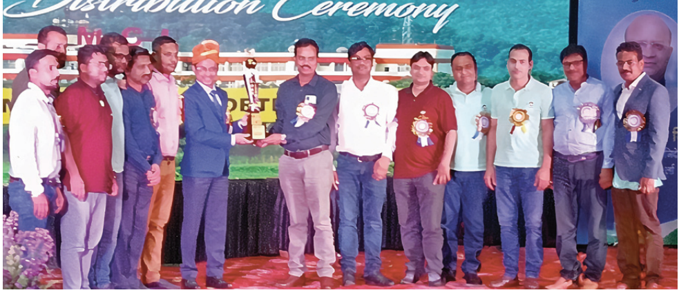
ଭୁବନେଶ୍ୱର,୨୧ (ଅଭୟ ବାଣ)