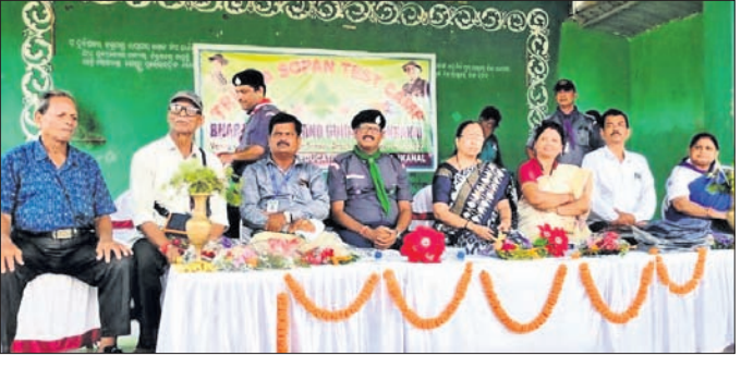
ଭାରତ ସ୍ୱାଭାବ ଓ ଗାଳତ୍ୱ ପକ୍ଷରୁ ଟେଣ୍ଡର କ୍ୟାମ୍ପ ଆରମ୍ଭ

ଭାରତ ସ୍ୱାଭାବ ଗାଳତ୍ୱ ପକ୍ଷରୁ ଟେଣ୍ଡର କ୍ୟାମ୍ପ