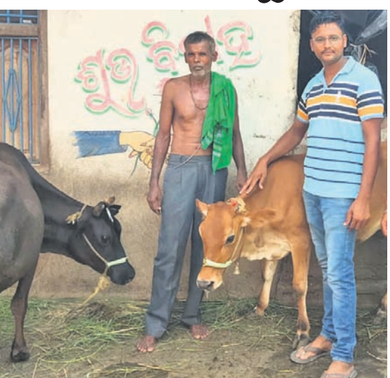
ତିହିଡ଼ି ବୁକର ଫଟୋପୁର ଗ୍ରାମରେ କ୍ଷୀର ଦେଉଥିବା ବାଛୁରୀ ।

ଭଦ୍ରକ, ୨୧୯ (ସମାଚାର ରାଜ୍ୟ) ମାତ୍ର ୧୩ ମାସର ଏକ ବାଛୁରୀ ଗର୍ଭବତୀ ନ ହୋଇ ମଧ୍ୟ ଦିନକୁ ୩ ଲିଟର କ୍ଷୀର ଦେବା ଦେବା ଭଦ୍ରକ ଜିଲ୍ଲା ତିହିଡ଼ି ଅଞ୍ଚଳରେ ଚର୍ଚ୍ଚାର ବିଷୟ ହୋଇଛି । କୃତ୍ରିମ ପ୍ରଜନନରୁ ଜନ୍ମ ହୋଇଥିବା ମାଛ ବାଛୁରୀଟି ଏବେ କାମଧେନୁର ଆଖ୍ୟା ପାଇଛି । ଏପରି ଆଶ୍ଚର୍ଯ୍ୟକର ଘଟଣା ଦେଖିବାକୁ ମିଳିଛି ତିହିଡ଼ି ବୁକର ଫଟୋପୁର ଗ୍ରାମରେ । ଭଲ ଗ୍ରାମର ସୁଦର୍ଶନ ବାସକ ବାଛୁରୀ ମାତ୍ର ୧୨ମାସ ବୟସରୁ ବୁଢ଼ା ଉପାଦାନ ଆରମ୍ଭ କରିଛି । ପ୍ରଥମେ ଏକ ମାସ ବୟସ ହେବା ପରେ ଉକ୍ତ ବାଛୁରୀର ଚିର ଏବଂ ପହା ବାହାରିବା ଆରମ୍ଭ ହେଲା । ତାହାଙ୍କ ପରାମର୍ଶ ଅନୁସାରେ ଭଦ୍ରକ ଜିଲ୍ଲା ତିହିଡ଼ି ଅଞ୍ଚଳରେ ଚର୍ଚ୍ଚାର ବିଷୟ ହୋଇଛି । କୃତ୍ରିମ ପ୍ରଜନନରୁ ଜନ୍ମ ହୋଇଥିବା ମାଛ ବାଛୁରୀଟି ଏବେ କାମଧେନୁର ଆଖ୍ୟା ପାଇଛି । ଏପରି ଆଶ୍ଚର୍ଯ୍ୟକର ଘଟଣା ଦେଖିବାକୁ ମିଳିଛି ତିହିଡ଼ି ବୁକର ଫଟୋପୁର ଗ୍ରାମରେ । ଭଲ ଗ୍ରାମର ସୁଦର୍ଶନ ବାସକ ବାଛୁରୀ ମାତ୍ର ୧୨ମାସ ବୟସରୁ ବୁଢ଼ା ଉପାଦାନ ଆରମ୍ଭ କରିଛି ।