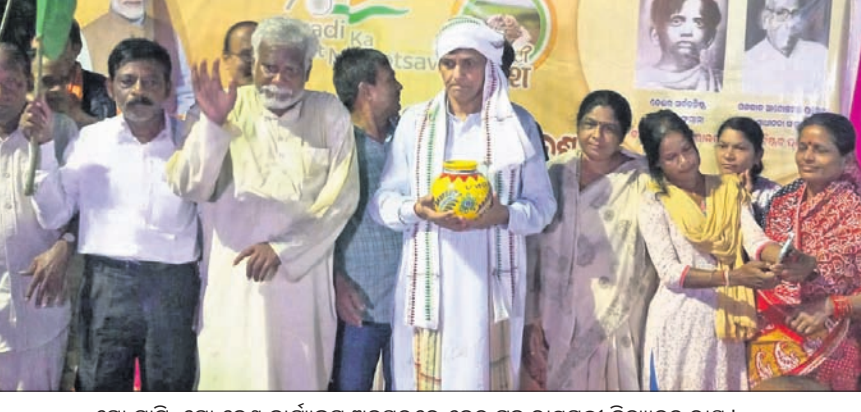
ମୋ ମାଟି, ମୋ ଦେଶ କାର୍ଯ୍ୟକ୍ରମ ଅବସରରେ କେନ୍ଦ୍ର ଗୃହ ରାଷ୍ଟ୍ରମନ୍ତ୍ରୀ ନିତ୍ୟାନନ୍ଦ ରାୟ।