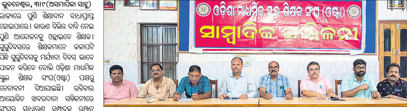
ଖବରଦାତା ସମ୍ମିଳନୀରେ ଉପସ୍ଥିତ ଓଷ୍ଠୀ କର୍ମକର୍ମୀମାନେ ଆୟୋଜନ ସମ୍ପର୍କରେ ସୂଚନା ଦେଉଛନ୍ତି।

ଭୁବନେଶ୍ୱର, ୩୩୯ (ଅସମାପିକା ସାହୁ) ରାଜ୍ୟରେ ପୁଣି ଶିକ୍ଷାଦାନ ବାଧାପ୍ରାପ୍ତ ହୋଇପାରେ। କାରଣ ବିଭିନ୍ନ ଦାବି ନେଇ ପୁଣି ଆୟୋଜନକୁ ଓହ୍ଲାଇଦେ ଶିକ୍ଷକ ଗୁରୁଦିବସରେ ଶିକ୍ଷକମାନେ କଳାପତି ପିନ୍ଧି ଗୁରୁଦିବସକୁ ମର୍ଯ୍ୟାଦା ଦିବସ ଭାବେ ପାଳନ କରିବେ ବୋଲି ଓଡ଼ିଶା ମାଧ୍ୟମିକ ସ୍କୁଲ ଶିକ୍ଷକ ସଂଘ (ଓଷ୍ଠୀ) ପକ୍ଷରୁ ଚେତାବନା ଦିଆଯାଇଛି।