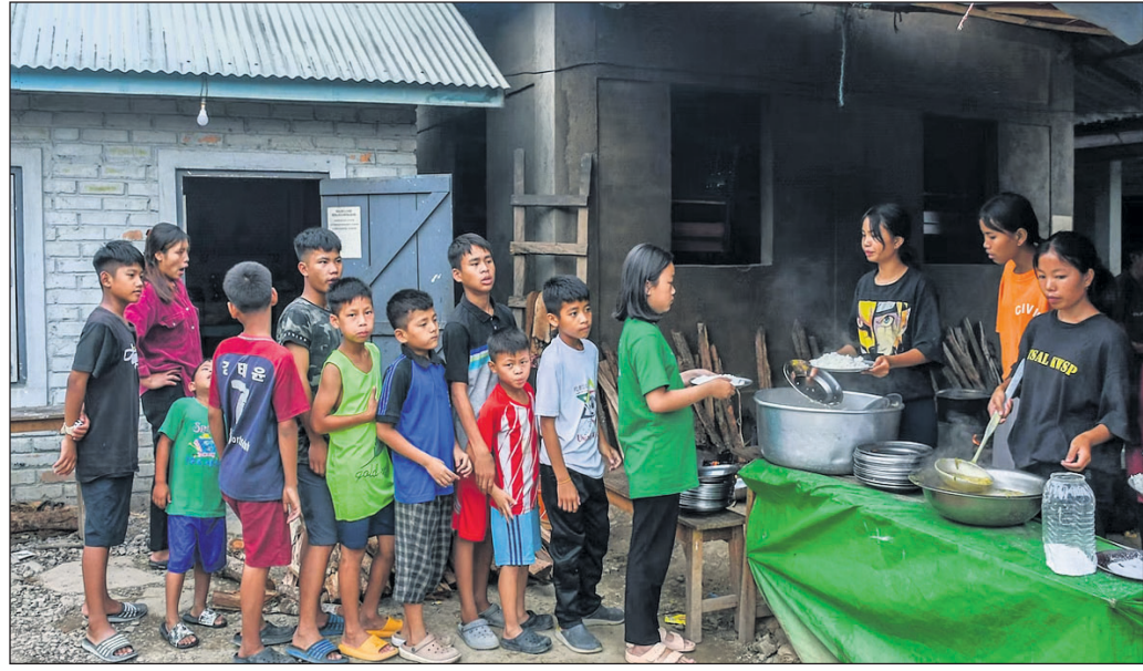
ମଣିପୁରର ଏକ ରିଲିଫ୍ କ୍ୟାମ୍ପରେ ପିଲାମାନଙ୍କୁ ଖାଦ୍ୟ ଦିଆଯାଉଛି।