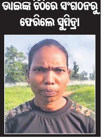
ମାଲକାନଗିରି, ୩୯ (ନୃସିଂହ ଚରଣ ମହାନ୍ତି)