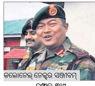
କଲୋନେଲ୍ ନେତୃତ୍ୱ ସଞ୍ଚାୟକ ଉତ୍ତମ, ୩୯

ମଣିପୁର ସ୍ଥିତି ସମ୍ବନ୍ଧରେ ଅବସରପ୍ରାପ୍ତ ସେନା ଅଧିକାରୀ ମାଧୁକାରୀ ସର୍ଜିକାଲ ଷ୍ଟାଲକର ନେତୃତ୍ୱ ନେଇଥିଲେ