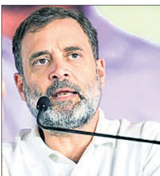
ଚୌଧୁରୀ କହିଛନ୍ତି। କମିଟିରେ ରାଜ୍ୟ ସଭାର ବିରୋଧୀ ଦଳ ନେତା ମଲ୍ଲିକାର୍ଜୁନ ଦେବ ଖାର୍ଗେଙ୍କୁ ନିଆ ନ ଯାଇ ପୂର୍ବତନ

‘ଏକ ରାଷ୍ଟ୍ର, ଏକ ନିର୍ବାଚନ’ ଚିନ୍ତାଧାରାକୁ କଂଗ୍ରେସ ନେତା ରାହୁଲ ଗାନ୍ଧୀ ନିନ୍ଦା କରିଛନ୍ତି। ଏହା ଭାରତୀୟ ଏକତା ଓ ରାଜ୍ୟଗୁଡ଼ିକ ଉପରେ ଆକ୍ରମଣ ବୋଲି ରବିବାର ରାହୁଲ କୁଲ୍‌ଟ୍ କରିଛନ୍ତି। ଏକସଙ୍ଗେ ନିର୍ବାଚନ କରିବାର ସମ୍ଭାବ୍ୟତା ଉପରେ ମତାମତ ରଖିବା ଲାଗି ସରକାର ପୂର୍ବତନ ରାଷ୍ଟ୍ରପତି ରାମନାଥ କୋବିନ୍ଦଙ୍କ ଅଧିକାରରେ ଏକ ଉଚ୍ଚସ୍ତରୀୟ କମିଟି ଗଠନ କରିଛନ୍ତି। ତେବେ ଉକ୍ତ କମିଟିରେ ନ ରହିବାକୁ ଚାହାନ୍ତି ନାହିଁ ବୋଲି କଂଗ୍ରେସ ନେତା ଅଧୀର ରଞ୍ଜନ