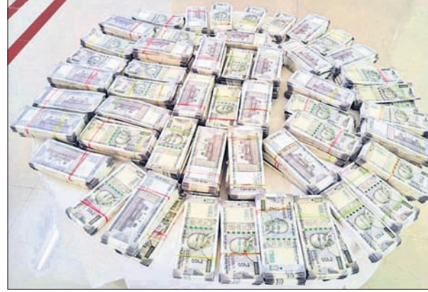
ଭୁବନେଶ୍ୱର, ୩୯ (ସତ୍ୟଜିତ ରାଉତ)