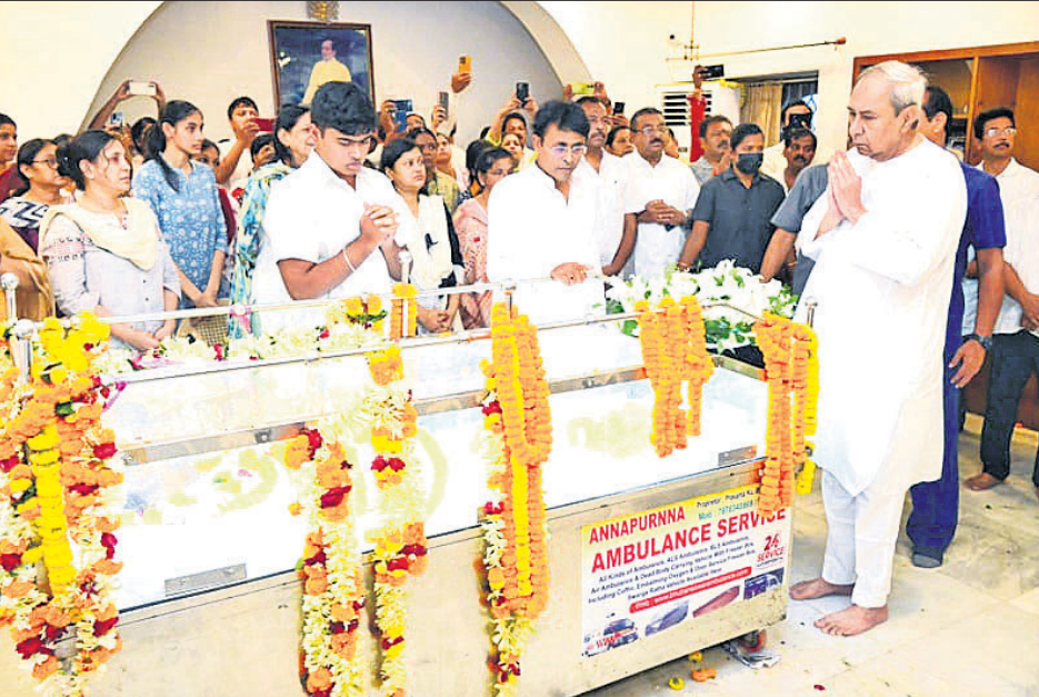
ଭୁବନେଶ୍ୱର ନୟାପଲ୍ଲୀରୁ ସୂର୍ଯ୍ୟ ପାତ୍ରଙ୍କ ବାସଭବନରେ ମୃତ୍ୟୁମନ୍ତ୍ରୀ ନବୀନ ପଟ୍ଟନାୟକ ଶ୍ରଦ୍ଧାଞ୍ଜଳି ଅର୍ପଣ କରୁଛନ୍ତି।