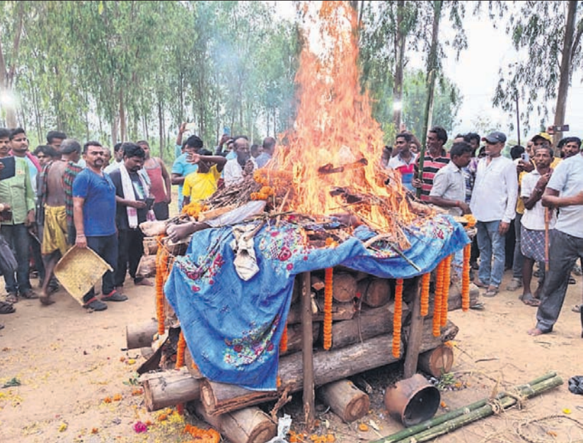
ଦିଗପହଣ୍ଡିଠାରେ ସୂର୍ଯ୍ୟ ପାତ୍ରଙ୍କ ଶେଷକୃତ୍ୟ ସମ୍ପନ୍ନ କରାଯାଇଛି।

ପକ୍ଷୀ ଠିକଣା ବଦଳାଇବାରେ ଲାଗିଛନ୍ତି। ପୂର୍ବରୁ ବଗରହନରେ ଦେଶୀୟ ପକ୍ଷୀମାନେ ଭିତ୍ତ କମାଳଥିଲେ। ୨୦୧୯ ହେଲେ ବଗରହନଠାରୁ ୩ କିମି ଦୂର ମଠାଠିଆରେ ଦେଶୀୟ ପକ୍ଷୀଙ୍କ କଳରବ ଶୁଭୁଛି। ୨୦୧୯ରୁ ମଠାଠିଆ ସହିତ ଲକ୍ଷ୍ମୀପ୍ରସାଦଠିଆ ଓ ଦୁର୍ଗାପ୍ରସାଦଠିଆରେ ଦେଶୀୟ ପକ୍ଷୀମାନେ ଭିତ୍ତ କମାଳଛନ୍ତି। ଚଳିତବର୍ଷ ଏକମାଣିଆର ବାଲିକିଆ ଆଇଲ୍ୟାଣ୍ଡ ପକ୍ଷୀଙ୍କ ଗୁଡ଼ିକ ଠିକଣା ପାଇଛନ୍ତି। ସବୁଠୁ ବୃହତ୍ପୁଞ୍ଜା କଥା ହେଲା ୨୦ ବର୍ଷରୁ ଉର୍ଦ୍ଧ୍ୱ ପର୍ଯ୍ୟନ୍ତ ଧରି ଦେଶୀୟ ପକ୍ଷୀମାନେ ବଗରହନରେ ଭିତ୍ତ କମାଳଥିଲେ। ସେହି ଘୁମିରେ ପର୍ଯ୍ୟଟକମାନେ ଦେଶୀୟ ପକ୍ଷୀଙ୍କୁ ଦେଖିବା ପାଇଁ ଖାତ ଗାଢ଼ାଏ ମଧ୍ୟ ନିର୍ମାଣ କରାଯାଇଥିଲା। ମାତ୍ର ଜଗତର ୬ ବର୍ଷ ହେଲା ବଗରହନରେ ଗୋଟିଏ ଦି ପକ୍ଷୀ ବସା ବାନ୍ଧୁ ନାହାନ୍ତି। ଦେଶୀୟ ପକ୍ଷୀ ପରିବେଶବିତ୍ତୁ ଆଶ୍ଚର୍ଯ୍ୟ କରନ୍ତି। ପରିବେଶ ପ୍ରବୃତ୍ତଶା, ଜଳବାୟୁ ପରିବର୍ତ୍ତନ ଓ ସେମାନଙ୍କ ପାଇଁ ଖାଦ୍ୟ ଅଭାବ ଯୋଗୁ ଦେଶୀୟ ପକ୍ଷୀ ବାରମ୍ବାର ଠିକଣା ବଦଳାଇ ଥିବାକୁ କୁହାଯାଇଛି।