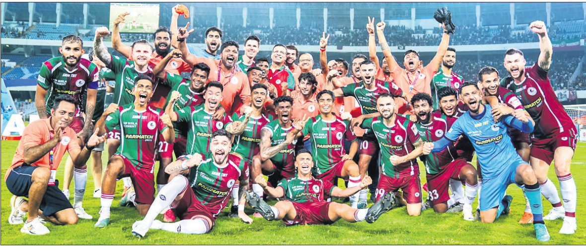
ଭୁବନେଶ୍ୱର କପ୍ ଫୁଟବଲ ଚାମ୍ପିୟନ ହେବାପରେ ଉଲ୍ଲାସିତ ମୋହନ ବାଗାନ ଯୁବକ ଟୀମର ଲାଏଓଟ୍ ଦଳ।