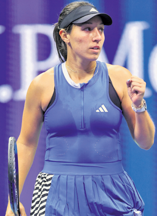
ମ୍ୟାଚ ଜିତିବାପରେ ଜେସିକା ପେଗୁଲା।

ଲୁସର୍ଭ, ୩୩୯ (ପି.ଟି.) ଚେନିସ୍ ଗ୍ରାଣ୍ଡସ୍ଲାମ ଯୁବକ୍ ଓପନ ମହିଳା ସିଙ୍ଗଲ୍‌ର ଚତୁର୍ଥ ରାଉଣ୍ଡରେ ପ୍ରବେଶ କରିଛି ଜେସିକା ପେଗୁଲା, ମାଡିସନ୍ କିସ୍ ଓ ଓଡୁ ଜାବେର୍। ଏହା ସହିତ ଚତୁର୍ଥ ରାଉଣ୍ଡରେ ଦୁଇ ଆମେରିକୀୟ ଖେଳାଳି ପେଗୁଲା ଓ କିସ୍ ପରସ୍ପର ମୁକାବିଲା କରିବେ। ବିଶ୍ୱ ମାନ୍ୟତାର ୩ ନମ୍ବର ଗ୍ଲାନରେ ଥିବା ଜେସିକା ପେଗୁଲା ୬-୪, ୪-୬ ଓ ୬-୨ରେ ଯୁକ୍ତରାଜ୍ୟ ଏଲିନା ସ୍ୱିଡୋଲିନାକୁ ପରାସ୍ତ କରିଥିଲେ। ୨୦୧୭ରେ ପ୍ରଥମ ଥର ଯୁବକ୍ ଓପନରେ ରନର୍ ଅପ୍ ରହିଥିବା ଜେସିକା ଏହା ପରଠାରୁ ଗୋଟିଏ ଦି ଗ୍ରାଣ୍ଡସ୍ଲାମର କ୍ୱାର୍ଟର ଫାଇନାଲରେ ପ୍ରବେଶ କରିବାରେ ସମର୍ଥ ହୋଇ ନାହାନ୍ତି। ଶନିବାର