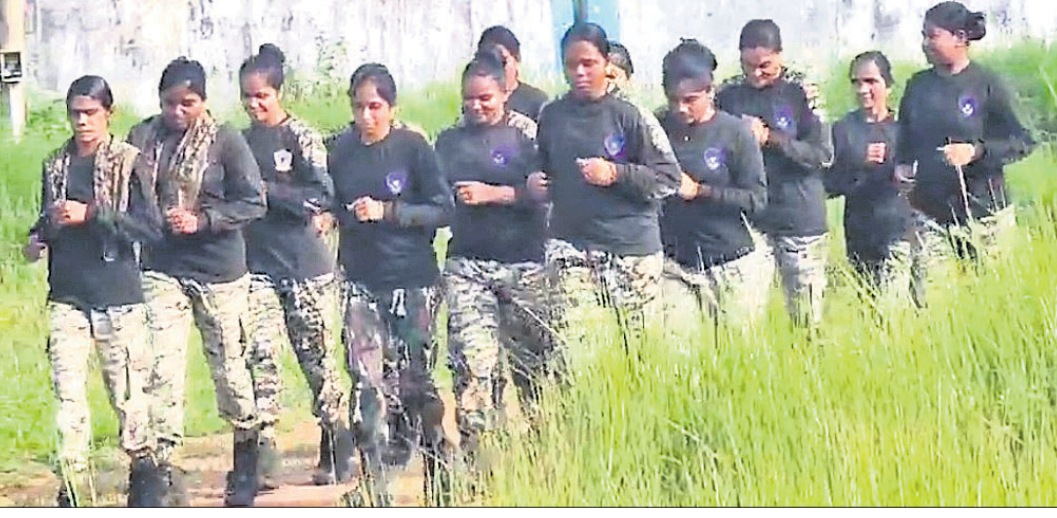
ଛତିଶଗଡ଼ ବିଜାପୁର ଜିଲ୍ଲାରେ ମହିଳା କମାଣ୍ଡୋମାନେ ମାଓବାଦୀ ବିରୋଧୀ ଅଭିଯାନରେ ବାହାରିଛନ୍ତି।

କେତେକ ମହିଳା ଦୀର୍ଘ ବର୍ଷ ଧରି ବିଭିନ୍ନ ମାଓବାଦୀ ସଂଗଠନରେ କାର୍ଯ୍ୟ କରୁଛନ୍ତି। ବିଭିନ୍ନ ସମୟରେ ସେମାନେ ସଂଗଠନ ଉପରେ ଅସନ୍ତୋଷ ବ୍ୟକ୍ତ କରି ସମାଜର ମୁଖ୍ୟ ସ୍ତ୍ରୋତରେ ସାମିଲ ହେବା ଲାଗି ପୋଲିସ ପାଖରେ ଆତ୍ମସମର୍ପଣ କରୁଛନ୍ତି। ପରେ ସେମାନଙ୍କୁ ପୋଲିସ ପକ୍ଷରୁ ନୂତନ ଦାୟିତ୍ୱ ଦିଆଯାଇଛି। ଫଳରେ ସେମାନେ ତିଷ୍ଟିକ୍ଷ ରିଜର୍ଭ ଗାର୍ଡ(ତିଆରୁଜି)ବାହିନୀର ଜଣେ ଜଣେ ଶକ୍ତିଶାଳୀ ମହିଳା କମାଣ୍ଡୋ ହୋଇ ଜଗତକୁ ନିରାଶ୍ରୟ ଦିଆଯାଇଥିବା ବାହିନୀରେ ଥିବା ନିଜ ଭାଇଙ୍କ ଏକ ହାତ ଲେଖା ଠିକି ତାଙ୍କୁ ଫେରାଇ ଆଣିଥିଲା। ସମାଜର ମୁଖ୍ୟସ୍ତ୍ରୋତକୁ। ୨୦୨୦ରେ ବିଜାପୁର ପୋଲିସ ପାଖରେ ଆତ୍ମସମର୍ପଣ ଏକ ୪୭ ବନ୍ଧୁକ ଧରି ଅପରେଶନରେ