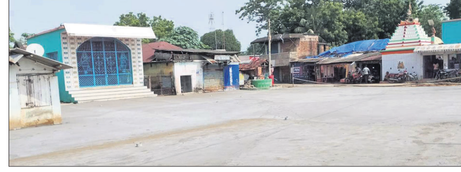
କଂକ୍ରିଟ ଡ୍ରେଇଂ ହୋଇଥିବା ବରହମପୁର ଦୁର୍ଗାମଣ୍ଡପ ପ୍ରାଙ୍ଗଣ।