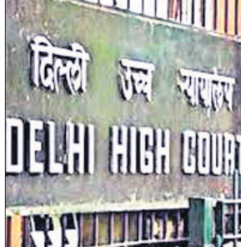
ଚିତ୍ରଣା ଦେଇଛନ୍ତି। ନିଷ୍ପରତା ଆଧାରରେ ଅଲଗା ରଖିଥିବା ସାମାଜ୍ୟ ଛାଡ଼ିପ୍ରସ୍ତୁତ ଦେବା ଲାଗି ପରିବାର ଅଧିକାର ଅନୁମତି

ସାମାଜ୍ୟ ପରିବାର ବିରୋଧରେ ମହିଳା ମିଥ୍ୟା ଯୌତୁକ ନିର୍ଯାତନା କିମ୍ବା ବଳାଙ୍ଗାର ଅଭିଯୋଗ ଆଣିବା ‘ଚରମ ନିଷ୍ପରତା’ ଏବଂ ଏହାର କ୍ଷମା ନାହିଁ ବୋଲି ଦିଲ୍ଲୀ ହାଇକୋର୍ଟ କହିଛନ୍ତି। ଉକ୍ତ ଅପାଳତକ ମତରେ କୌଣସି ବିବାହିତ ସମ୍ପର୍କର ଆଧାର ହେଉଛି ସହବାସ ଓ ବିବାହିତ ସମ୍ପର୍କ। ଦମ୍ପତି ପରସ୍ପର ସହାୟତାକୁ ବଞ୍ଚିତ ହେଲେ ବିବାହ ତିଷ୍ଠି ରହିବ ନାହିଁ ବୋଲି ପ୍ରମାଣିତ ହୋଇଥିଲା। ଜଣେ ଅନ୍ୟ ଜଣକୁ ବିବାହିତ ସମ୍ପର୍କକୁ ବଞ୍ଚିତ କରିବା ଅଧିକ ନିଷ୍ପରତା ବୋଲି ହାଇକୋର୍ଟ