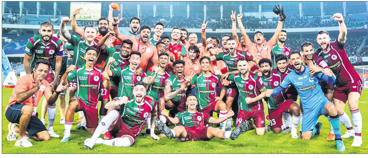
ଭୂରାଣ କପ୍ ଫୁଟବଲ ଚାମ୍ପିୟନ ହେବାପରେ ଭଲସିଟ ମୋହନ ବାଗାନ ଯୁବର କାଏମ ଦଳ।

କୋଲକାତା, ୩୧ (ପି.ଟି.) ଭୂରାଣ କପ୍ ଫୁଟବଲ ଟୁର୍ଣ୍ଣାମେଣ୍ଟର ୧୩୨ତମ ସଂସ୍କରଣରେ ବାକି ମାରିଛି ମୋହନ ବାଗାନ ଯୁବର କାଏମ।