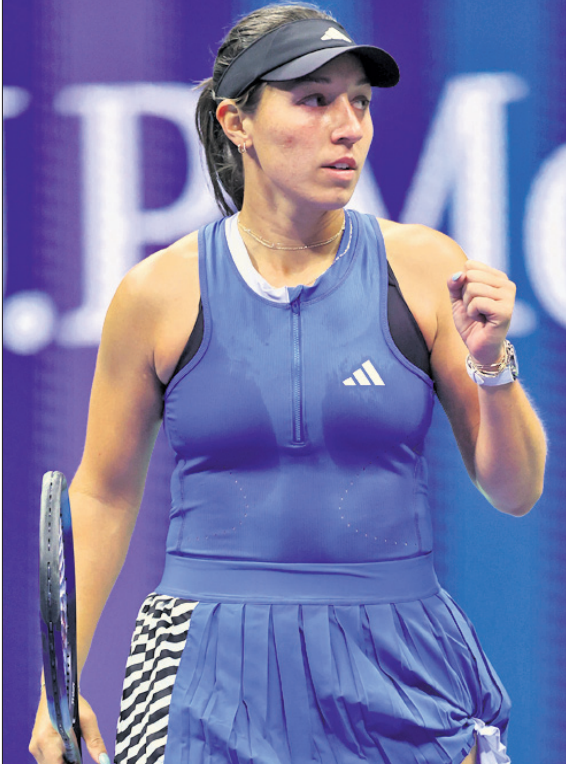
ମ୍ୟାଚ ଜିତିବାପରେ କେସିକା ପେଗୁଲା।