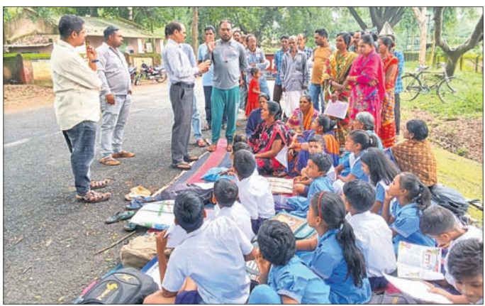
ଛାତ୍ରଛାତ୍ରୀମାନେ ପ୍ରତିବାଦ କରୁଛନ୍ତି ।

ଫୁଲବାଣୀ, ଧାର୍ଯ୍ୟ (ରାଜ୍ୟ ଲୋକ ସଭା) ଫୁଲବାଣୀ ରୁକ୍ମିଣୀ ଉଚ୍ଚ ମାଧ୍ୟମିକ ବିଦ୍ୟାଳୟରେ ଶିକ୍ଷକ ଅଭାବ ପ୍ରତିବାଦରେ ସୋମବାର ଛାତ୍ରଛାତ୍ରୀମାନେ ବିଦ୍ୟାଳୟ ସମ୍ମୁଖ ରାସ୍ତା ଦେଇ ଧାରଣା ଦେଇଛନ୍ତି ।