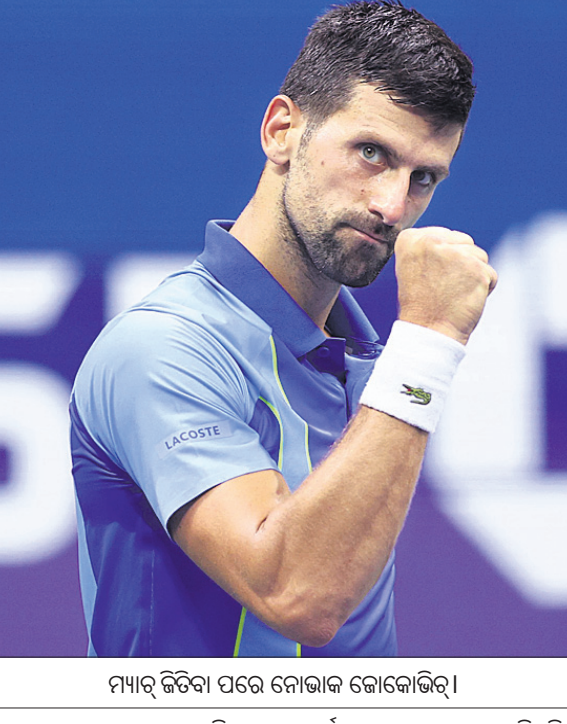
ମ୍ୟାଚ ଜିତିବା ପରେ ନୋଭାକ ଜୋକୋଭିଚ୍।

ବେନିସ୍ ଗ୍ରାଣ୍ଡସ୍ଲାମ ମ୍ୟୁସ୍ ଓପନ ପ୍ରତିଯୋଗିତାରେ ପ୍ରଥମ ଖେଳାଳି ଭାବେ ନିଜ ଚାମ୍ପିୟନ ଶୀର୍ଷକ ହାସଲ କରିଛନ୍ତି।