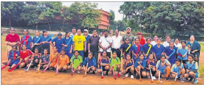
ପ୍ରତିଯୋଗିତାରେ ଭାଗନେଇଥିବା ଖେଳାଳୀମାନେ ।