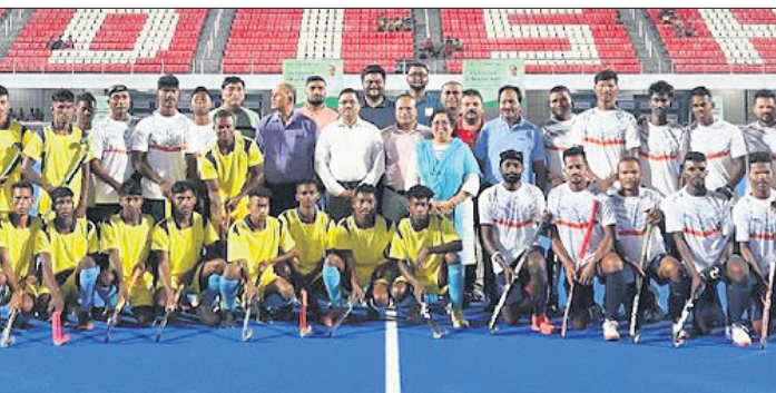
ଉଦ୍‌ଘାଟନା ମ୍ୟାଚ ପୂର୍ବରୁ ଅତିଥିଙ୍କ ସହ ଭୁଲ ଦଳର ଖେଳାଳି।