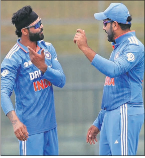
ରବୀନ୍ଦ୍ର ଜାଡେଜା ଓ ରୋହିତ ଶର୍ମା।

ପାଲେକେଲ୍, ୪।୯ (ପି.ଟି.) ଏସିଆ କପ୍ କ୍ରିକେଟରେ ନେପାଳ ବିପକ୍ଷ ଗ୍ରୁପ୍ ମ୍ୟାଚକୁ ୧୦ ଉଇକେଟରେ ଜିତି ସୁପର୍-୪ରେ ପ୍ରବେଶ କରିଛି ଭାରତ। ରବୀନ୍ଦ୍ର ଜାଡେଜା ଓ ମହମ୍ମଦ ସିରାଜଙ୍କ ଘାତକ ବୋଲିଂ ବଳରେ ନେପାଳ ୪୮.୨ ଓଭରରେ ୨୩୦ ରନ୍‌ରେ ଅଲଆଉଟ ହୋଇଥିଲା। ବର୍ଷା କାରଣରୁ ଭାରତ ସମ୍ମୁଖରେ ୨୩୩ ଓଭରରେ ୧୪୫ ରନ୍‌ର ଲକ୍ଷ୍ୟ ଧାର୍ଯ୍ୟ କରାଯାଇଥିଲା। ଭାରତ