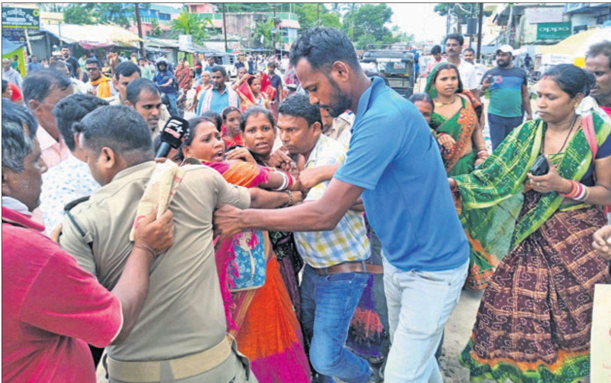
ବାସୁଦେବପୁର ମୁଖ୍ୟ ବଜାର ରାସ୍ତାରେ ମହିଳାଙ୍କ କବଳକୁ ଯୋଗାଣ ଅଧିକାରୀଙ୍କୁ ପୋଲିସ୍ ଉଦ୍ଧାର କରୁଛି।

ସାଧାରଣ ବ୍ୟବସ୍ଥା (ପିଟିଏସ୍)ରେ ଦିଆଯାଇଥିବା ଚାଉଳ ୨ ମାସ ଧରି ପାଇଲେନି ହିତାଧିକାରୀ। ସେମାନେ ଏନେଇ ବାରମ୍ବାର ଜଣାଇବା ସତ୍ତ୍ୱେ ବ୍ୟବସ୍ଥା ଦାୟିତ୍ୱରେ ଥିବା କର୍ମଚାରୀ ଓ ଅଧିକାରୀ କୌଣସି ପଦକ୍ଷେପ ନେଇନାହାନ୍ତି। ଶେଷରେ ମହିଳା ହିତାଧିକାରୀଙ୍କ ଅସନ୍ତୋଷ ସୋମବାର ଉତ୍ସାହପୂର୍ଣ୍ଣ ନେଇଛି। ସେମାନେ ଭଦ୍ରକ ଜିଲ୍ଲା ବାସୁଦେବପୁର ବ୍ଲକ୍ ଯୋଗାଣ ଅଧିକାରୀଙ୍କୁ ଅପରାଧୀ ଭାବେ ନେଇ ରାସ୍ତାରେ ପିଟିଛନ୍ତି। ଏହି ଘଟଣାରେ ପୋଲିସ୍ ଜଣେ ମହିଳାଙ୍କ ସମେତ ୨ଜଣଙ୍କୁ ଆନାରେ ଅଟକ ରଖିଛି।