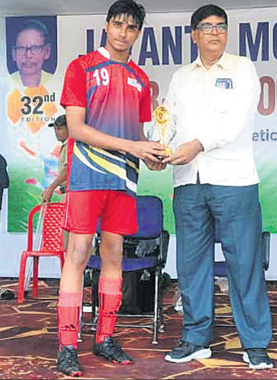
କୁମ୍ଭୀର ଅରମ୍ଭ ପୂର୍ବରୁ ଅର୍ପଣ କରାଯାଇଥିବା ଟ୍ରଫି।