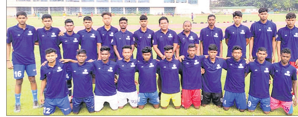
ବି.ସି. ରୟ ଟ୍ରଫି ପାଇଁ ଯୋଗଦାନ ଦେଇଥିବା ଓଡ଼ିଶା ଦଳ।

ଅଂଶଗ୍ରହଣକାରୀ ଦଳଗୁଡ଼ିକୁ ୪ଟି ଗ୍ରୁପରେ ବିଭକ୍ତ କରାଯାଇଛି। ପ୍ରତି ଗ୍ରୁପରେ ୪ଟି ବି.ସି. ରୟ ଟ୍ରଫି ଲାଗୁ ହେବ। ଉପରୋକ୍ତ ଟ୍ରଫି ଟ୍ୟୁରଣ ପ୍ରତିଯୋଗିତାରେ ବିଭିନ୍ନ ରାଜ୍ୟରୁ ୧୨ଟି ଦଳ ଅଂଶଗ୍ରହଣ କରିବେ। ଭୁବନେଶ୍ୱରରେ ପ୍ରଥମଥର ପାଇଁ ଏହି ଟ୍ରଫି ଟ୍ୟୁରଣ ଆୟୋଜନ ହେବାକୁ ଯାଉଛି।