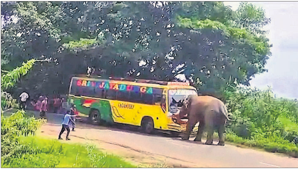
ରାୟଗଡ଼ାକୁ ପାର୍ବତୀପୁରମୁକାମାୟା ଏକ ଘରୋଇ ଯାତ୍ରାବାହୀ ବସକୁ ମାନ୍ୟତା ଦିଆ ଥିବା ଗାଁ ନିକଟରେ ଏକ ଦଳ ଶୁଣରେ ଏହାର କାତକୁ ଭାଙ୍ଗିଛି।

ବଲିଉଡ୍ ଅଭିନେତ୍ରୀ କଙ୍ଗନା ରଣାଡେଙ୍କ ବହୁ ପ୍ରତୀକ୍ଷିତ ମୁଭି 'ଚନ୍ଦ୍ରମୁଖୀ-୨' ଆସନ୍ତା ଗଣେଶ ଚତୁର୍ଥୀରେ ପ୍ରେକ୍ଷାଳୟକୁ ଆସିବ।