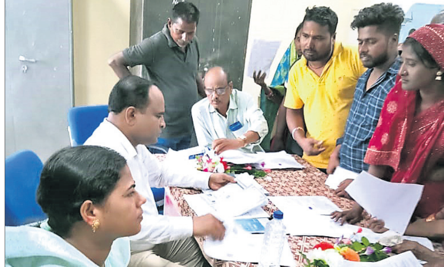
ପ୍ରଶାସନିକ ଅଧିକାରୀମାନେ ଅଭିଯୋଗ ଶୁଣାଣି କରୁଛନ୍ତି।