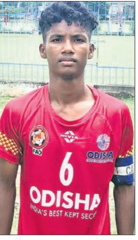
ଅମନ ଲାଜ୍ଜା ଭୁବନେଶ୍ୱର, ୪।୯ (ତପନ ସ୍ୱାଇଁ)