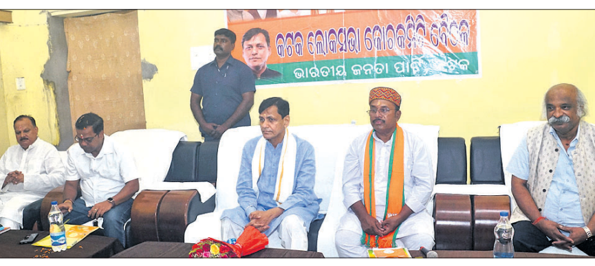
କଟକ ସରକାର ହାତ୍ତାରେ ଆୟୋଜିତ ସମାକ୍ଷା ବୈଠକରେ କେନ୍ଦ୍ରମନ୍ତ୍ରୀ ନିତ୍ୟାନନ୍ଦ ରାୟଙ୍କ ସହ ଭାଜପା ନେତୃବୃନ୍ଦ।