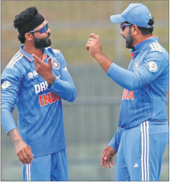
ରବାନ୍ଦ୍ର ଜାଡେଜା ଓ ରୋହିତ ଶର୍ମା।

ପାଲେକେଲ, ୪।୯ (ପି.ଟି.) ଏସିଆ କପ୍ କ୍ରିକେଟରେ ନେପାଳ ବିପକ୍ଷ ଗ୍ରୁପ୍ ମ୍ୟାଚରେ ରବାନ୍ଦ୍ର ଜାଡେଜା ଓ ମହମ୍ମଦ ସିରାଜଙ୍କ ଘାତକ ବୋଲି। ଉଭୟ ବୋଲର ଶୀତ ଲେଖାଏ ଉଇକେଟ ନେବାରୁ ନେପାଳ ୪୮.୨ ଓଭରରେ ୨୩୦ ରନ୍ରେ ସମସ୍ତ ଉଇକେଟ ହରାଇଛି। ବର୍ଷା ବାଧାପ୍ରାପ୍ତ ମ୍ୟାଚରେ ଖବର ପ୍ରସ୍ତୁତ ହୁଏ। ଭାରତ ୨.୧ ଓଭରରେ ବିନା ଉଇକେଟରେ ୧୭ ରନ୍ ସଂଗ୍ରହ କରିଛି।