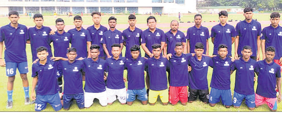
ବି.ସି. ରୟ ଟ୍ରଫି ପାଇଁ ଯୋଗଦାନ ଦେଇଥିବା ଓଡ଼ିଶା ଦଳ।