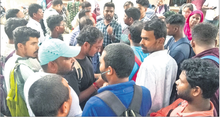
କଟକସ୍ଥିତ ବୋର୍ଡ କାର୍ଯ୍ୟାଳୟ ସମ୍ମୁଖରେ ପରୀକ୍ଷାର୍ଥୀମାନେ ଧାରଣା ଦେଇଛନ୍ତି।

ଅନେକ ତ୍ରୁଟି ଥିବା ପରୀକ୍ଷାର୍ଥୀ ଅଭିଯୋଗ କରିଛନ୍ତି। ପରୀକ୍ଷାର୍ଥୀଙ୍କ କହିବା ପ୍ରତାପକ, ଏହି ପରୀକ୍ଷାରେ ଠିକ୍ ମୂଲ୍ୟାୟନ ହୋଇନାହିଁ। ସେହିପରି ପରୀକ୍ଷାର ଓଏମ୍‌ଆର୍ ସିଏ ପ୍ରଦାନ କରାଯାଇନାହିଁ। ବିକ୍ରମରେ ପରୀକ୍ଷାଫଳ ପ୍ରକାଶ ପାଇଛି। ପ୍ରକାଶ ପାଇଥିବା ଉତ୍ତର ପତ୍ର ଭୁଲ୍ ଥିଲା। ଏନେଇ ଆମେ ବ୍ୟାଲେଞ୍ଜ ବୋର୍ଡରେ କରିଥିଲୁ। ଏହାପରେ ଫାଇନାଲ ଉତ୍ତର ଆସିଥିଲା। ହେଲେ ସେଥିରେ ବି