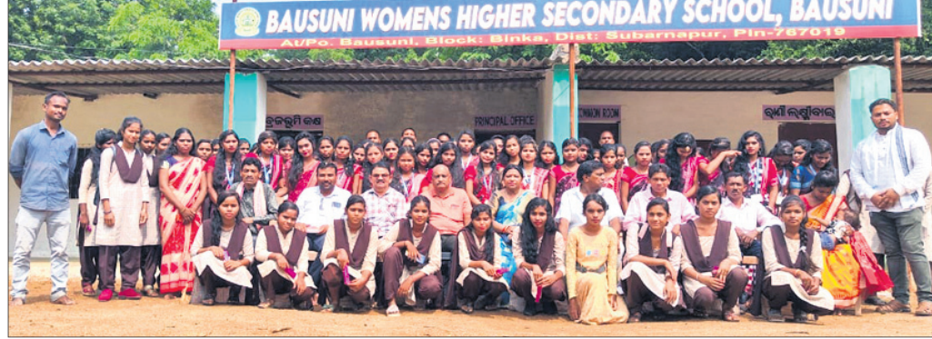
ଅତିଥି, ଅଧ୍ୟକ୍ଷ, ଅଧ୍ୟାପକଙ୍କ ସହ ନବାଗତ ଛାତ୍ରାମାନେ।