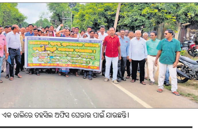
ଚାଷୀମାନେ ଏକ ରାଲିରେ ତହସିଲ ଅଫିସ ଘେରାଇ ପାଇଁ ଯାଉଛନ୍ତି