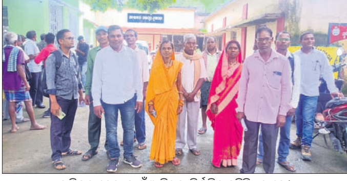
ଦାବିପତ୍ର ଦେବା ପାଇଁ ଆସିଥିବା ନିର୍ବାଚିତ ପ୍ରତିନିଧିମାନେ