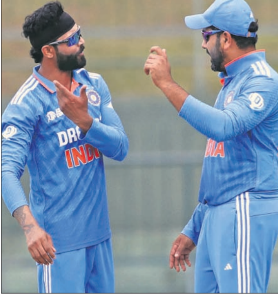
ରବାନ୍ଧ୍ର ଜାଡେଜା ଓ ରୋହିତ ଶର୍ମା।

ସାଲେକେଲ, ୪୧ (ପି.ଟି.) ଏସିଆ କପ୍ ଟ୍ରାୟାଲରେ ନେପାଳ ବିପକ୍ଷ ଗ୍ରୁପ୍ ମ୍ୟାଚରେ ରବାନ୍ଧ୍ର ଜାଡେଜା ଓ ମହମ୍ମଦ ସିରାଜଙ୍କ ଘାତକ ବୋଲି ଉଭୟ ବୋଲର ଖର୍ଚ୍ଚି ଲେଖାଏ ଉଭୟଙ୍କ ନେତୃତ୍ୱ ନେପାଳ ୪୮.୨ ଓଭରରେ ୨୩୦ ରନରେ ସମସ୍ତ ଉଭୟଙ୍କ ହରାଇଛି। ବର୍ଷା ବାଧାପ୍ରାପ୍ତ ମ୍ୟାଚରେ ଖବର ପ୍ରସ୍ତୁତ ସୁଦ୍ଧା ଭାରତ ୨.୧ ଓଭରରେ ବିନା ଉଭୟଙ୍କରେ ୧୭ ରନ୍ ସଂଗ୍ରହ କରିଛି।