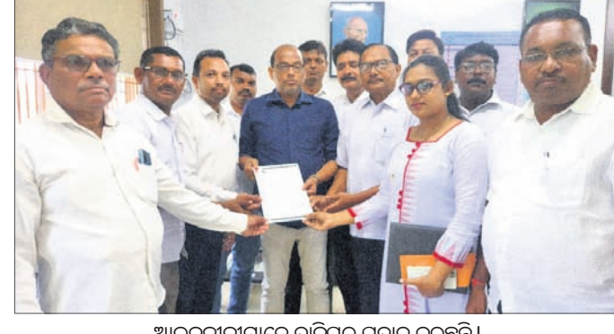
ଆଇନଜୀବୀମାନେ ଦାବିପତ୍ର ପ୍ରଦାନ କରୁଛନ୍ତି।