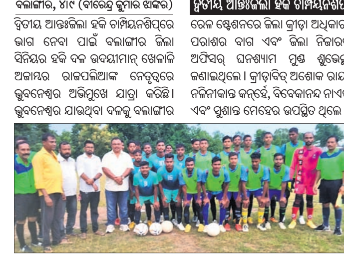
ଭୁବନେଶ୍ୱର ଯାଉଥିବା ବିଲ୍ଲାଙ୍ଗୀର ସିନିୟର ହକି ଦଳର ଖେଳାଳି।