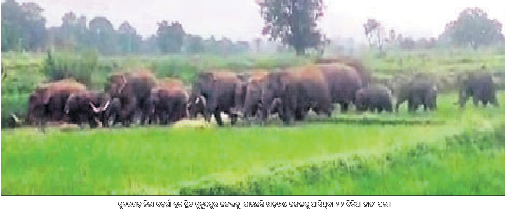
ସୁନ୍ଦରଗଡ଼ ଜିଲା ବଡ଼ଗାଁ ବ୍ଲକ ସ୍ଥିତ ମୁକୁନ୍ଦପୁର ଜଙ୍ଗଲକୁ ଯାଉଛନ୍ତି ଝାଡ଼ଖଣ୍ଡ ଜଙ୍ଗଲରୁ ଆସିଥିବା ୨୨ ଟିକିଆ ହାତୀ ମାଲ।