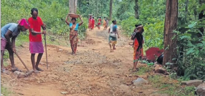
ଗ୍ରାମବାସୀ ରାସ୍ତା ଉପରେ ମାଟି ପକାଇ ଯାଚାଯାଚି ହୁଏ କହୁଛନ୍ତି।

ଲୁଗାପତ୍ଟା, ୪୧ (ଦାଶରଥ ପଣ୍ଡା) : କେ. ବଳାଙ୍ଗ ଥାନା ଅନ୍ତର୍ଗତ ଯୋଯୋ ଟୋଲା ଓ ନୁଆ ଟୋଲା ଗ୍ରାମର ରାସ୍ତା ଶୋଚନୀୟ ହୋଇଥିବାରୁ ଗ୍ରାମବାସୀ ମାଟି ପକାଇ ସମସ୍ତଙ୍କୁ କରି ଯାଚାଯଚା ହୁଏ। ଏହାକୁ ସମାଧାନ କରିବା ପାଇଁ ଗ୍ରାମକୁ ଆଜି ପର୍ଯ୍ୟନ୍ତ ରାସ୍ତା ଗଢ଼ାଯାଇ ନାହିଁ। ବର୍ଷା ଦିନେ ଗ୍ରାମବାସୀ ନାହିଁ ନ ଥିବା ଅନୁଭବ ହୋଇଛି। ଆଧୁନିକ ମଧ୍ୟ ଗାଁ ଅଭିବୃଦ୍ଧି ଯାଚାଯଚା ହେଉଛି। ଆଧୁନିକ ମଧ୍ୟ ଗାଁ ଅଭିବୃଦ୍ଧି ଯାଚାଯଚା ହେଉଛି। ଆଧୁନିକ ମଧ୍ୟ ଗାଁ ଅଭିବୃଦ୍ଧି ଯାଚାଯଚା ହେଉଛି। ଆଧୁନିକ ମଧ୍ୟ ଗାଁ ଅଭିବୃଦ୍ଧି ଯାଚାଯଚା ହେଉଛି।