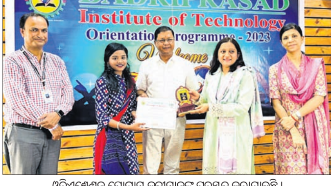
ଓଡ଼ିଶା ଶିକ୍ଷା ବିଭାଗ ଦ୍ୱାରା ଉଦ୍ଘାଟନା କରାଯାଇଥିବା ଓରିଏଣ୍ଟେସନ ପ୍ରୋଗ୍ରାମ କୁଟୀନୀୟ ଲୋକଙ୍କୁ ପୁରସ୍କୃତ କରାଯାଇଛି।

ବୌଦ୍ଧ, ୫୯ (ଅତିରିକ୍ତ ଜିଲ୍ଲା ବାରିକ) ଆଇନଜୀବୀ ସୁରକ୍ଷା ବିଲ୍ ଦାବି କଲା ଜିଲା ସଂଘ। ଆଇନଜୀବୀ ସୁରକ୍ଷା ବିଲ୍ ଦାବି କଲା ଜିଲା ସଂଘ।