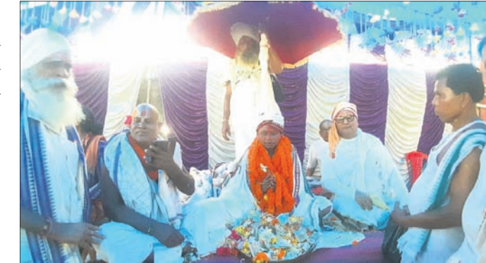
ବେନ୍ଦ୍ରା ମଠରେ ନୂତନ ମହତ୍ତ୍ୱକୁ ଅଭିଷେକ କରାଯାଇଛି।