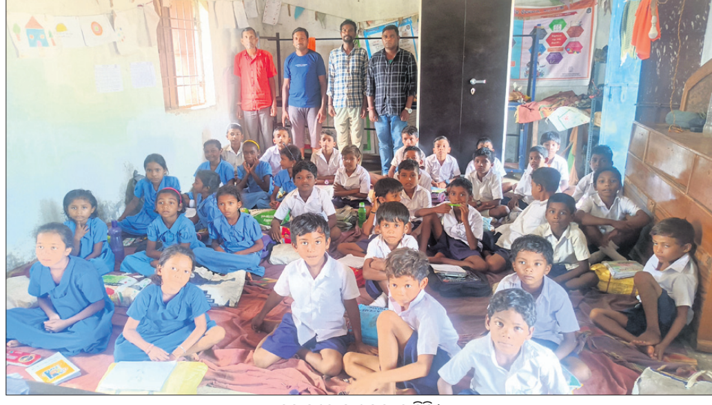
କୁବ ଘରେ ପାଠପଢ଼ା ଚାଲିଛି