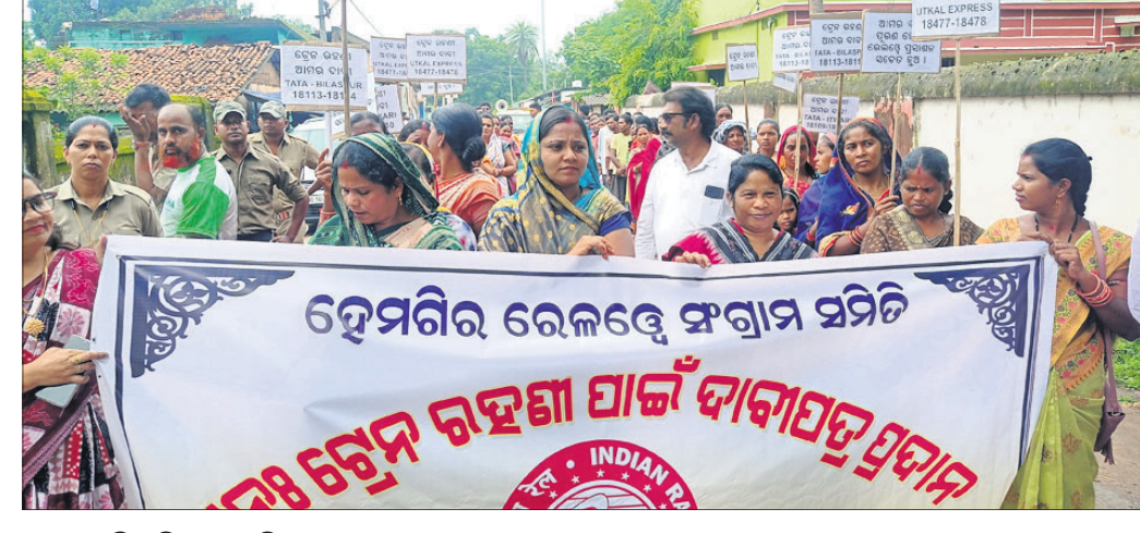
ଟ୍ରେନ୍ ରହଣି ଦାବିରେ ବାହାରିଥିବା ଶୋଭାଯାତ୍ରା।

ହେମଗିରି, ୪୧ (ତେଜନ ପଟେଲ) : ସୁନ୍ଦରଗଡ଼ ଜିଲ୍ଲା ହେମଗିରି ରେଳଷ୍ଟେସନରେ ଟ୍ରେନ୍ ରହଣି ଦାବିକୁ ନେଇ ଯୋଗଦାନ ରେଳଖଣ୍ଡ ସଂଗ୍ରାମ ସମିତି ତରଫରୁ କନିକା ପଞ୍ଚାୟତ ଅଧିକାରୀଙ୍କୁ ରେଳଖଣ୍ଡ ପର୍ଯ୍ୟନ୍ତ ଏକ ବିଶାଳ ଶୋଭାଯାତ୍ରା ବାହାରିଥିଲା। ଟାଣା ଭବବାରୀ, ଟାଣା ବିଲ୍ଲାସପୁର, ଭକ୍ତ ଶିବପ୍ରସାଦରେ ଟ୍ରେନ୍ ରହଣି ପାଇଁ କେନେରାଲ ମ୍ୟାନେଜର ରେଳଖଣ୍ଡ ବିଲ୍ଲାସପୁର ଜୋନକୁ ଶ୍ରେୟ ମାଗୁଥିବା ଜଣାଯାଇଛି। ଏକ ଦାବି ପତ୍ର ପ୍ରଦାନ କରାଯାଇଛି। ଅଞ୍ଚଳର ଜନସାଧାରଣ ତଥା ହେମଗିରି, ଲେପ୍ରିପଡ଼ା ବ୍ଲକର ଅନେକ ବ୍ୟବସାୟୀ ସଂଗଠନ ଏହି ଟ୍ରେନ୍ ଉପରେ ନିର୍ଭର କରିଥାନ୍ତି। ଅନେକ ଗରିବ ଲୋକ ଜଙ୍ଗଲ ଜାତ ଦ୍ରବ୍ୟ ସଂଗ୍ରହ କରି ଟ୍ରେନ୍ ଯୋଗେ ପଡୋଶୀ ରାଜ୍ୟ ଯାଇ ବିକ୍ରି କରି ପରିବାର ପ୍ରତିପୋଷଣ