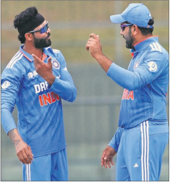
ରବୀନ୍ଦ୍ର ଜାଡେଜା ଓ ରୋହିତ ଶର୍ମା।

ପାଲକେଲ, ୪୯ (ପି.ଟି.) ଚଳିତ ଏସିଆ କପ୍ କ୍ରିକେଟର ସୁପର-୪ରେ ପ୍ରବେଶ କରିଛି ଭାରତ। ସୋମବାର ଅନୁଷ୍ଠିତ ବର୍ଷା ବାଧାପ୍ରାପ୍ତ ମ୍ୟାଚ୍‌ରେ ରୋହିତ ଶର୍ମାଙ୍କ ନେତୃତ୍ୱାଧୀନ ଦଳ ନେପାଳକୁ ୧୦ ରନରେ ପରାସ୍ତ କରିଛି। ରବୀନ୍ଦ୍ର ଜାଡେଜା ଓ ମହମ୍ମଦ ସିରାଜଙ୍କ ଘାତକ ବୋଲିଂକୁ ସାମ୍ନା କରି ନ ପାରି ନେପାଳ ୪୮.୨ ଓଭରରେ ୨୩୦ ରନରେ ଅଲଆଉଟ୍ ହୋଇଥିଲା।