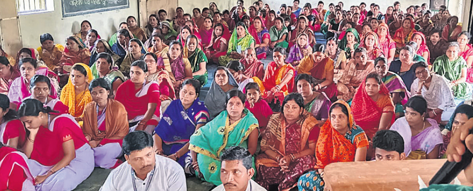
ନିରାକାରପୁର: ଆର୍ଯ୍ୟବିହାରସ୍ଥିତ ସରସ୍ୱତୀ ଶିଶୁ ବିଦ୍ୟାଳୟରେ ଅନୁଷ୍ଠିତ ମାତୃ ସମ୍ମିଳନୀରେ ଉପସ୍ଥିତ ଛାତ୍ରାଛାତ୍ରୀଙ୍କ ମା' ମାନେ।