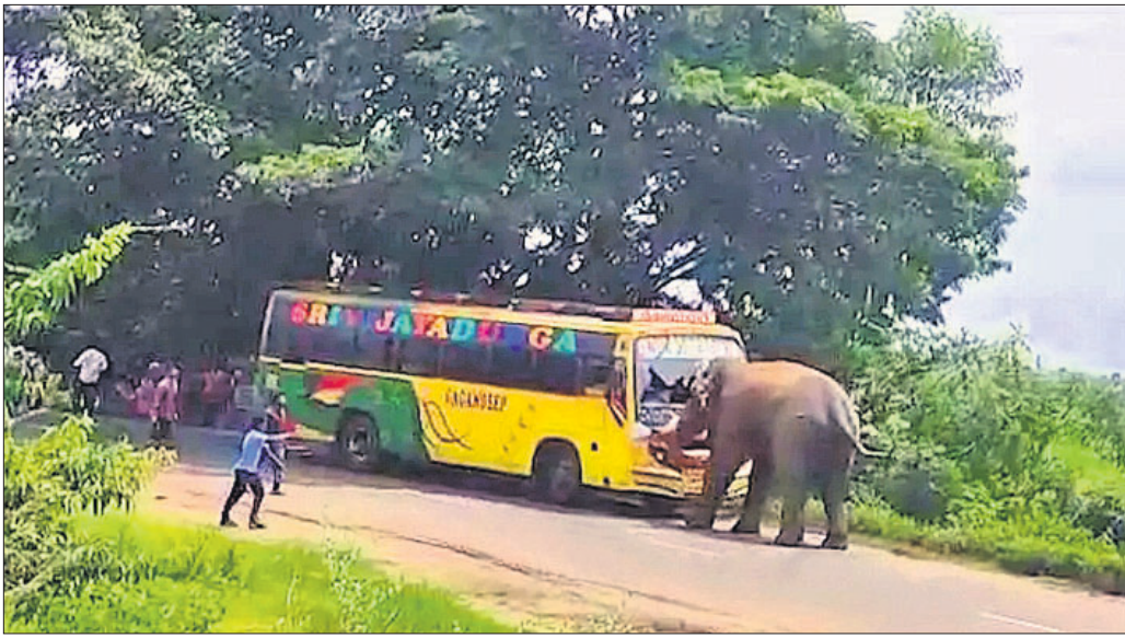
ରାୟଗଡ଼ାକୁ ପାର୍ବତୀପୁରଠାରୁ ଯାଉଥିବା ଏକ ଘରୋଇ ଯାତ୍ରାବାହୀ ବସକୁ ମାନ୍ୟମ ଜିଲ୍ଲା ଅର୍ଡର ଗାଁ ନିକଟରେ ଏକ ଦକ୍ଷା ଶୁଣ୍ଠରେ ଏହାର କାନ୍ଦୁ ଶୁଣିଲେ।

ବଲିଉଡ୍ ଅଭିନେତ୍ରୀ କଙ୍ଗନା ରଣାଡ଼ିକ୍ ବହୁ ପ୍ରତୀକ୍ଷିତ ମୂଳି 'ଚନ୍ଦ୍ରମୁଖୀ-୨' ଆସନ୍ତା ଗଣେଶ ଚତୁର୍ଥୀରେ ପ୍ରେକ୍ଷାଳୟକୁ ଆସିବ।