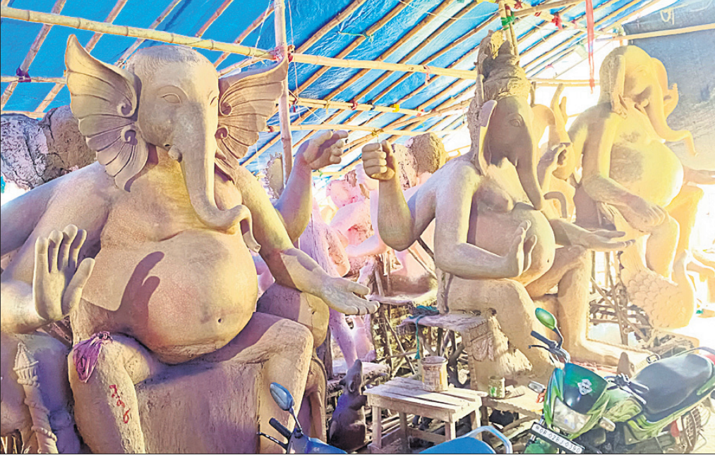
କଟଣା: ଗଣେଶ ପୂଜା ଉପଲକ୍ଷେ ମୂର୍ତ୍ତି ନିର୍ମାଣ କାର୍ଯ୍ୟ ଚାଲିଛି।