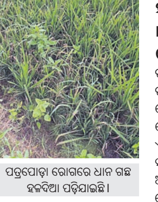
ପତ୍ରପୋଡ଼ା ରୋଗରେ ଧାନ ଗଛ ହଳଦିଆ ପଡ଼ିଯାଇଛି।