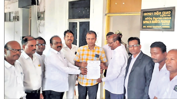
ରାଷ୍ଟ୍ରପତିଙ୍କ ଉଦ୍ଦେଶ୍ୟରେ ଅତିରିକ୍ତ ଜିଲ୍ଲାପାଳଙ୍କୁ ଦାବିପତ୍ର ପ୍ରଦାନ କରାଯାଇଛି।