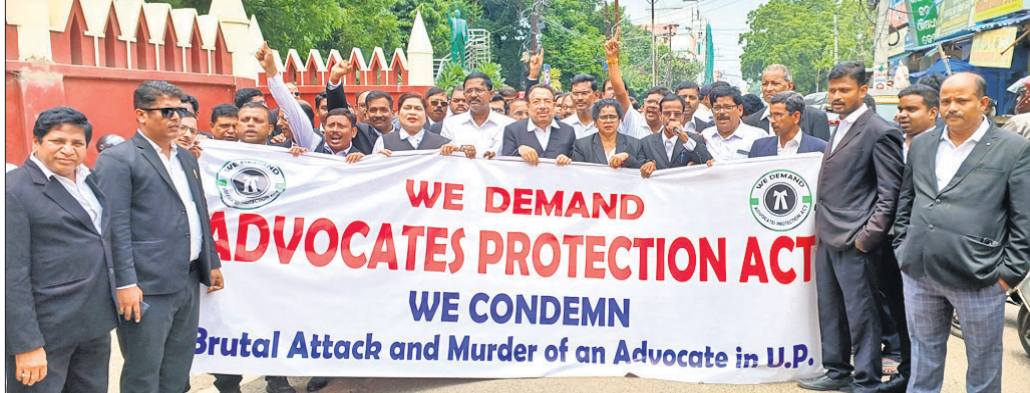
ଆଇନଜୀବୀ ସୁରକ୍ଷା ଆଇନ ପାରିତ ଦାବି ନେଇ କଳାପାଳଙ୍କ କାର୍ଯ୍ୟାଳୟ ଅଭିଯୁକ୍ତ ବାହାରିଥିବା ଶୋଭାଯାତ୍ରା।

କଟକ, ୪୧୯ (କାର୍ତ୍ତିକ ସାହୁ)। ଆଇନଜୀବୀଙ୍କ ସୁରକ୍ଷା ଆଇନ ପାରିତ ଦାବି ନେଇ କଳାପାଳଙ୍କ କାର୍ଯ୍ୟାଳୟ ଅଭିଯୁକ୍ତ ବାହାରିଥିବା ଶୋଭାଯାତ୍ରା... ଆଇନଜୀବୀଙ୍କ ସୁରକ୍ଷା ଆଇନ ପାରିତ ଦାବି ନେଇ କଳାପାଳଙ୍କ କାର୍ଯ୍ୟାଳୟ ଅଭିଯୁକ୍ତ ବାହାରିଥିବା ଶୋଭାଯାତ୍ରା।