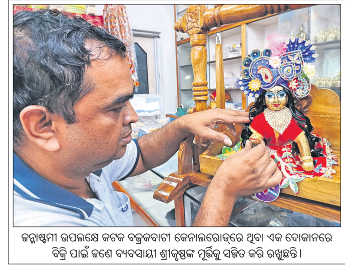
କନ୍ୟାଶ୍ରମୀ ଉପଲକ୍ଷେ କଟକ ବକ୍ସକାମୀ କୋଲାରୋଡ଼ରେ ଥିବା ଏକ ବୋକାଳରେ ତିଆରି ହେଉଥିବା ପିଠି ପାଇଁ ଜଣେ ବ୍ୟବସାୟୀ ଶ୍ରୀକୃଷ୍ଣ ମୂର୍ତ୍ତିକା ସଜିତ କରି ରଖୁଛନ୍ତି।

ଲୋକଙ୍କ ସହିତ ରହିଆସିଛି ଓ ଆଗାମୀ ଦିନରେ ରହିବ। ସେହିପରି ଆସିଲେ ଦୁର୍ନୀତିର ପର୍ଯ୍ୟାପଣ କରିବି।