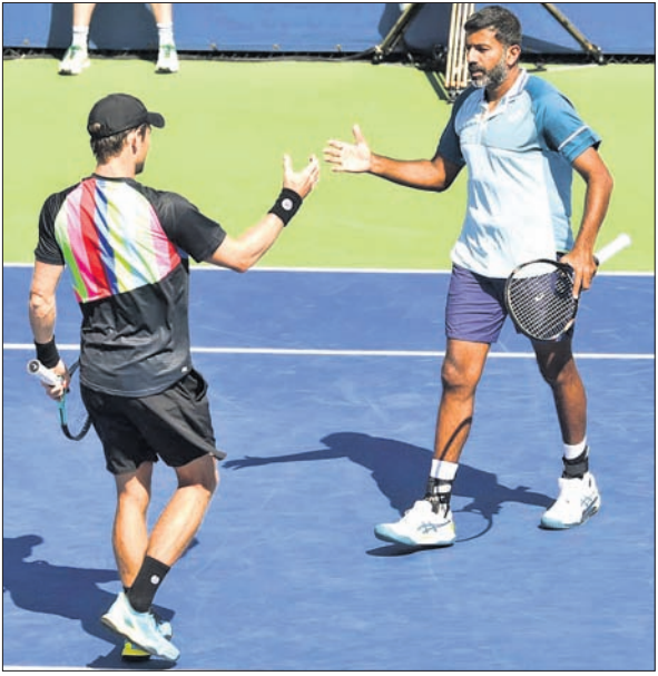
ପରସ୍ପରକୁ ଅଭିନନ୍ଦନ ଜଣାଇଛନ୍ତି ମାଥ୍ୟୁ ଇବ୍ରେନ ଓ ରୋହନ ବୋପାନ୍ନା।

ଭାରତର ରୋହନ ବୋପାନ୍ନା ଓ ଅଷ୍ଟ୍ରେଲିଆର ମାଥ୍ୟୁ ଇବ୍ରେନ ୬ ସେଟ୍ ପର୍ଯ୍ୟନ୍ତ ଯୁଦ୍ଧ କରିଛନ୍ତି। ଓଡ଼ିଶା ଏହାର ପ୍ରଥମ ମ୍ୟାଚରେ କେରଳକୁ ୨-୦ ଗୋଲରେ ପରାସ୍ତ କରିଥିଲା।