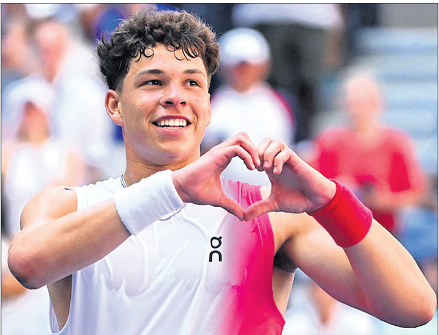
ମ୍ୟାଚ ଜିତିବା ପରେ ଉଲ୍ଲାସିତ ଆମେରିକୀୟ ବେନ୍ ଶେଲ୍ଟନ।