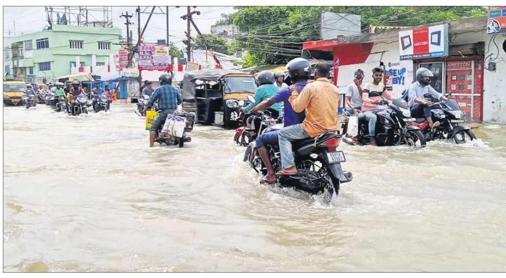
ବସ୍ତାରେ ରେମୁଣା ଗୋଲେଇ ମୁଖ୍ୟରାସ୍ତାରେ ବର୍ଷା ଜଳ।

ରୁଧିର ଭୋର ସମୟରେ ହୋଇଥିବା ବୁଲ ଘଣ୍ଟା ଭାଗ୍ୟ ବର୍ଷାରେ ବାଲେଶ୍ୱର ସହର ତଥା ଆଖପାଖ ଅଞ୍ଚଳରେ କୁଟ୍ରିମ ବନ୍ୟା ପରିସ୍ଥିତି ସୃଷ୍ଟି ହୋଇଥିଲା। ପୁଣ୍ୟ ରାସ୍ତାପାର୍ଶ୍ୱ ଅଞ୍ଚଳ ସମେତ ତଳିଆ ଅଞ୍ଚଳ କିଛି ସମୟ ଧରି ଜଳାଶୟ ହୋଇପଡ଼ିଥିଲା। ଏମିତିକି ବୋକାନ ସମେତ ଲୋକଙ୍କ ଘରେ ମଧ୍ୟ ପାଣି ପଶିଯାଇଥିଲା। ବର୍ଷା ପାଣି ନିଷ୍ପାସନ କରିବାକୁ ଲୋକେ ନାକେଦମ୍ ହୋଇପଡ଼ିଥିଲେ। ପୌରପାଳିକା ପକ୍ଷରୁ କୋଟି କୋଟି ଟଙ୍କାର ଅନୁଦାନ ଖର୍ଚ୍ଚ ହେଉଥିଲେ ବି ସହରର ଘାଣ୍ଟା ଜଳ ନିଷ୍ପାସନ ବ୍ୟବସ୍ଥା ପ୍ରତି କେହି ଚିନ୍ତୁତ୍ୱ ଦେଖି ନ ଥିବା ଲୋକେ ଅଭିଯୋଗ କରିଛନ୍ତି। ବାଲେଶ୍ୱର ପୌରାଞ୍ଚଳରେ ବର୍ଷା ଦିନରେ ଜଳ ନିଷ୍ପାସନ ପୁଣ୍ୟ ସମସ୍ୟା ରୂପେ ଉଭା ହୋଇଛି। ବାଲେଶ୍ୱର ଜିଲ୍ଲାରେ ହାରହାରି ୪୬.୦୮ ମି.ମି. ବର୍ଷା ହୋଇଥିବା ରେକର୍ଡ୍ ହୋଇଛି। ବାହାନଦା ବ୍ଲକ୍ରେ ସର୍ବାଧିକ ୯୫ ମି.ମି. ବର୍ଷା ହୋଇଥିବା ବେଳେ ବସ୍ତାରେ ସର୍ବନିମ୍ନ ୪ ମି.ମି. ବର୍ଷା ହୋଇଛି। ସେହିପରି ସଦର ବ୍ଲକ୍ରେ ୮୮ ମି.ମି., ରେମୁଣାରେ ୫୫ ମି.ମି., ଭୋଗରାଇରେ ୧୦ ମି.ମି., ଜଳେଶ୍ୱରରେ ୨୩ ମି.ମି., ବାଲିଆପାଳରେ ୬ ମି.ମି., ନାଳଗିରିରେ ୬୬ ମି.ମି., ସୋର