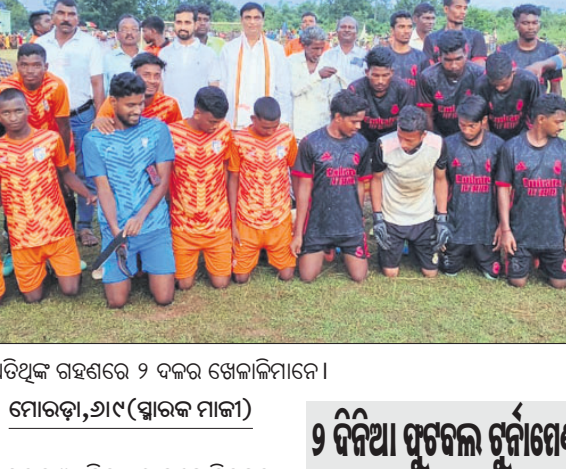
ଅଭିଯୋଗ ଗ୍ରହଣରେ ୨ ଦଳର ଖେଳାଳିମାନେ।

କୋଠା ନିର୍ମାଣ ପାଇଁ ଯୁବକମାନଙ୍କୁ ସମ୍ବର୍ଣ କରାଯାଇଛି। କୋଠା ନିର୍ମାଣ ନେଇ ଅଭିଯୋଗ ହୋଇଛି। ଉକ୍ତ ମହଲ ନିର୍ମାଣ କାମ ଚାଲିଥିଲେ ହେଁ ଏନେଇ ଯୁବକମାନଙ୍କୁ ସମ୍ବର୍ଣ କରାଯାଇଛି।