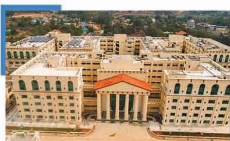
ଡାକ୍ତରୀ ଶିକ୍ଷାରେ ରୂପାନ୍ତରଣ