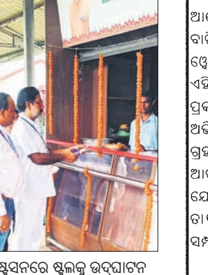
ଷ୍ଟେସନରେ ଶୁଲକୁ ଉଦ୍ଘାଟନ କରାଯାଇଛି।