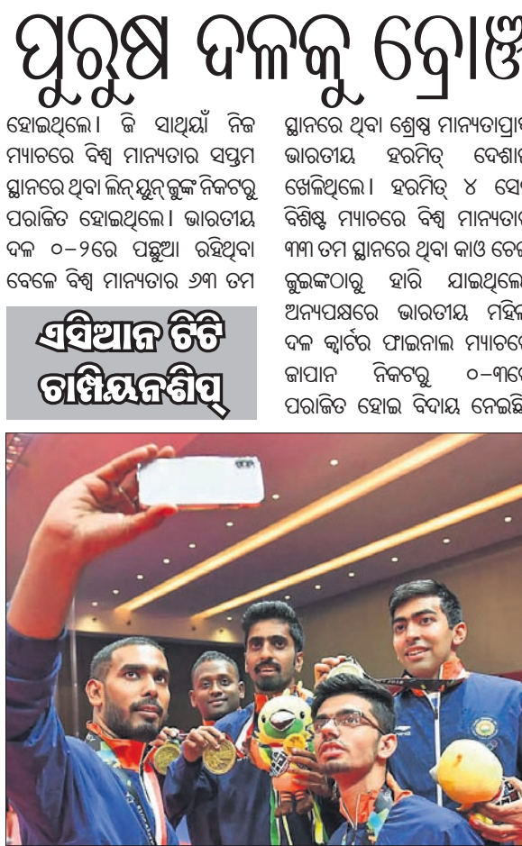
ଦ୍ରୋଞ୍ଚି ବିଜୟୀ ଭାରତୀୟ ପୁରୁଷ ଦଳ।

ଦ୍ରୋଞ୍ଚି ଚାମ୍ପିୟନଶିପରେ ଭାରତୀୟ ପୁରୁଷ ଦଳ ୦-୩ରେ ଚାଲିଥିବା ଦିନକର ପ୍ରାରମ୍ଭିକ ଟେସ୍ଟରେ ହୋଇଥିଲା।