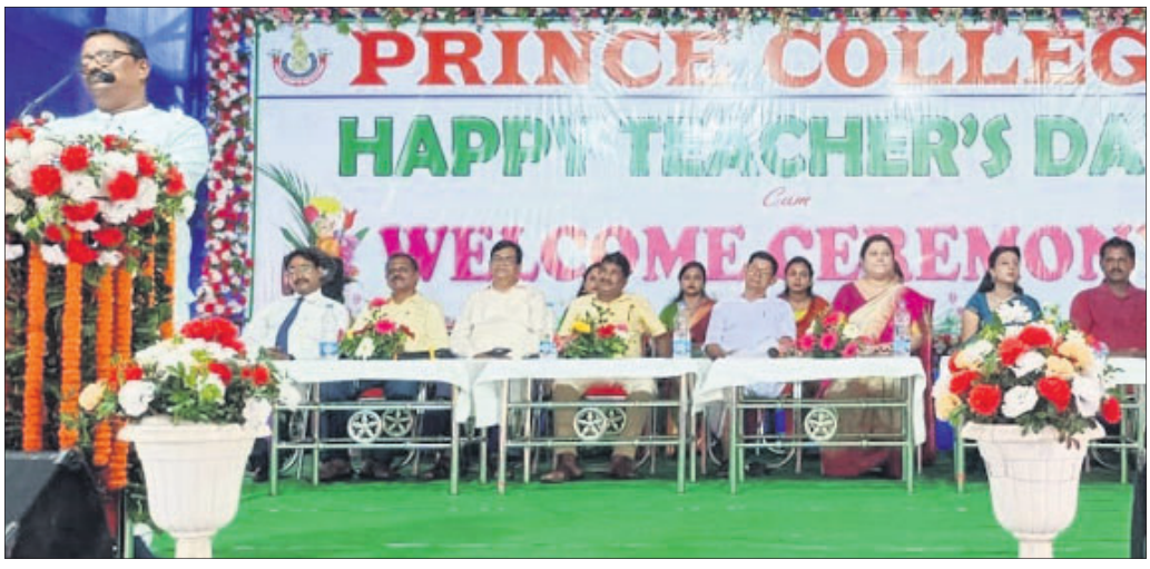
ସ୍ୱାଗତ ଉତ୍ସବରେ ଉପସ୍ଥିତ ଅତିଥିମାନେ।