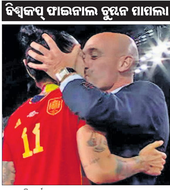
ଜେନି ହର୍ମୋସୋଙ୍କୁ ଚୁପ୍ଚନ ଦେବା ଅବସରରେ ଲୁଚାଇ ରୁବେଲ୍ଲା।

ପିଫା ମହିଳା ବିଶ୍ୱକପ ଚାମ୍ପିୟନ ଷ୍ଟେନ୍ ଦଳର ସ୍ତ୍ରୀକର୍ମ୍ୟ ଜେନି ହର୍ମୋସୋ ଫୁଟବଲ ସଂଘ ପୁଞ୍ଜୀ ଲୁଚାଇବାକୁ ଦରୋଧରେ ଯୌନ ଶୋଷଣ ଅଭିଯୋଗ ଆଣିଛନ୍ତି।