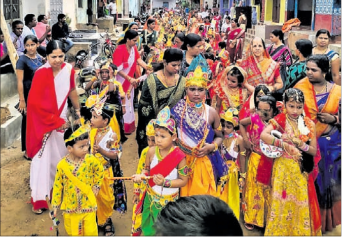
ରାଧା କୃଷ୍ଣ ବେଶରେ କୁନି କୁନି ପିଲା ।

ଦଶପଦା, ୬।୯ (ପ୍ରକାଶ କୁମାର ପାଣି) ଅବସରରେ ସ୍ଥାନୀୟ ସରସ୍ୱତୀ ଶିଶୁ ମନ୍ଦିରଠାରେ ଏକ ଉତ୍ସବ ଆୟୋଜିତ ହୋଇଥିଲା । ପିଲାମାନେ ରାଧାକୃଷ୍ଣ ବେଶରେ ସଜିତ ହୋଇ ନାଚ ଗୀତର ଆସବ କରିଥିଲେ । ନଗର ପରିକ୍ରମଣ ବେଳେ ସେମାନଙ୍କ ଅଭିଭାବକମାନେ ମଧ୍ୟ ସାମିଲ ହୋଇଥିଲେ ।