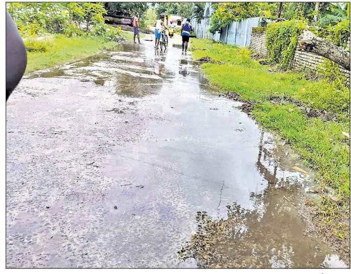
ପାଣିକୋଇଲି,୨୯ (ବିକାଶ କୁମାର ମଲିକ)

୧୬୨୩.କାଗାମ ରାଜପଥରୁ ପାଣିକୋଇଲି ପଞ୍ଚାୟତ କାର୍ଯ୍ୟାଳୟ ମୁଖ୍ୟ ରାସ୍ତାରେ ଅନବରତ ପାଣି ଚାଲୁଛି । ଏହି ରାସ୍ତାରେ ବିଦ୍ୟୁତ କାର୍ଯ୍ୟାଳୟ, ରାଜସ୍ୱ ନାରିକେଳ କାର୍ଯ୍ୟାଳୟ, ମୁଖ୍ୟ ଡାକଘର, ଶ୍ରୀମା ଅରବିନ୍ଦ ଆଶ୍ରମ ଓ ବିଦ୍ୟାଳୟ, କଲେଜ ରହିଛି । ଏଥିସହିତ ଅଳ୍ପଦିନ ଓ ପାଣିକୋଇଲିକୁ ଏହା ରାସ୍ତା ମୁଖ୍ୟ । ରାଜପଥ ପାର୍ଶ୍ୱରେ ହୋଇଥିବା ସଂଯୋଗାଳୟର ରାସ୍ତା ଅର୍ଦ୍ଧ ନିର୍ମିତ