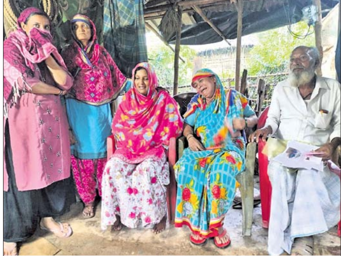
ଝଗଡ଼ାରେ ସମ୍ମାନରେ ମୃତ ଯୁବକଙ୍କ ପରିବାର ଲୋକେ।

ରାଜ୍ୟ ଉପରେ ସଂକ୍ରମଣ ମେଡ଼ିକାଲ କଲେଜ ନିକଟରେ ମୃତ୍ୟୁ ହୋଇଥିବା ବିବାହ ଧାର୍ଯ୍ୟକାଳ ମୃତ୍ୟୁକୁ ପୋଲିସ ଜବତ କରିଥିଲା।