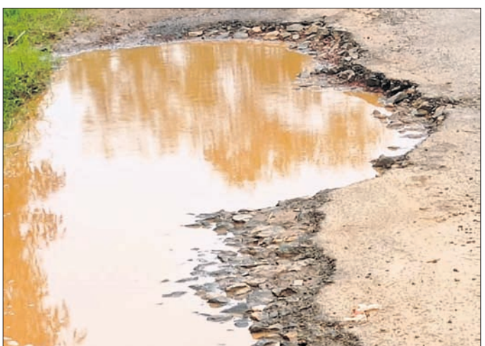
ଖାଲିଖାଳୀ ଯୋଗୁ ବଗିଚା ରାସ୍ତା ମରଣାନ୍ତକ।

ରାଜନୀତି, ୬୫୦ (କେନ୍ଦ୍ରୀୟ ଖଣ୍ଡ): ରାଜନୀତିକ ମଣ୍ଡଳସ୍ତରୀୟ ବିଜ୍ଞାନ ସେମିନାର ଅନୁଷ୍ଠିତ ହୋଇଥିଲା।