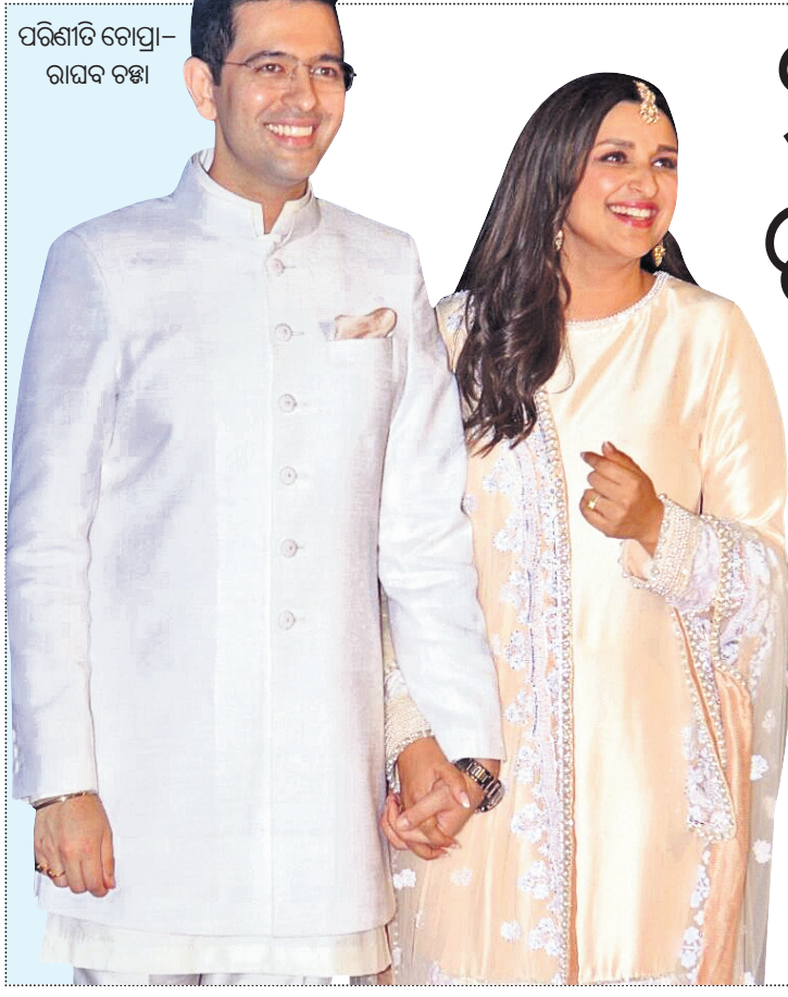
ପରିଣାତି ଗୋପ୍ରା-ରାଘବ ଚକ୍ରା