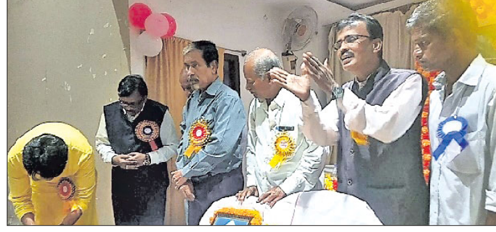
ଏସ.ପି. ନନ୍ଦ ପାଠାଗାରର ବାର୍ଷିକୋତ୍ସବରେ ଯୋଗଦେଇଥିବା ଅତିଥି ।