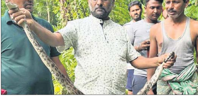
ନାଳଗିରି, ୭ (ପ୍ରଶାନ୍ତ ବିହାରୀ)

ନାଳଗିରି, ୭ (ପ୍ରଶାନ୍ତ ବିହାରୀ) ହୋଇପଡ଼ିଥିଲା। ଏନେଇ ଗୁରୁପ୍ରସାଦ ବାଲେଶ୍ୱର ଜିଲା କୁଳଦିହା ଅଭୟାରଣ୍ୟରୁ ଏକ ୨ ଫୁଟ ଲମ୍ବର ଅଜଗର ଆସି ପଶୁଚାର୍ଯ୍ୟ ନାଳଗିରି ପଞ୍ଚାଳିଖେଣ୍ଡର ନିକଟ ଶ୍ରୀବେଦପୁର ଗ୍ରାମର ଗୁରୁପ୍ରସାଦ ବିକ୍ରମ ଘର ବାଡ଼ିରେ ଥିବା କାଳରେ ଛଦି ହୋଇପଡ଼ିଥିଲା।