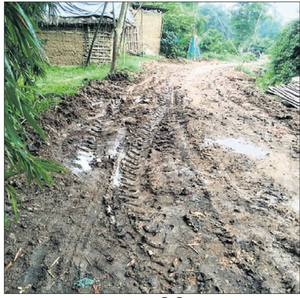
ରାସ୍ତାକାମ ଶେଷ ନ ହୋଇ ପଡ଼ିରହିଥିବାରୁ ଯାତାୟତରେ ବାଧା।