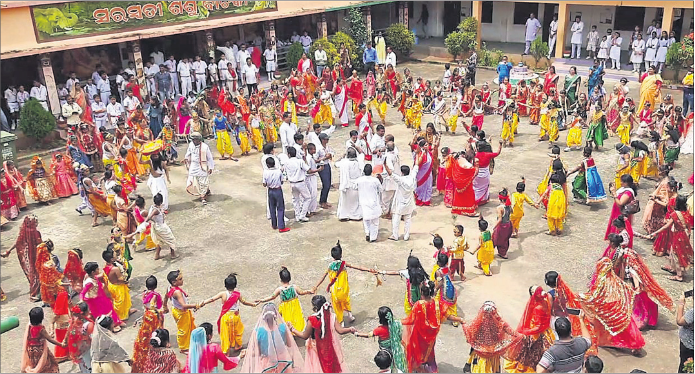
ନୟାଗଡ଼ ସରସ୍ୱତୀ ଶିଶୁ ବିଦ୍ୟାଳୟର ପିଲାମାନେ ନାଚଗୀତରେ ମସରୁଲ ।

କରିଥିଲେ । ସେହିପରି ଗୋପପୁରରେ ରାଧାକୃଷ୍ଣ ବେଶଧାରୀ ଶିଶୁମାନେ ଗ୍ରାମ୍ୟ ପରିକ୍ରମା କରି ଜନ୍ମାଷ୍ଟମୀ ପର୍ବକୁ ପାଳନ କରିଥିଲେ । ଅନ୍ୟପକ୍ଷେ ନୟାଗଡ଼ ପୁରୁଣା ସହରର ଗୋପାଳୀୟକ ମନ୍ଦିରରେ ଜନ୍ମାଷ୍ଟମୀ ପାଳନ ହୋଇଯାଇଛି ।