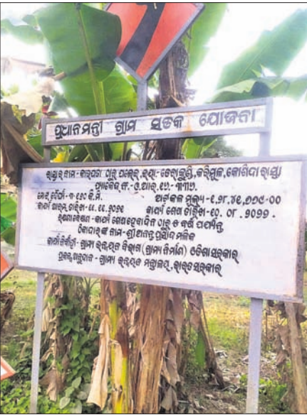
କାମାଯାଉଥିବା ସୂଚନା ଫଳକ।

ଡେରାବିଶ, ୬୫୦ (କେନ୍ଦ୍ରୀୟ ଖଣ୍ଡ): ଡେରାବିଶ ବ୍ଲକ୍ ଅନ୍ତର୍ଗତ ପଲେଇ ପଞ୍ଚାୟତ କର୍ମଚାରୀ, କୋଣିକା ଓ ଡେରାବିଶ ବ୍ଲକ୍ କୋଣିକା ଓ ଡେରାବିଶ ବ୍ଲକ୍ ନିର୍ମାଣ ହେଉଥିବା ରାସ୍ତା କାର୍ଯ୍ୟ କଳ୍ପ ପ୍ରକଳ୍ପରେ ଚାଲିଛି। କେନ୍ଦ୍ରୀୟ ଗ୍ରାମ୍ୟ ଉନ୍ନୟନ ବିଭାଗ ପକ୍ଷରୁ ନିର୍ମାଣ ହେଉଥିବା ଏହି ରାସ୍ତା ନିର୍ମାଣର ନେତୃତ୍ୱ ଯୋଜନାରେ ପଲେଇ ପଞ୍ଚାୟତ ଅଧିକାରୀ ଲୋକାପାଳଙ୍କୁ ଭେଟି ଏ ନେଇ ଅଭିଯୋଗ କରିଛନ୍ତି। ଗ୍ରାମ୍ୟ ଉନ୍ନୟନ ବିଭାଗ କର୍ତ୍ତୃପକ୍ଷଙ୍କ ବେପରୁଆ ନୀତି ଯୋଗୁ ୨୦୨୧ରୁ ଆରମ୍ଭ ହୋଇ ୨୦୨୨ ଅଗଷ୍ଟ ୧୦ରେ ଶେଷ ହେବାକୁ ସୂଚନା ଗ୍ରାମ୍ୟବାସୀ ଅଭିଯୋଗରେ ଦର୍ଶାଇଛନ୍ତି।