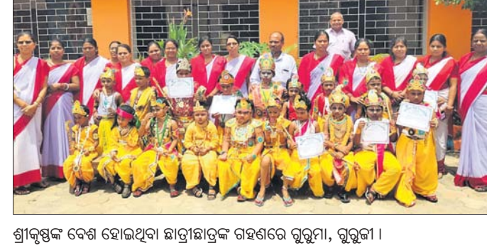
ଶ୍ରୀକୃଷ୍ଣଙ୍କ ଦେଶ ହୋଇଥିବା ଛାତ୍ରାଛାତ୍ରୀଙ୍କ ମହତ୍ତ୍ୱର ରହିଛି।

ପାଇଁ ଅପୂର୍ବପରେ ପକାଉଛି । ଚାଷୀ, ଦିନ ମୂଲ୍ୟକୁ ପଞ୍ଚାୟତ ବାହାରେ ଥିବା ବ୍ୟାଙ୍କକୁ ଯା-ଆସ କରିବା ଆକର୍ଷଣ ଦେଉଥିବା କାର୍ଯ୍ୟରେ ବାଧା ରହିଛି।