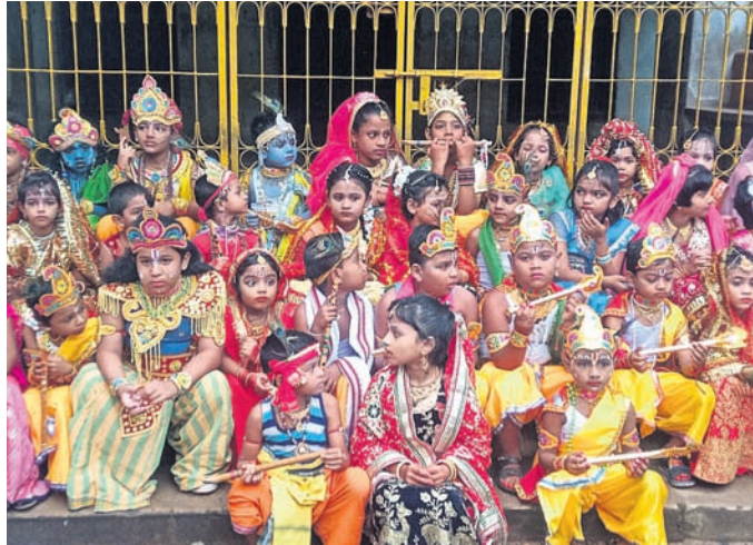
ରାଧାକୃଷ୍ଣ ବେଶରେ ଶିଶୁ ମନ୍ଦିରର ପିଲାମାନେ ।

ଖଣ୍ଡପଡ଼ା, ୬।୯ (ଅକ୍ଷୟ କୁମାର ମହାରଣା) ମନ୍ଦିରରେ ଦିବା ରାତ୍ର ନାମ ସଂକୀର୍ତ୍ତନ ଅନୁଷ୍ଠିତ ହୋଇଥିଲା । ଖଳିସାହି ଇନ୍ଦ୍ର ମଠରେ ବସୁ ଆତମରେ ଠାକୁରଙ୍କ ଜନ୍ମାଷ୍ଟମୀ ପାଳିତ ହୋଇଯାଇଛି । ଗୋପାଳୀୟକ ମନ୍ଦିର, ଖଳିସାହିସ୍ଥିତ ଗୋପାଳୀୟକ ମନ୍ଦିର, ରାଧାକୃଷ୍ଣ ମନ୍ଦିର, ଖଳିସାହି ଇନ୍ଦ୍ର ମଠ, ମର୍ଦ୍ଦାକପୁର ମନ୍ଦିର ପରିସରରେ ପୁଣିଆ ହରୁମାନ ପାଠ, ସିଧାମୂଳାସୁ ମଣିକର୍ଣ୍ଣିକା ପାହାଚ ନିକଟ ଗୋକୁଳାନନ୍ଦ ଶ୍ରୀକୃଷ୍ଣଙ୍କୁ ଆଧ୍ୟାତ୍ମିକ ପାଠରେ ପଠାଯାଇଥିଲା । କାଉ ପାଠ, ମହୁଲପଡ଼ା ବାଡ଼ା ମଠରେ ଜନ୍ମାଷ୍ଟମୀ ଉପଲକ୍ଷେ ମଙ୍ଗଳ ଆକଟି ଅବସରରେ ବୁଦ୍ଧ ଅଭିଷେକ ହୋଇଥିଲା । ପରେ ଷୋଡ଼ଶ ଉପଚାରରେ ଠାକୁରଙ୍କ ପୂଜାର୍ଚ୍ଚନା ହୋଇଥିଲା । ପରେ ହୋମ କାର୍ଯ୍ୟ ଅନୁଷ୍ଠିତ ହୋଇ ପଞ୍ଚିତକ ଦ୍ୱାରା କୃଷ୍ଣଙ୍କୁ ଅଧ୍ୟାୟ ପଠନ କରାଯାଇଥିଲା । ବିଳମ୍ବିତ ରାତି ପର୍ଯ୍ୟନ୍ତ ଭକ୍ତମାନେ ପୂଜାର୍ଚ୍ଚନା କରୁଥିଲେ । ଏଥିସହ ଖଣ୍ଡପଡ଼ା, ଖଳିସାହି ଗୋପାଳୀୟକ ମନ୍ଦିର, କର୍ମିଣୀ ରାଧାମୋହନ ଜାଉ ମନ୍ଦିର, କର୍ମିଣୀ ରାଧାକୃଷ୍ଣ ବେଶଧାରୀ ପିଲା ଗ୍ରାମ ପରିକ୍ରମା କରୁଥିବା ବେଳେ ମହାମାନେ ସେମାନଙ୍କୁ ବନ୍ଦାପନା କରୁଥିବା ଦେଖିବାକୁ ମିଳିଥିଲା ।