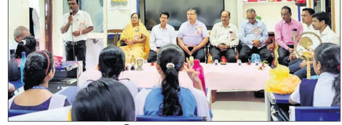
ଅତିଥିଙ୍କ ସହ ଛାତ୍ରଛାତ୍ରୀମାନେ।

ରାଜନୀତି, ୬୫୦ (କେନ୍ଦ୍ରୀୟ ଖଣ୍ଡ): ରାଜନୀତିକ ମଣ୍ଡଳସ୍ତରୀୟ ବିଜ୍ଞାନ ସେମିନାର ଅନୁଷ୍ଠିତ ହୋଇଥିଲା। ଏଥିରେ ବିଜ୍ଞାନ ସମ୍ମାନ ବିଦ୍ୟାଳୟରୁ ଅନୁଷ୍ଠିତ ହୋଇଥିଲା।