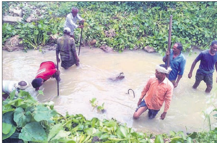
କେନାଲ ସଫା କରାଯାଇଛି ।

ଗଜପତି ଜିଲ୍ଲା ଗୋଷାଣି ବ୍ଲକ ଅନ୍ତର୍ଗତ ଜଙ୍ଗଲପାଠୁ ଗ୍ରାମ ଦେଇ ଆନ୍ଧ୍ର ନୂଆଁ ହୋଇଥିବା କୃଷିସାଗର କେନାଲକୁ ଆନ୍ଧ୍ରପ୍ରଦେଶର ଚାଷୀମାନେ ସଫେଇ କରୁଥିବା ଦେଖିବାକୁ ମିଳୁଛି । ଏହି କୃଷିସାଗର କେନାଲ ପାରଳା ମହାରାଜାଙ୍କ ଦୂରଦୃଷ୍ଟି ଯୋଗୁଁ ଖନନ କରାଯାଇଥିଲା ।