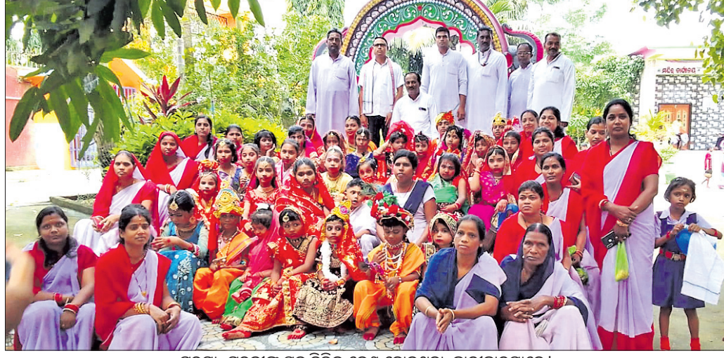
ଗୁରୁମା, ଗୁରୁଜୀଙ୍କ ସହ ବିଭିନ୍ନ ବେଶ ହୋଇଥିବା ଛାତ୍ରାଛାତ୍ରୀମାନେ।