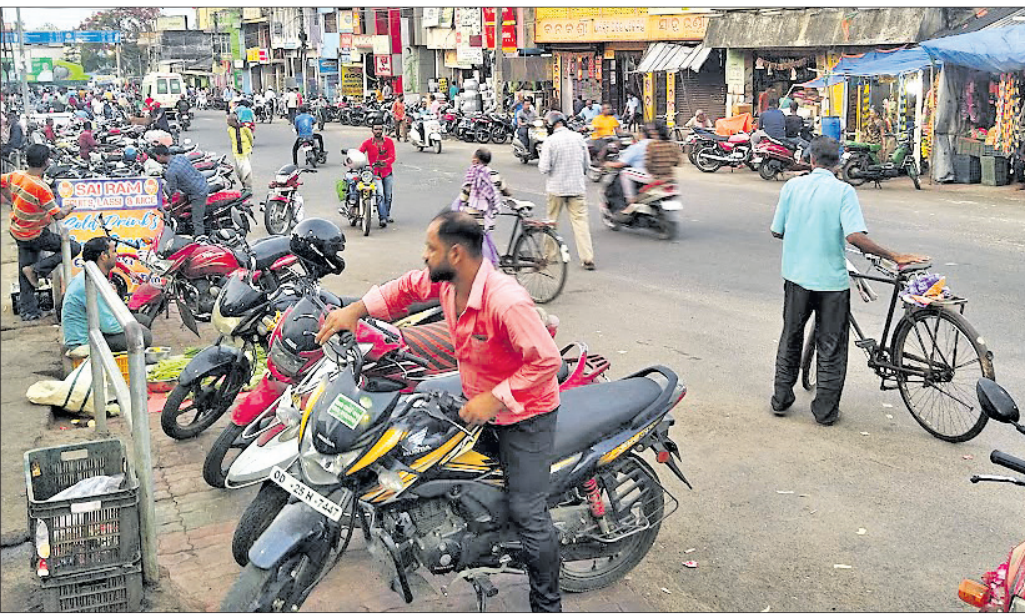
ରାସ୍ତାରେ ବ୍ୟବସାୟୀ ଓ ଲୋକେ ବାଇକ ରଖୁଛନ୍ତି ।