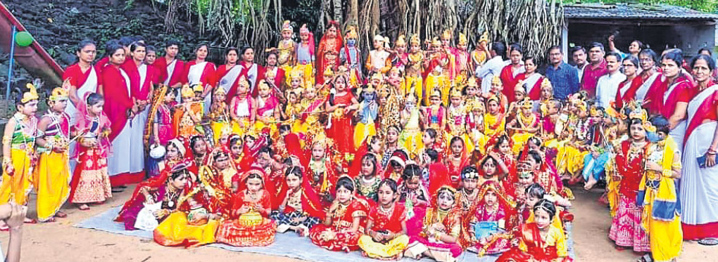
କାଦମ୍ବୀ ସରସ୍ୱତୀ ଶିଶୁ ବିଦ୍ୟାଳୟରେ ଜନ୍ମାଷ୍ଟମୀ ଉତ୍ସବରେ ଶ୍ରୀକୃଷ୍ଣ ଓ ରାଧା ଦେଖିଯାଉଛନ୍ତି ଛାତ୍ରାଛାତ୍ରୀ।

ଏହି ଅବସରରେ ଅନୁଷ୍ଠାନ ପକ୍ଷରୁ ବିଭିନ୍ନ ସାଂସ୍କୃତିକ କାର୍ଯ୍ୟକ୍ରମ, ପ୍ରତିଭା ଅଭିବ୍ୟକ୍ତି, ଗ୍ରାମ ସମାଜ, ଚାରା ପ୍ରାଣୀ ସମାଜ ଓ ନନ୍ଦୋହର ପର୍ବ ପାଳନ କରାଯାଇଥିଲା।