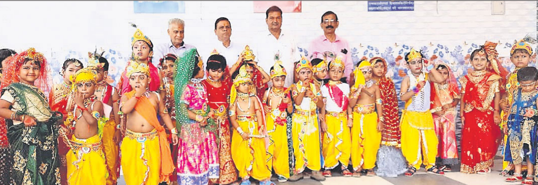
ବାଲିଚନ୍ଦ୍ରପୁର ସରକାରୀ ଶିଶୁ ବିଦ୍ୟାଳୟରେ ରାଧାକୃଷ୍ଣ ବେଶରେ ଛାତ୍ରଛାତ୍ରୀମାନେ ।