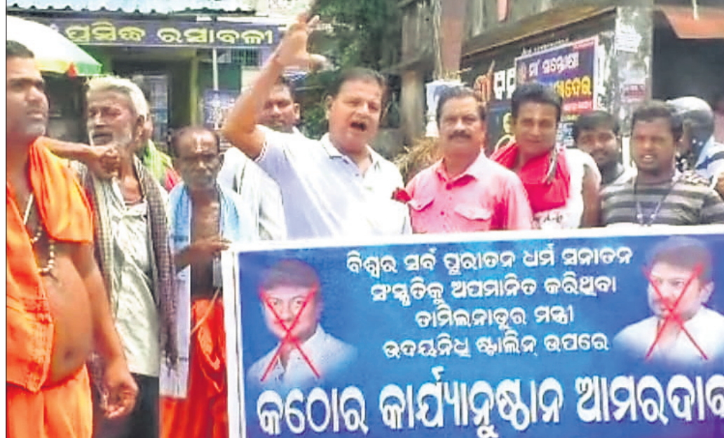
ବଳଦେବ ସେନା ପକ୍ଷରୁ ବିରୋଧ ପ୍ରଦର୍ଶନ କରାଯାଇଛି।

କେନ୍ଦ୍ରୀୟ, ୬୫୦ (କେନ୍ଦ୍ରୀୟ ଖଣ୍ଡ): ବଳଦେବ ସେନା ପକ୍ଷରୁ ବିରୋଧ ପ୍ରଦର୍ଶନ କରାଯାଇଛି।