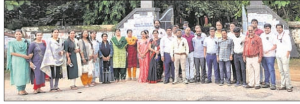
କଳାବ୍ୟାଜ ପିନ୍ଧି ଅଧ୍ୟାପକମାନେ ବିକ୍ଷୋଭ ପ୍ରଦର୍ଶନ କରୁଛନ୍ତି ।