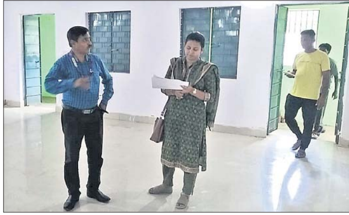
ବ୍ୟାଙ୍କ ଛାଡ଼ିବା ପରେ ଲୋକମାନେ ଆସିଥିବା ପ୍ରତିରୂପ।

ଲୋକମାନଙ୍କ ପାଇଁ ବ୍ୟାଙ୍କ ଖୋଲିବା ପ୍ରକ୍ରିୟା ଅପରିହାର୍ଯ୍ୟ ହୋଇପଡ଼ିଛି। ରବିବାରକୁ ଧର୍ମାପାଳିକା ଯାତ୍ରା ପର୍ଯ୍ୟନ୍ତ ସମସ୍ତଙ୍କୁ ବ୍ୟାଙ୍କ ଛାଡ଼ିବାକୁ ପଡ଼ିବ।