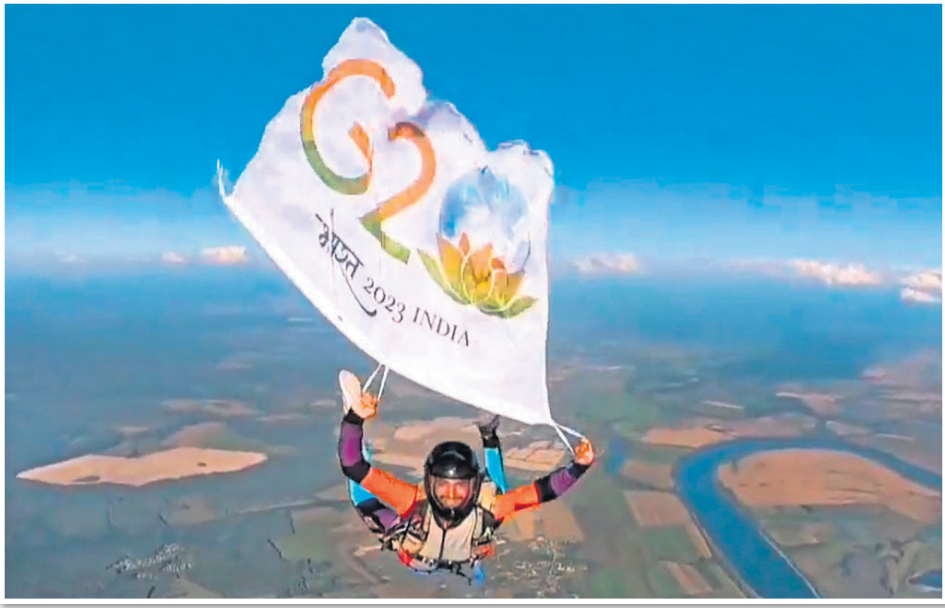
ସମ୍ମିଳନୀ ପୂର୍ବରୁ ଜଣେ ବ୍ୟକ୍ତି ଜି୨୦ ଥିମ୍ ଥିବା ପତାକା ଧରି ସ୍ୱାଧୀନତାଦିନ କରୁଛନ୍ତି ।