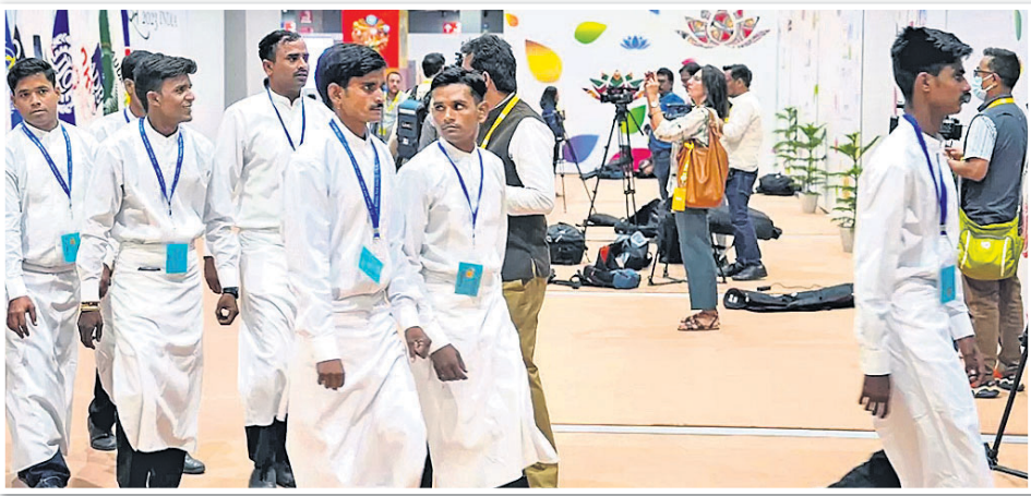
ଇଣ୍ଡୋନେସିଆର ମିଡିଆ ସେକ୍ଟରରେ ସେପ୍ଟେମ୍ବର ।