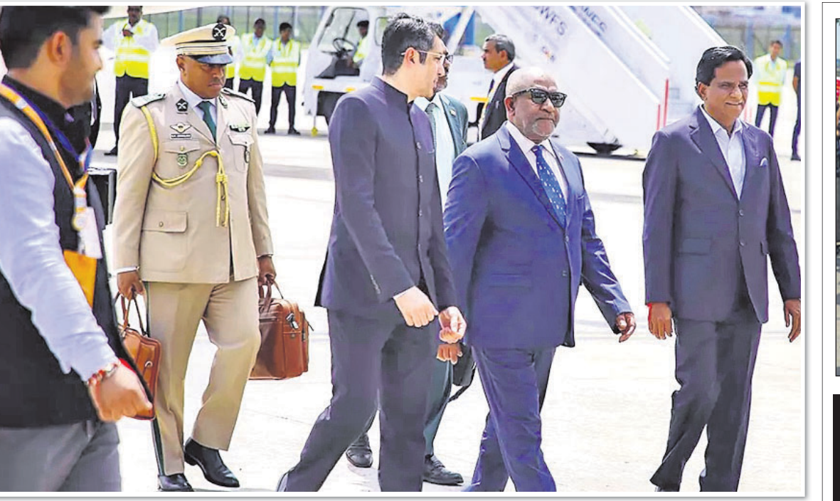
କୋମୋରୋସ୍ ରାଷ୍ଟ୍ରପତି ତଥା ଆଫ୍ରିକୀୟ ସଂଘ (ଏୟୁ) ଅଧ୍ୟକ୍ଷ ଅଜାଲି ଅସୋରମାନି ପାଲାମ୍ ଏୟାରପୋର୍ଟରେ ପହଞ୍ଚିବା ପରେ ରେଳ ରାଷ୍ଟ୍ରମନ୍ତ୍ରୀ ରାଓସାହେବ ଦାଦାରାଓ ସ୍ୱାଗତ କରୁଛନ୍ତି ।

କରିବା ଦିଗରେ ଆମେ ସାମ୍ବେଦନା ଭାବେ କାର୍ଯ୍ୟ କରିବୁ । ଭାରତର ଜି୨୦ ଅଧିକାରୀ ବିଶ୍ୱସ୍ତୁତ ରହିଛି, 'ବସୁଧେବ କୁରୁମୁକମ୍' ଏବଂ ପୂର୍ଣ୍ଣ, ଏକ ପରିବାର, ଏକ ଭବିଷ୍ୟତ' ଯାହା ଆମର ବିଶ୍ୱ ଅଭିମୁଖ୍ୟ ସମଗ୍ର ବିଶ୍ୱ ଏକ ପରିବାର ସହ ଗଭୀର ସମ୍ପର୍କ ରହିଥିବା ପ୍ରଧାନମନ୍ତ୍ରୀ କହିଛନ୍ତି ।