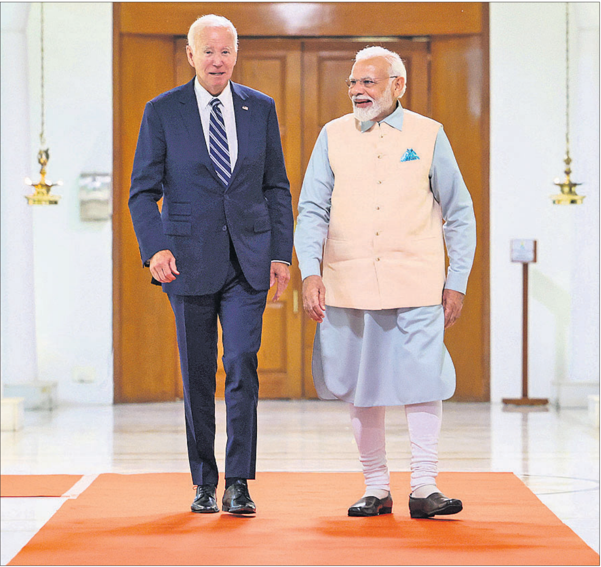
ନୂଆଦିଲ୍ଲୀସ୍ଥିତ ଲୋକ କଲ୍ୟାଣ ମାର୍ଗ ବାସଭବନରେ ଶୁକ୍ରବାର ଦ୍ୱିପାକ୍ଷିକ ଆଲୋଚନା ପରେ ପ୍ରଧାନମନ୍ତ୍ରୀ ନରେନ୍ଦ୍ର ମୋଦିଙ୍କ ସହ ଆମେରିକା ରାଷ୍ଟ୍ରପତି ଜୋ ବାଇଡେନ୍।