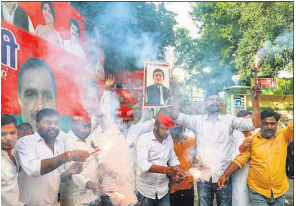
ଭରତପୁରସର ଘୋଷି ଆସନରେ ସମାଜବାଦୀ ପାର୍ଟି ପ୍ରାର୍ଥୀ ବିଜୟା ହେବା ପରେ କର୍ମୀମାନେ ଖୁସି ମନାଉଛନ୍ତି।

୬ ରାଜ୍ୟର ୬ ବିଧାନସଭା ଆସନ ଲାଗି ହୋଇଥିବା ଉପନିର୍ବାଚନ ଫଳାଫଳ ଶୁକ୍ରବାର ଘୋଷଣା କରାଯାଇଛି। ଏଥିରେ ବିରୋଧୀମାନଙ୍କ ମେଣ୍ଟ 'ଇଣ୍ଡିଆ'କୁ ବଳ ମିଳିଛି। ବିରୋଧୀ ୪ ଆସନରେ ଜିତିଥିବାବେଳେ ଭାଜପାକୁ ମିଳିଛି ୩ଟି ସିଟ୍।