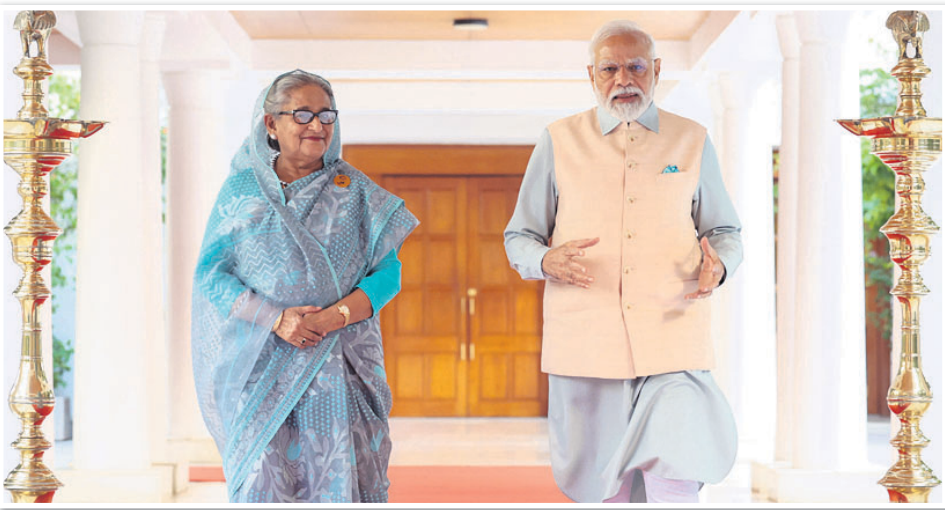
ବାଲାଦେଶ ପ୍ରଧାନମନ୍ତ୍ରୀ ଶେଖ୍ ହାସିନା ଓ ଭାରତୀୟ ପ୍ରତିପକ୍ଷ ନେତ୍ର ମୋଦି ।