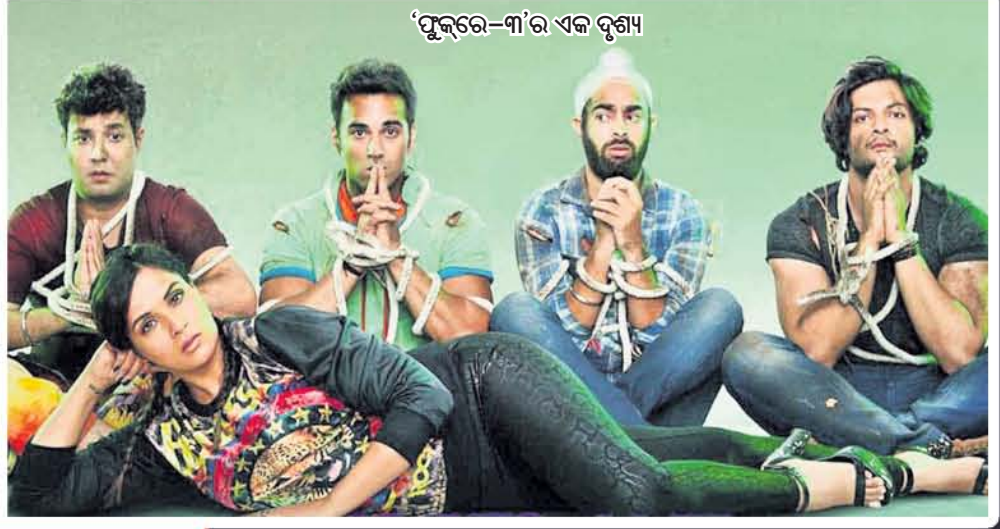
'ପୁଲ୍‌ରେ-୩'ର ଏକ ଦୃଶ୍ୟ