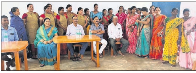
'ମିଶନ ଶକ୍ତି କାପେ' ଉଦ୍‌ଘାଟନୀରେ ଅତିଥିଙ୍କ ସହ ସ୍ୱୟଂ ସହାୟକା ଗୋଷ୍ଠୀର ସଦସ୍ୟ।

ଦେବଗଡ଼, ୯/୯ (ଶଶାଙ୍କ ଶେଖର ଝାଙ୍କର) ଓଡ଼ିଶା ସରକାରଙ୍କ ମିଶନ ଶକ୍ତି ବିଭାଗ ପକ୍ଷରୁ ବାରକୋଟ ରୁକ୍ମ ଅନ୍ତର୍ଗତ କଳା ଗ୍ରାମ ପଞ୍ଚାୟତ ସଦର ମହକୁମାରେ ଶନିବାର 'ମିଶନ ଶକ୍ତି କାପେ' ଉଦ୍‌ଘାଟିତ ହୋଇଯାଇଛି।