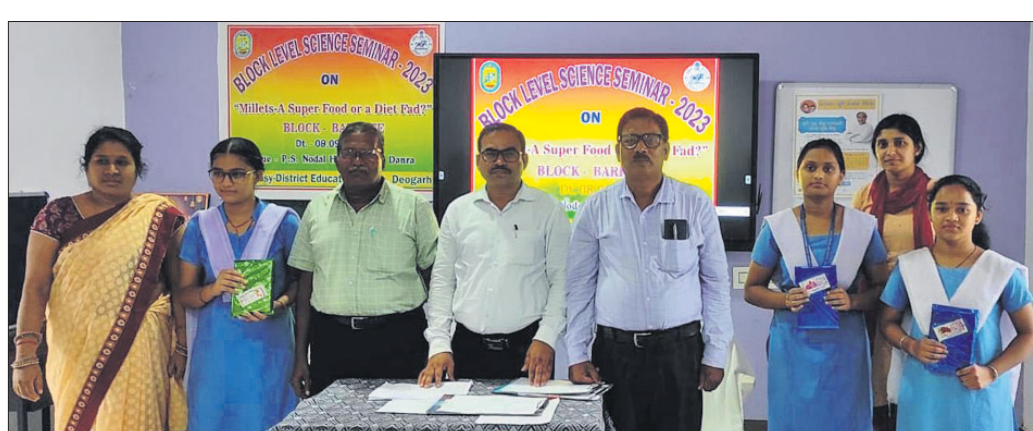
ବିଜ୍ଞାନ ଆଲୋଚନାଚକ୍ରରେ ଛାତ୍ରୀ ଓ ଶିକ୍ଷକ।

ଦେବଗଡ଼, ୯/୯ (ଶଶାଙ୍କ ଶେଖର ଝାଙ୍କର) ବାରକୋଟ ରୁକ୍ମ ୧୧ଟି ବିଦ୍ୟାଳୟର ପ୍ରତିଯୋଗୀ ଓ ଗାଇତ ଶିକ୍ଷକ ଯୋଗ ଦେଇଥିଲେ।