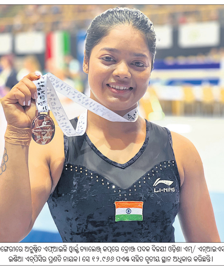
ହଜେଗରେ ଅନୁଷ୍ଠିତ ଏପିଆଇଇ ଓଲିମ୍ପିକ୍‌ରେ ବ୍ରୋ଼ି ପଦକ ବିଜୟୀ ଓଡ଼ିଶା ଏମ/ ଏନଆଇଏଏ ଭିକିଆ ଏକ୍ସପ୍ରିସ୍ ପ୍ରତିନିଧାନ । ସେ ୧୨.୯୬୭ ପଏଣ୍ଟ ସହିତ ତୃତୀୟ ଗ୍ଲାନ ଅଧିକାର କରିଛନ୍ତି ।

ହେଉଛନ୍ତି ବର୍ତ୍ତମାନର ବିଶ୍ୱ ଚାମ୍ପିୟନ । ସେ ୧୧.୪୮ ଗାଇମିଙ୍ଗ୍ରେ ରେସ୍ ଶେଷ କରିଥିଲେ । ଟ୍ରିପିଥ୍ ଗୋପନର ୧୯୮୮ ସିଡଲ ଅଲିମ୍ପିକ୍‌ରେ ୨୧.୩୪ ଗାଇମିଙ୍ଗ୍ ସହ ବିଶ୍ୱ ରେକର୍ଡର ଅଧିକାରୀ ହୋଇଥିଲେ । ଜ୍ୟାକସନ ରେସ୍ ଆରମ୍ଭରୁ ଶେଷ ପର୍ଯ୍ୟନ୍ତ ଆଗରେ ରହି ଅନ୍ୟ ପ୍ରତିଯୋଗୀଙ୍କୁ କୌଣସି ସୁଯୋଗ ଦେଇ ନ ଥିଲେ । ଆହୋରିକ୍ ଷ୍ଟାର୍‌ଗ୍ରାମ ବହୁପ୍ରକରେ ୨୨.୩୧ ଗାଇମିଙ୍ଗ୍ରେ ବିତାଣ ହୋଇଥିବା ବେଳେ ଆମେରିକାର ଜେନା ପ୍ରାଭିନି (୨୨.୪୬) ତୃତୀୟ ଗ୍ଲାନରେ ରହିଥିଲେ । ଜ୍ୟାକସନ ହେଉଛନ୍ତି ପ୍ରକୃତରେ ଜଣେ ୪୦୦ମିଟର ସ୍ପେସାଲିଷ୍ଟ । ସେ ଏକ କିଛି ବର୍ଷ ହେଲା ଖ୍ରୀଷ୍ଟରେ ମନୋନିବେଶ କରିଛନ୍ତି । ଟୋକିଓ ଅଲିମ୍ପିକ୍‌ରେ ସେ ୧୦୦ ମିଟରରେ ଡୋ଼ା଼ ଏବଂ ୪୫୧୦୦ମିଟର ରିଲେରେ ସର୍ବ ପଦକ ହାସଲ କରିଥିଲେ । ଏବେ ସେ ୨୦୦ ମିଟରରେ ଧ୍ୟାନ ଦେଉଛନ୍ତି । ୯ ବର୍ଷୀୟ ଏହି ଆଥଲେଟ୍ ୨୦୨୨ ବିଶ୍ୱ ଚାମ୍ପିୟନଶିପ୍ ୨୦୦ମିଟରରେ ସର୍ବ ପଦକ ଲାଭ କରିଥିଲେ ।