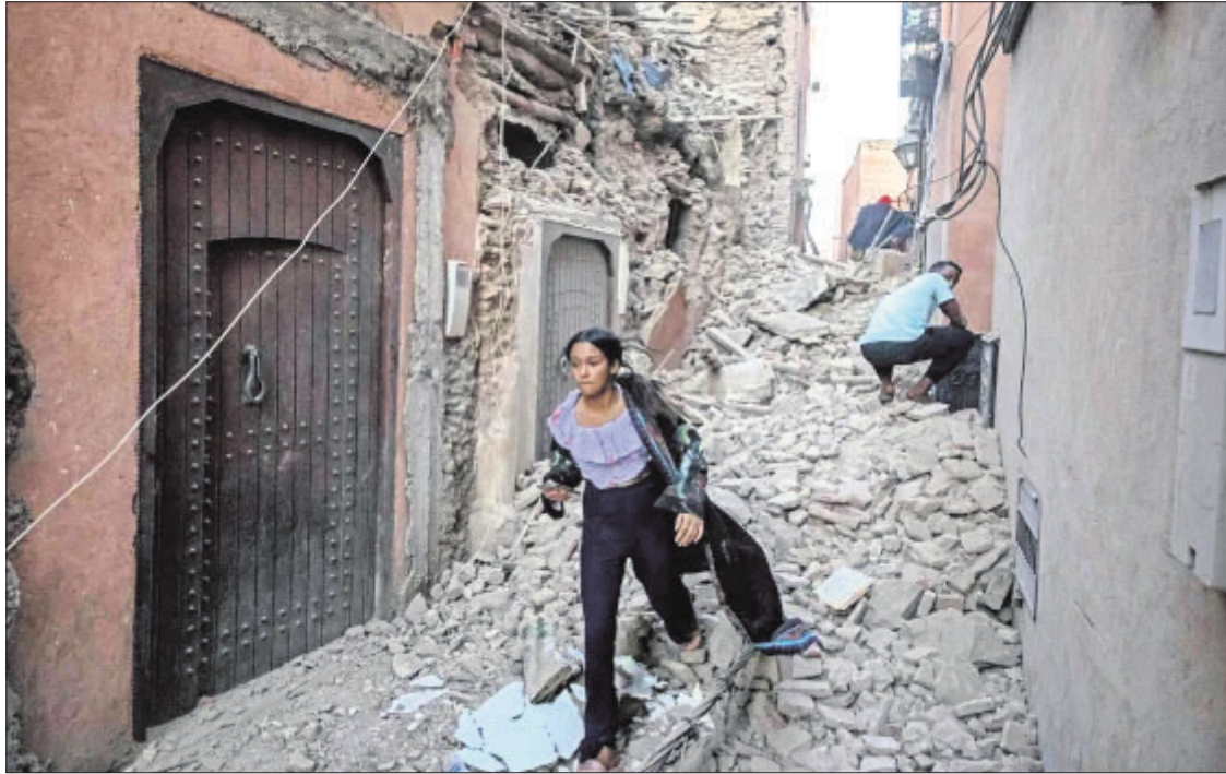
ମରକୋର ମାରାକେଶ୍ୱ ସହରରେ ଭୂକମ୍ପରେ ଧ୍ୱସ୍ତବିଧି ହୋଇପଡ଼ିଥିବା ଘରଗୁଡ଼ିକ।

ମରକୋରେ ଶୁକ୍ରବାର ଦିନସିତ ରାତିରେ ଶକ୍ତିଶାଳୀ ଭୂକମ୍ପ ଅନୁଭୂତ ହୋଇ ୧,୦୩୭ ଲୋକଙ୍କ ମୃତ୍ୟୁ ଘଟିଥିବାବେଳେ ୧,୨୦୦ରୁ ଅଧିକ ଆହତ ହୋଇଛନ୍ତି। ଉଦ୍ଧାର କାର୍ଯ୍ୟ ଜାରି ରହିଥିବାବେଳେ ଆହତଙ୍କ ମଧ୍ୟରୁ ଅନେକଙ୍କ ଅବସ୍ଥା ସଙ୍କଟାପନ୍ନ ଥିବାରୁ ମୃତ୍ୟୁସଂଖ୍ୟା ବଢ଼ିବା ଆଶଙ୍କା କରାଯାଇଛି। ଭୂକମ୍ପରେ ଆତଙ୍କିତ ମାରକେଶ୍ୱର ଅନ୍ତର୍ଗତ ଗ୍ରାମାଞ୍ଚଳଠାରୁ ଐତିହାସିକ ମାରାକେଶ୍ୱର ସହର ପର୍ଯ୍ୟନ୍ତ ଅନେକ ଘର ମାଟିରେ ମିଶିଯାଇଛି। ଭୂକମ୍ପର ତୀବ୍ରତା ରିକ୍ଟର ସ୍କେଲରେ ୬.୮ ଥିଲା ବୋଲି ଆମେରିକା ଭୂତାତ୍ମକ ସର୍ବେକ୍ଷଣ ସଂସ୍ଥା ପକ୍ଷରୁ କୁହାଯାଇଛି। ଅନ୍ୟପକ୍ଷରେ ଭୂକମ୍ପର ତୀବ୍ରତା ୭ ଥିଲା ବୋଲି ମରକୋ ନ୍ୟାଶନାଲ ସିସ୍ଟିମ୍ ମନିଟରିଂ ଆଣ୍ଡ ଆଲର୍ଟ ନେଟୱର୍କ ପକ୍ଷରୁ କୁହାଯାଇଛି। ରାତିରେ ଭୂକମ୍ପ ହେବାରୁ ମୃତ୍ୟୁସଂଖ୍ୟା ଅଧିକ ହୋଇଛି। କମ୍ପନ ବେଳେ ଯେଉଁମାନେ ଉଠିଥିଲେ, ସେମାନେ ଭୟରେ ଘରୁ ବାହାରି ରାସ୍ତାରେ ଧାଉଁଥିଲେ। ପୁଣି ଭୂକମ୍ପ ୯ ପୃଷ୍ଠା-୨