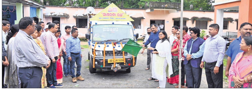
ଜିଲ୍ଲାପାଳ ସାକ୍ଷରତା ସାକ୍ଷରତା ରଥକୁ ଉଦ୍ଘାଟନ କରୁଛନ୍ତି।