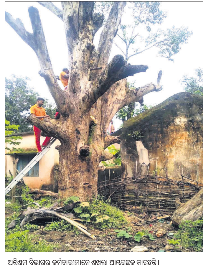
ଅଗ୍ନିଶମ ବିଭାଗର କର୍ମଚାରୀମାନେ ଶୁଖିଲା ଆମ୍ବଗଛକୁ କାଟୁଛନ୍ତି।

ଧରାଣୀ ସରକାରୀ ପ୍ରାଥମିକ ବିଦ୍ୟାଳୟ ପରିସର ବାହାରେ ଜଣେ ବ୍ୟକ୍ତିଙ୍କ ନିକଟରେ ଏକ ବିରାଟ ଶୁଖିଲା ଆମ୍ବଗଛ ରହିଥିବାବେଳେ ବିଭିନ୍ନ ସମୟରେ ଉକ୍ତ ଗଛକୁ ଶୁଖିଲା କାଠ ବିଭାଗ ପୁଞ୍ଜିରେ ଚେତା ପଶିବା ସହ ଅଗ୍ନିଶମ ବାହିନୀ ସହାୟତାରେ ଉକ୍ତ ଗଛକୁ କଟାଯାଇଥିବା ଜଣାପଡ଼ିଛି।