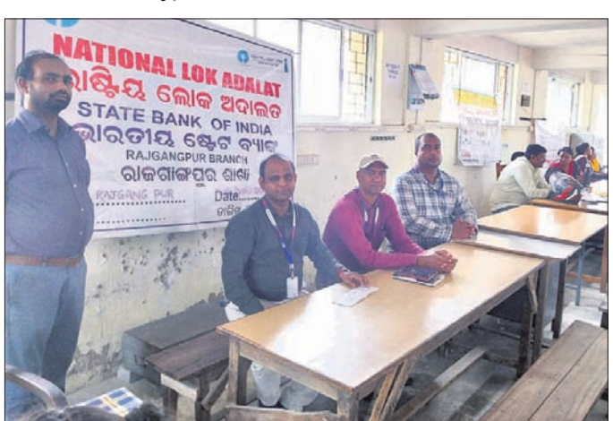
ରାଜଗାଙ୍ଗପୁର, ୯।୯ (ଅଶୋକ ପାଣି)

ସୁନ୍ଦରଗଡ଼ ଜିଲ୍ଲାର ରାଜଗାଙ୍ଗପୁର କୋର୍ଟ ପରିସରରେ ଶନିବାର ରାଷ୍ଟ୍ରୀୟ ଲୋକ ଅଦାଲତ ଅନୁଷ୍ଠିତ ହୋଇଯାଇଛି। ସ୍ଥାନୀୟ ବିଭିନ୍ନ ଜର୍ଦ୍ଦାନୀୟ ବିଭିନ୍ନ ସମ୍ପତ୍ତି ନାଏକ