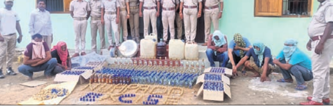
ଜବତ ନକଲି ମଦ, ଅତିରିକ୍ତ ଉପସ୍ଥିତ ବିଭାଗ କର୍ମଚାରୀ।