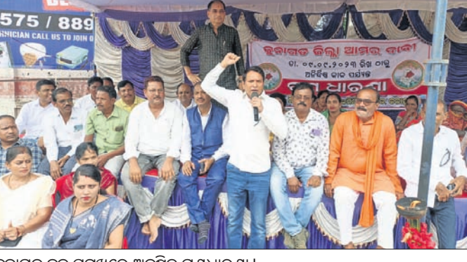
ଜୁନାଗଡ଼ ବ୍ଲକ୍ ସମ୍ମୁଖରେ ଅନୁଷ୍ଠିତ ଗଣଧାରଣା।