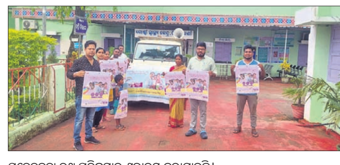
ସଚେତନତା ରଥ ପରିକ୍ରମାର ଶୁଭାରମ୍ଭ କରାଯାଇଛି।

ଦେବଗଡ଼, ୯/୯ (ଶଶାଙ୍କ ଶେଖର ଝାଙ୍କର) ମିଶନ ଲକ୍ଷ୍ୟ ଧରୁଷ ୫.୦ ଟିକାକରଣ ଉପଲକ୍ଷେ ଶନିବାର ତିଲେଇବଣୀ ରାଜ୍ୟ ଖୁଲାପକାରାଠାକୁ ସର୍ବାଧିକ କରାଯାଇଥିଲା।