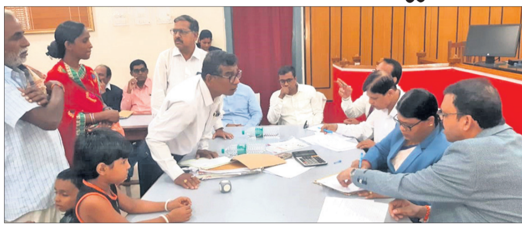
ବ୍ରହ୍ମପୁର, ୯/୯ (ସୁବାସ ଚନ୍ଦ୍ର ପାଢ଼ୀ)

କାତାୟ ଆଇନସେବା ପ୍ରାଧିକରଣ ନିର୍ଦ୍ଦେଶନାରେ ଓଡ଼ିଶା ପ୍ରାଧିକରଣ ସହଯୋଗରେ ଗଞ୍ଜାମ ଜିଲ୍ଲା ଆଇନସେବା ପ୍ରାଧିକରଣ ପକ୍ଷରୁ ଚଳିତବର୍ଷର ୩ୟ ରାଷ୍ଟ୍ରୀୟ ଲୋକ ଅଦାଲତ ଶନିବାର ଅନୁଷ୍ଠିତ ହୋଇଯାଇଛି।