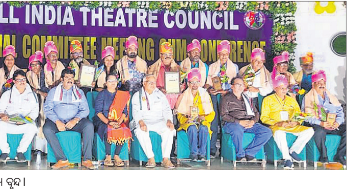
ସମ୍ମିଳନୀରେ ଉପସ୍ଥିତ ଅଭିପ୍ତ ଓ ସଂଘର ସଦସ୍ୟ ଦ୍ୱୟ।

ଗୋପାଳପୁର, ୯/୯ (ନରସିଂହ ଆଚାର୍ଯ୍ୟ) ଗଞ୍ଜାମ ଜିଲ୍ଲା ଅଧୀନ ସୁନାପୁର ସାମୁଦ୍ରିକ ଶିକ୍ଷାକେନ୍ଦ୍ରରୁ ଛାତ୍ରମାନଙ୍କୁ ଯାତ୍ରା କରିବାକୁ ଯାଇଥିଲେ। ସମୁଦ୍ର ମୁହାଣରେ ଛାତ୍ରମାନଙ୍କୁ ଯାତ୍ରା କରିବାକୁ ଯାଇଥିଲେ।