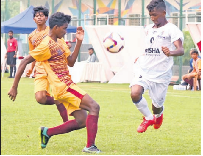
ଓଡ଼ିଶା ଓ ଛତିଶଗଡ଼ ମଧ୍ୟରେ ଅନୁଷ୍ଠିତ ମ୍ୟାଚ।

ଭୁବନେଶ୍ୱର, ୯୮୯ (ତପନ ସାହୁ) ଓଡ଼ିଶା ଓ ଛତିଶଗଡ଼ ମଧ୍ୟରେ ଅନୁଷ୍ଠିତ ମ୍ୟାଚରେ ଓଡ଼ିଶା ୧-୦ ହାରରେ ହରାଇଥିଲା।