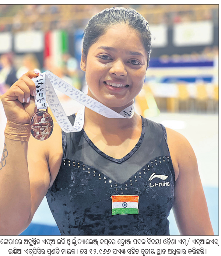
ହଜେରୀରେ ଅନୁଷ୍ଠିତ ଏସିଆକପ୍ ଖେଳିବାରେ ଭାଗ ନେଇଥିବା କପ୍‌ରେ ଗୋଟିଏ ପଦକ ବିଜୟୀ ଓଡ଼ିଶା ଏମ୍/ଏସିଆକପ୍ ଲଢ଼ିଆ ଏକ୍ସପ୍ରିସ୍ ପ୍ରତିନିଧାନ। ସେ ୧୨.୯୬୭ ପଏଣ୍ଟ ସହିତ ବୃତ୍ତୀୟ ଗ୍ଲାନ ଅଧିକାର କରିଛନ୍ତି।

କୋର୍ଟକୁ ସମର୍ଥନ କଲାନ୍ତି ବାଂଲାଦେଶ ବୋର୍ଡ କଲମ୍ବୋ, ୯।୯ (ପି.ଟି.) ଏସିଆ କପ୍ ସୁପର-୪ରେ ଭାରତ-ପାକିସ୍ତାନ ହାଇ ଭୋଲ୍ଟେଜ୍ ମ୍ୟାଚ୍ ପାଇଁ ରିଜର୍ଭ ଦିବସ ବ୍ୟବସ୍ଥାକୁ ବାଂଲାଦେଶ ଓ ଶ୍ରୀଲଙ୍କା ପୁଞ୍ଜୀ କୋର୍ଟ ବିରୋଧ କରିଥିଲେ। ତେବେ ବାଂଲାଦେଶ କ୍ରିକେଟ ବୋର୍ଡ ପକ୍ଷରୁ ଏହା ଏକ ସହମତି ଭିତ୍ତିକ ନିଷ୍ପତ୍ତି ବୋଲି କୁହାଯାଇଛି। ଶ୍ରୀଲଙ୍କା ଦଳର ପୁଞ୍ଜୀ କୋର୍ଟ କ୍ରିୟା ସିଲ୍ଲୁରୁଡ୍ ଓ ବାଂଲାଦେଶ ଦଳର କୋର୍ଟ ଚର୍ଯ୍ୟା ହାଥୁରସିଦା ଏହି ନିଷ୍ପତ୍ତିକୁ ବିରୋଧ କରିଥିଲେ। ତେବେ ବାଂଲାଦେଶ କୋର୍ଟ ମନ୍ତ୍ରାଳୟ କିଛି ଘଣ୍ଟା ମଧ୍ୟରେ ବାଂଲାଦେଶ କ୍ରିକେଟ ବୋର୍ଡ(ବିସିବି) ପକ୍ଷରୁ ଏକ ଟୁରନ୍ କରାଯାଇଥିଲା। ସୁପର-୪ରେ ପ୍ରବେଶ କରିଥିବା ସମଗ୍ର ଦଳର କ୍ରିକେଟ ବୋର୍ଡକ୍ ସହମତି ଭିତ୍ତିରେ ଏହି ନିଷ୍ପତ୍ତି