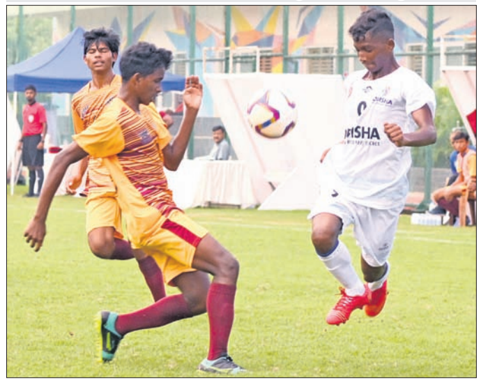
ଓଡ଼ିଶା ଓ ଛତିଶଗଡ଼ ମଧ୍ୟରେ ଅନୁଷ୍ଠିତ ମ୍ୟାଚ।

ଭୁବନେଶ୍ୱର, ୯୮୯ (ତପନ ସାହୁ) ନେବା ପାଇଁ ଉଭୟ ଦଳ ଉଦ୍ୟମକୁ ରାଜ୍ୟ ସରକାରଙ୍କ କ୍ରୀଡ଼ା ବିଭାଗ ଓ ଫୁଟବଲ ଆୟୋଗିକ୍ସର ଅଧିକାରୀ ଓଡ଼ିଶା(ଫାଓ) ଆନୁକୁଲ୍ୟରେ ଚାଲିଥିବା ବି.ସି. ରୟ ଟ୍ରଫି ଜାତୀୟ ଭୁବନେଶ୍ୱର ଫୁଟବଲ ଟୁର୍ନାମେଣ୍ଟରେ ଶନିବାର ୪ଟି ମ୍ୟାଚ ଅନୁଷ୍ଠିତ ହୋଇଛି। ଏଥିରେ ଓଡ଼ିଶା, ଉତ୍ତର ପ୍ରଦେଶ, କର୍ନାଟକ ଓ ଝାଡ଼ଖଣ୍ଡ ମେଡଭେଡେଭ। ଉଭୟ ଖେଳାଳି ୧୪ ଥର ପୁରସ୍କୃତ ହୋଇଥିବା ବେଳେ ଜୋକୋଭିଚ୍ ୯-୫ରେ ଆରୁଆ ରହିଛନ୍ତି।