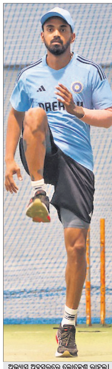
ଅଭ୍ୟାସ ଅବସରରେ ଲୋକେଶ ରାହୁଲ।

ଏସିଆ କପ୍ କ୍ରିକେଟ ରାହୁଲ ଓ ଇଶାନ କିଶନଙ୍କ ମଧ୍ୟରୁ କାହାକୁ ଦଳରେ ନିଆଯିବ ତାହାକୁ ନେଇ ଚିନ୍ତା ବଢ଼ିଛି। କିଶନ ନିଜ ଅତୀତରେ ୪ ମ୍ୟାଚରୁ ୪ ଅର୍ଦ୍ଧଶତକ ହାସଲ କରି ସମଗ୍ର ପ୍ରଭାବିତ କରିଛନ୍ତି। ସେ ଫ୍ଲେକ୍ସିବଲ୍ ବିପକ୍ଷରେ ଗତି ଏବଂ ପାକିସ୍ତାନ ବିପକ୍ଷ ଗୁପ୍ତ ମ୍ୟାଚରେ ଅର୍ଦ୍ଧଶତକ ହାସଲ କରିଛନ୍ତି। ୫ ନମ୍ବର ଗ୍ଲାନରେ ବ୍ୟାଟିଂ କରିବାକୁ କିଛି ଅହୁଣ୍ଡା ଅନୁଭବ କରୁ ନ ଥିବା ମଧ୍ୟ ସେ ପ୍ରମାଣିତ କରିଛନ୍ତି। ବାମହାତୀ ହୋଇଥିବାରୁ ତାଙ୍କ ଉପସ୍ଥିତିରେ ଭାରତୀୟ ବ୍ୟାଟିଂ ଲାଇନ୍‌ଅପ୍‌ରେ ବିବିଧତା ମଧ୍ୟ ଆସିପାରୁଛି। ଅନ୍ୟପକ୍ଷରେ ଆହତ ସମସ୍ୟାରୁ