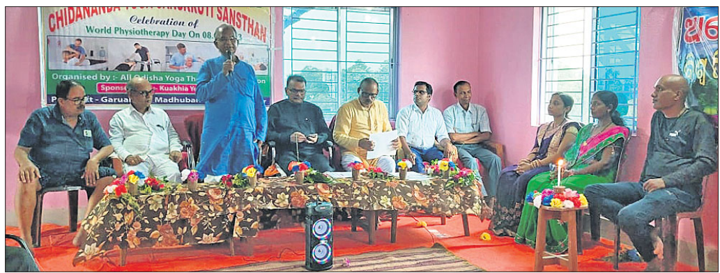
ବିଶ୍ୱ ଫିଜିଓଥେରାପି ଦିବସ ଅବସରରେ ଯୋଗଦେଇଥିବା ଅତିଥି ଓ ଅନ୍ୟମାନେ ।