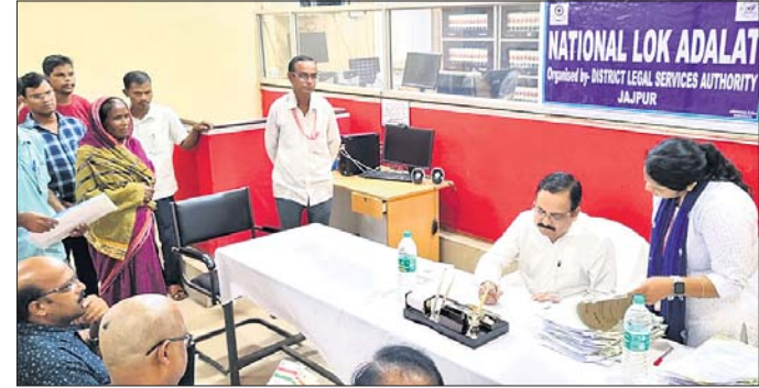
ରାଷ୍ଟ୍ରୀୟ ଲୋକ ଅଦାଲତରେ ମକଦ୍ଦମାର ବିଚାର ଚାଲିଛି ।