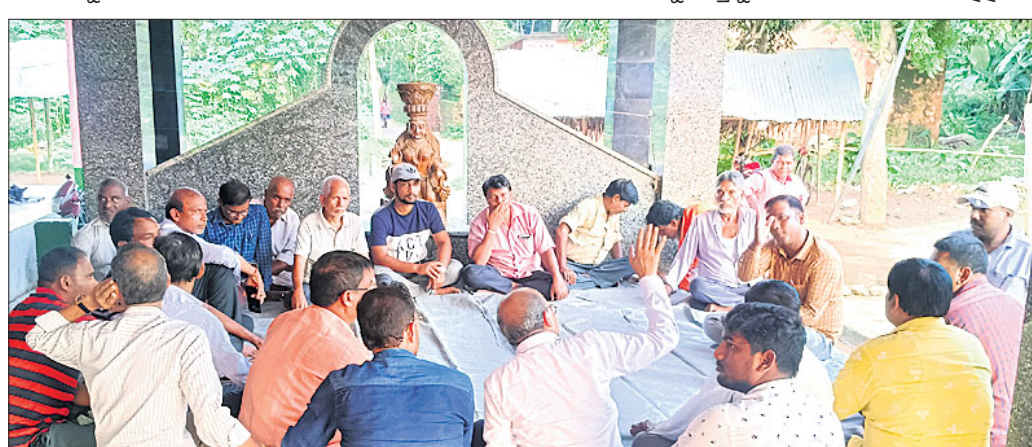
ବୈଠକରେ ଯୋଗଦେଇଥିବା ଗ୍ରାମବାସୀ ।

ଜଣାଇବା ପାଇଁ ସ୍ଥିର କରିଛନ୍ତି । ଯେହେତୁ ଏହା ଏକ ଗ୍ରାମାଞ୍ଚଳ ଓ ରାସ୍ତା ବନ୍ଦର ମଧ୍ୟ ଦେଇ ୪ ଲେନ ରାସ୍ତା ବଦଳରେ ୨ ଲେନ ରାସ୍ତା ନିର୍ମାଣ ପାଇଁ ଦାବି ହୋଇଛି । ଏଥିସହିତ ସରକାରୀ ଜମିକୁ ପ୍ରଥମେ ମାପରୂପ କରାଯିବ ପରେ ଆବଶ୍ୟକତାକୁ ବିରୋଧ କରି ନିଆଯାଇ, ଏହାଦ୍ୱାରା ଅନେକ ପରିବାର ବାସହରାକୁ