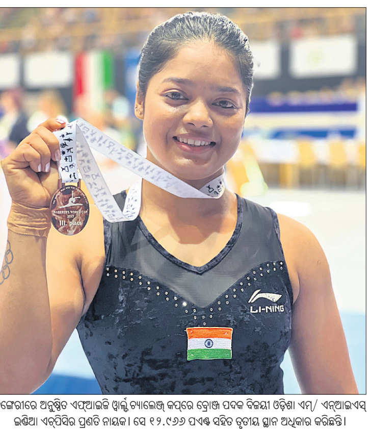
ହଜେଟାରେ ଅନୁଷ୍ଠିତ ଏସିଆକପ୍ ଉପରେ ବାଂଲାଦେଶ ଦଳରେ ବ୍ରୋଞ୍ଜ ପଦକ ବିଜୟୀ ଓଡ଼ିଶା ଏମ୍/ଏସିଆକପ୍ ଉପରେ ଏସିଆକପ୍ ପ୍ରତିନିଧିତା। ସେ ୧୨.୯୬୭ ପଏଣ୍ଟ ସହିତ ବ୍ରୋଞ୍ଜ, ଗ୍ଲାନ ଅଧିକାର କରିଛନ୍ତି।

ହେଉଛନ୍ତି ବର୍ତ୍ତମାନ ବିଶ୍ୱ ଚାମ୍ପିୟନ। ସେ ୨୧.୪୮ ଚାମ୍ପିୟନରେ ରେସ୍ ଶେଷ କରିଥିଲେ। ଗ୍ରୀସିଂ ଗୋପନର ୧୯୮୮ ସିଡ୍ନି ଅଲିମ୍ପିକ୍ରେ ୨୧.୩୪ ଚାମ୍ପିୟନ୍ ସହ ବିଶ୍ୱ ରେକର୍ଡର ଅଧିକାରୀ ହୋଇଥିଲେ। ଜ୍ୟାକସନ ରେସ୍ ଆରମ୍ଭରେ ଶେଷ ପର୍ଯ୍ୟନ୍ତ ଆଗରେ ରହି ଅନ୍ୟ ପ୍ରତିଯୋଗୀଙ୍କୁ କୌଣସି ସୁଯୋଗ ଦେଇ ନ ଥିଲେ। ଆନ୍ତର୍ଜାତିକ ଷ୍ଟାର୍ଟର ବହୁପ୍ରକରେ ୨୨.୩୧ ଚାମ୍ପିୟନ ହିରାମ ଏଲ୍ ଲୁସିରୋଜକ ନାମରେ ରହିଥିଲା। ସେ ୧୯୯୯ରେ ୪:୪୪.୬୯ ଚାମ୍ପିୟନ ରେକର୍ଡର ଅଧିକାରୀ ହୋଇଥିଲେ। ୨,୦୦୦ ମିଟର ଅଲିମ୍ପିକ୍ ପ୍ରୋଗ୍ରାମର ଅଂଶବିଶେଷ ରୁହେଁ ଜାମାଇକାର ଅଗ୍ରଣୀ ଡ୍ରିଣ୍ଡର ଶେରିକା ଜ୍ୟାକସନହିଲା ୨୦୦ ମିଟରରେ ଫ୍ଲୋରେନ୍ସ ଗ୍ରୀସିଂ ଗୋପନରକ୍ତ ଦୀର୍ଘ ୩୫ବର୍ଷରୁ ପୁରୁଣା ରେକର୍ଡ ଭଙ୍ଗ କରିବାରେ ବିଫଳ ହୋଇଛନ୍ତି। ଜାକସନ