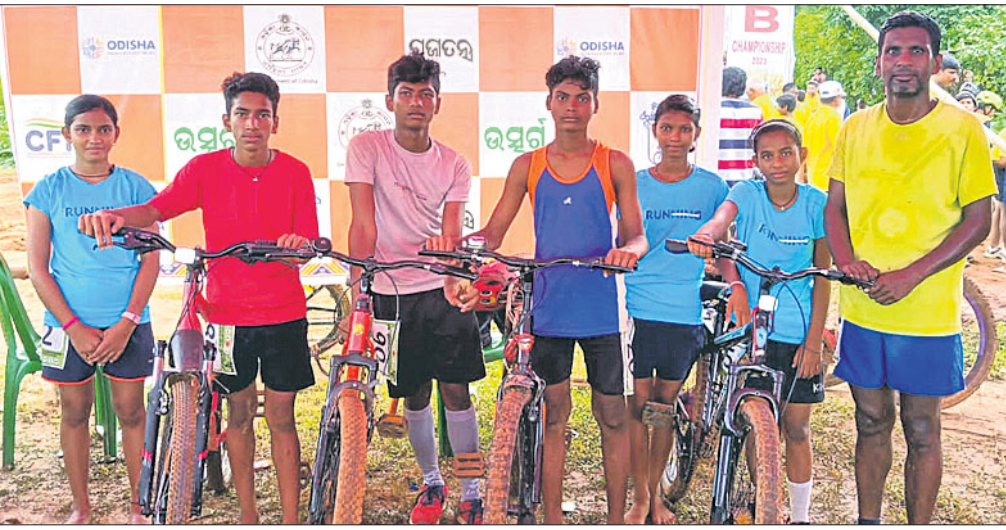
ସାଇକ୍ଲ ପ୍ରତିଯୋଗିତାରେ ଭାଗନେଇଥିବା ବନ୍ଦୀ ଛାତ୍ରୀଛାତ୍ରୀମାନେ ।