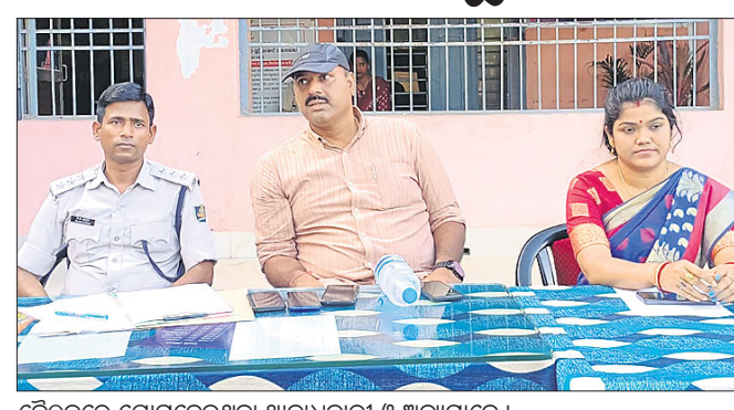
ବୈଠକରେ ଯୋଗଦେଇଥିବା ଆନାୟକାରୀ ଓ ଅନ୍ୟମାନେ ।