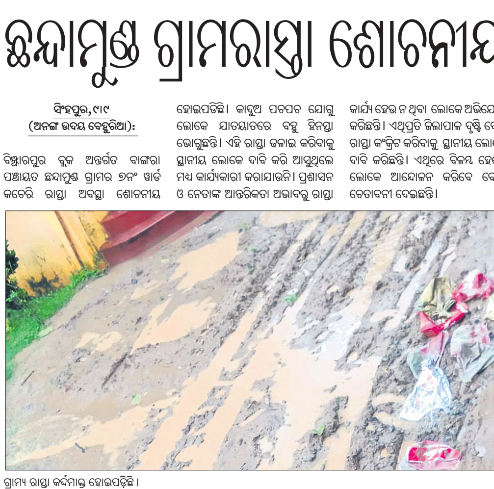
ଗ୍ରାମ୍ୟ ରାସ୍ତା କର୍ବମାତ୍ର ହୋଇପଡ଼ିଛି ।

ହୋଇପଡ଼ିଛି। କାରୁଆ ପରପତ ଯୋଗୁ ଯାତଯାତରେ ବହୁ ହିନସ୍ତା ଭୋଗୁଛନ୍ତି। ଏହି ରାସ୍ତା ଜଳାଇ କରିବାକୁ ସ୍ଥାନୀୟ ଲୋକେ ଦାବି କରି ଆସୁଥିଲେ ମଧ୍ୟ କାର୍ଯ୍ୟକାରୀ କରାଯାଇନାହିଁ। ପ୍ରଶାସନ ଓ ନେତାଙ୍କ ଆଡ଼ିକତା ଅଭାବରୁ ରାସ୍ତା