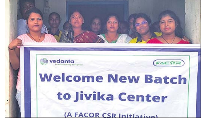
ପ୍ରଶିକ୍ଷଣ ଶିବିରରେ ଯୋଗଦେଇଥିବା ମହିଳାମାନେ ।