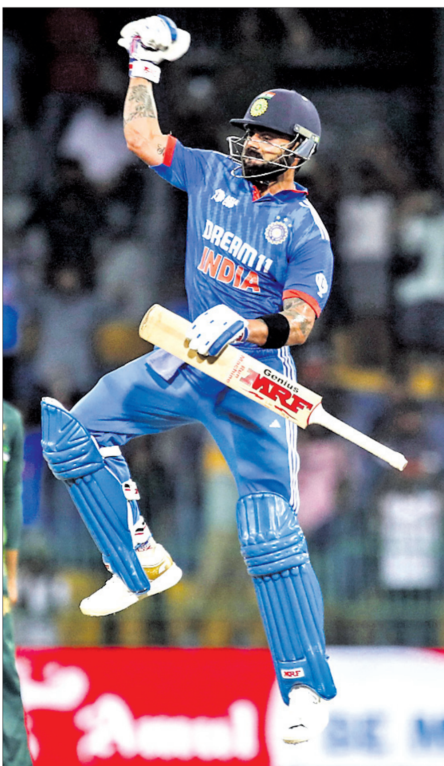
ଶତକ ହାସଲ ପରେ ଉଲ୍ଲାସିତ ବିରାଟ କୋହଲି।

ଭାରତର ଷ୍ଟାର କ୍ରିକେଟର ବିରାଟ କୋହଲି ଅନ୍ତର୍ଜାତୀୟ ଦିନିକିଆ କ୍ରିକେଟରେ ପୁରଣ କରିଛନ୍ତି ୧୩୫ ରନ୍। ପାକିସ୍ତାନ ବିପକ୍ଷରେ କୋହଲି ଏହି ମାଇଲଖୁଣ୍ଟ ହାସଲ କରିଛନ୍ତି। ଏହି ମ୍ୟାଚ ପୂର୍ବରୁ କୋହଲିଙ୍କୁ ୧୩୫ ରନ୍ ପୁରଣ କରିବାକୁ ୯୮ ରନ୍ ଆବଶ୍ୟକ ଥିଲା। ଏହି ମ୍ୟାଚରେ ଦିନିକିଆ କ୍ୟାରିୟରର ୪୭ତମ ଶତକ ପୁରଣ କରିବା ସହିତ ସମ୍ପୂର୍ଣ୍ଣ ଷ୍ଟାଇଲରେ ୧୩୫ ରନ୍ ପୁରଣ କରିଛନ୍ତି। ଏହା ସହିତ ବିଶ୍ୱର ଦ୍ରୁତତମ ଖେଳାଳି ଭାବରେ କୋହଲି ୧୩୫ ରନ୍ର କ୍ଲବରେ ପ୍ରବେଶ କରିଛନ୍ତି। ଭାରତର କ୍ରିକେଟ କିମ୍ବଦନ୍ତୀ ସଚିନ୍ ଡେବୁଲକରଙ୍କ ରେକର୍ଡ ଭାଙ୍ଗିଛନ୍ତି କୋହଲି। ଡେବୁଲକର ୩୨୧ ଜିନିଷରେ ୧୩୫ ରନ୍ ପୁରଣ କରିଥିବା ବେଳେ କୋହଲି ୨୬୭ ତମ ଜିନିଷରେ ଏହି ସଫଳତା ହାସଲ କରିଛନ୍ତି। ବିଶ୍ୱର ପଞ୍ଚମ ଖେଳାଳି ଭାବରେ କୋହଲି ଅନ୍ତର୍ଜାତୀୟ ଦିନିକିଆରେ ୧୩୫ ରନ୍ ସମ୍ପୂର୍ଣ୍ଣ କରିଛନ୍ତି। ସଚିନ୍ ଡେବୁଲକର (୧୮,୪୨୬ ରନ୍), କୁମ୍ଭାର ସଙ୍ଗକାରା (୧୪,୨୩୪ ରନ୍), ରିକି ପଣ୍ଡା (୧୩,୦୪୦ ରନ୍) ଓ ସନଥ ଜୟପୁରିୟା (୧୩,୪୩୦ ରନ୍) ପୂର୍ବରୁ ୧୩୫ ରନ୍ର କ୍ଲବରେ ସାମିଲ ଅଛନ୍ତି।