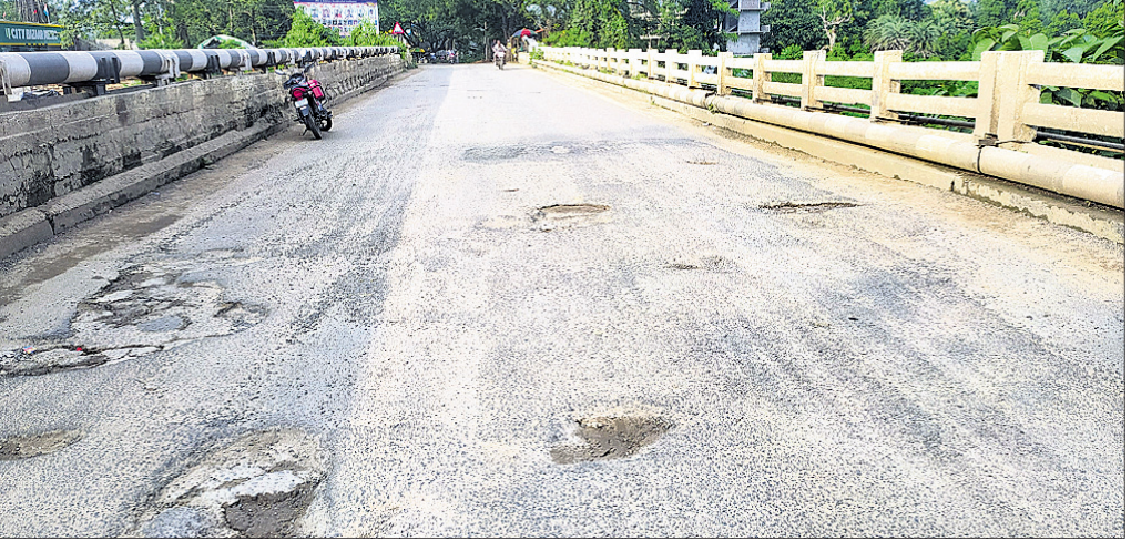
ଖାଲଖମାରେ ପରିପୂର୍ଣ୍ଣ ବ୍ରିଜ।

ସମ୍ମୁଖୀନ ହେଉଛନ୍ତି। ୫୭ ନଂ. ଜାତୀୟ ରାଜପଥ ଉପରେ ଉଚ୍ଚ ବ୍ରିଜଟି ଅସମ୍ପୂର୍ଣ୍ଣ, ଦୈନନ୍ଦିନ ଶହ ଶହ ଯାନବାହନ ଚଳାଚଳ କରୁଛି। ଏଭଳି ସ୍ଥିତିରେ ତାଳିପକା କାମ ନେଇ ସାଧାରଣରେ ଅସନ୍ତୋଷ ପ୍ରକାଶ ପାଇବାରେ ଲାଗିଛି। ଏହାର ଏକ ସ୍ଥାୟୀ ମରାମତି କରାଯାଉନାହିଁ। ଜାତୀୟ ରାଜପଥ କର୍ତ୍ତୃପକ୍ଷ ଏଥିପ୍ରତି ଦୃଷ୍ଟି ଦେଇ ମରାମତି କରିବାକୁ ସାଧାରଣରେ ଦାବି ହେଉଛି।