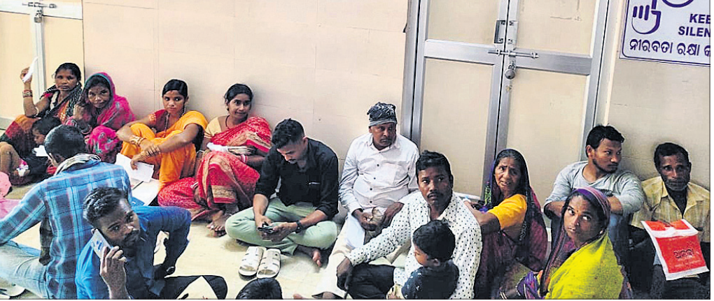
ଅଲଗା-ଅଲଗା କ୍ଷମ ବନ୍ଦ ଥିବାରୁ ଆସିଥିବା ରୋଗୀ ଓ ସମ୍ପର୍କୀୟ ଚିକିତ୍ସାଳୟ ବାରଣ୍ଡାରେ ବସି ରହିଛନ୍ତି।

ଜିଲ୍ଲା ମୁଖ୍ୟ ଚିକିତ୍ସାଳୟର ଯାହା ବିଭାଗରେ ବିଦ୍ୟୁତ୍ କଟିଲେ ରୋଗୀର କଫ ଚେଷ୍ଟା ବନ୍ଦ ରହିଛି। ଜିଲ୍ଲା ମୁଖ୍ୟ ଚିକିତ୍ସାଳୟ ପାଇଁ ଉଦ୍ଦିଷ୍ଟ ଜେନେରେଟରୁ ଯାହା ବିଭାଗକୁ ସଂଯୋଗ ଦିଆ ନ