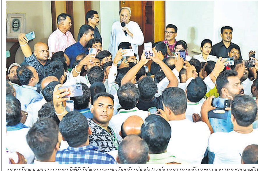
ନବୀନ ନିବାସରେ ଯୋଗଦାନ ହିଁ ନିର୍ବାଚନ ମଣ୍ଡଳୀ ବିଜେଡି କର୍ମକର୍ମୀ ଓ କର୍ମୀ ଦଳର ସଭାପତି ନବୀନ ପଟ୍ଟନାୟକଙ୍କୁ ଭେଟୁଛନ୍ତି।

ପାଟଣା, ୧୧:୧୫ : ଲି-୨୦ରେ ରାଷ୍ଟ୍ରପତି ଦ୍ରୌପଦୀ ପୂର୍ଣ୍ଣିକା ଦ୍ୱାରା ଆୟୋଜିତ ଦେଶ ଭୋଜିରେ ବିହାର ମୁଖ୍ୟମନ୍ତ୍ରୀ ନୀତିଶ କୁମାର ମଧ୍ୟ ଯୋଗଦେଇଥିଲେ। ଏପ୍ରସଙ୍ଗକୁ ନେଇ ପ୍ରଶାନ୍ତ କିଶୋର (ପିକେ) ନୀତିଶଙ୍କୁ କଡ଼ା ସମାଲୋଚନା କରିଛନ୍ତି। ନୀତିଶଙ୍କୁ ଭାଜପାକୁ ଏକ ବାର୍ତ୍ତା ଦେବାକୁ ଯାଇଥିଲେ ଯେ, ଯଦି ସେମାନେ ଗୁରୁତ୍ୱ ନ ଦିଅନ୍ତି ତଥାପି ଆମେ ମଧ୍ୟ ସେଠାକୁ ଯାଇପାରୁ। ଗତ ୮ ବର୍ଷ ମଧ୍ୟରେ ନୀତିଶ ସେଠାକୁ ଯାଇ ନ ଥିଲେ। ସେ ଭାଜପା ସହିତ ଥିବା ସମୟରେ ମଧ୍ୟ ଏପରି କରି ନ ଥିଲେ। ପ୍ରଶାନ୍ତ କିଶୋର କହିଛନ୍ତି, ନୀତିଶ ଭାରି ଚତୁର। ତାଙ୍କର ରାଜନୀତି କରିବାର ନିକଟ୍ତ ରଖିବାଟି ଅଛି। ଗୋଟିଏ କବାଟ ଖୋଲା ରଖି ଉଭୟ ଝରକା ଏବଂ ଖାଏଲାଲଟ ପଛ ପଟରୁ ଖୋଲା ରଖିଛନ୍ତି। କେତେବେଳେ କାଳେ କ'ଣ ଆବଶ୍ୟକ ହେବ। ତେଣୁ ସେ ନିଜର ରାୟ ଖୋଲା ରଖିଛନ୍ତି। ଇଣ୍ଡିଆ ମେଟ ହେଉଛି ନୀତିଶଙ୍କ ଘର କବାଟ ଏବଂ ଝରକା ହେଉଛି ଏନ୍ଡିଏ ଯାହାର ରାଜ୍ୟସଭା ସଦସ୍ୟ ହେଉଛି। ହରିବଂଶ ନାରାୟଣ। ହରିବଂଶଙ୍କ ମାଧ୍ୟମରେ ସେ ଭାଜପା ସହ ଯୋଗାଯୋଗରେ ଅଛନ୍ତି। କୋଠାକୁ ଆଲୋକ ଆସିବା ପାଇଁ ଆମେ ଘ୍ଲାନ ଛାଡ଼ିବା ପରି ଏହା ଏକ ମେସେଜିଂ ଅଟେ। ଏହା ଭାଜପା ଏବଂ ଏନଡିଏ ସଦସ୍ୟଙ୍କୁ ବାର୍ତ୍ତା ଦେଉଛି। କେହି ଜଣେ ନୀତିଶ କୁମାରକୁ ପଚାରିବା ଉଚିତ ସେ ଗତ ବର୍ଷ କାହିଁକି ଯାଇ ନ ଥିଲେ? ଏନ୍ଡିଏ ଲୋକଙ୍କ ଉପରେ ଗପ ପକାଇବାର ଏହା ହେଉଛି ସେମାନଙ୍କର ଉଦ୍ଦେଶ୍ୟ। ଯଦି ଆପଣଙ୍କ ଲୋକମାନେ ଆମକୁ ଗୁରୁତ୍ୱ ଦିଅନ୍ତି ନାହିଁ ତେବେ ଆମେ ମଧ୍ୟ ସେଠାକୁ ଯାଇପାରୁ। ବିହାରରେ ନୀତିଶ କୁମାରଙ୍କ ରାଜନୀତି ସମସ୍ତଙ୍କୁ ଜଣା ବୋଲି ପିକେ କହିଛନ୍ତି।