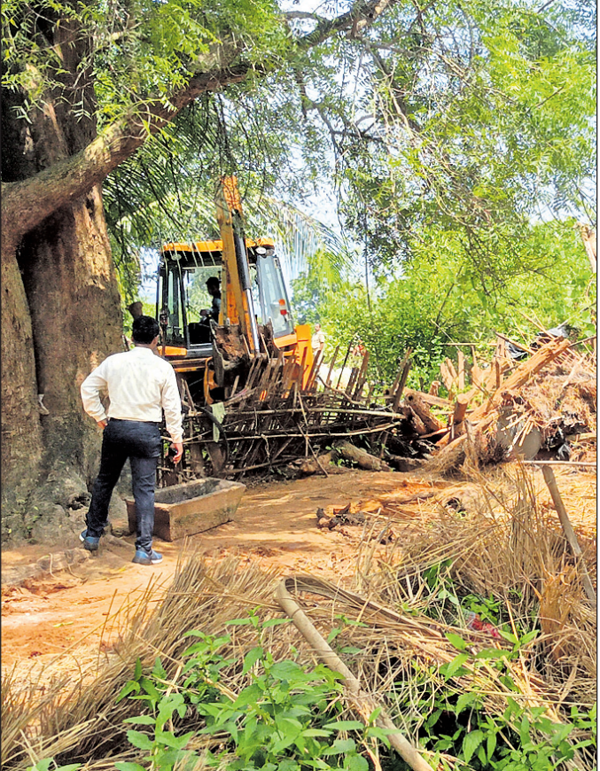
ସରକାରୀ କମ୍ପିଉଟର ଜେସିବି ଲଗାଇ ପ୍ରଶାସନ ଜବରଦଖଲ ଉଦ୍ଧେଦ କରୁଛି।