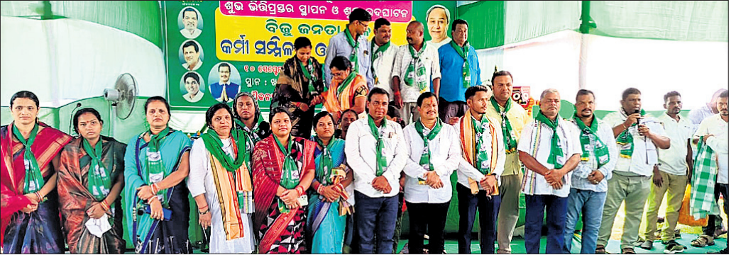
ସଭାରେ ବିଧାୟକଙ୍କ ସହ ବିଜେଡି କର୍ମୀ ।