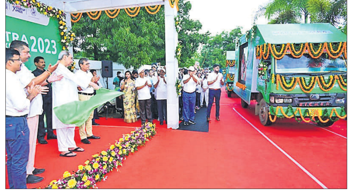
ପୁଞ୍ଜ୍ୟମନ୍ତ୍ରୀ ନବୀନ ପଟ୍ଟନାୟକ ଶ୍ଯର୍ତ୍ତାୟ ଏକପ୍ରେସ୍‌କୁ ପତାକା ଦେଖାଇ ଉଦ୍ଘାଟନ କରୁଛନ୍ତି।