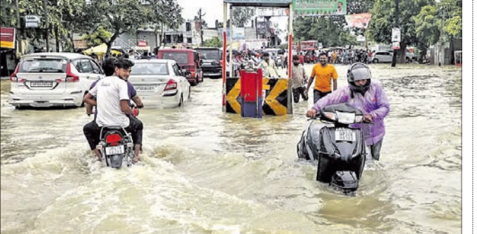
ପ୍ରବଳ ବର୍ଷା ଯୋଗୁ ହୁସିର ବାରବାଙ୍କୀ ଜିଲାର ରାସ୍ତା ଜଳାଶୟିତ।

ଲକ୍ଷ୍ନୋ, ୧୧: ବର୍ଷା ବିପ୍ଲବ ଯୋଗୁ ଉତ୍ତର ପ୍ରଦେଶରେ ଗତ ୨୪ ଘଣ୍ଟା ମଧ୍ୟରେ ୧୯ ଜଣଙ୍କ ମୃତ୍ୟୁ ଘଟିଛି ବୋଲି ରାଜ୍ୟ ଚିଲିଫ କମିଶନର କାର୍ଯ୍ୟାଳୟ ପକ୍ଷରୁ ଜଣାଯାଇଛି। ବଡ଼ପାତରୁ ୪ ଜଣଙ୍କ ମୃତ୍ୟୁ ଘଟିଥିବାବେଳେ ପାଣିରେ ବୁଡ଼ି ୨ ଜଣଙ୍କ ମୃତ୍ୟୁ ଘଟିଛି। ରାଜ୍ୟର ଆଭ୍ୟନ୍ତରୀଣ ଅଞ୍ଚଳରେ ପ୍ରବଳ ବର୍ଷା ହୋଇଥିବାରୁ ରବିବାର ଠାରୁ ଜୀବନଯାତ୍ରା ବ୍ୟାହତ ହୋଇଛି। ମୃତକଙ୍କ ମଧ୍ୟରେ ୪ ଜଣ ହାରିଡ଼ି, ବରବାଙ୍କିର ୩, ପ୍ରତାପଗଡ଼ ଓ କନୌଜର ୨ ଜଣ ଲେଖ୍ୟ ରହିଛନ୍ତି।