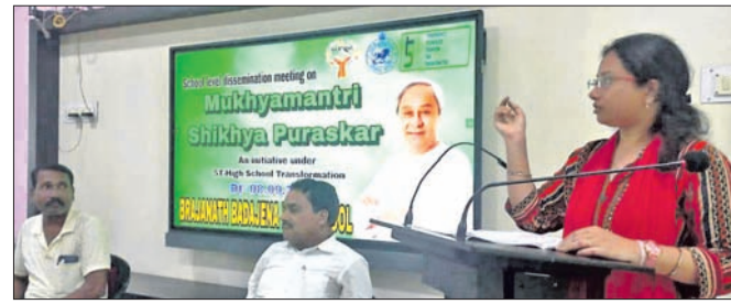
ପୁଞ୍ଜୀମନ୍ତ୍ରୀ ଶିକ୍ଷା ପୁରସ୍କାର ସଚେତନତା କାର୍ଯ୍ୟକ୍ରମ।

ଓଡ଼ିଶା ସରକାରଙ୍କ ନିର୍ଦ୍ଦେଶନାମା ଅନୁଯାୟୀ ଦେଈାନାଳ ସହରସ୍ଥିତ ଶିକ୍ଷା ମନ୍ତ୍ରୀଙ୍କୁ ପୁରସ୍କାର ଦିଆଯାଇଛି।