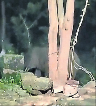
୫ନଂ ଓଡ଼ିରେ ପଶିଥିବା ଦନ୍ତାହାତୀ।

ଦେଈାନାଳ, ୧୧/୯ (ରତନ ନାୟର) ଦେଈାନାଳ ପୌରାଞ୍ଚଳ ୫ ନଂ. ଓଡ଼ି ଚାନ୍ଦମାରି ସାହି ଦେବାମନ୍ଦିର ପଛ ପାଖରେ ଯୋମବାର ସନ୍ଧ୍ୟାରେ ଏକ ଦନ୍ତାହାତୀ ଉପପ୍ରବ ଚଳାଇଛି।