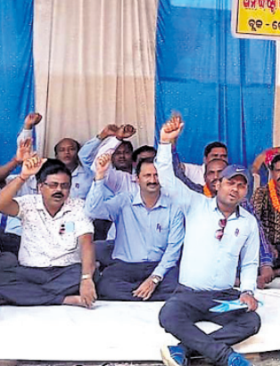
ପ୍ରାଥମିକ ଶିକ୍ଷକମାନେ କାର୍ଯ୍ୟବନ୍ଧ ଆନ୍ଦୋଳନ ଚଳାଇଛନ୍ତି।

ନିଖୁଳ ଉତ୍ତର ପ୍ରାଥମିକ ଶିକ୍ଷକ ଫେଡ଼ରେଶନ୍‌ର ଆହ୍ୱାନକ୍ରମେ ୩ ଦିନ ଧରି ଦେଈାନାଳ ସଦର ବ୍ଲକ୍ ସମସ୍ତ ବର୍ଗର ଶିକ୍ଷକମାନେ ଯୋମବାରଠାରୁ ବ୍ଲକ୍ ଶିକ୍ଷାଧିକାରୀଙ୍କ କାର୍ଯ୍ୟାଳୟ ସମ୍ମୁଖରେ ଧାରଣା ଦେଇଛନ୍ତି।