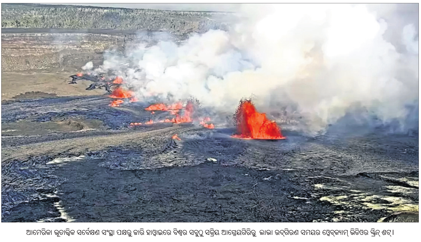
ଆମେରିକା ଭୂତାତ୍ମକ ସର୍ବେକ୍ଷଣ ସଂସ୍ଥା ପକ୍ଷରୁ ଜାରି ହୋଇଥିବା ଏହି ସମୁଦ୍ର ସମୂହ ଆଗୋଲ୍ଡାଗ୍ନିଶିଳା ମାତା ଉଦ୍ଗିରଣ ସମୟର ଫ୍ଲୋରୋଗ୍ରାଫିକ୍ ଫ୍ରିମ୍ ଶବ୍ଦ।

ହାଇଦ୍ରାବାଦ, ୧୧: ଆନ୍ଧ୍ରପ୍ରଦେଶର ପୂର୍ବତନ ମୁଖ୍ୟମନ୍ତ୍ରୀ ତଥା ଚିତ୍ତିପି ଅଧ୍ୟକ୍ଷ ଏନ୍. ଚନ୍ଦ୍ରାବାବୁ ନାଲନ୍ଦୁକୁ ଦୁର୍ନୀତି ମାମଲାରେ ସିଆଇଡି ରିଟପ କରିବା ପରେ ଦଳର ସମସ୍ତ ୨୧ ବିଧାନସଭାକୁ ଗୃହବନ୍ଧ ରଖାଯାଇଛି। ଆନ୍ଧ୍ର ବିଭିନ୍ନ ସହରରେ ଥିବା ସେମାନଙ୍କ ଘର ବାହାରେ ବ୍ୟାପକ ପୋଲିସ ଫୋର୍ସ ମୁତୟନ ହୋଇଛି। ଚନ୍ଦ୍ରାବାବୁଙ୍କ ରିଟପଦାରି ପ୍ରତିବାଦରେ ଚିତ୍ତିପି ପକ୍ଷରୁ ସେମାନଙ୍କ ରାଜ୍ୟବ୍ୟାପୀ ବନ୍ଦ ଡାକରା ଦିଆଯାଇଥିବାବେଳେ ସହରଗୁଡ଼ିକରେ କଡ଼ା ସୁରକ୍ଷା ବ୍ୟବସ୍ଥା ଗ୍ରହଣ କରାଯିବା ସହ ଲୋକେ ଏକାଠି ନ ହେବା ଲାଗି ୧୪୪ ଧାରା ଜାରି ହୋଇଛି। ପୋଲିସ ବିଭିନ୍ନ ସ୍ଥାନରେ ଚଢ଼ାଉ କରି ବହୁ ସଂଖ୍ୟାରେ ଚିତ୍ତିପି ନେତାଙ୍କୁ ଅଟକ ରଖିଛି। ବହୁକୋଟି ଟଙ୍କା ଆନ୍ଧ୍ରପ୍ରଦେଶ ରାଜ୍ୟ ସମ୍ପତ୍ତି ବିକାଶ ନିଗମ ଦୁର୍ନୀତି ମାମଲାରେ ସମ୍ପୂର୍ଣ୍ଣ ଚନ୍ଦ୍ରାବାବୁଙ୍କୁ ଶରୀକାର ରିଟପ କରାଯାଇଥିଲା। ତାଙ୍କୁ ୧୪ ଦିନ ପାଇଁ ବିଚାରବିଭାଗୀୟ ହାତକୁ ପଠାଇ ଦିଆଯାଇଛି।