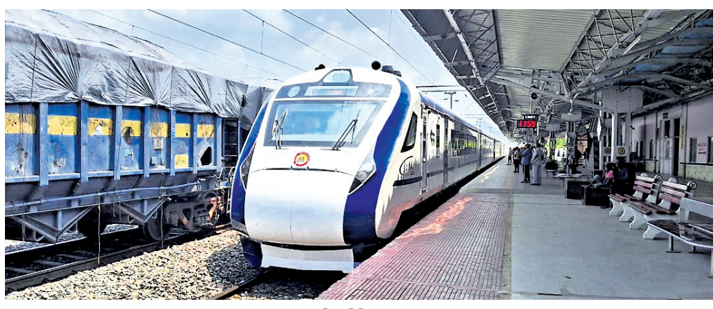
ଦେଢ଼ାନାଳ ଷ୍ଟେଶନରେ ବନ୍ଦେ ଭାରତ ଏକ୍ସପ୍ରେସ୍ ଟ୍ରେନ୍ ରହଣି କରିଛି।