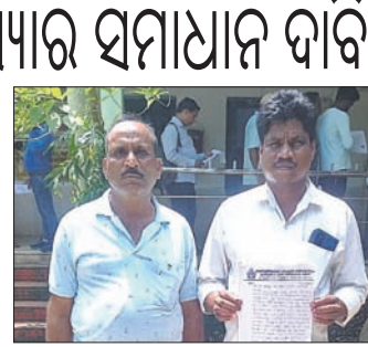
ଶିକ୍ଷକ ଅଭାବ ନେଇ ଦୁର୍ଗା ପ୍ରସାଦ ଗ୍ରାମବାସୀ ଅଭିଯୋଗ କରୁଛନ୍ତି।

ଦେଈାନାଳ ଜିଲ୍ଲା ସଦର ବ୍ଲକ୍ ଦୁର୍ଗାପ୍ରସାଦ ଗ୍ରାମର ସ୍କୁଲ ପରିଚାଳନା କମିଟି ଓ ଅଭିଭାବକମାନେ ବିଦ୍ୟାଳୟରେ ଶିକ୍ଷକ ଅଭାବ ସମସ୍ୟାର ସମାଧାନ ଦାବି କରିଛନ୍ତି।