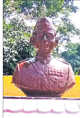
ନେତାଜୀଙ୍କ ନୂତନ ପ୍ରତିମୂର୍ତ୍ତି।

ଦେଈାନାଳ ନୂଆପୋଖରୀ ସମ୍ମୁଖରେ ଥିବା ନେତାଜୀ ଶିଶୁ ଉଦ୍ୟାନ ପରିସରରେ ପୌରସଂସ୍ଥା ପକ୍ଷରୁ ଯୋମବାର ନେତାଜୀ ପୁରାଣ ଚନ୍ଦ୍ର ବୋଷଙ୍କ ଏକ ନୂତନ ପ୍ରତିମୂର୍ତ୍ତି ସ୍ଥାପନ କରାଯାଇଛି।