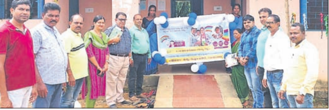
ଡାହିମାଳ ଗ୍ରାମରେ ମିଶନ ଇନ୍ଦ୍ରଧନୁ ଉଦ୍‌ଘାଟନ ଅବସରରେ ଅତିଥିମାନେ।

ଦେଈାନାଳ, ୧୧/୯ (ରତନ ନାୟର) ଦେଈାନାଳ ଜିଲ୍ଲା ସଦର ବ୍ଲକ୍ ନାରିଆପଶି ପଞ୍ଚାୟତ ଡାହିମାଳ ଗ୍ରାମ ଅଙ୍ଗନୱାଡି କେନ୍ଦ୍ର ପରିସରରେ ଯୋମବାର ଜିଲ୍ଲା ସ୍ୱାସ୍ଥ୍ୟ ସମିତି ପକ୍ଷରୁ ଇନ୍ଦ୍ରଧନୁ ମିଶନର ନିମନ୍ତେ ମିଶନ ଇନ୍ଦ୍ରଧନୁ ଉଦ୍‌ଘାଟିତ ହୋଇପାରିଛି।