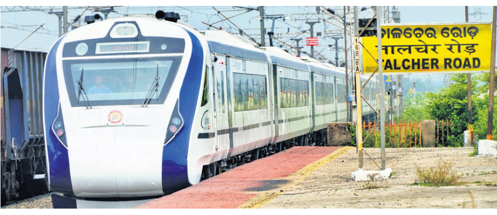
ଚାଳଚେର ରୋଡ଼ ଷ୍ଟେଶନରେ ପ୍ରବେଶ କରୁଛି ବନ୍ଦେ ଭାରତ ଏକ୍ସପ୍ରେସ୍ ଟ୍ରେନ୍।