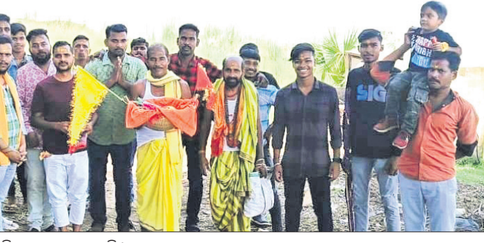
ମୂର୍ତ୍ତି ନିର୍ମାଣ ନିମନ୍ତେ ବ୍ରାହ୍ମଣ ନଦୀକୂଳରୁ ମାଟି ସଂଗ୍ରହ କରାଯାଇଛି।

ଦେଈାନାଳ ରାଧାକୃଷ୍ଣ ବଜାର ଶ୍ରୀଶ୍ରୀ ଗଣେଶ ପୂଜା ପ୍ରତିଷ୍ଠାନ ଚରଫରୁ ଗଣେଶଙ୍କ ମୂର୍ତ୍ତି ନିର୍ମାଣ ପାଇଁ ଚଳିତବର୍ଷ ମାଟି ସଂଗ୍ରହ କରାଯାଇଛି।