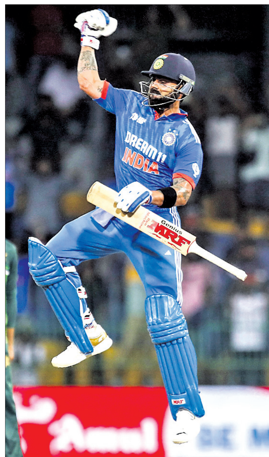
ଶତକ ହାସଲ ପରେ ଉଲ୍ଲସିତ ବିରାଟ କୋହଲି।

ଭାରତର ଷ୍ଟାର କ୍ରିକେଟର ବିରାଟ କୋହଲି ଅନ୍ତର୍ଜାତୀୟ ଦିନିକିଆ କ୍ରିକେଟରେ ପୁରଣ କରିଛନ୍ତି ୧୩୫ ରନ୍। ପାକିସ୍ତାନ ବିପକ୍ଷ ଏସିଆ କପର ସୁପର-୪ ମ୍ୟାଚରେ କୋହଲି ଏହି ମାଇଲଖୁଣ୍ଟ ହାସଲ କରିଛନ୍ତି। ଏହି ମ୍ୟାଚ ପୂର୍ବରୁ କୋହଲିଙ୍କୁ ୧୩୫ ରନ୍ ପୁରଣ କରିବାକୁ ୯୮ ରନ୍ ଆବଶ୍ୟକ ଥିଲା। ଏହି ମ୍ୟାଚରେ ଦିନିକିଆ କ୍ୟାରିୟରର ୪୭ତମ ଶତକ ପୁରଣ କରିବା ସହିତ ସମ୍ପୂର୍ଣ୍ଣ ଷ୍ଟାଲରେ ୧୩୫ ରନ୍ ପୁରଣ କରିଛନ୍ତି। ଏହା ସହିତ ବିଶ୍ୱର ଦ୍ରୁତତମ ଖେଳାଳି ଭାବରେ କୋହଲି ୧୩୫ ରନ୍ କ୍ଲବରେ ପ୍ରବେଶ କରିଛନ୍ତି। ଭାରତର କ୍ରିକେଟ କିମ୍ବଦନ୍ତୀ ସଚିନ୍ ଡେବୁଲକରଙ୍କ ରେକର୍ଡ ଭାଙ୍ଗିଛନ୍ତି କୋହଲି। ଡେବୁଲକର ୩୨୧ ଇନିଂସରେ ୧୩୫ ରନ୍ ପୁରଣ କରିଥିବା ବେଳେ କୋହଲି ୨୬୭ ତମ ଇନିଂସରେ ଏହି ସଫଳତା ହାସଲ କରିଛନ୍ତି। ବିଶ୍ୱର ପଞ୍ଚମ ଖେଳାଳି ଭାବରେ କୋହଲି ଅନ୍ତର୍ଜାତୀୟ ଦିନିକିଆରେ ୧୩୫ ରନ୍ ସମ୍ପୂର୍ଣ୍ଣ କରିଛନ୍ତି। ସଚିନ୍ ଡେବୁଲକର (୧୮,୪୨୬ ରନ୍), କୁମ୍ଭାର ସଙ୍ଗକାରା (୧୪,୨୩୪ ରନ୍), ରିକି ପଣ୍ଡା (୧୩,୦୪୦ ରନ୍) ଓ ସନଥ ଜୟପୁରିୟା (୧୩,୪୩୦ ରନ୍) ପୂର୍ବରୁ ୧୩୫ ରନ୍ କ୍ଲବରେ ସୀମା ଅଛନ୍ତି।