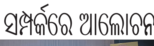
ଦୈନିକରେ ଜୀବନଜୀବିକା ଓ ଜମି ସୁରକ୍ଷା କମିଟିର କର୍ମକର୍ତ୍ତାମାନେ।

କମିଟି ପକ୍ଷରୁ କୁହାଯାଇଛି, ଏହି ଷ୍ଟେଶନ ଦେଇ ଭୁବନେଶ୍ୱର-ବଲାଙ୍ଗୀର ଇଞ୍ଜରସିଟି ଏକ୍ସପ୍ରେସ୍ ଯାଉଥିଲେ ମଧ୍ୟ ରହଣି କରୁନାହାଁ। ଫଳରେ ଏହି ଟ୍ରେନ୍ ଉପରେ ନିର୍ଭର କରୁଥିବା ଅଞ୍ଚଳବାସୀମାନେ ରେଡ୍‌ଗୋଲ୍ଡ ଓ ବଲୁଣ୍ଡା ରେଳଷ୍ଟେଶନ ଉପରେ ନିର୍ଭର କରି ଅଥଚା ଖର୍ଚ୍ଚକ ଦେଉଛନ୍ତି। ଟ୍ରେନ୍ ରହଣି ପାଇଁ ବହୁବାର ଆନ୍ଦୋଳନ କରାଯିବ ବୋଲି କମିଟି ପକ୍ଷରୁ ଚେତାବନା ଦିଆଯାଇଛି।