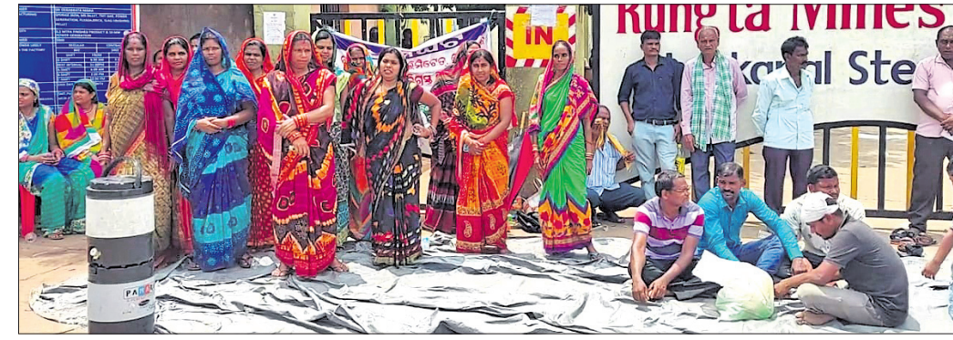
ରୁଜ୍ଜା ମାଲକ୍ ପାଟକ ସମ୍ମୁଖରେ ବିସ୍ମାଦିତମାନେ ଧାରଣା ଦେଇଛନ୍ତି।

୫୪ ବିସ୍ମାଦିତ ପରିବାରକୁ ଦିଆଯାଇଥିବା ପ୍ରତିଶ୍ରୁତି ପାଳନ ନ ହେବାରୁ ଏହାର ପ୍ରତିବାଦରେ ସମ୍ପୂର୍ଣ୍ଣ ଜମିହରା ପ୍ରଜାମାନେ ଯୋମବାର ସକାଳ ୮ଟା ବାଦ୍ ସମୟ ଧରି ଦେଈାନାଳ ଜିଲ୍ଲା ହିନ୍ଦୋଳ ବ୍ଲକ୍ ଚର୍ଚ୍ଚା ଅଞ୍ଚଳରେ ଥିବା ରୁଜ୍ଜା ମାଲକ୍ ଲିମିଟେଡ୍ ସ୍ଥଳ ପ୍ଲାଷ୍ଟିକ୍ ପାଟକ ସମ୍ମୁଖରେ ଧାରଣା ଦେଇଥିଲେ।