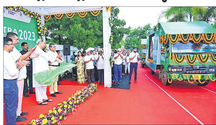
ପୁଞ୍ଜ୍ୟମନ୍ତ୍ରୀ ନବୀନ ପଟ୍ଟନାୟକ ଶ୍ଵର୍ଣ୍ଣଅପ୍ ଏକ୍ସପ୍ରେସ୍‌କୁ ପତାକା ଦେଖାଇ ଉଦ୍ଘାଟନ କରୁଛନ୍ତି।