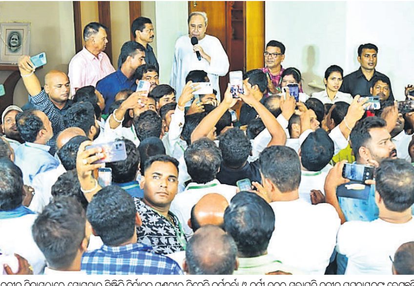
ନବୀନ ନିବାସରେ ଯୋଗଦାନ ହିଝିଲ ନିର୍ବାଚନ ମଣ୍ଡଳର ବିଜେଡି କର୍ମଚାରୀ ଓ କର୍ମୀଙ୍କ ସହିତ ନବୀନ ପଟ୍ଟନାୟକଙ୍କ ଭେତ୍ତିକା।

ପାଟଣା, ୧୧।୯ : ଲି-୨୦ରେ ରାଷ୍ଟ୍ରପତି ତ୍ରୌପତୀ ପୂର୍ଣ୍ଣିକା ଦ୍ୱାରା ଆୟୋଜିତ ନୈଶ ଭୋଜିରେ ବିହାର ମୁଖ୍ୟମନ୍ତ୍ରୀ ନୀତୀଶ କୁମାର ମଧ୍ୟ ଯୋଗଦେଇଥିଲେ। ଏପ୍ରସଙ୍ଗକୁ ନେଇ ପ୍ରଶଂସା କରାଯାଇ (ପିକେ) ନୀତୀଶଙ୍କୁ କହା ସମାଲୋଚନା କରିଛନ୍ତି। ନୀତୀଶଙ୍କୁ ଭାଙ୍ଗିପାକୁ ଏକ ବାର୍ତ୍ତା ଦେବାକୁ ଯାଇଥିଲେ ଯେ, ଯଦି ସେମାନେ ଗୁରୁତ୍ୱ ନ ଦିଅନ୍ତି ତଥାପି ଆମେ ମଧ୍ୟ ସେଠାକୁ ଯାଇପାରୁ। ଗତ ୮ ବର୍ଷ ମଧ୍ୟରେ ନୀତୀଶ ସେଠାକୁ ଯାଇ ନ ଥିଲେ। ସେ ଭାଙ୍ଗିପା ସହିତ ଥିବା ସମୟରେ ମଧ୍ୟ ଏପରି କରି ନ ଥିଲେ। ପ୍ରଶଂସା କରାଯାଇ କହିଛନ୍ତି, ନୀତୀଶ ଭାରି ଚତୁର। ତାଙ୍କର ରାଜନୀତି କରିବାର ନିଷ୍ପତ୍ତି ରଖିନାତି ଅଛି। ଗୋଟିଏ କବାଟ ଖୋଲା ରଖି ଉଭୟ ଝରକା ଏବଂ ଖାଏଲାଲଟ ପଛ ପଟରୁ ଖୋଲା ରଖିଛନ୍ତି। କେତେଦୈର୍ଘ୍ୟ କାଳେ କ'ଣ ଆବଶ୍ୟକ ହେବ। ତେଣୁ ସେ ନିଜର ରାୟ ଖୋଲା ରଖିଛନ୍ତି। ଇଝିଆ ମେଣ୍ଟ ହେଉଛି ନୀତୀଶଙ୍କ ଘର କବାଟ ଏବଂ ଝରକା ହେଉଛି ଏନ୍‌ଡିଏ ଯାହାର ରାଜ୍ୟସଭା ସଦସ୍ୟ ହେଉଛି ଚନ୍ଦ୍ରଶେଖର ନାରାୟଣ। ଚନ୍ଦ୍ରଶେଖରଙ୍କ ମାଧ୍ୟମରେ ସେ ଭାଙ୍ଗିପା ସହ ଯୋଗାଯୋଗରେ ଅଛନ୍ତି। କୋଠାକୁ ଆଲୋଚନା ଆସିବା ପାଇଁ ଆମେ ସ୍ଥାନ ସ୍ଥାପିବା ପରି ଏହା ଏକ ମେସେଜିଂ ଅଟେ। ଏହା ଭାଙ୍ଗିପା ଏବଂ ଏନଡିଏ ସଦସ୍ୟଙ୍କୁ ବାର୍ତ୍ତା ଦେଉଛି। କେହି ଜଣେ ନୀତୀଶ କୁମାରଙ୍କୁ ପଚାରିବା ଉଚିତ ସେ ଗତ ବର୍ଷ କାହିଁକି ଯାଇ ନ ଥିଲେ? ଏନ୍‌ଡିଏ ଲୋକଙ୍କ ଉପରେ ଗାପ ପକାଇବାର ଏହା ହେଉଛି ସେମାନଙ୍କର ଉଦ୍ଦେଶ୍ୟ। ଯଦି ଆପଣଙ୍କ ଲୋକମାନେ ଆମକୁ ଗୁରୁତ୍ୱ ଦିଅନ୍ତି ନାହିଁ ତେବେ ଆମେ ମଧ୍ୟ ସେଠାକୁ ଯାଇପାରୁ। ବିହାରରେ ନୀତୀଶ କୁମାରଙ୍କ ରାଜନୀତି ସମସ୍ତଙ୍କୁ ଜଣା ବୋଲି ପିକେ କହିଛନ୍ତି।