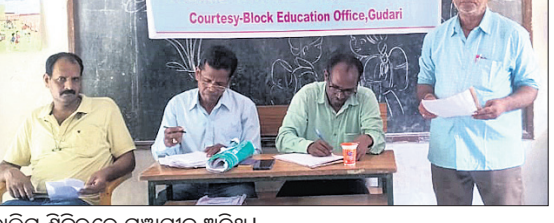
ଡାଲିନ ଶିବିରରେ ମଞ୍ଚାଧାର ଅଟେ ।

ରାୟଗଡ଼ା ଜିଲ୍ଲା କୁଡ଼ାରି ବ୍ଲକର କଳିନି ଉଚ୍ଚ ବିଦ୍ୟାଳୟରେ ଭିକ୍ଷଣ ଶିଶୁଙ୍କ ଅଭିଭାବକ ଓ ପ୍ରଧାନ ଶିକ୍ଷକଙ୍କ ନିମନ୍ତେ ଏକ ଡାଲିନ ଶିବିର ଯୋଜନା କରାଯାଇଛି।