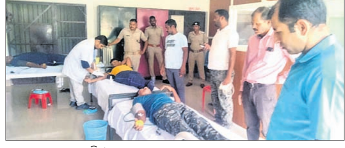
ରକ୍ତ ସଂଗ୍ରହ କରାଯାଇଛି । ନାରାୟଣପାଟଣା/ବନ୍ଧୁଗାଁ, ୧୧୯ (ରାଜକିଶୋର ଜେନା/ଅର୍ପିତ ଲହରୀ)

ନବରଙ୍ଗପୁର ଜିଲ୍ଲା ଡାକ୍ତା ଅବକାରୀ କୁଳ ଅଧୀନ ବୋରିଗାଁ ଗ୍ରାମ ଛକ ନିକଟରେ ଯୋଗାଯୋଗ ଅପରାହ୍ନରେ ବାଇକ୍ ଦୁର୍ଘଟଣା ଘଟି ଖଣେ ମୃତ୍ୟୁ ଆହତ ହୋଇଛନ୍ତି ।