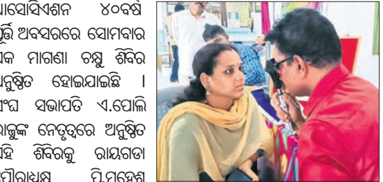
କର୍ମୀମାନଙ୍କୁ ଚନ୍ଦ୍ର ପରୀକ୍ଷା କରାଯାଇଛି ।

ରାୟଗଡ଼ା, ୧୧ (ଭାଗ୍ୟଶ୍ରୀ ଗ୍ରାମ) ରାୟଗଡ଼ା ଶ୍ରୀ ମାଟିଗିରି କାର୍ଯ୍ୟକ୍ରମ ଆୟୋଜନ କରାଯାଇଛି।