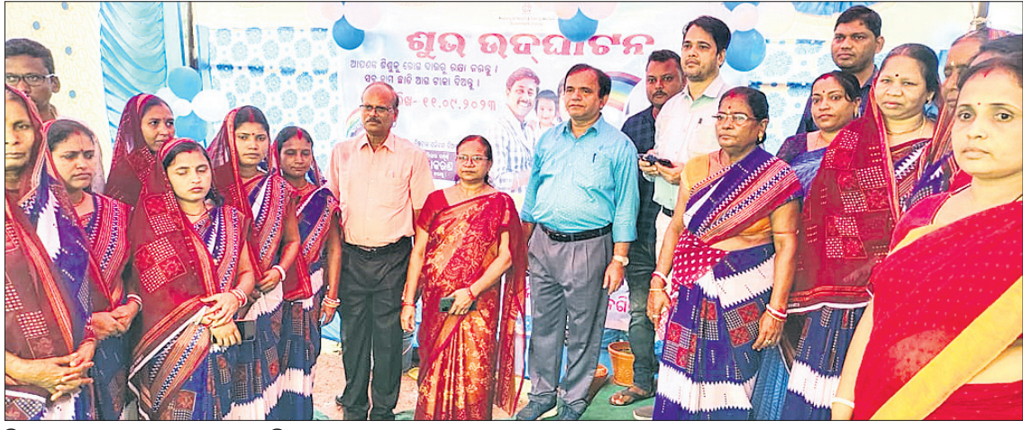
ମିଶନ ଇନ୍ଦ୍ରଧନୁସ୍ୱର ଶୁଭାରମ୍ଭ କରାଯାଇଛି ।

ମାଲକାନଗିରି, ୧୧ (ବୃହସ୍ପତି ଦିନ) ମାଲକାନଗିରି ଜିଲ୍ଲା ସ୍ୱାସ୍ଥ୍ୟ ବିଭାଗ ତରଫରୁ ଜିଲ୍ଲାସ୍ତରୀୟ ମିଶନ ଇନ୍ଦ୍ରଧନୁସ୍ୱର କାର୍ଯ୍ୟକ୍ରମ ମାଲକାନଗିରି ସହର ଏମ୍ଲି ୪୩ ଗ୍ରାମର ଆଜନିଆଁତି କେନ୍ଦ୍ରରେ ଯୋଜନା କରାଯାଇଛି।