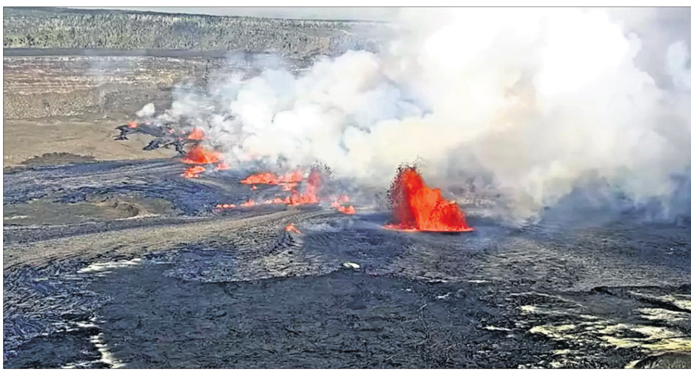
ଆମେରିକା ଭୂତାତ୍ମକ ସର୍ବେକ୍ଷଣ ସଂସ୍ଥା ପକ୍ଷରୁ ଜାରି ହୋଇଥିବା ବିଶ୍ୱର ସବୁଠୁ ସକ୍ରିୟ ଆଗ୍ନେୟଗିରିରୁ ଲାଭା ଉଦ୍ଗିରଣ ସମୟର ଫ୍ଲୋରାନ୍ସ ଛବି ଶବ୍ଦ।

ହାଇଦ୍ରାବାଦ, ୧୧: ଆନ୍ଧ୍ରପ୍ରଦେଶର ପୂର୍ବତନ ମୁଖ୍ୟମନ୍ତ୍ରୀ ତଥା ଚିତ୍ତିପି ଅଧ୍ୟକ୍ଷ ଏନ୍. ଚନ୍ଦ୍ରାବାବୁ ନାଲଗୁଲୁ ଦୁର୍ଗତି ମାମଲାରେ ସିଆଇଡି ଚିରଫ କରିବା ପରେ ଦଳର ସମସ୍ତ ୨୧ ବିଧାୟକଙ୍କୁ ଗୃହବନ୍ଦୀ ରଖାଯାଇଛି। ଆନ୍ଧ୍ର ବିଭିନ୍ନ ସହରରେ ଥିବା ସେମାନଙ୍କ ଘର ବାହାରେ ବ୍ୟାପକ ପୋଲିସ ଫୋର୍ସ ମୁତୟନ ହୋଇଛି। ଚନ୍ଦ୍ରାବାବୁଙ୍କ ଚିରଫଦାରି ପ୍ରତିବାଦରେ ଚିତ୍ତିପି ପକ୍ଷରୁ ସୋମବାର ରାଜ୍ୟବ୍ୟାପୀ ବନ୍ଦ ଘୋଷଣା ଦିଆଯାଇଥିବାବେଳେ ସହରଗୁଡ଼ିକରେ କଡ଼ା ସୁରକ୍ଷା ବ୍ୟବସ୍ଥା ଗ୍ରହଣ କରାଯିବା ସହ ଲୋକେ ଏକାଠି ନ ହେବା ଲାଗି ୧୪୪ ଧାରା ଜାରି ହୋଇଛି। ପୋଲିସ ବିଭିନ୍ନ ସ୍ଥାନରେ ଚଢ଼ାଉ କରି ବହୁସଂଖ୍ୟାରେ ଚିତ୍ତିପି ନେତାଙ୍କୁ ଅଟକ ରଖିଛି। ବହୁକୋଟି ଟଙ୍କା ଆନ୍ଧ୍ରପ୍ରଦେଶ ରାଜ୍ୟ ସମତା ବିକାଶ ନିଗମ ଦୁର୍ଗତି ମାମଲାରେ ସମ୍ପୂର୍ଣ୍ଣ ଚନ୍ଦ୍ରାବାବୁଙ୍କୁ ଶନିବାର ଚିରଫ କରାଯାଇଥିଲା। ତାଙ୍କୁ ୧୪ ଦିନ ପାଇଁ ବିଚାରବିଭାଗୀୟ ହାଜତକୁ ପଠାଇ ଦିଆଯାଇଛି।