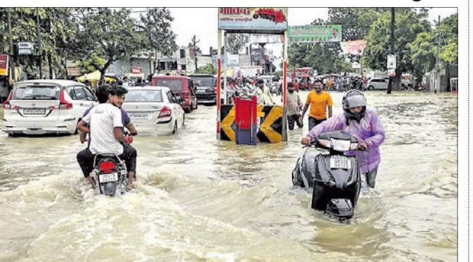
ପ୍ରବଳ ବର୍ଷା ଯୋଗୁ ଯୁପିର ବାରବାଟୀ ଜିଲାର ରାସ୍ତା ଜଳାଣି ହେଇଛି।

ଲକ୍ଷ୍ନୋ, ୧୧:୯: ବର୍ଷା ବିପ୍ଳବ ଯୋଗୁ ଉତ୍ତର ପ୍ରଦେଶରେ ଗତ ୨୪ ଘଣ୍ଟା ମଧ୍ୟରେ ୧୯ ଜଣଙ୍କ ମୃତ୍ୟୁ ଘଟିଛି ବୋଲି ରାଜ୍ୟ ଚିଲିଫ କମିଶନର କାର୍ଯ୍ୟାଳୟ ପକ୍ଷରୁ ଜଣାଯାଇଛି। ବଡ଼ପାତରୁ ୪ ଜଣଙ୍କ ମୃତ୍ୟୁ ଘଟିଥିବାବେଳେ ପାଣିରେ ବୁଡ଼ି ୨ ଜଣଙ୍କ ମୃତ୍ୟୁ ଘଟିଛି। ରାଜ୍ୟର ଆଭ୍ୟନ୍ତରଣ ଅଞ୍ଚଳରେ ପ୍ରବଳ ବର୍ଷା ହୋଇଥିବାରୁ ବିଭିନ୍ନ ଠାକୁରାଣୀମାନଙ୍କୁ ବ୍ୟାହତ ହୋଇଛି। ମୃତକଙ୍କ ମଧ୍ୟରେ ୪ ଜଣ ହାରଡି, ବରବାଲିକର ୩, ପ୍ରତାପଗଡ଼ ଓ କନୌଜର ୨ ଜଣ ଲେଖ୍ୟ ରହିଛନ୍ତି।