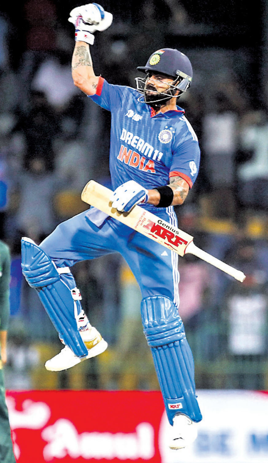
ଶତକ ହାସଲ ପରେ ଉଲ୍ଲସିତ ବିରାଟ କୋହଲି।

କ୍ୟାରିୟରର ୭ମ ଦିନିକିଆ ଶତକ ହାସଲ କରିଥିଲେ ନିର୍ଭରଯୋଗ୍ୟ ରାହୁଲ। ସେ ୧୦୬ ବଲରୁ ୧୧୧ (୧୨ ଚୋକା, ୨ ଛକା) ରନକରି ଅପରାଜିତ ରହିଥିଲେ। ପୂର୍ବଦିନ ପାକିସ୍ତାନ ପକ୍ଷରୁ ଶାହିନ ଶାହ ଆଫ୍ରିଦୀ ଓ ଶଦାବ ଖାଁ ଗୋଟିଏ ଲେଖାଏ ଉଇକେଟ ନେଇଥିଲେ। ସଂକ୍ଷିପ୍ତ ଷ୍ଟୋର ଭାରତ ୫୦ ଓଭରରେ ୩୫୭/୨ (ବିରାଟ କୋହଲି-୧୨୨*, ଲୋକେଶ ରାହୁଲ-୧୧୧*, ଶୁବମନ ଚିଲ-୫୮, ରୋହିତ ଶର୍ମା-୫୬, ଶାହିନ ଆଫ୍ରିଦୀ-୧/୬୯, ଶଦାବ ଖାଁ-୧/୬୧)।