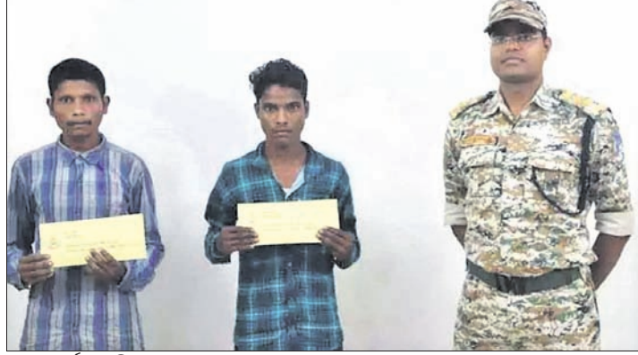
ଆତ୍ମସମର୍ପଣ କରିଥିବା ମାଓବାଦୀ । ସାମାଜିକ କର୍ମୀଙ୍କ ସାହାଯ୍ୟରେ ସମର୍ପଣ କରାଯାଇଥିଲା ।

ମାଲକାନଗିରି ଜିଲ୍ଲା ସୀମାନ୍ତ ଛତିଶଗଡ଼ ବିକାସ ପ୍ରକଳ୍ପରେ ଯୋଗଦାନ କରିଥିବା ୨ ଜଣ ମାଓବାଦୀ ସେମାନଙ୍କର ଆତ୍ମସମର୍ପଣ କରିଛନ୍ତି।