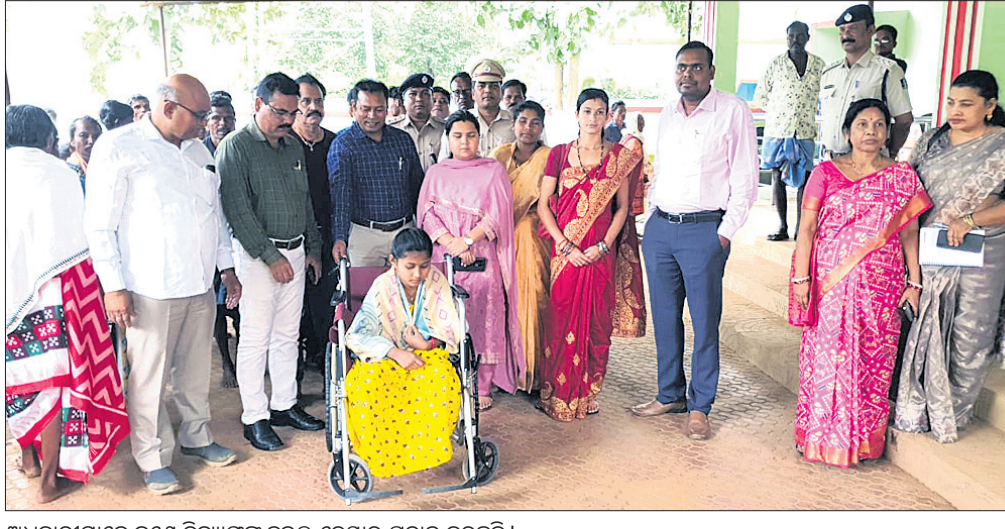
ଅଧିକାରୀମାନେ ଜଣେ ବିଦ୍ୟାଳୟକୁ ଛୁଇଁ ଦେଇ ପ୍ରଦାନ କରୁଛନ୍ତି ।

ଉତ୍କଳ ସମ୍ମିଳନୀ ପକ୍ଷରୁ ଆସନ୍ତା ୨୫ରେ ହେବାକୁ ଥିବା ରାଷ୍ଟ୍ରୀୟ କାର୍ଯ୍ୟକାରୀତା ବୈଠକ ତଥା ନବରଙ୍ଗପୁର ଜିଲ୍ଲା ସଂଗଠନ ବାର୍ଷିକ ଉତ୍ସବ ନିମନ୍ତେ ପ୍ରସ୍ତୁତି ବୈଠକ କରାଯାଇଛି ।