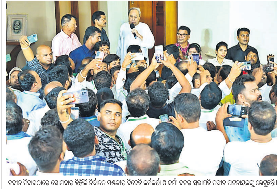
ନବୀନ ନିବାସରେ ଯୋଗଦାନ ହିଁ ନିର୍ବାଚନ ମଣ୍ଡଳୀ ବିଜେଡି କର୍ମକର୍ତ୍ତା ଓ କର୍ମୀ ଦଳର ସଭାପତି ନବୀନ ପଟ୍ଟନାୟକଙ୍କୁ ଭେଟୁଛନ୍ତି।

ପାଟଣା, ୧୧:୧୫ : ଲି-୨୦ରେ ରାଷ୍ଟ୍ରପତି ଦ୍ରୌପଦୀ ପୂର୍ଣ୍ଣିକା ଦ୍ୱାରା ଆୟୋଜିତ ନୈଶ ଭୋଜିରେ ବିହାର ମୁଖ୍ୟମନ୍ତ୍ରୀ ନୀତିଶ କୁମାର ମଧ୍ୟ ଯୋଗଦେଇଥିଲେ। ଏପ୍ରସଙ୍ଗକୁ ନେଇ ପ୍ରଶାନ୍ତ କିଶୋର (ପିକେ) ନୀତିଶଙ୍କୁ କଡ଼ା ସମାଲୋଚନା କରିଛନ୍ତି। ନୀତିଶଙ୍କୁ ଭାଜପାକୁ ଏକ ବାର୍ତ୍ତା ଦେବାକୁ ଯାଇଥିଲେ ଯେ, ଯଦି ସେମାନେ ଗୁରୁତ୍ୱ ନ ଦିଅନ୍ତି ତଥାପି ଆମେ ମଧ୍ୟ ସେଠାକୁ ଯାଇପାରୁ। ଗତ ୮ ବର୍ଷ ମଧ୍ୟରେ ନୀତିଶ ସେଠାକୁ ଯାଇ ନ ଥିଲେ। ସେ ଭାଜପା ସହିତ ଥିବା ସମୟରେ ମଧ୍ୟ ଏପରି କରି ନ ଥିଲେ। ପ୍ରଶାନ୍ତ କିଶୋର କହିଛନ୍ତି, ନୀତିଶ ଭାରି ଚତୁର। ତାଙ୍କର ରାଜନୀତି କରିବାର ନିକଟ ରଣନୀତି ଅଛି। ଗୋଟିଏ କବାଟ ଖୋଲା ରଖି ଉଭୟ ଝରକା ଏବଂ ଧ୍ୟାୟାଳୁତା ପଛ ପଛୁ ଖୋଲା ରଖିଛନ୍ତି। କେତେବେଳେ କାଳେ କ'ଣ ଆବଶ୍ୟକ ହେବ। ତେଣୁ ସେ ନିଜର ରାୟ ଖୋଲା ରଖିଛନ୍ତି। ଇଣ୍ଡିଆ ମେଟ ହେଉଛି ନୀତିଶଙ୍କ ଘର କବାଟ ଏବଂ ଝରକା ହେଉଛି ଏନ୍ଡିଏ ଯାହାର ରାଜ୍ୟସଭା ସଦସ୍ୟ ହେଉଛନ୍ତି। ହରିବଂଶ ନାରାୟଣ। ହରିବଂଶଙ୍କ ମାଧ୍ୟମରେ ସେ ଭାଜପା ସହ ଯୋଗାଯୋଗରେ ଅଛନ୍ତି। କୋଠାକୁ ଆଲୋକ ଆସିବା ପାଇଁ ଆମେ ଘ୍ଲାନ ଛାଡ଼ିବା ପରି ଏହା ଏକ ମେସେଜିଂ ଅଟେ। ଏହା ଭାଜପା ଏବଂ ଏନଡିଏ ସଦସ୍ୟଙ୍କୁ ବାର୍ତ୍ତା ଦେଉଛି। କେହି ଜଣେ ନୀତିଶ କୁମାରଙ୍କୁ ପଚାରିବା ଉଚିତ ସେ ଗତ ବର୍ଷ କାହିଁକି ଯାଇ ନ ଥିଲେ? ଏନ୍ଡିଏ ଲୋକଙ୍କ ଉପରେ ଗପ ପକାଇବାର ଏହା ହେଉଛି ସେମାନଙ୍କର ଉଦ୍ଦେଶ୍ୟ। ଯଦି ଆପଣଙ୍କ ଲୋକମାନେ ଆମକୁ ଗୁରୁତ୍ୱ ଦିଅନ୍ତି ନାହିଁ ତେବେ ଆମେ ମଧ୍ୟ ସେଠାକୁ ଯାଇପାରୁ। ବିହାରରେ ନୀତିଶ କୁମାରଙ୍କ ରାଜନୀତି ସମସ୍ତଙ୍କୁ ଜଣା ବୋଲି ପିକେ କହିଛନ୍ତି।