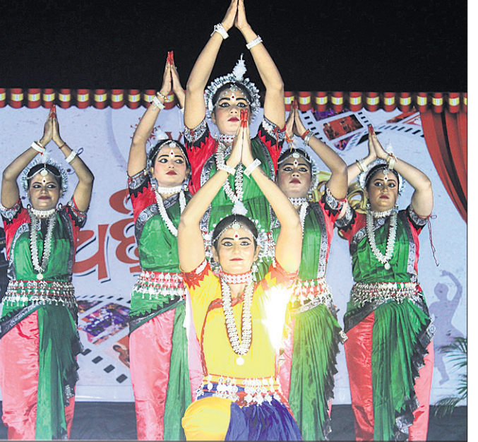
ଶିକ୍ଷୟିତ୍ରୀମାନେ ସାଂସ୍କୃତିକ କାର୍ଯ୍ୟକ୍ରମ ପରିବେଷଣ କରୁଛନ୍ତି ।