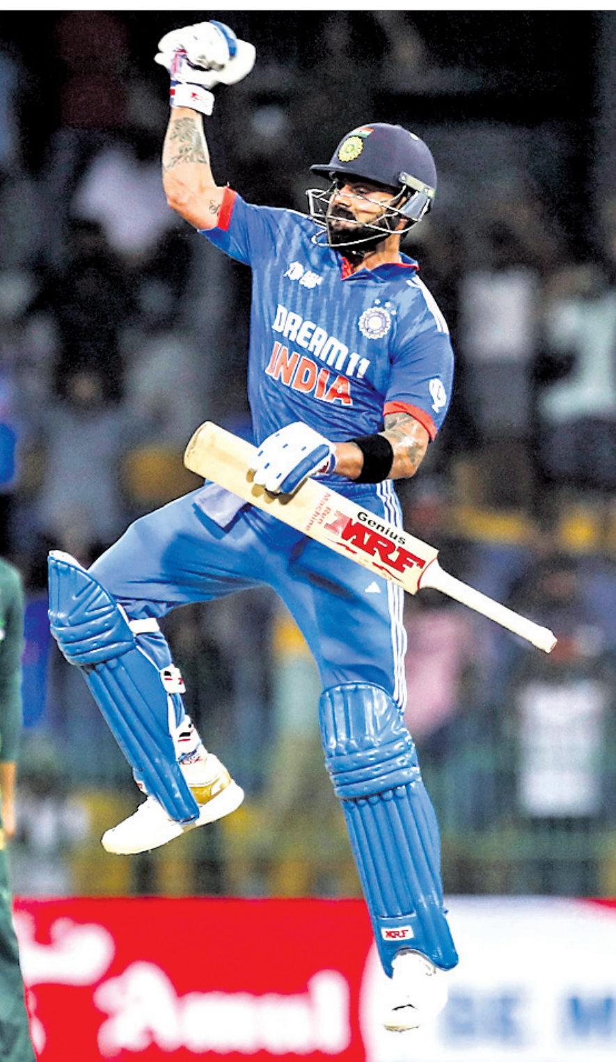
ଶତକ ହାସଲ ପରେ ଉଲ୍ଲାସିତ ବିରାଟ କୋହଲି।

ଭାରତର କ୍ରିକେଟ କିମ୍ବଦନ୍ତୀ ସଚିନ୍ ଡେବ୍ଡେଙ୍କୁ ରେକର୍ଡ ଭାଙ୍ଗିଛନ୍ତି କୋହଲି। ଡେବ୍ଡେଙ୍କର ୩୨୧୧ ଇନିଂସରେ ୧୩ ହଜାର ରନ୍ ପୁରଣ କରିଥିବା ବେଳେ କୋହଲି ୨୬୭ ତମ ଇନିଂସରେ ଏହି ସଫଳତା ହାସଲ କରିଛନ୍ତି। ବିଶ୍ୱର ପଞ୍ଚମ ଖେଳାଳି ଭାବରେ କୋହଲି ଅନ୍ତର୍ଜାତୀୟ ଦିନିକିଆରେ ୧୩ ହଜାର ରନ୍ ସମ୍ପୂର୍ଣ୍ଣ କରିଛନ୍ତି। ସଚିନ୍ ଡେବ୍ଡେଙ୍କର (୧୮,୪୨୬ ରନ୍), କୁମାର ସଙ୍ଗଙ୍କାରା (୧୪,୨୩୪ ରନ୍), ରିକି ପଣ୍ଡା (୧୩, ୭୦୪ ରନ୍) ଓ ସନଥ ଜୟପୁରିଆ (୧୩,୪୩୦ ରନ୍) ପୂର୍ବରୁ ୧୩ ହଜାର କ୍ଲବରେ ସୀମା ଅଛନ୍ତି।