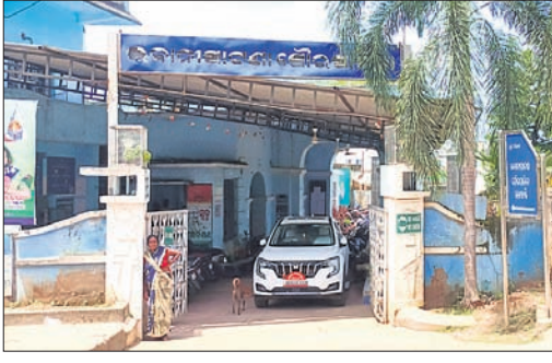
ଭବାନୀପାଟଣା ଚୌରପାଳିକା କାର୍ଯ୍ୟାଳୟ।

ଗୋଟେ ବର୍ଷ ଦୁଇ କି ୨ ବର୍ଷ ଦୁଇ ଦୀର୍ଘ ୭୨ ବର୍ଷର ଚୌରପାଳିକାର ନିଜସ୍ୱ କାର୍ଯ୍ୟାଳୟ ଗୃହ ନ ଥିବା ସାଧାରଣରେ ଏବେ ଚର୍ଚ୍ଚାର ବିଷୟ। ଚୌରପାଳିକା ସ୍ଥାପନରୁ ବର୍ତ୍ତମାନ ଯାଏଁ ରାଜୁଡ଼ା ଅମଳର ନିର୍ମିତ ଏକ କୋଠାରେ ରାଜିଛି ଏହି କାର୍ଯ୍ୟାଳୟ। ଯାହାକି ଏବେ ବିପଦସଙ୍କୁଳ ମିଳିଛି କଳାହାଣ୍ଡି ଜିଲ୍ଲା ଭବାନୀପାଟଣା ଚୌରପାଳିକାରେ। ଭବାନୀପାଟଣା ଚୌରପାଳିକା ୧୯୫୧ରେ ସ୍ଥାପନ ହୋଇଥିବାବେଳେ ବର୍ତ୍ତମାନ ଯାଏଁ ୩୫ଜଣ ଅଧ୍ୟକ୍ଷ/ଅଧ୍ୟକ୍ଷ ପଦବା ନିର୍ବାଚିତ ହୋଇଥିବା ଓ ଅଧିକାରୀ ଦାୟିତ୍ୱରେ ରହିଥିବା ସୂଚନା ଫଳକରୁ ଜଣାପଡିଛି। ରାଜ୍ୟର ପୁରାତନ ଚୌରପାଳିକାରେ ଭବାନୀପାଟଣା ସହର ନାମ ମଧ୍ୟ ରହିଛି। ଭବାନୀପାଟଣା ଚୌରପାଳିକାରେ ୨୦ଟି ଖର୍ଚ୍ଚ ରହିଥିବାବେଳେ ସହରର ଜନସଂଖ୍ୟା ପାଖାପାଖି ଚଳିତବର୍ଷର ରିପୋର୍ଟ ଅନୁଯାୟୀ ୯୦ ହଜାରରୁ ଚୋଲାଣି। ଗତ ଦିନରେ ଚୌରପାଳିକା ପକ୍ଷରୁ ସହରରେ ବିଭିନ୍ନ ଯୋଜନାରେ ଅନେକ ଉନ୍ନତିମୂଳକ କାର୍ଯ୍ୟ କରାଯିବା ସହ ଏଥିପାଇଁ କୋଟି କୋଟି ଟଙ୍କା ମଧ୍ୟ ଖର୍ଚ୍ଚ ହୋଇସାରିଲାଣି।