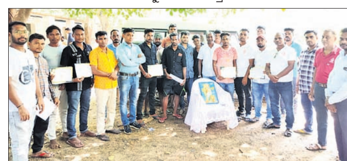
ରକ୍ତଦାନ ଶିବିରରେ ଉପସ୍ଥିତ ରକ୍ତଦାତା ଏବଂ ଆୟୋଜକ ।

ଭେଡ଼େନ, ୧୧।୯ (ସୁବର୍ଣ୍ଣ ମହାପାତ୍ର) ରକ୍ତ ସଂଗ୍ରହ କରାଯାଇଥିଲା । ଗ୍ରାମୀୟ ବରଗଡ଼ ଜିଲ୍ଲା ଭେଡ଼େନ ବ୍ଲକ ଅଭିଯୋଗ ପଞ୍ଚାୟତ ଅନ୍ତର୍ଗତ କେନ୍ଦ୍ରାପାଲିସ୍ଥିତ ରାଷ୍ଟ୍ରୀୟ ପୂର୍ଣ୍ଣାଙ୍ଗ ବିଦ୍ୟାଳୟ ପରିସରରେ ରବିବାର ପୂର୍ଣ୍ଣାଙ୍ଗ ବିଦ୍ୟାଳୟ ପରିସରରେ ରବିବାର ରକ୍ତଦାନ ଶିବିର ଅନୁଷ୍ଠିତ ହୋଇଯାଇଛି । ମାହେଶ୍ୱରୀ ସେନା ଓ କେନ୍ଦ୍ରାପାଲି ଗ୍ରାମବାସୀଙ୍କ ମିଳିତ ଆନୁକୂଲ୍ୟରେ ଆୟୋଜିତ ଶିବିରରେ ୩୨ ଯୁବକ ଏବଂ ଗ୍ରାମବାସୀ ସହଯୋଗ କରିଥିଲେ ।