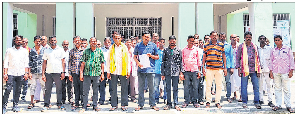
ଇଥାନଲ ପ୍ଲାଣ୍ଟକୁ ବିରୋଧ କରି ଜିଲ୍ଲାପାଳଙ୍କୁ ଫେରାଦ ହୋଇଥିବା ଗ୍ରାମବାସୀ ।

ବରଗଡ଼, ୧୧।୯ (ପ୍ରୋମାନନ୍ଦ ଖମ୍ବାରୀ) ବରଗଡ଼ ଜିଲ୍ଲା ବରଗଡ଼ ବ୍ଲକର ଏସ୍. ଭୂମେରପାଲି ଏବଂ ସୋହେଲା ବ୍ଲକ ଅନ୍ତର୍ଗତ ଲେବିଡ଼ି ପଞ୍ଚାୟତ ନିକଟରେ ନିର୍ମାଣାଧୀନ ଇଥାନଲ ପ୍ଲାଣ୍ଟକୁ ନେଇ ବିରୋଧ ତେଜି ଉଠିଛି । ଏହି କ୍ରମରେ ସୋମବାର ଅଞ୍ଚଳବାସୀ ଜିଲ୍ଲାପାଳଙ୍କୁ ଫେରାଦ ହୋଇଛନ୍ତି । ଜିଲ୍ଲାପାଳ ନୋମିନାଟି ବାମନାକା ଉଦ୍ଦେଶ୍ୟରେ ତାଙ୍କ କାର୍ଯ୍ୟକ୍ରମରେ ଗ୍ରାମବାସୀ ସ୍ୱାଭିକାନ୍ତ ପ୍ରଦାନ କରିଛନ୍ତି । ସେଠାରେ ଇଥାନଲ ପ୍ଲାଣ୍ଟ ନିର୍ମାଣ ପାଇଁ ସ୍ୱୀକୃତି ନ ଦେବା ପାଇଁ ଅଞ୍ଚଳବାସୀ ଜିଲ୍ଲାପାଳଙ୍କୁ ନିବେଦନ କରିଛନ୍ତି । ପ୍ରକାଶ ଯେ, ଲେବିଡ଼ି ପଞ୍ଚାୟତର ଭାତବିଡ଼ା, ଚେପଟିବାହାଲ ନିକଟରେ ଏକ ଇଥାନଲ ପ୍ଲାଣ୍ଟ ନିର୍ମାଣାଧୀନ ରହିଛି । ପ୍ଲାଣ୍ଟ ଯେଉଁଠାରେ ନିର୍ମାଣ କରାଯାଉଛି,