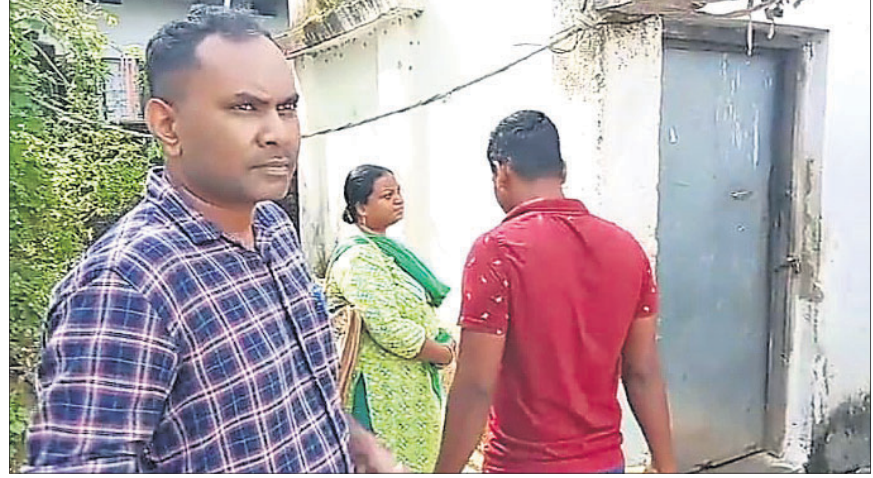
ମୃତକଙ୍କ ଘରେ ସାଇଡିଂ ଚିମ୍ନ ଛାନଭିନ୍ନ କରୁଛି।