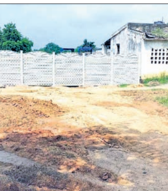
ନିର୍ମାଣାଧୀନ ଇଥାନଲ ପ୍ଲାଣ୍ଟ ।

ସେହି ଗ୍ରାମ ନିକଟରେ ଏସ୍. ଭୂମେରପାଲି, ବନବାସପାଲି, ନୂଆପାଲି, ଛତାପଥର, ପିପିଲିପାଲି, ସୋହୋପାଲି, ସାଲେପାଲି, ଭାତବିଡ଼ା, ଲେବିଡ଼ି, ଚେପଟିବାହାଲ, କୁଲିତାଡ଼ିଆ ଆଦି ଗ୍ରାମ ରହିଛି । ସେହି ଗ୍ରାମ ଉପରୋକ୍ତ ଗ୍ରାମଗୁଡ଼ିକରୁ ମାତ୍ର ଅଧ କି.ମି.ରୁ ୨ କି.ମି ଦୂରତା ମଧ୍ୟରେ ରହିଛି । ଜନବସତି ଅଞ୍ଚଳରେ ତାହା ନିର୍ମାଣ କରାଯାଉଥିବା ଯୋଗୁ ପ୍ଲାଣ୍ଟର କୁପ୍ରଭାବ ଗ୍ରାମବାସୀ ଲୋକଙ୍କ ଉପରେ ପଡ଼ିବ ବୋଲି ଗ୍ରାମବାସୀ ଅଭିଯୋଗ କରିଛନ୍ତି । ସେହିପରି ଉକ୍ତ ଇଥାନଲ ପ୍ଲାଣ୍ଟ ନିର୍ମାଣ ପୂର୍ବରୁ ଅଞ୍ଚଳବାସୀଙ୍କୁ ନେଇ କୌଣସି ଜନଶୁଣାଣୀ ହୋଇ ନ ଥିବା ଗ୍ରାମବାସୀ କହିଛନ୍ତି । ବିନା ଜନଶୁଣାଣୀ