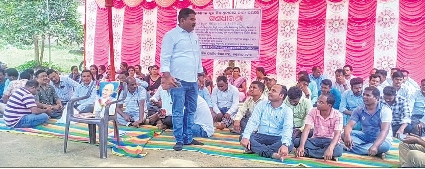
ବୌଦ୍ଧ ଜିଲ୍ଲା କର୍ମାଳୟ ମିଳିତ ପ୍ରାଥମିକ ଶିକ୍ଷକ ସଂଘ ପକ୍ଷରୁ ଶିକ୍ଷକମାନେ ଧାରଣା ଦେଇଛନ୍ତି ।