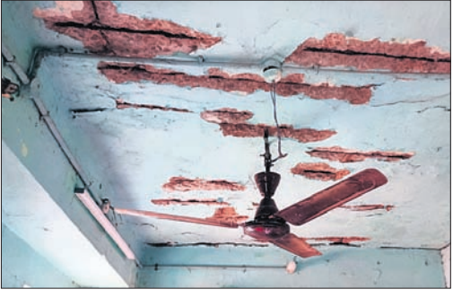
ଛାତରୁ ସମିଷ୍ଟ ଖଣ୍ଡ ପଡିଯାଇ ରତନୁତିକ ଦେଖାଯାଉଛି।

ହେଲେ ଏହି ୭୨ ବର୍ଷର ଚୌରପାଳିକା ବର୍ତ୍ତମାନ ଯାଏଁ ନିଜସ୍ୱ କୋଠା ନ ହୋଇପାରିବା କୁହା ଓ ପରିତାପର ଦିନରେ ଚୌରପାଳିକା ପକ୍ଷରୁ ସହରରେ ବିଭିନ୍ନ ଯୋଜନାରେ ଅନେକ ଉନ୍ନତିମୂଳକ କାର୍ଯ୍ୟ କରାଯିବା ସହ ଏଥିପାଇଁ କୋଟି କୋଟି ଟଙ୍କା ମଧ୍ୟ ଖର୍ଚ୍ଚ ହୋଇସାରିଲାଣି।