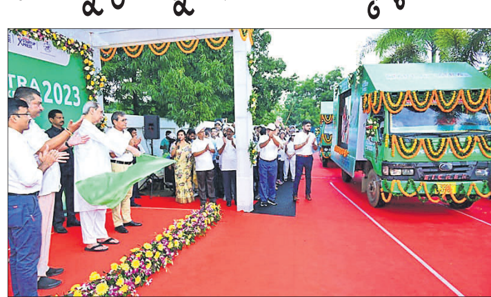
ପୁଞ୍ଜ୍ୟମନ୍ତ୍ରୀ ନବୀନ ପଟ୍ଟନାୟକ ଶ୍ଵର୍ଣ୍ଣଅପ୍ ଏକ୍ସପ୍ରେସ୍‌କୁ ପତାକା ଦେଖାଇ ଉଦ୍ଘାଟନ କରୁଛନ୍ତି।