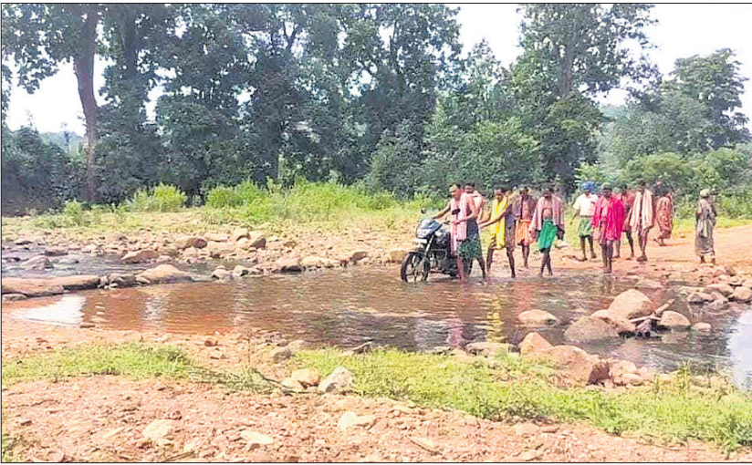
ନାଳକୁ ପାର ହେଉଛନ୍ତି ଛାତ୍ରାଛାତ୍ରୀ ଓ ଗ୍ରାମବାସୀ।