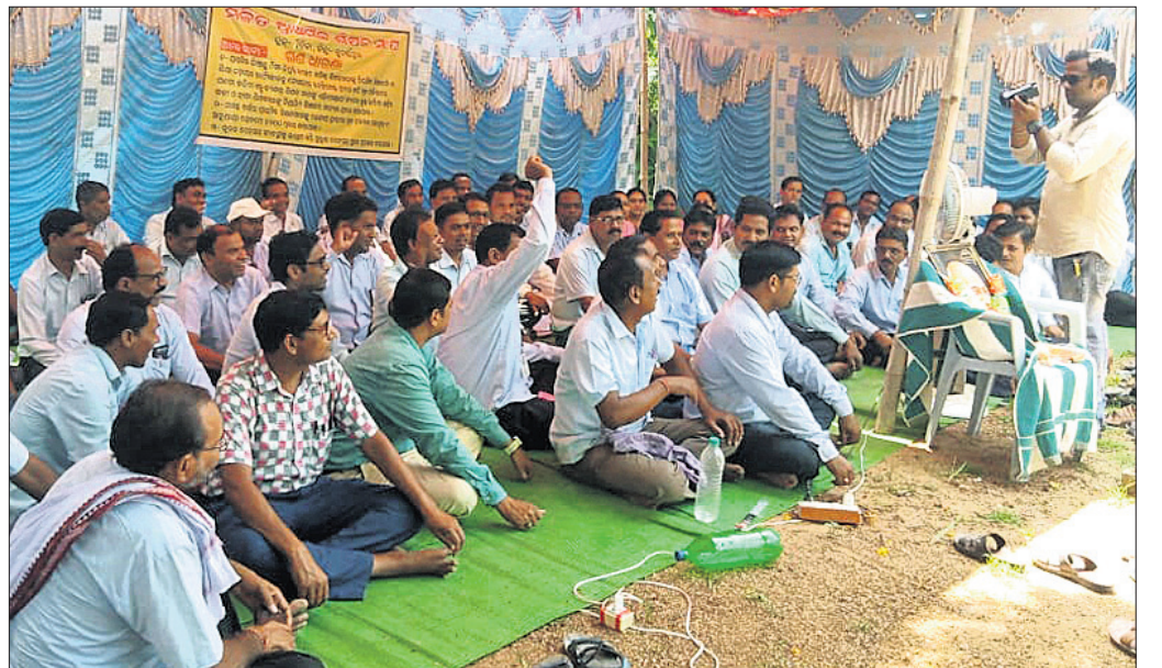
ଗୋଷ୍ଠୀ ଶିକ୍ଷା ଅଧିକାରୀଙ୍କ କାର୍ଯ୍ୟାଳୟ ସମ୍ମୁଖରେ ଗଣଧାରଣା ଦିଆଯାଇଛି।