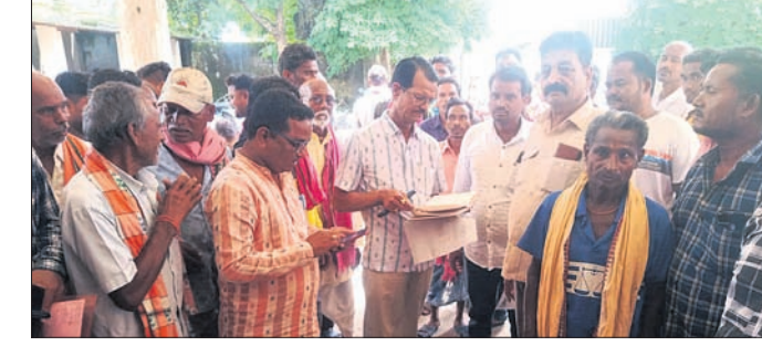
ତରଭା ତହସିଲଦାରଙ୍କୁ ଲିଖିତ ଅଭିଯୋଗ କରୁଛନ୍ତି ଗ୍ରାମବାସୀ।