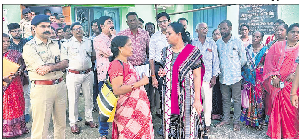
ଅଭିଯୋଗ ଶୁଣାଣୀ ଅବସରରେ ଜିଲ୍ଲାପାଳ, ସର୍ବସି ଏବଂ ଅନ୍ୟମାନେ ।