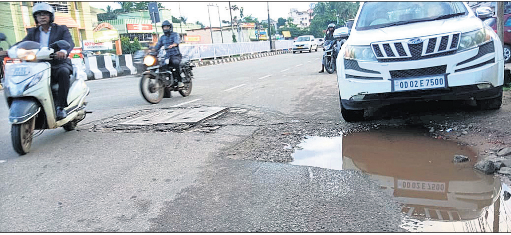
କଟକ ରୋଡ୍ ଲକ୍ଷ୍ମୀସାଗର ଛକ ନିକଟ ରାସ୍ତାରେ ହୋଇଥିବା ଖାଲ।

ଖାଲଖାମାରେ ଭରି ହେବାରେ ଲାଗିଛି ସ୍ମାର୍ଟସିଟି ଭୁବନେଶ୍ୱର। ସୁଆଡେ ଦେଖିବା ପାଇଁ ଖାଲ ଖୋଳିବା ପାଇଁ ସହରକୁ ଖୋଳି ପୋତି ଛାରଖାର କରି ଦେଇଥିବାବେଳେ ମୌସୁମୀ ବର୍ଷା ରାସ୍ତା ଅବସ୍ଥାକୁ ବିଗାଡିଦେଇଛି। ଠିକ୍ ସମୟରେ ମରାମତି ହେଉ ନ ଥିବାରୁ ଛୋଟ ଖାଲ ବଡ଼ବଡ଼ ଗାଡ଼ରେ ପରିଣତ ହୋଇ ସହରବାସୀଙ୍କ ପାଇଁ ମରଣଯନ୍ତ୍ରୀ ପାଲଟିଛି। କଟକ ରୋଡ୍, ଝାରପଡ଼ା, ଶହୀଦନଗର, ସତ୍ୟନଗର, ବମିଖାଲ, ପକାଶୁଣୀ ଭଳି ସହରର ଅଧିକାଂଶ ସ୍ଥାନର ସ୍ଥିତି ସାମାଜିକ ରହିଛି। ପ୍ରତିଦିନ ଶହ ଶହ ଗାଡ଼ି ମୋଟର ସମ୍ପୂର୍ଣ୍ଣ ରାସ୍ତା ଦେଇ ଯାଉଥିବାବେଳେ ବିଭିନ୍ନ ସମସ୍ୟାର ସମ୍ମୁଖୀନ ହେଉଛନ୍ତି। ବର୍ଷାପାଣିରେ ଖାଲଖାମା କିଛି ଜଣା ପଡୁନାହିଁ। ଫଳରେ ଅନେକ ସମୟରେ ଦୁର୍ଘଟଣା ହେଉଛି। ଚଳିତ ମାସ ୧୨ରେ ବିଶ୍ୱକର୍ମା ପୂଜା ଥିବାବେଳେ ୧୯ରେ ବିଶ୍ୱବିନାଶକ ଗଜାନନଙ୍କ ପୂଜା। ପୁଣି ଆଗକୁ ରହିଛି ପାର୍ବଣ ଋତୁ। ସାଧାରଣତଃ ଭୁବନେଶ୍ୱରର ବିଭିନ୍ନ ରାସ୍ତାରେ ଗ୍ରୀଷ୍ମ