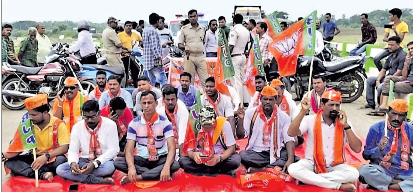
ଗୋପ- ବେଶୀପୁର ନଦୀବନ୍ଧ ରାସ୍ତା ମରାମତି ଦାବିରେ ମଙ୍ଗଳବାର ଭାଙ୍ଗି ପାସରୁ କୃଷିଭଦ୍ରା ନଦୀ ତ୍ରିକ୍ ଉପରେ ରାସ୍ତା ଅବରୋଧ କରାଯାଇଛି ।