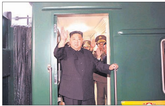
ଏକ ଘରୋଇ ଟ୍ରେନ୍‌ରେ ରୁଷିଆ ଭିଜିଟିଂ ଯାତ୍ରା ଆରମ୍ଭ କରିଥିଲେ ଡାକ୍ତରୀ ସହକେତେକ ଶ୍ରୀମତୀ ଓ ସାମରିକ ଅଧିକାରୀ

ଅଧିକାରୀ ଟ୍ରେନ୍‌ରେ ଯାଇଛନ୍ତି। ମଙ୍ଗଳବାର ସକାଳେ ସେମାନେ ରୁଷିଆର ଖସାନ୍‌ରେ ଘାମାୟ ଅଧିକାରୀମାନଙ୍କୁ ଭେଟିଛନ୍ତି। କିମ୍ କମ୍ପାନୀର ଅଧିକାରୀ ପରେ ୧୨ ବର୍ଷ ମଧ୍ୟରେ ମାତ୍ର ୭ ଥର ବିଦେଶ ଗସ୍ତ କରିଛନ୍ତି। ସେଥିରୁ ୪ ଥର କେବଳ ଡାକ୍ତରୀ ଯାଇଛନ୍ତି। ରୁଷିଆର ଯୁକ୍ତେନ ଆକ୍ରମଣ ପରେ ପାଶ୍ଚାତ୍ୟ ବିରୋଧରେ ମସୋ ଓ ପୋଲ୍ୟାକ୍‌ଙ୍କୁ କିମ୍ ସହାୟ ଗସ୍ତ ଆହୁରି ନିକଟତର କରିବ ବୋଲି କୁହାଯାଇଛି।