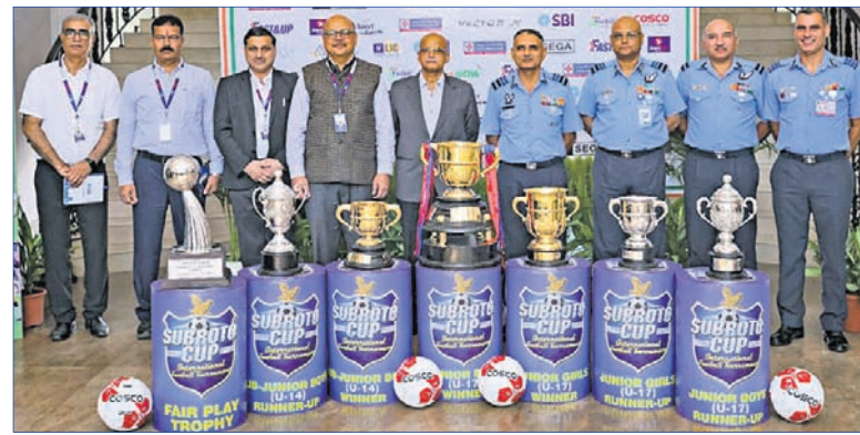
ସୁନ୍ଦର କପ୍ ଟ୍ରଫି ସହ ଅତିଥି ଓ କର୍ମଚାରୀ।

ସୁନ୍ଦର କପ୍ ଲକ୍ଷ୍ମଣନାମାଗଣାଲି ପୁରସ୍କାର ପାଇଁ ଆୟୋଜକ ସହର ତାଲିକାରେ ବେଙ୍ଗାଳୁରୁ ସାମିଲ କରାଯାଇଛି।