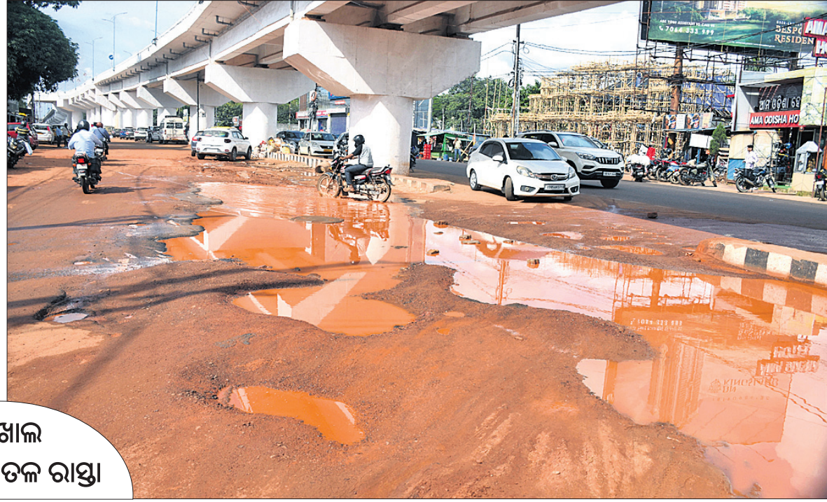
ବମିଖାଲ ଓଭରବ୍ରିଜ୍ ତଳ ରାସ୍ତା