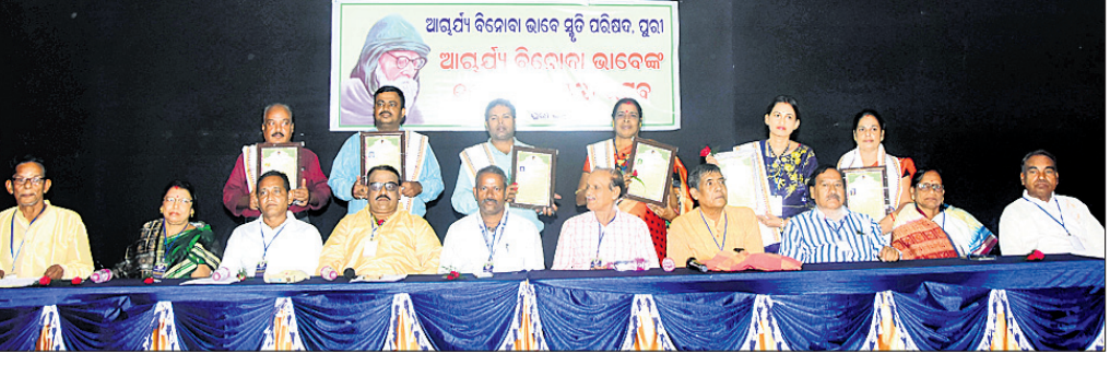
ଆଲୋଚନାଚକ୍ରରେ ସମ୍ମାନିତ ବ୍ୟକ୍ତିଙ୍କ ସହ ମଞ୍ଚାସନ ଅତିଥି ।