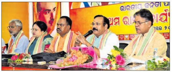
କୃଷକ ମୋର୍ଚ୍ଚାର ରାଜ୍ୟ କାର୍ଯ୍ୟକାରୀତା ବୈଠକରେ ଯୋଗଦେଇଥିବା ନେତୃତ୍ୱ ।

ଭୁବନେଶ୍ୱର, ୧୩୯ (ପୁନିତ ମିଶ୍ର): ଭାରତୀୟ କୃଷକ ମୋର୍ଚ୍ଚାର ରାଜ୍ୟ କାର୍ଯ୍ୟକାରୀତା ବୈଠକର ଉଦ୍ଦେଶ୍ୟ ହେଉଛି କୃଷକମାନଙ୍କର ସୁବିଧା ସୁଧାର କରିବା ।