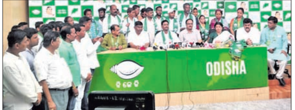
ଶ୍ରୀ ଜନମେଣ୍ଡାରେ ବୁଧବାର ମିଶ୍ରଣ ପର୍ବରେ ଦକାଈ ନେତୃତ୍ୱର ସହ ବିଜେଡିରେ ଯୋଗଦେଇଥିବା କର୍ମଚାରୀମାନଙ୍କର ନିର୍ବାଚନପତ୍ର ଗ୍ରହଣ କରାଯାଇଛି ।

ଭୁବନେଶ୍ୱର, ୧୩୯ (ଅନିଲ ଦାସ): ଗଞ୍ଜାମ ଜିଲ୍ଲା କର୍ମଚାରୀମାନଙ୍କର ନିର୍ବାଚନପତ୍ର ଗ୍ରହଣ କରାଯାଇଛି ।