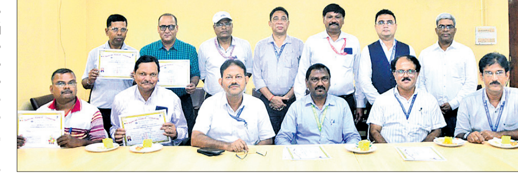
ପୁରସ୍କୃତ ଅଧିକାରୀ ଓ କର୍ମଚାରୀମାନଙ୍କର ସହ ଅତିଥି ।

ରାଉରକେଲା, ୧୩୯ (ବିସୁବ ରଞ୍ଜନ ଦାଶ) ରାଉରକେଲା ସହର କୋଏଲ ନଗରସ୍ଥିତ ଏ ଲୁକ୍ ପୂଜା କମିଟି ତରଫରୁ ପ୍ରତିବର୍ଷ ଭଳି ସାର୍ବଜନୀନ ପୂର୍ବାପୂଜା ପାଳନ ନିମନ୍ତେ ନୂତନ ପୂଜା କମିଟି ଗଠନ ହେବା ସହ କମିଟି ନାମ ଚାଲିଲା ଯୋଗିତ ହୋଇଯାଇଛି ।