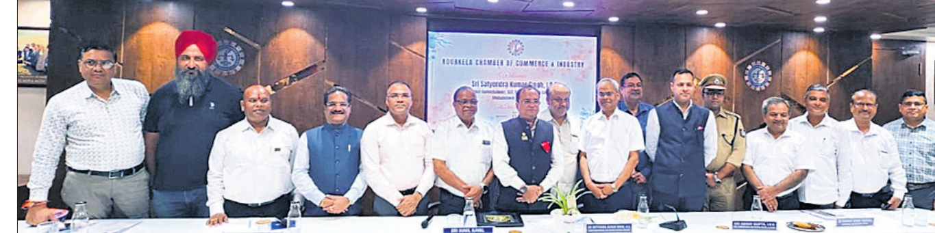
ରାଉରକେଲା ଟ୍ୟାମର ଅର୍ଡ଼ କମର୍ସ ସମ୍ମିଳନୀ କକ୍ଷରେ କେନ୍ଦ୍ର ଓ ରାଜ୍ୟର ସେବା କର ସମ୍ପର୍କିତ କର୍ମଶାଳାରେ ମଞ୍ଚାସୀନ ଅତିଥି ।