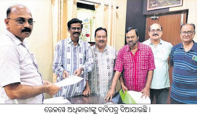
ରେଲୱେ ଅଧିକାରୀଙ୍କୁ ଦାବିପତ୍ର ଦିଆଯାଇଛି।