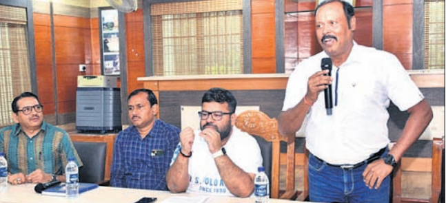
ବୈଠକରେ ସାମିଲ ଥିବା ଅଧିକାରୀ, ଜନପ୍ରତିନିଧି ।

ରାଉରକେଲା, ୧୩୯ (ବିସୁବ ରଞ୍ଜନ ଦାଶ) ବୀରମିତ୍ରପୁର ନୂତନ ଟାଉନ ପ୍ଲାନିଂକୁ ନେଇ ରୁଧିବାର ଏକ ଗୁରୁତ୍ୱପୂର୍ଣ୍ଣ ବୈଠକ ଆରମ୍ଭିତ ।