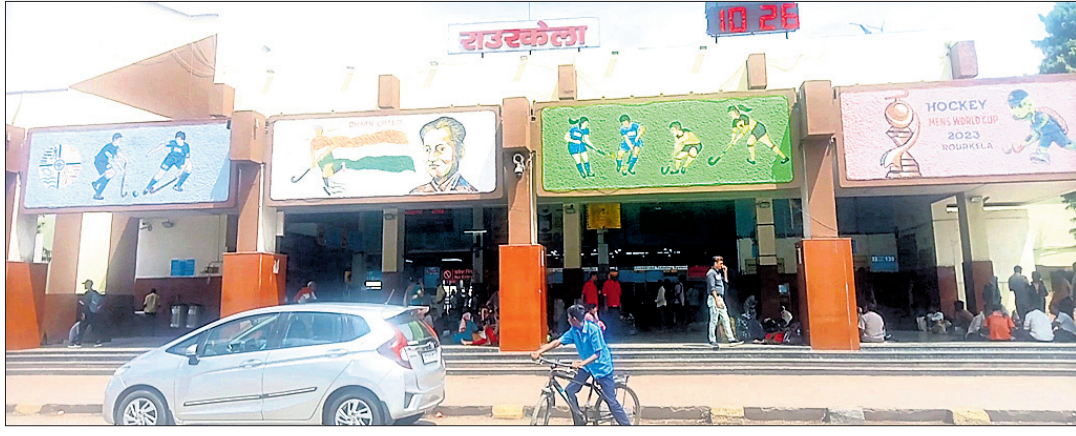
ରାଉରକେଲା ରେଳଷ୍ଟେସନ ।

୧୮୭ ଗ୍ରାହ୍ୟ ଟେକ୍ନିସିଆନ ଓ ଆପ୍ରେଣ୍ଟିସ ପ୍ରଶିକ୍ଷାର୍ଥୀମାନଙ୍କ ଦକ୍ଷତା ବିକାଶ କର୍ମଶାଳା