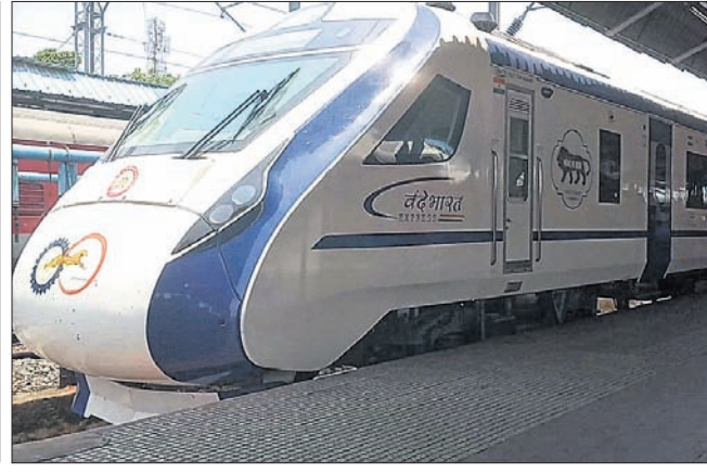
ଗ୍ରାଧିକାରୀଙ୍କୁ ବନ୍ଦେ ଭାରତ ଏକ୍ସପ୍ରେସ ।

କାମରେ ଯାଇଥିବା ଠିକା କର୍ମଚାରୀଙ୍କ ମୃତଦେହ ଜବତ ରାଉରକେଲା, ୧୩୯ (ବିସୁବ ରଞ୍ଜନ ଦାଶ) ରୁଧିବାର ଆରବ୍‌ସି କୋକ ଓଭେନ ବ୍ୟାଚେରା ନମ୍ବର-୬ ନିକଟସ୍ଥ ଡ୍ରେନରୁ ଜବତ ଠିକା କର୍ମଚାରୀଙ୍କ ମୃତଦେହ ଜବତ କରିଛି ଗଞ୍ଜାମ ପାଲି ପୋଲିସ ।