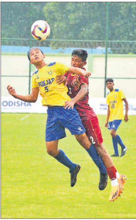
ବି.ସି. ରୟ ଟ୍ରଫି ଜାତୀୟ କ୍ରୀଡ଼ା କ୍ରୀଡ଼ାଳୟରେ ଫୁଟବଲ ଟୁର୍ଣ୍ଣାମେଣ୍ଟରେ ରୁଧିରାଣି ଖେଳାଳି-ଉତ୍ତମ ପ୍ରଦେଶ ଏବଂ ପଞ୍ଜାବ-ବେଙ୍ଗାଳ ମଧ୍ୟରେ ଅନୁଷ୍ଠିତ ସେମିଫାଇନାଲର ସଂଘର୍ଷପୂର୍ଣ୍ଣ ମୁହୂର୍ତ୍ତ।