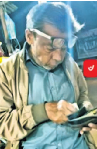
ବନ୍ଦ ଘରୁ ଡାକ୍ତରଙ୍କ ଗଳିତ ମୃତଦେହ ଜବତ