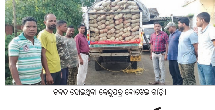
ଜବତ ହୋଇଥିବା କେନ୍ଦୁପତ୍ର ବୋଝେଇ ଗାଡ଼ି।

ରେଡ଼ାଖୋଲ, ୧୩୯(ଅରୁଣାଚଳ ପୁରୋହିତ): ରେଡ଼ାଖୋଲ ବନଖଣ୍ଡ ବନ୍ଦନା ରେଖା କର୍ମଚାରୀ ରୁପବାର କେନ୍ଦୁପତ୍ର ବୋଝେଇ ଏକ ପିକ୍ଅପ୍ ଭ୍ୟାନ ଜବତ କରିଛନ୍ତି।