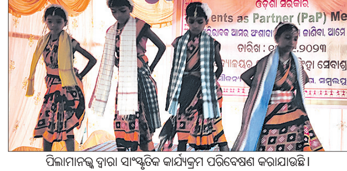
ପିଲାମାନଙ୍କୁ ଦ୍ୱାରା ସାଂସ୍କୃତିକ କାର୍ଯ୍ୟକ୍ରମ ପରିବେଷଣ କରାଯାଇଛି।

ନାକଟିଦେଉଳ, ୧୩୯(ବୈକୁଣ୍ଠ ନାଥ ସାହୁ): ନାକଟିଦେଉଳ ବ୍ଲକ୍ ବଳମ ପଞ୍ଚାୟତ ବଲାଙ୍ଗିରୀରେ ଅଭିଭାବକ ଜନକାଠି ଓ କାଠି ଉତ୍ତର ବିଭାଗ ପରିଚାଳିତ ଆଶ୍ରମ ସ୍କୁଲରେ ରୁପବାର ଅଭିଭାବକ ଆମର ଅଂଶଦାନ କାର୍ଯ୍ୟକ୍ରମ ଅନୁଷ୍ଠିତ ହୋଇଯାଇଛି।