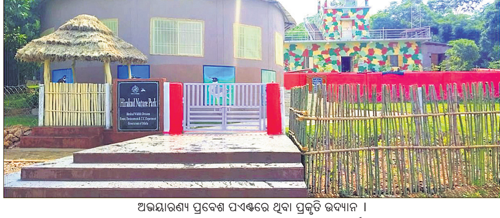
ଅଭୟାରଣ୍ୟ ପ୍ରବେଶ ପଥରେ ଥିବା ପ୍ରକୃତି ଭବ୍ୟାନ ।

ସମ୍ବଲପୁର, ୧୩୯(ଶୁଭାଶିଷ ପାଠ୍ୟ): ପର୍ଯ୍ୟଟକଙ୍କୁ ଆକୃଷ୍ଟ କରିବା ପାଇଁ ସମ୍ବଲପୁର ତେନ୍ଦୁଗଡ଼ ଅଭୟାରଣ୍ୟକୁ ବନ ବିଭାଗ ବିକଶିତ କରିଥାଉଛି। ଏହି କ୍ରମରେ ଅଭୟାରଣ୍ୟର ପ୍ରବେଶ ପଥ ଗୋବିନ୍ଦପୁରଠାରେ ହାରାକୁଦ ପ୍ରକୃତି ଭବ୍ୟାନ ରୁପବାର ଲୋକାର୍ପଣ ହୋଇଛି।