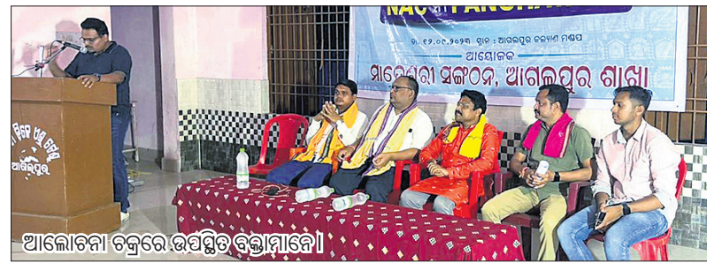
ଆଲୋଚନାଚକ୍ରରେ ଉପସ୍ଥିତ ବ୍ୟକ୍ତିମାନେ।

କଳାଜୀର ଜିଲ୍ଲା ଖପ୍ରାଖୋଲ ଗୋଷ୍ଠୀ ସ୍ୱାସ୍ଥ୍ୟକେନ୍ଦ୍ର ସଭା ଗୃହରେ ରୋଗୀ କଲ୍ୟାଣ ସମିତି ବୈଠକ ରୁପବାର ଅନୁଷ୍ଠିତ ହୋଇଯାଇଛି।