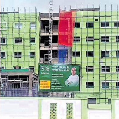
ଯଯାତି କେଶରୀ ମେଡିକାଲ କଲେଜ ନାମକୁ ସ୍ୱୀକୃତି ମିଳିଲା