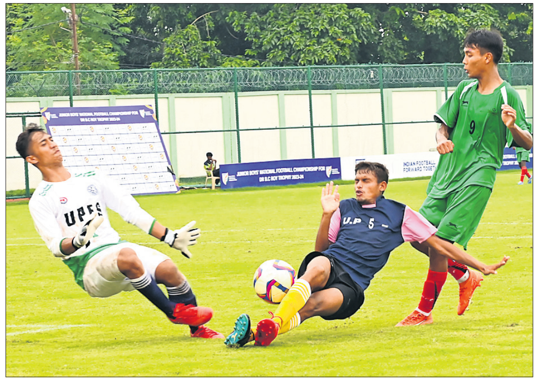
ବି.ସି. ରୟ ଟ୍ରଫି ଜାତୀୟ କ୍ରୀଡ଼ା ମୁକ୍ତିକଳା କ୍ରୀଡ଼ାମେଳଣରେ ଭୁବନେଶ୍ୱରର ଖିଡ଼ାଖେଳ-ଉତ୍ତର ପ୍ରଦେଶ ଏବଂ ପଞ୍ଜାବ-ବେଙ୍ଗାଳ ମଧ୍ୟରେ ଅନୁଷ୍ଠିତ ସେମିଫାଇନାଲର ସଂଘର୍ଷପୂର୍ଣ୍ଣ ମୁହୂର୍ତ୍ତ।