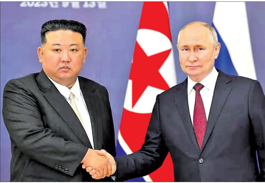
ରୁଷିଆର ଭୋଷ୍ଟେର୍ନରେ ରାଷ୍ଟ୍ରପତି ଭାବେ ପୁଟିନ୍‌ଙ୍କ ସହ ହାତ ମିଳାଇଛନ୍ତି ଉତ୍ତର କୋରିଆ ଶାସକ କିମ୍ ଜଙ୍ଗ୍ ଉନ୍ (ବାମ)।

୧୯୫୦-୫୩ର କୋରୀୟ ଯୁଦ୍ଧ ବେଳେ ଦକ୍ଷିଣ କୋରିଆ ଉପରେ ଉତ୍ତର କୋରିଆ ଆକ୍ରମଣ କରିଥିଲା। ସେହି ସମୟରେ ଯୋଗାଣଦେଇଥିଲା।