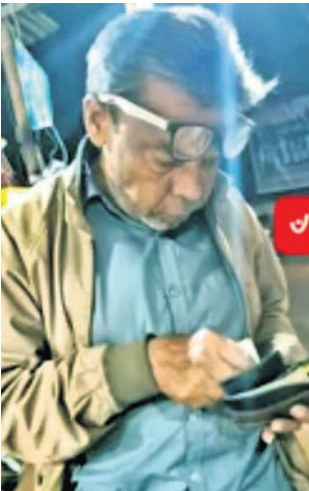
ବନ୍ଧୁ ଡାକ୍ତରଙ୍କ ଗଳିତ ମୃତଦେହ ଜବତ