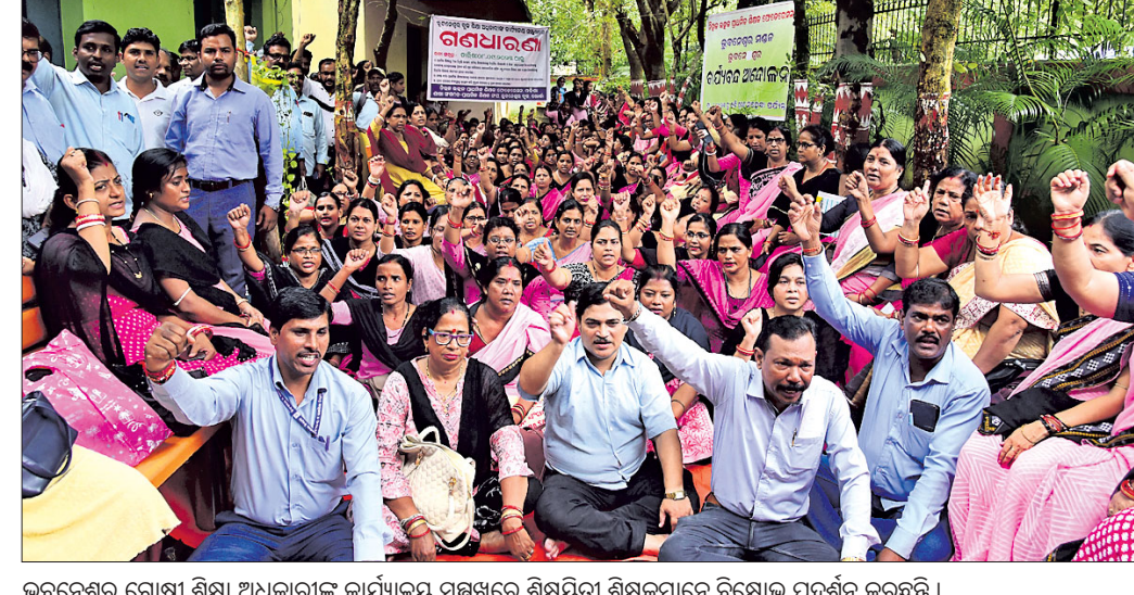
ଭୁବନେଶ୍ୱର ଗୋଷ୍ଠୀ ଶିକ୍ଷା ଅଧିକାରୀଙ୍କ କାର୍ଯ୍ୟାଳୟ ସମ୍ମୁଖରେ ଶିକ୍ଷୟିତ୍ରୀ ଶିକ୍ଷକମାନେ ବିରୋଧ ପ୍ରଦର୍ଶନ କରୁଛନ୍ତି ।

ଭୁବନେଶ୍ୱର ବୁକର ପ୍ରାଥମିକ ଓ ଉଚ୍ଚପ୍ରାଥମିକ ବିଦ୍ୟାଳୟରେ କାର୍ଯ୍ୟରତ ଶିକ୍ଷକ ଶିକ୍ଷୟିତ୍ରୀ ବିଭିନ୍ନ ଦାବି ନେଇ ବୁଧବାର ଭୁବନେଶ୍ୱର ଗୋଷ୍ଠୀ ଶିକ୍ଷା ଅଧିକାରୀଙ୍କ କାର୍ଯ୍ୟାଳୟ ଘେରିଛନ୍ତି।