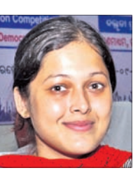
- ଅଭିନବ ଆଚାର୍ଯ୍ୟ, ଦ୍ୱିତୀୟ

ଗଣମାଧ୍ୟମ ହେଉଛି ଗଣତନ୍ତ୍ରର ଜାଗ୍ରତ ପୁରା । ଗଣତନ୍ତ୍ରକୁ ସୁରକ୍ଷା ଦେବା ନିମନ୍ତେ ଗଣମାଧ୍ୟମର ଅନେକ ଗୁରୁତ୍ୱ ରହିଛି । ମୁଦ୍ରପତ୍ରିକା ଏକ ସେତୁ ଭାବେ ଉଭୟ ଗଣତନ୍ତ୍ର ଓ ଗଣମାଧ୍ୟମକୁ ସୁଗଠିତ କରିବା ଆବଶ୍ୟକ ।