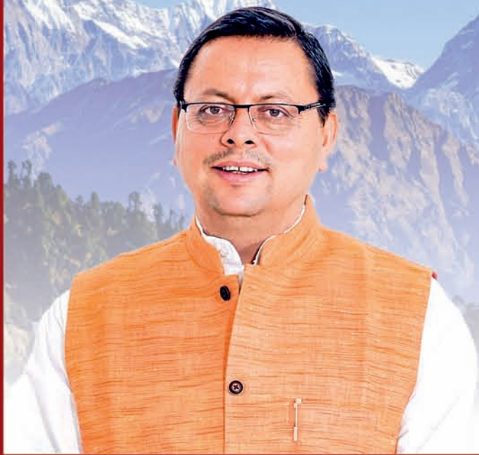
Pushkar Singh Dhami Chief Minister, Uttarakhand