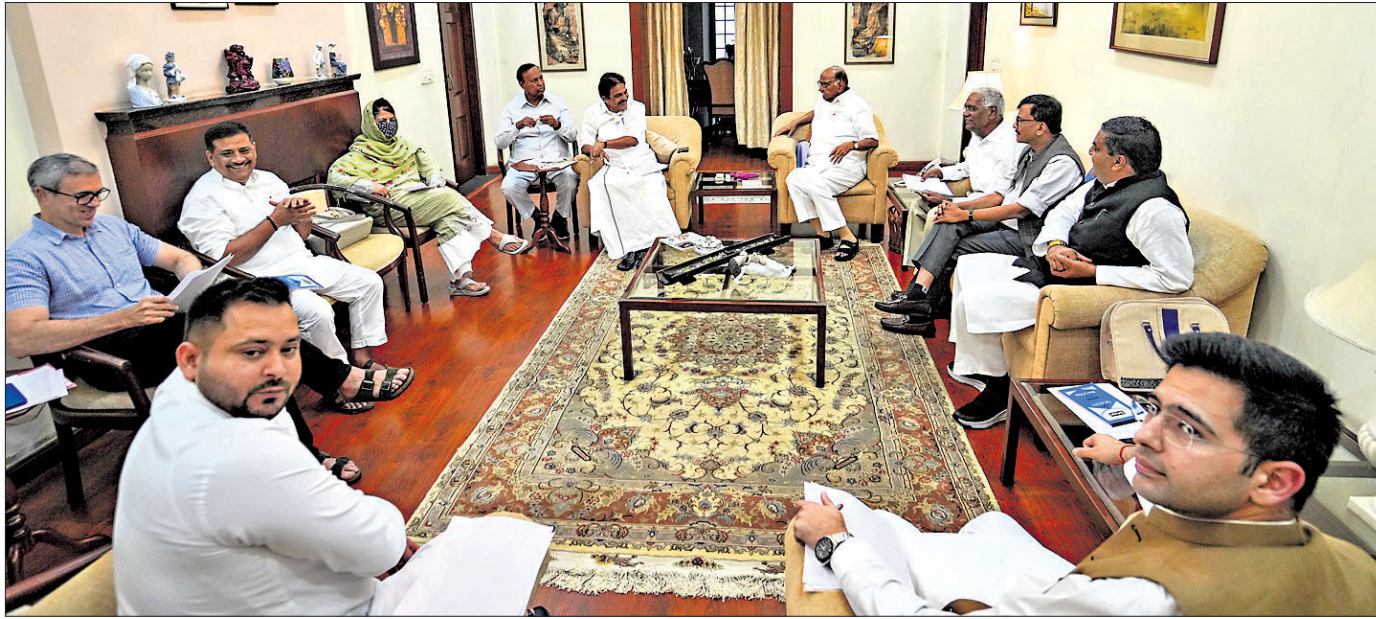
ନୂଆଦିଲ୍ଲୀସ୍ଥିତ ଶରଦ ପାଠ୍ରାୟଙ୍କ ବାସଭବନରେ ରୁଧିର ଅନୁଷ୍ଠିତ 'ଇଣ୍ଡିଆ'ର ପ୍ରଥମ ରଣନୀତି ବୈଠକରେ ଉପସ୍ଥିତ ନେତାମାନେ।

୨୦୨୪ ଲୋକ ସଭା ନିର୍ବାଚନରେ ଭାଜପାକୁ ହରାଇବା ପାଇଁ ୨୭ ଦିରୋଧୀ ଦଳକୁ ନେଇ ଗଠିତ ଇଣ୍ଡିଆ ନ୍ୟାଶନାଲ ଡେମୋକ୍ରାଟିକ୍ ଇନ୍‌ସିଡିଭିଭୁ ଆଲୀଏନ୍ସ (ଇଣ୍ଡିଆ)ର ପ୍ରଥମ ରଣନୀତି ବୈଠକ ରୁଧିର ଅନୁଷ୍ଠିତ ହୋଇଯାଇଛି। ଜାତୀୟତାବାଦୀ କଂଗ୍ରେସ ପାର୍ଟି (ଏନ୍‌ସିପି) ମୁଖ୍ୟ ଶରଦ ପାଠ୍ରାୟଙ୍କ ନୂଆଦିଲ୍ଲୀ ବାସଭବନରେ ହୋଇଥିବା ଏହି ବୈଠକରେ ଜାତିଗତ ଜନଗଣନା କରାଯିବାର ଉପରେ ବିଶେଷ ଗୁରୁତ୍ୱ ଦିଆଯାଇଛି। ସେହିପରି ଖୁବ୍ ଶୀଘ୍ର ଆସନ ବୁଝାମଣା ଉପରେ ନିଷ୍ପତ୍ତି ନିଆଯିବ। ବିଧାନସଭା ନିର୍ବାଚନ ହେବାକୁ ଯାଉଥିବା ମଧ୍ୟପ୍ରଦେଶର ଭୋପାଳରେ ଇଣ୍ଡିଆର ପ୍ରଥମ ମିଳିତ ସାଧାରଣ ସଭା ଅନୁଷ୍ଠିତ ହେବ ବୋଲି ବୈଠକ ଶେଷରେ କଂଗ୍ରେସ ସାଧାରଣ ସମ୍ପାଦକ କେ.ସି. ବେଣ୍ଟଗୋପାଳ ସୂଚନା ଦେଇଛନ୍ତି।