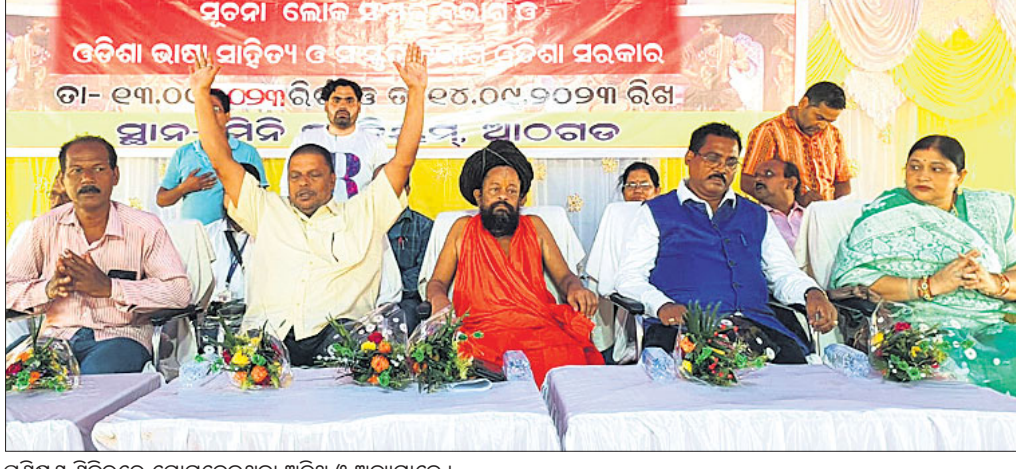
ପ୍ରଶିକ୍ଷଣ ଶିବିରରେ ଯୋଗଦେଇଥିବା ଅତିଥି ଓ ଅନ୍ୟମାନେ ।