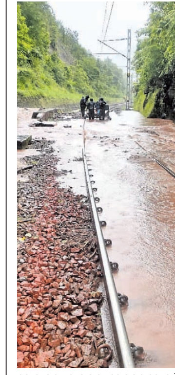
କୋରାପୁଟ-ରାୟଗଡ଼ା ରେଳପଥରେ ମାଟି ଅତଡ଼ା ଖସିବା ସହ ପାଣି ପ୍ରବାହିତ ହେଉଛି।

୬ରୁ ୨୦ ସେଣ୍ଟିମିଟର ଯାଏଁ ବର୍ଷା ହେବାର ସମ୍ଭାବନା ରହିଛି। ଏହିସବୁ ଜିଲ୍ଲା ପାଇଁ ରେଡ୍‌ଓଫି କାରି କରାଯାଇଛି। ସେହିପରି ଏହି ସମୟରେ ନବରଙ୍ଗପୁର, ନୂଆପଡ଼ା, ବରଗଡ଼, ସମ୍ବଲପୁର, ନୟାଗଡ଼, କଟକ, ଅନୁଗୋଳ, ଗଞ୍ଜାମ ଆଦି ପୃଷ୍ଠା-୨