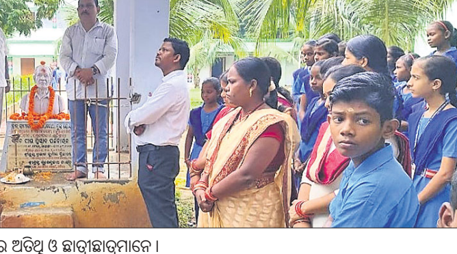
ପୀରପ୍ରସାଦ ପଟ୍ଟନାୟକଙ୍କ ପ୍ରତିମୂର୍ତ୍ତି ନିକଟରେ ଅତିଥି ଓ ଛାତ୍ରଛାତ୍ରୀମାନେ ।