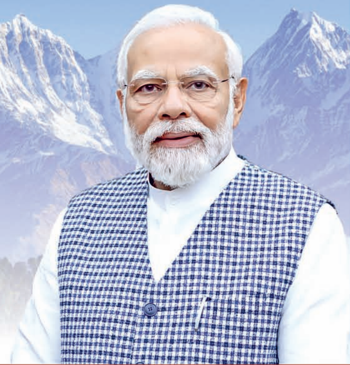
Narendra Modi Prime Minister