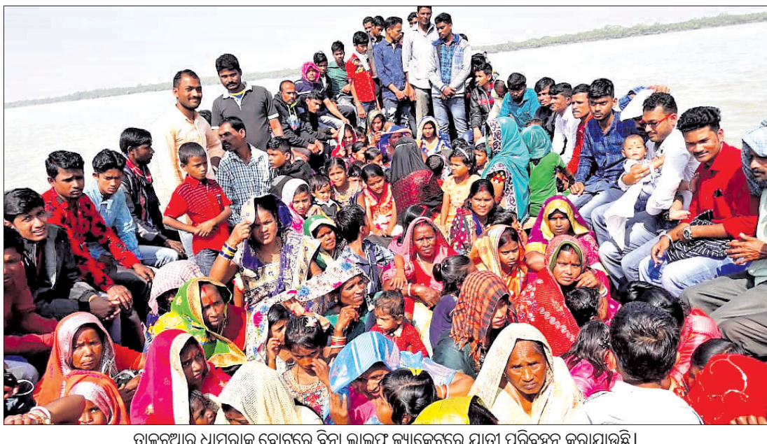
ତାଳୁଆରୁ ଧାମରାକୁ ବୋର୍ଡରେ ବିନା ଲାଲପ୍ କ୍ୟାଙ୍କେଟ୍ରେ ଯାତ୍ରୀ ପରିବହନ କରାଯାଉଛି।

କେନ୍ଦ୍ରାପଡ଼ା ଜିଲ୍ଲାରେ ୭ ନଦୀ ଏବଂ ୨୭ ନାଳ ରହିଛି। ଏହି ସବୁ ନଦୀ, ନାଳ ଘେରରେ ଥିବା ୧୭ ପଞ୍ଚାୟତକୁ ସଂଯୋଗ ପାଇଁ ସେତୁ ନାହିଁ। ତଳା ବୁରା ଯାତାୟାତ ଚାଲିଛି। ସେହି ପରିମାଣରେ ତଳାକୁ ଘରଣା ବାରମ୍ବାର ଦେଖିବାକୁ ମିଳୁଛି। ଏହା ସତ୍ତ୍ୱେ ଜିଲ୍ଲା ପ୍ରଶାସନ କିମ୍ବା ଜନସାଧାରଣଙ୍କୁ ସେଥିରୁ କୌଣସି ଶିକ୍ଷା ମିଳିବା ପରି ମନେ ହେଉନାହିଁ। ପ୍ରାୟତଃ ତଳା ଯାତ୍ରାମାନେ ଲାଲପ୍ କ୍ୟାଙ୍କେଟ୍ ପିନ୍ଧି ନ ଥିବାବେଳେ ମାଛଧରା ବୋର୍ଡରେ ଯାତ୍ରୀ ପରିବହନ ଯୋଗୁଁ ଜୀବନହାନୀର ସମ୍ଭାବନା ହୋଇଛି। ବିରାପଦ ଯାତ୍ରା ପାଇଁ ବୋର୍ଡ ରୁଲ୍ସ ଥିଲେ ମଧ୍ୟ ତାହାକୁ ଠିକ୍ ଭାବେ ଅନୁପାଳନ କରାଯିବାରେ ପ୍ରଶାସନ କୁହୁଡ଼ି ଦେଖାଯାଉଛି।