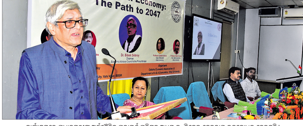
କାର୍ଯ୍ୟକ୍ରମରେ ପ୍ରଧାନମନ୍ତ୍ରୀଙ୍କ ଅର୍ଥନୀତି ପରିଷଦ ଅଧ୍ୟକ୍ଷ ଡ. ବିବେକ ଦେବଦାସ ଉଦ୍‌ଘୋଷଣା କରୁଥିବା ସମୟରେ ।

୨୦୪୭ ବିକାଶ ଲକ୍ଷ୍ୟ' ଶୀର୍ଷକ ବକ୍ତୃତା ପ୍ରଦାନ କରି ଡ. ଦେବଦାସ କହିଲେ, ଭାରତୀୟ ଅର୍ଥନୀତି ପ୍ରଗତିରେ ଗୋଟିଏ ଦଶନ୍ଧି ଶାସ୍ୟ ସହାୟକ ହୋଇଥାଏ । ତେଣୁ ବିଶ୍ୱପ୍ରସାର ଅର୍ଥନୀତିରେ ନିଜର ଆଧିପତ୍ୟ ବିସ୍ତାର ପାଇଁ କୃଷି ବିକାଶ ଜରୁରୀ । କୃଷି କ୍ଷେତ୍ରରେ ସଂସ୍କାର ସହ ଏହାର ବିକାଶ ଦିଗରେ ବ୍ୟାପକ ପଦକ୍ଷେପ ନେବାକୁ ପଡ଼ିବ ।