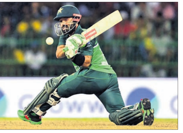
ସୁଲସ୍ ଶର୍ପିଙ୍ଗ୍ ଅବସରରେ ମହମ୍ମଦ ରିଜର୍ଡ୍।

କଲୟା, ୧୪/୯ ଶ୍ରୀଲଙ୍କା ବିପକ୍ଷ ଏସିଆ କପ୍ ସୁପର-୪ ମ୍ୟାଚରେ ଅର୍ଦ୍ଧଶତକ ହାସଲ କରିଛନ୍ତି