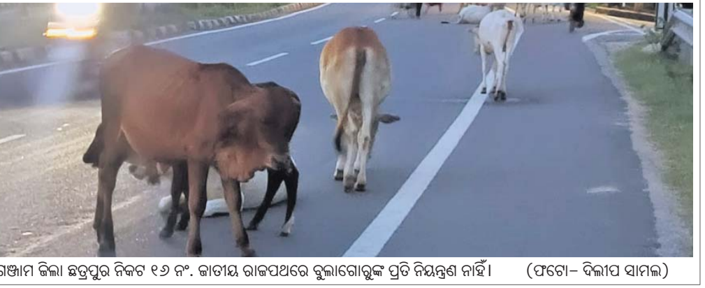
ଗଞ୍ଜାମ ଜିଲ୍ଲା ଛତ୍ରପୁର ନିକଟ ୧୬ ନଂ. ଜାତୀୟ ରାଜପଥରେ ବୁଲାଇବାକୁ ପ୍ରତି ନିୟନ୍ତ୍ରଣ ନାହିଁ।

ଗୋପାଳପୁର, ୧୫୯୯ (ନବାନ ରାଜ ଆଚାରୀ) ଗୋପାଳପୁର ଥାନା ଅନ୍ତର୍ଗତ ଏକଦିନ ଗ୍ରାମରେ ରାସ୍ତାକୁ ନେଇ ୨ ଗୋଷ୍ଠୀ ମଧ୍ୟରେ ସଂଘର୍ଷ ହୋଇଥିଲା।