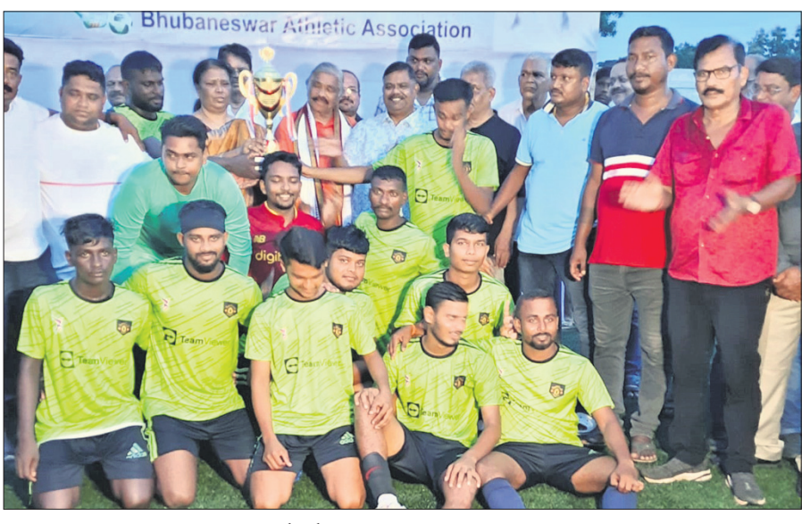
ଅତିଥି ଓ କର୍ମକର୍ତ୍ତାଙ୍କ ସହ ଭୁବନେଶ୍ୱର ଚାମ୍ପିୟନ ଦଳର ଖେଳାଳି।

ମୁନାଇଚେତ୍ ମୁଥ୍ ସ୍କୋର୍ଟିଂ କ୍ଳବ୍ ର ଚାମ୍ପିୟନ ହୋଇଛନ୍ତି। ଭୁବନେଶ୍ୱର ଆଥଲେଟିକ୍ ଆସୋସିଏସନ୍ ଆନୁକୁଲ୍ୟରେ ଅଗଷ୍ଟ ୪ରୁ ୧୨ ଯାଏଁ ଭୁବନେଶ୍ୱର ସ୍ପୋର୍ଟ୍ସ ଷ୍ଟାଡ଼ିୟମରେ ଖେଳାଯାଇଥିଲା।