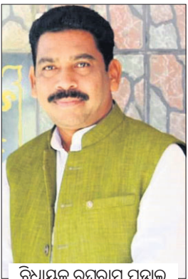
ବିଧାନକୁ ହତ୍ୟା ଧମକ ଦେବା

କୋରାପୁଟ ବିଧାନକୁ ହତ୍ୟା ଧମକ ଦେବା... (ଅନିତା ବେହେରା)