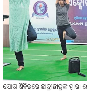
ଯୋଗ ଶିବିରରେ ଛାତ୍ରାଛାତ୍ରୀଙ୍କ ଦ୍ୱାରା ଯୋଗ ଅଭ୍ୟାସ କରାଯାଇଛି।

ବ୍ରହ୍ମପୁର/ଗୋପାଳପୁର, ୧୫୯୯ (ବୃତ୍ତି ରଞ୍ଜନ ମହାଲିକ/ନବାନ ଆଚାରୀ)