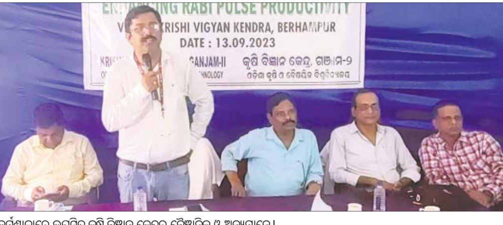
କର୍ମଶାଳାରେ ଉପସ୍ଥିତ କୃଷି ବିଜ୍ଞାନ କେନ୍ଦ୍ରର ବୈଜ୍ଞାନିକ ଓ ଅନ୍ୟମାନେ।

ଗଞ୍ଜାମ ଜିଲ୍ଲାରେ ଧାନ ପରେ ରବି ଋତୁରେ ପ୍ରାୟ ଦେଢ଼ ଲକ୍ଷ ହେକ୍ଟର ଜମିରେ ତାଳି ଜାତୀୟ ଫସଲ ଗଣ୍ୟ କରାଯାଉଛି।