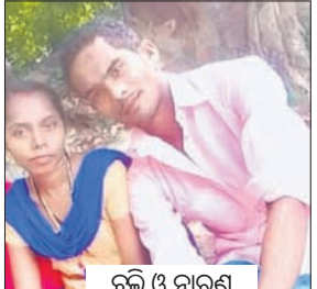
ସ୍ତ୍ରୀ ଓ ନାରୀ

ସୋରଡ଼ା, ୧୪।୯ (ଲକ୍ଷ୍ମୀବର ପାଣିଗ୍ରାହୀ) ନଦୀକୂଳରେ ସ୍ତ୍ରୀଙ୍କୁ ହତ୍ୟା କରିବା ପରେ ଖଣ୍ଡ ଖଣ୍ଡ କରି ନଦୀକୁ ଫିଙ୍ଗିଦେଇଛନ୍ତି ସ୍ତ୍ରୀମାନେ। ଏକଲି ବାଲ୍ୟ ଓ ଲୋମହର୍ଷଣକାରୀ ଘଟଣା ଗଣ୍ଡାମ ଜିଲ୍ଲା ସୋରଡ଼ା ଥାନା ଭଗବାନପୁର ଗ୍ରାମରେ ଘଟିଛି।