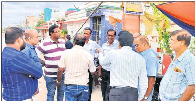
ସର୍ତ୍ତେ କାର୍ଯ୍ୟବେଳେ ଉପସ୍ଥିତ କୋଠାବାଡ଼ି ବିଭାଗ ଓ ବିଜ୍ଞାପନ ଅଧିକାରୀ ଏବଂ ଅନ୍ୟମାନେ।

ବ୍ରଜନଗର ଟାଉନ ଲେନ୍ ରାସ୍ତା ନିର୍ମାଣ ପାଇଁ ସହରରେ ଅଞ୍ଚଳ ନିର୍ମାଣ କ୍ରିୟାକୁସ୍ଥାନ କମିଟି ଓ ବ୍ରଜନଗର ଉନ୍ନୟନ ପରିଷଦ ପକ୍ଷରୁ ଦାବି ହୋଇ ଆସୁଥିଲା।