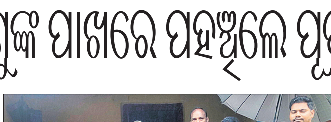
ଅନାଥ ଶିଶୁଙ୍କୁ ପୂର୍ବତନ ବିଧାୟକ ସହାୟତା ଦେଉଛନ୍ତି ।