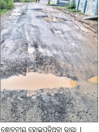
ଶୋଚନୀୟ ହୋଇପଡିଥିବା ରାସ୍ତା।

ମାଲକାନଗିରି ପୌର ପରିଷଦ ପର୍ବତ ଉପରେ ପ୍ରସିଦ୍ଧ ଶୈବପୀଠ ମଲ୍ଲିକେଶ୍ୱର ରହିଛି। ବର୍ଷସାରା ଏହି ଶୈବ ପୀଠକୁ ବହୁ ସଂଖ୍ୟକ ଭକ୍ତ ଶିବରାତ୍ରି, କାର୍ତ୍ତିକ ସୋମବାର, କାର୍ତ୍ତିକ ପୂର୍ଣ୍ଣିମା, ବୋଲ ବମ୍ ଭକ୍ତଙ୍କ ଜଗତିସେଧ ବ୍ୟତୀତ ବିଭିନ୍ନ ପର୍ବପର୍ବାଣି ସହ ପ୍ରତ୍ୟେକ ସୋମବାର ପ୍ରବଳ ଭିଡ ହୋଇଥାଏ। ଏହି ଶୈବପୀଠର ବିକାଶ ପାଇଁ ରାଜ୍ୟ ସରକାର ଜିଲ୍ଲା ପ୍ରଶାସନ ମାଧ୍ୟମରେ ପ୍ରାୟତଃ ୪ କୋଟିରୁ ଊର୍ଦ୍ଧ୍ୱ ଟଙ୍କା ବ୍ୟୟ କରିଛନ୍ତି। ମାତ୍ର ସହରଠାରୁ ୧ କି.ମି. ରାସ୍ତା ଗତ ବର୍ଷକ ପୂର୍ବରୁ ତିଆରି କରାଯାଇନାହିଁ। କିନ୍ତୁ ବର୍ଷେ ନ ପୁରୁଣୁ