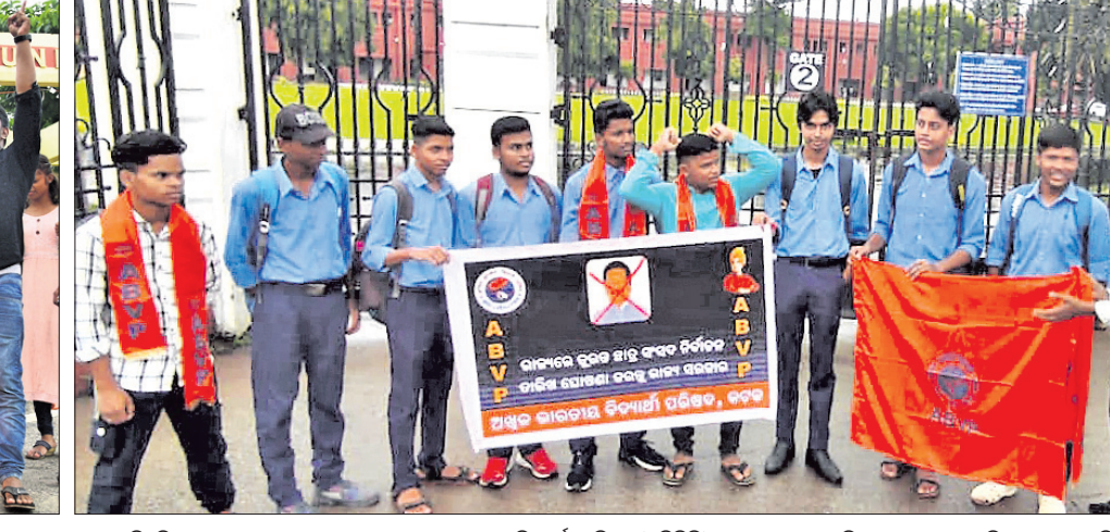
ଅଧିକ ଭାରତୀୟ ବିଦ୍ୟାର୍ଥୀ ପରିଷଦ (ଏସିପି)ର ଛାତ୍ରମାନେ ଉଚ୍ଚ ଶିକ୍ଷାମନ୍ତ୍ରୀଙ୍କ କୁଶପୁରୁକିକା ଦାହ କରୁଛନ୍ତି।