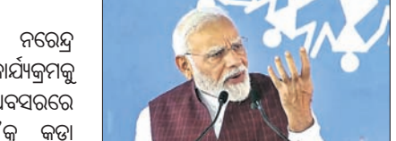
ବୋଲି ପ୍ରଧାନମନ୍ତ୍ରୀ କହିଛନ୍ତି। ଡିଏମ୍‌କେ ନେତା ଉଦୟନିଧି ସ୍ୱାମିନିକ ସମାଜର ଧର୍ମ ସମ୍ପର୍କିତ ମନ୍ତବ୍ୟକୁ ନେଇ ବିବାଦ ଲାଗିରହିଥିବାବେଳେ ପ୍ରଧାନମନ୍ତ୍ରୀ ପ୍ରଥମ

ମଧ୍ୟପ୍ରଦେଶରେ ପ୍ରଧାନମନ୍ତ୍ରୀ ନରେନ୍ଦ୍ର ମୋଦି ଗୁରୁବାର ଏକ କାର୍ଯ୍ୟକ୍ରମକୁ ଉଦ୍‌ଘୋଷଣା ଦେବା ଅବସରରେ ବିରୋଧୀ ମେଞ୍ଚ 'ଇଣ୍ଡିଆ'କୁ କଡ଼ା ସମାଲୋଚନା କରିଛନ୍ତି। ବିରୋଧୀ 'ଇଣ୍ଡିଆ' ମେଞ୍ଚ ସମାଜର ଧର୍ମକୁ ଧ୍ୱଂସ କରିବେକ ଦେଶକୁ ୧,୦୦୦ ବର୍ଷ ତଳର ଦାସତ୍ୱ ସମୟକୁ ନେଇଯିବାକୁ ଚାହୁଁଛି