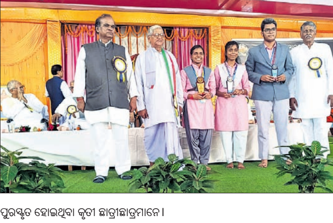
ପୁରସ୍କୃତ ହୋଇଥିବା କୃତୀ ଛାତ୍ରୀଛାତ୍ରୀମାନେ ।