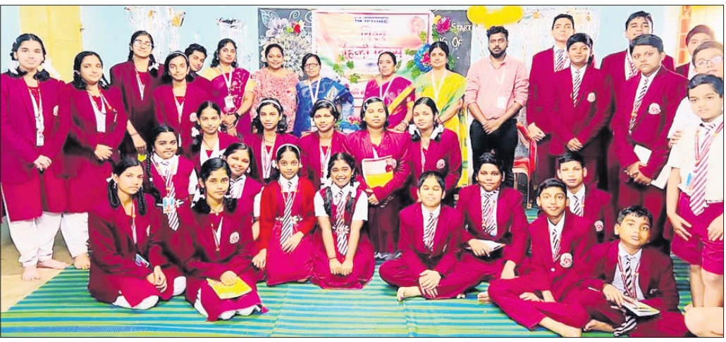
ସ୍ୱାମୀ ବିବେକାନନ୍ଦ ବନ ଭାରତୀ ବିଦ୍ୟାଳୟରେ ବିଶ୍ୱ ହିନ୍ଦୀ ଦିବସ ପାଳିତ କାର୍ଯ୍ୟକ୍ରମରେ ସାମିଲ ହୋଇଥିବା ଛାତ୍ରଛାତ୍ରୀ ।

କୋରାପୁଟ, ୧୪।୯ (ଅମିତାଜ ବେହେରା ) କୋରାପୁଟରୁ ସ୍ୱାମୀ ବିବେକାନନ୍ଦ ବନ ଭାରତୀ ବିଦ୍ୟାଳୟରେ ରୁକୁଣ୍ଡର ବିଶ୍ୱ ହିନ୍ଦୀ ଦିବସ ପାଳିତ ହୋଇଛି । ଅଧ୍ୟକ୍ଷା ଅତସି