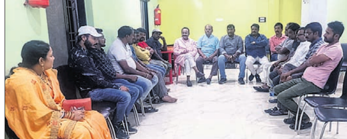
ଭାଜପା ପ୍ରସ୍ତୁତି ବୈଠକରେ ଉପସ୍ଥିତ କର୍ମକର୍ତ୍ତା।