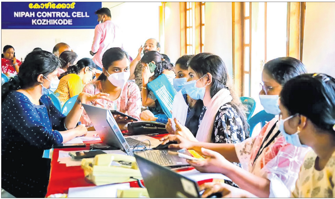
କେନ୍ଦ୍ରରେ ନିପା ଭାଇରସ ଆଡ଼େ ବଢ଼ିବାରେ ଲାଗିଥିବାବେଳେ କୋର୍ଡିକୋଡ୍ କଣ୍ଟ୍ରୋଲ ରୁମ୍‌ରେ କାର୍ଯ୍ୟରତ ସାମ୍ବଲକର୍ମୀ।

ନୂଆଦିଲ୍ଲୀ, ୧୪୯୯ (ପି.ଟି.) ଦିଲ୍ଲୀ-ଏନ୍‌ସିଆର୍ ଅଞ୍ଚଳରେ ପ୍ରତ୍ୟକ୍ଷ ଧରଣରୁ କମ୍ପାନୀ ପାଇଁ ବାଣ ଉପରେ ନିକ୍ଷେପାଦେଶ ଜାରି କରିବା ଲାଗି ହୋଇଥିବା ଏକ ଆବେଦନ ଉପରେ ସୁପ୍ରିମକୋର୍ଟ ଗୁରୁବାର ରାୟ ସଂରକ୍ଷିତ ରଖିଛନ୍ତି।