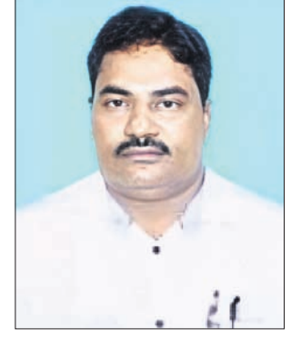
ସଂଗ୍ରାମ କେଶରୀ କେନା