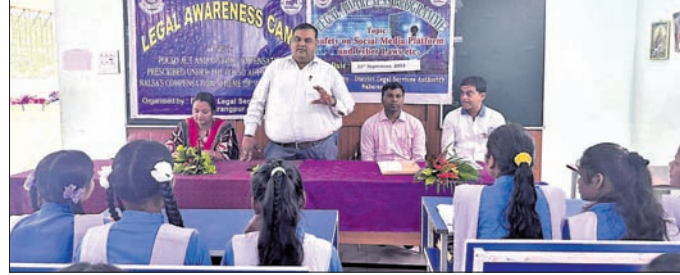
ଶିବିରରେ ଜଣେ ବସ୍ତା ନିଜ ମତ ଦେଉଛନ୍ତି।