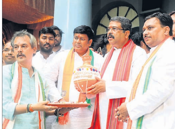
ପ୍ରଦାନ କରିବ। ମୋ ମାଟି ମୋ ଦେଶ ଅଭିଯାନରେ କୋଲକାତାସ୍ଥିତ ଶ୍ରୀଅରବିନ୍ଦ ଜଗନ୍ନାଥରୁ ପବିତ୍ର ମାଟି ସଂଗ୍ରହକରି ନିଜକୁ ଧନ୍ୟ ମନେକରୁଛି ବୋଲି ସେ କହିଛନ୍ତି। ଜାତୀୟ ସମୟରେ ଜନସମ୍ପର୍କ କାର୍ଯ୍ୟକ୍ରମରେ ଶିକ୍ଷାମାଟି ଅରବିନ୍ଦ ପ୍ରକୃତ ଶିକ୍ଷା

କୋଲକାତାସ୍ଥିତ ଅରବିନ୍ଦ ଜଗନ୍ନାଥ ଅରବିନ୍ଦ ଭବନରୁ 'ମୋ ମାଟି ମୋ ଦେଶ' ଅଭିଯାନରେ ସାମିଲହୋଇ କେନ୍ଦ୍ରମନ୍ତ୍ରୀ ଧର୍ମେନ୍ଦ୍ର ପ୍ରଧାନ ଅମୃତ କଳସରେ ମାଟି ସଂଗ୍ରହ କରିଛନ୍ତି। ମୋ ମାଟି ମୋ ଦେଶ ଅଭିଯାନ ଏବେ ଦେଶରେ ଜନ ଆନ୍ଦୋଳନର ରୂପ ନେଇସାରିଛି ଏବଂ ଦେଶର କୋଟି କୋଟି ଲୋକ ଏଥିରେ ସାମିଲ ହେଉଛନ୍ତି। ଆଗାମୀ ୨୫ ବର୍ଷ ମଧ୍ୟରେ ଭାରତକୁ ଏକ ବିକଶିତ ଦେଶ ଭାବେ ପରିଣତ କରିବା ପାଇଁ ସଂକଳ୍ପ ନେବା ବୋଲି ଏହି ଅବସରରେ ଧର୍ମେନ୍ଦ୍ର କହିଛନ୍ତି। ଧର୍ମେନ୍ଦ୍ର ଆହୁରି କହିଛନ୍ତି, ଅରବିନ୍ଦ ବିଭାର, ଆଦର୍ଶ ଓ ଅବଦାନ ଭାରତର ଭବିଷ୍ୟତ ଗଠନରେ ପ୍ରମୁଖ ଭୂମିକା ଗ୍ରହଣ କରିଛି। ଉପନିବେଶବାଦ ମାନସିକତାରୁ ମୁକ୍ତି କରାଇବାର ସେ ଥିଲେ ପ୍ରମୁଖ ବିହାରୀ। 'ଶ୍ରେଷ୍ଠ ଭାରତ' ପାଇଁ ତାଙ୍କର ଦୃଷ୍ଟିକୋଣ ସର୍ବଦା ଆମକୁ ମାର୍ଗଦର୍ଶନ ପ୍ରଦାନ କରିବ। ମୋ ମାଟି ମୋ ଦେଶ ଅଭିଯାନରେ କୋଲକାତାସ୍ଥିତ ଶ୍ରୀଅରବିନ୍ଦ ଜଗନ୍ନାଥରୁ ପବିତ୍ର ମାଟି ସଂଗ୍ରହକରି ନିଜକୁ ଧନ୍ୟ ମନେକରୁଛି ବୋଲି ସେ କହିଛନ୍ତି। ଜାତୀୟ ସମୟରେ ଜନସମ୍ପର୍କ କାର୍ଯ୍ୟକ୍ରମରେ ଶିକ୍ଷାମାଟି ଅରବିନ୍ଦ ପ୍ରକୃତ ଶିକ୍ଷା ଦୃଷ୍ଟିକୋଣ ସହ ଯୋଡ଼ି ହୋଇରହିଛି। ଏହା ଶିଶୁର ସାମଗ୍ରିକ ବିକାଶ ପାଇଁ ଏକ ଉତ୍ତମ ପରିବେଶ ପ୍ରଦାନ କରେ ବୋଲି ସେ କହିଛନ୍ତି। ଏହି ଗପ୍ତ ବୋଲି ସେ କହିଛନ୍ତି। ଜାତୀୟ ସମୟରେ ଜନସମ୍ପର୍କ କାର୍ଯ୍ୟକ୍ରମରେ ଶିକ୍ଷାମାଟି ଅରବିନ୍ଦ ପ୍ରକୃତ ଶିକ୍ଷା