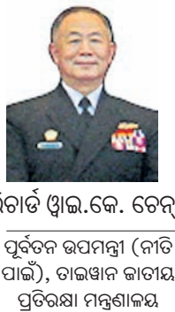
ରିଚାର୍ଡ ଥାଉ.କେ. ଚେନ୍ ପୂର୍ବତନ ଉପମନ୍ତ୍ରୀ (ନାତି ପାଇଁ), ତାଲିଖନ କାତାୟ ପ୍ରତିରକ୍ଷା ମନ୍ତ୍ରାଳୟ