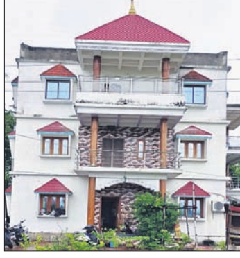
ବାଲୁଗାଁରେ ଥିବା ସଂଗ୍ରାମକ ଚିନିମହଲା କୋଠା

ଭୁବନେଶ୍ୱର (ସତ୍ୟକିନ୍ଦ୍ର ରାଉତ)/ବାଲୁଗାଁ (ସଂଗ୍ରାମ ପାଳକରାୟ), ୧୫