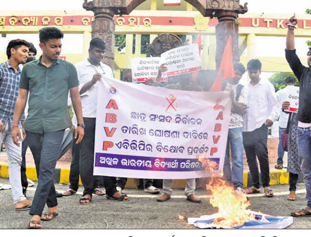
ଅଧିକ ଭାରତୀୟ ବିଦ୍ୟାର୍ଥୀ ପରିଷଦ (ଏସିପି)ର ଛାତ୍ରମାନେ ଉଚ୍ଚ ଶିକ୍ଷାମନ୍ତ୍ରୀଙ୍କ କୁଶପୁରୁକିକା ଦାହ କରୁଛନ୍ତି।