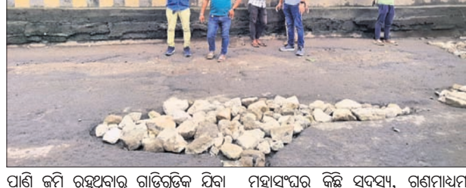
ପାଣି ଜମି ରହୁଥିବାରୁ ଗାତକୁ ଚିକିତ୍ସା କରିବା ପାଇଁ ପଥର ଓ ବାଲି ଭରି ସମତୁଲ କରାଯାଇଛି।

ନାକ୍ସପଟା ପୋଲରେ ବହୁ ବଡ଼ ଗର୍ତ୍ତ ଦୃଷ୍ଟି ହୋଇଥିବାରୁ ଲୋକେ ଏହାକୁ ମରାମତି ପାଇଁ ବାରମ୍ବାର ଦାବି ସତ୍ତ୍ୱେ ଜାତୀୟ ରାଜପଥ ବିଭାଗ ଓ ପ୍ରଶାସନ କୌଣସି ପଦକ୍ଷେପ ନେଇ ନାହିଁ। ଫଳରେ ବାଧ୍ୟ ହୋଇ ଜେକେପୁର ଓ ନାକ୍ସପଟା ବୁଝିକାଟା ଗାତରେ ପଥର ଓ ବାଲି ଭରି କରି ସମତୁଲ କରିଛନ୍ତି। ଜେକେପୁର ନିକଟସ୍ଥ ନାକ୍ସପଟା ଗ୍ରାମ ଦେଇ ଯାଇଥିବା ୩୨୬୯ ନମ୍ବର ଜାତୀୟ ରାଜପଥରେ ରହିଥିବା ପୋଲ ଖାଲଖାମରେ ଭରି ହୋଇଥିବାରୁ ସେଠାରେ ଅନେକ ସମୟରେ ଯୁର୍ଦ୍ଧ୍ୱଚାପୀନ ଘଟୁଥିଲା। ଏବେ ବର୍ଷା ଲାଗି ରହିଥିବାରୁ ପୋଲରେ ଥିବା ଗର୍ତ୍ତକୁ ଚିକିତ୍ସା କରିବା ପାଇଁ ପଥର ଓ ବାଲି ଭରି ସମତୁଲ କରାଯାଇଛି। ଏଥିରେ ଭ୍ରାଜଭର