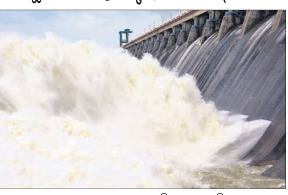
ହାରାକୁଦ ତ୍ୟାମକୁ ବନ୍ୟାଜଳ ନିଷାସନ ହେଉଛି।