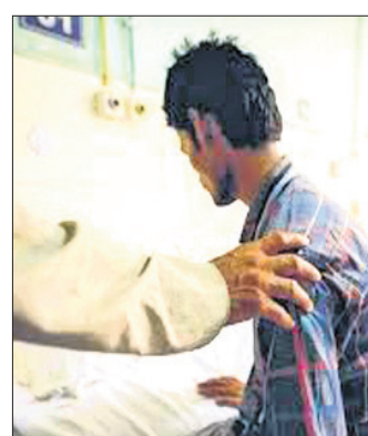
ଉପରୋକ୍ତ କାର୍ଯ୍ୟ ଗୋଷ୍ଠୀ ମାଧ୍ୟମରେ ହୁଏ ଫଳରେ ଅସ୍ତ୍ର ବ୍ୟକ୍ତି ଗୋଷ୍ଠୀରେ ସାମିଲ ହେବାର ସୁଯୋଗ ପାଏ। ତିନି ଦିନୋଦନ ପାଇଁ ଭ୍ରମଣ, ସ୍ୱତନ୍ତ୍ର ତାଲିମ, ସ୍ୱାସ୍ଥ୍ୟ ପରୀକ୍ଷା ଏବଂ ସଚେତନତା ଶିବିର, ଭିକ୍ଷଣ ପ୍ରମାଣପତ୍ର ଏବଂ ବିଭିନ୍ନ ଯୋଜନାରେ ସାମିଲ କାର୍ଯ୍ୟକ୍ରମ କରାଯାଇଥାଏ। ଜୀବନଜୀବିକା କାର୍ଯ୍ୟକ୍ରମ ବିଷୟରେ ଆଲୋଚନା, ଆର୍ଥିକ ସାକ୍ଷରତା ଇତ୍ୟାଦି ମଧ୍ୟ ସାମିଲ କରାଯାଇ ପାରିବ। ରୋଗ ନିବାରଣ ସହିତ ମନୋ-ସାମାଜିକ କାର୍ଯ୍ୟକ୍ରମ ଅସ୍ତ୍ର ବ୍ୟକ୍ତି ଏବଂ ପରିବାରକୁ ପରବର୍ତ୍ତୀ ସମୟରେ ଅଭ୍ୟାସ ପାଇଁ ସାହାଯ୍ୟ କରିଥାଏ। ଏହି ଶିବିର ଅସ୍ତ୍ର ବ୍ୟକ୍ତିର ଗୁଣାତ୍ମକ ଜୀବନଶୈଳୀରେ ପରିବର୍ତ୍ତନ ଆଣିଥାଏ।

ଦକ୍ଷତା, ବୃତ୍ତିଗତ ତାଲିମ, ପରିବାର ଓ ଗୋଷ୍ଠୀ ଲୋକଙ୍କୁ ମାନସିକ ରୋଗ ଏବଂ ଗ୍ରହଣୀୟତା ବିଷୟରେ ସଚେତନ କରିବା ଲକ୍ଷ୍ୟ ରଖି। ଆବାସିକ ଶିବିର ମାନସିକ ଅସ୍ତ୍ର ବ୍ୟକ୍ତିକୁ ସ୍ୱାଧୀନ ଭାବରେ ନିଜ କାମ ନିଜେ କରିବାକୁ ସମର୍ଥ ହେବାର କୌଶଳ ଶିଖାଇଥାଏ। ପରିବାର ଲୋକ, ବନ୍ଧୁବାନ୍ଧବ ଏବଂ କାମସାଥୀଙ୍କ ସହ କଥାବାର୍ତ୍ତା କରିବାର କୌଶଳ ସହିତ ଅନ୍ୟାନ୍ୟ ଜୀବନ କୌଶଳ ହାସଲ କରିଥାଏ। ମାନସିକ ଅସ୍ତ୍ର ବ୍ୟକ୍ତିମାନେ ଜୀବନସାରା ଘରେ, ଗାଁରେ, କର୍ମକ୍ଷେତ୍ରରେ ଅନେକ ଘୁଣ୍ଟା ଏବଂ ବାଧବିପୀଡ଼ାରେ ଶିକାର ହୋଇଥାନ୍ତି। ଏହି ଘୁଣ୍ଟାଭାବ ବଢ଼ିବା ଫଳରେ ମାନସିକ ଅସ୍ତ୍ରଧାରୀ ବଢ଼ି ଏବଂ ସୁସ୍ଥତାରେ ବିଳମ୍ବ ହୋଇଥାଏ। ପରବର୍ତ୍ତୀ ସମୟରେ ଅସ୍ତ୍ରଧାରୀ କରିବା ପରେ ମଧ୍ୟ ଘୁଣ୍ଟାଭାବ ଯୋଗୁଁ ବ୍ୟକ୍ତିର ବୃତ୍ତିଗତ ସୁଯୋଗ ପାଏନାହିଁ, ଫଳରେ ପରିବାରରେ ଆର୍ଥିକ ବୋଧ ବଢ଼ି ନିଜେ ଆୟକରି ପରିବାରକୁ ଆର୍ଥିକ ସହଯୋଗ କରିପାରୁଥିବା ବ୍ୟକ୍ତିର ସମ୍ମାନ ସମାଜରେ ଅଧିକ ହୋଇଥାଏ। ଅସ୍ତ୍ର ବ୍ୟକ୍ତିର ବୃତ୍ତି ଗ୍ରାହଣ ସବୁବେଳେ ବ୍ୟକ୍ତିର ଲକ୍ଷଣ, ସ୍ୱାସ୍ଥ୍ୟର ଯତ୍ନ, ଆତ୍ମସମ୍ମାନ ଏବଂ ଆତ୍ମବୃତ୍ତି ଉପରେ ନିର୍ଭରକରେ। ପରିବାର ଏବଂ ଗୋଷ୍ଠୀର ସହଯୋଗ ହେଲେ ଅସ୍ତ୍ର ବ୍ୟକ୍ତିର ଆତ୍ମବିଶ୍ୱାସ ବଢ଼ିବା ସହିତ ସେ ଅସ୍ତ୍ରଧାରୀଙ୍କୁ ଆହ୍ୱାନକୁ ମୁକାବିଲା କରିବାକୁ ସମର୍ଥ ହୋଇଥାଏ।