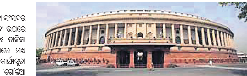
ସମ୍ପର୍କିତ ବିଲ୍ ଅଣାଯିବା ଉପରେ ମଧ୍ୟ ଓ'ଡ୍ରାଏନ୍ ଚିନ୍ତାଧାରା କରୁଛନ୍ତି। ସରକାର ବିରୋଧୀ ଦଳଗୁଡ଼ିକ ଆଶଙ୍କା କରୁଛନ୍ତି।

ସୋମବାର ଆରମ୍ଭ ହେବାକୁ ଥିବା ସଂସଦର ସ୍ୱତନ୍ତ୍ର ଅଧିବେଶନର କାର୍ଯ୍ୟକ୍ରମ ଉପରେ କେନ୍ଦ୍ର ପକ୍ଷରୁ ଏକ ଆପାତତଃ ଚାଲିକା ଜାରି କରାଯିବାର ଦିନକ ପରେ ମଧ୍ୟ କ୍ୱହ୍ ଦୂର ହୋଇନାହିଁ। ସମ୍ପୂର୍ଣ୍ଣ କାର୍ଯ୍ୟକ୍ରମ ସ୍ପଷ୍ଟ ହୋଇ ନ ଥିବାରୁ କେନ୍ଦ୍ର 'ଗୋଲିଆ କୌଶଳ' ପ୍ରୟୋଗ କରି ବିକ୍ଷେପ ଲିଷ୍ଟରେ ଆଉ କିଛି ଯୋଡ଼ିପାରେ ବୋଲି ବିରୋଧୀ ଦଳଗୁଡ଼ିକ ଆଶଙ୍କା କରୁଛନ୍ତି।