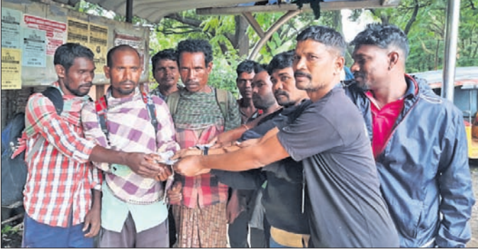
ପଟ୍ଟାଳି ମୋଟର ଚାଳକ ସଂଘ କର୍ମକର୍ତ୍ତା ଶ୍ରମିକମାନଙ୍କୁ ସହାୟତା ଯୋଗାଇ ଦେଇଛନ୍ତି।

ନିଜ ଅଞ୍ଚଳରେ ସରକାରଙ୍କ ପକ୍ଷରୁ କାମ ପାଇଥିଲେ ମଧ୍ୟ ଠିକ୍ ସମୟରେ ପାରିଶ୍ରମିକ ବାବଦ ଅର୍ଥ ପାଇ ନ ଥିବାରୁ ଦାବନ ଖଟିବାକୁ ବାହାର ରାଜ୍ୟକୁ ଶ୍ରମିକମାନେ ଯିବାକୁ ବାଧ୍ୟ ହୋଇଛନ୍ତି। ନବରଙ୍ଗପୁର ଜିଲ୍ଲାରୁ ଆନ୍ଧ୍ରକୁ ଚାଲିଯାଇଥିବା ଯାତ୍ରୀମାନଙ୍କୁ କୋରାପୁଟ ଜିଲ୍ଲା ପଟ୍ଟାଳି ବସଷ୍ଟାଣ୍ଡରେ ରୁଟୁବାର ବସଥିବା ଦେଖିବାକୁ ମିଳିଥିଲା। ସେମାନଙ୍କ କୁଣ୍ଡଳ କାହାଣୀ ଜାଣିବା ପରେ ପଟ୍ଟାଳି ମୋଟର ଚାଳକ ସଂଘ ସହାୟତା ଯୋଗାଇ ଦେଇଛି।