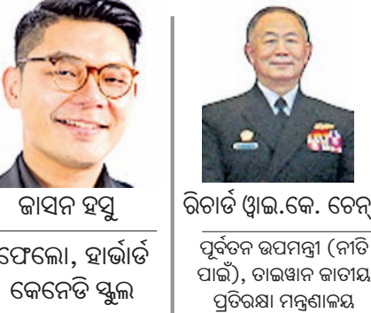
କାସନ ହସୁ ଫେଲୋ, ହାର୍ଡିଟି କେନେଡି ସ୍କୁଲ