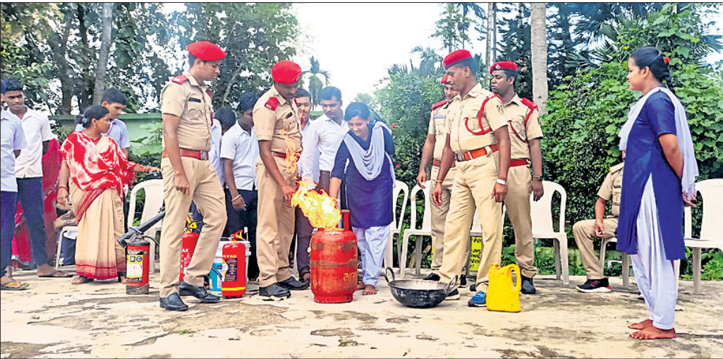
ଅଗ୍ନିଶମ କର୍ମଚାରୀମାନେ ପିଲାଙ୍କୁ ପ୍ରଶିକ୍ଷଣ ଦେଉଛନ୍ତି।

କେନାପୁର, ୧୪୯ (ଅଶୋକ ଦାସ): ଧର୍ମଶାଳା ବ୍ଲକ୍ ଅନ୍ତର୍ଗତ କବାଟବନ୍ଧ ସରକାରୀ ଉଚ୍ଚ ବିଦ୍ୟାଳୟ ପରିସରରେ ଚଢ଼େଇଧରା ଅଗ୍ନିଶମ ବିଭାଗ ପକ୍ଷରୁ ଏକ ସଚେତନତା କାର୍ଯ୍ୟକ୍ରମ ଅନୁଷ୍ଠିତ ହୋଇଯାଇଛି। ଏଥିରେ ଛାତ୍ରାଛାତ୍ରୀଙ୍କୁ