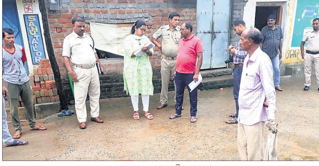
ହତ୍ୟାକାଣ୍ଡ ସ୍ଥଳରେ ପୋଲିସର ତଦନ୍ତ ।