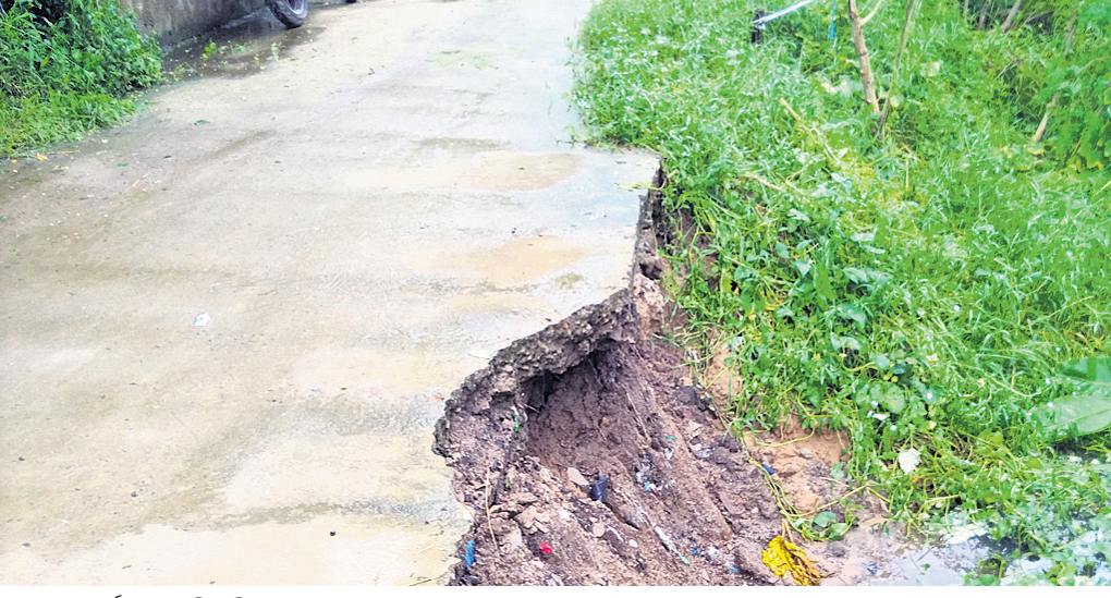
ଯୋଖରା ପାର୍ଶ୍ୱରେ ଭୁବୁଡ଼ି ପଡ଼ିଥିବା ରାସ୍ତା ।

ପାଟକୁରା, ୧୫ (ରବୀନ୍ଦ୍ର ନାଥ ବାରିକ) କେନ୍ଦ୍ରାପଡ଼ା ଜିଲା ଗରବପୁର ବ୍ଲକ ଅଧୀନ ବେରି ପଞ୍ଚାୟତ ବେଡ଼ାରୀ-କୁଳୁଡ଼ି ଗ୍ରାମ ରାସ୍ତା ୮ କୋଟି ୪୦ ଲକ୍ଷ ଟଙ୍କା ବ୍ୟୟରେ ନିର୍ମାଣ କରାଯାଇଥିଲା । ହେଲେ ସେହି କାମ ସରିବାର ୩ ମାସ ଯାଇଛି ବେରିମାଲିକ ସାହି ନିକଟରେ ଥିବା ଯୋଖରା ପାର୍ଶ୍ୱ ରାସ୍ତା ଭୁବୁଡ଼ି ପଡ଼ିଛି । ଏହି ଯୋଖରା ତିନିକଡ଼ରେ ଗ୍ରାମଉଚ୍ଚୟନ