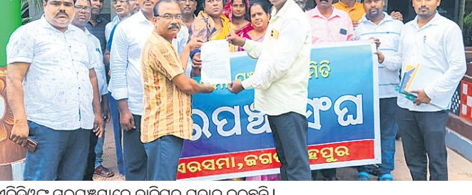
ଏବିଡ଼ିଓଙ୍କୁ ସରପଞ୍ଚମାନେ ଦାବିପତ୍ର ପ୍ରଦାନ କରୁଛନ୍ତି ।