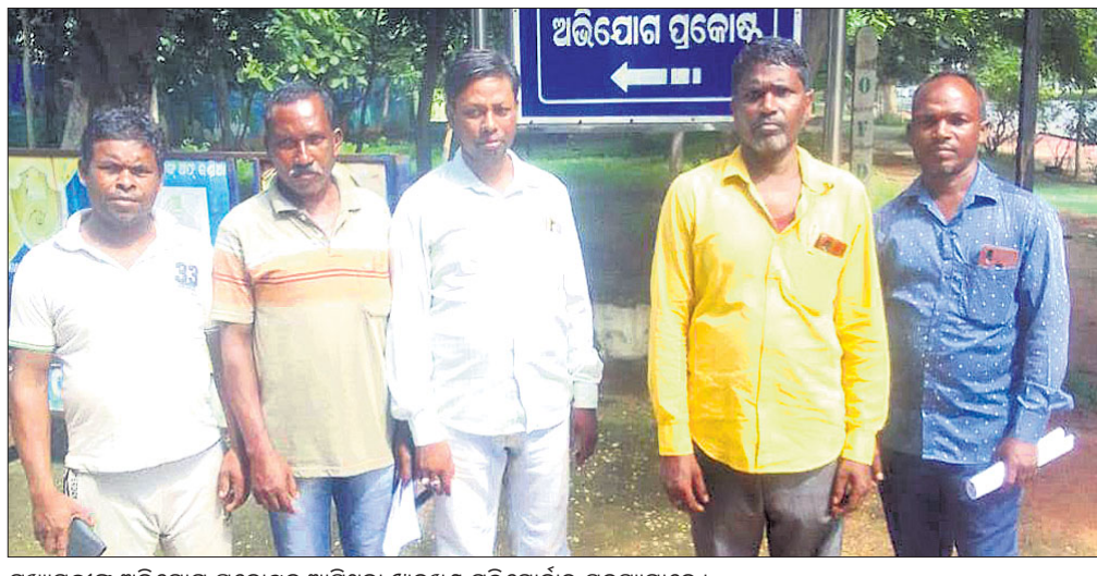
ମୁଖ୍ୟମନ୍ତ୍ରୀଙ୍କ ଅଭିଯୋଗ ପ୍ରକାଶକୁ ଆସିଥିବା ଝାଡ଼ଖଣ୍ଡ ମୁକ୍ତିମୋର୍ଚ୍ଚାର ସଦସ୍ୟମାନେ।

ଯାଜପୁର ଜିଲାର ଶିଳ୍ପ ଓ ଖଣି ସମ୍ପର୍କ ସୂଚକା ନିର୍ବାଚନ ମଣ୍ଡଳୀର ବିଭିନ୍ନ ସମସ୍ୟାର ସମାଧାନ ପାଇଁ ଝାଡ଼ଖଣ୍ଡ ମୁକ୍ତି ମୋର୍ଚ୍ଚା ଯାଜପୁର ଜିଲା କମିଟି ଅଣ୍ଡା ଭିତିକା ସ୍ଥାନୀୟ ନିମ୍ନି ପ୍ରସଙ୍ଗ ସମେତ ଦୀର୍ଘଦିନ ଧରି ସରକାରୀ ଜମିରେ ବସବାସ କରୁଥିବା ଏଠାକାର ଜନକାନ୍ତିକ ଜମି ମାଲିକାନା ପ୍ରଦାନ, ଛତେଇ ଠିକା ଶ୍ରମିକଙ୍କୁ ପୁନଃ ନିମ୍ନି, ଭୁବନେଶ୍ୱର, ଉତ୍ତମ ପ୍ରଦୂଷଣ ଆଦି ସମସ୍ୟାର ସମାଧାନ କରିବାକୁ ଦାବି ହୋଇଛି। ଏହି ମର୍ମହୀନ ଝାଡ଼ଖଣ୍ଡ ମୁକ୍ତିମୋର୍ଚ୍ଚା ପକ୍ଷରୁ ମୁଖ୍ୟମନ୍ତ୍ରୀଙ୍କ ପ୍ରକାଶରେ ଏକ ୧୨ ଦଫା ସମ୍ବଳିତ ଦାବିପତ୍ର ପ୍ରଦାନ କରାଯାଇଛି। ଉକ୍ତ ଦାବିପତ୍ରରେ ଆହୁରି ଦର୍ଶାଯାଇଛି ଯେ, ସୂଚକା ଓ ଦାନଗଦି ବ୍ଲକ୍ ଅଞ୍ଚଳରେ ଅନେକ କୃତ୍ରିମ ଶିଳ୍ପ ଓ ଖଣି ରହିଥିବା ସତ୍ତ୍ୱେ ଏଠାକାର ଜନକାନ୍ତି ସମ୍ପ୍ରଦାୟ ଅବହେଳିତ ହୋଇ ପଡି ରହିଛନ୍ତି। ଦାନଗଦି ବ୍ଲକ୍ ଶାଳିକା ପଞ୍ଚାୟତର ଦୁର୍ଗାପୁର, ଗମ୍ଭାରାପାଟଣା, ଜଟାଝର, ସାହୁପୁର ପ୍ରଭୃତି ଅଞ୍ଚଳରେ ସରକାରୀ ଜମିରେ ଲୋକେ ଘର କରି ରହୁଛନ୍ତି।