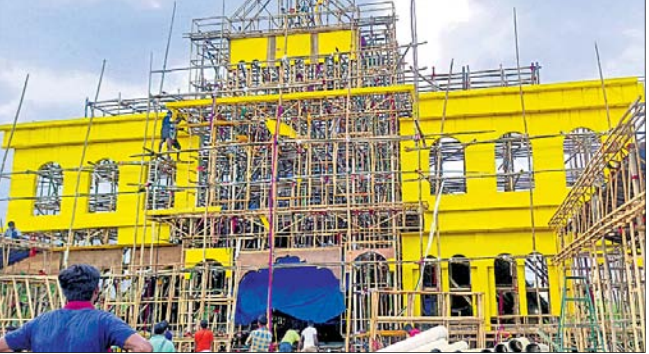
ଲଘୁତାପ ବର୍ଷା ଯୋଗୁ ପାରାଦୀପ ବିଶ୍ୱକର୍ମା ପୂଜା ପାଇଁ ତୋରଣ ନିର୍ମାଣ କାମ ବିଳମ୍ବ ହେଉଛି।