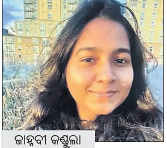
କାହାଣୀ କଣ୍ଟୁଲାଇ କରିବା ସହ ଅଭିଯୁକ୍ତଙ୍କ ବିରୋଧରେ କଡ଼ା କାର୍ଯ୍ୟାନୁଷ୍ଠାନ ଦାବି କରାଯାଇଛି। ଘଟଣାବେଳେ ପୋଲିସ୍ ଅଧିକାରୀ

ଆମେରିକା ପୋଲିସ୍ ଗାଡ଼ି ଧକ୍କାରେ ଭାରତୀୟ ଛାତ୍ରୀଙ୍କ ମୃତ୍ୟୁ ଘଟିଥିଲା ନୂଆଦିଲ୍ଲୀ, ୧୪୯ ଆମେରିକାରେ ଭାରତୀୟ ଛାତ୍ରୀ ଜାହାଜୀ କଣ୍ଟୁଲାଇଗତ ଜାନୁୟାରୀ ୨୩ରେ ପୋଲିସ୍ ଗାଡ଼ି ଧକ୍କାରେ ମୃତ୍ୟୁ ଘଟିଥିଲା। ଅଭିଯୁକ୍ତ ପୋଲିସ୍ କର୍ମୀ ଦୁଃଖ ପ୍ରକାଶ କରିବା ବଦଳରେ ଘଟଣାକୁ ଚାଷ୍ୟ କରୁଥିବାର ଏକ ଭିଡିଓ ଭାଇରାଲ ହୋଇଛି। ଭାରତୀୟ ଦୂତାବାସ ପକ୍ଷରୁ ପ୍ରତିକ୍ରିୟା ପ୍ରକାଶ