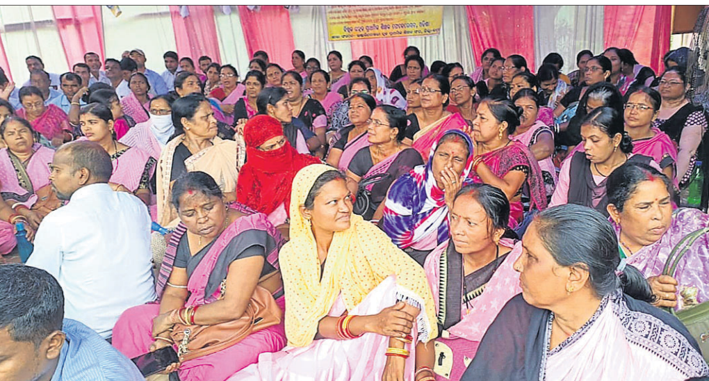
ଭଦ୍ରକ ଜିଲ୍ଲା ଭଣ୍ଡାରିପୋଖରୀ ବ୍ଲକ୍ ଶିକ୍ଷାଧିକାରୀଙ୍କ କାର୍ଯ୍ୟାଳୟ ଆଗରେ ଧାରଣାରତ ପ୍ରାଥମିକ ଶିକ୍ଷୟିତ୍ରୀଶିକ୍ଷକ।

ଭୁବନେଶ୍ୱର, ୧୫/୯ (ଅନିଲ ଦାସ) ରାଜ୍ୟର ବିଭିନ୍ନ ଜିଲ୍ଲାରେ ପ୍ରାଥମିକ ସ୍କୁଲ ଶିକ୍ଷୟିତ୍ରୀ ଓ ଶିକ୍ଷକମାନେ ୩ ଦିନ ଧରି ନେଇ ସେପ୍ଟେମ୍ବର ୮ରୁ ବ୍ଲକ୍ ଶିକ୍ଷାଧିକାରୀଙ୍କ କାର୍ଯ୍ୟାଳୟ ସମ୍ମୁଖରେ କାର୍ଯ୍ୟଦିନ ଆନ୍ଦୋଳନ ଚଳାଇଛନ୍ତି। ଏଥିଯୋଗୁ ରାଜ୍ୟରେ ପ୍ରାଥମିକ ଶିକ୍ଷା ଗଭୀର ଭାବେ ପ୍ରଭାବିତ ହୋଇଛି। ଆନ୍ଦୋଳନ ବନ୍ଦ କରି ତୁରନ୍ତ କାର୍ଯ୍ୟରେ ଯୋଗଦେବାକୁ ପ୍ରାଥମିକ ଶିକ୍ଷା ନିର୍ଦ୍ଦେଶକମାନଙ୍କ ପକ୍ଷରୁ ଶିକ୍ଷକମାନଙ୍କୁ ନିର୍ଦ୍ଦେଶ ଦିଆଯାଇଛି। ପ୍ରାଥମିକ ଶିକ୍ଷା ନିର୍ଦ୍ଦେଶକ ଏ ନେଇ ସମସ୍ତ