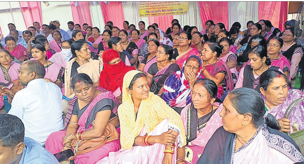
ଭଦ୍ରକ ଜିଲ୍ଲା ଭଣ୍ଡାରିପୋଖରୀ ବ୍ଲକ୍ ଶିକ୍ଷାଧିକାରୀଙ୍କ କାର୍ଯ୍ୟାଳୟ ଆଗରେ ଧାରଣାରେ ପ୍ରାଥମିକ ଶିକ୍ଷୟିତ୍ରୀଶିକ୍ଷକ।

ଡିଇଓ, ବିଇଓକୁ ରୁକୁଣାର ଚିଠି ଲେଖିଛନ୍ତି। ସ୍କୁଲରେ କେଉଁମାନେ ଅନୁପସ୍ଥିତ ଅଛନ୍ତି, ସେମାନଙ୍କର ଏକ ଦୈନିକ ଉପସ୍ଥାନ ପ୍ରସ୍ତୁତ କରିବା ସହ ଉପସ୍ଥିତ ଓ ଅନୁପସ୍ଥିତ ଶିକ୍ଷକଙ୍କ ସମ୍ପର୍କରେ ଜଣାଇବାକୁ ନିର୍ଦ୍ଦେଶ ଦିଆଯାଇଛି। ଏଥି ସହିତ ବୁଦ୍ଧିଜିବିକ ଶିକ୍ଷକଙ୍କ ସଂପର୍କରେ ଜଣାଇବାକୁ ନିର୍ଦ୍ଦେଶ ଦେଇଛନ୍ତି। ଚିଠିରେ ଉଲ୍ଲେଖ କରାଯାଇଛି ଯେ ଶିକ୍ଷକମାନେ କୌଣସି କର୍ତ୍ତୃପକ୍ଷଙ୍କଠାରୁ ଅନୁମତି ନ ଦେଇ ଶିକ୍ଷାଦାନ ଛାଡ଼ି ଆନ୍ଦୋଳନ କରୁଛନ୍ତି, ଯାହାକି ଆଚରଣ ବିଧିର ଏହା ଖୋଲା ଭଙ୍ଗ୍ୟମାନ। ଆନ୍ଦୋଳନରେ ବସିଥିବା ଶିକ୍ଷକଙ୍କୁ ୨୨୦ ଦିନର କାର୍ଯ୍ୟ ଦିବସ ଭରଣା କରିବାକୁ ନିର୍ଦ୍ଦେଶ ଦିଆଯାଇଛି। ବର୍ଷକୁ ୨୨୦ ଦିନ କାମ ନ କଲେ ପରବର୍ତ୍ତୀ