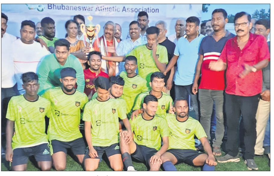
ଅତିଥି ଓ କର୍ମଚାରୀଙ୍କ ସମ୍ମାନରେ ଚାମ୍ପିୟନ ଦଳର ଖେଳାଳି ।