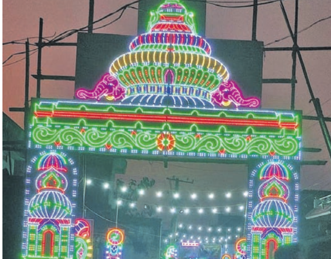
ଶୋଭା ପାଇବାକୁ ଥିବା ଏକଲତା ଲାଇଟ୍ ଗେଟ୍ ନକଲ।

ନୀଳଚକ୍ର ମାର୍କେଟ ବ୍ୟବସାୟୀ ସଂଘ ପୂଜା କମିଟି ■ ପ୍ରତିଦିନ ଶ୍ରୀକାଳୁଙ୍କ ପାଇଁ ପ୍ରସାଦ ସେବନ ବ୍ୟବସ୍ଥା ■ ୧୫ଜଣ ଭଲ୍ୟୁଣ୍ଟିୟର ନିଯୋଜିତ ହେବେ