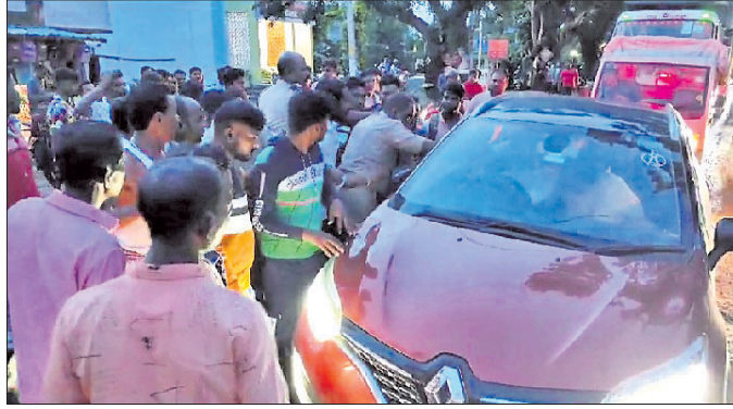
ଦୁର୍ଘଟଣାପରେ ସ୍ଥାନୀୟ ଲୋକେ ରାସ୍ତାରେ କରୁଛନ୍ତି

ବାରଙ୍ଗ ଥାନା ଅଧୀନ ବାରଙ୍ଗ- ବାଙ୍କୀ ରାସ୍ତାର ପୁଣ୍ୟପୁରାଣ ଖେଳପଡ଼ିଆ ଆଗରେ ଏକ ୧୦ ଚକିଆ ତ୍ରୁକ ଗୁରୁବାର ସନ୍ଧ୍ୟାରେ ଜଣେ ସାଇକେଲ ଆରୋହୀଙ୍କୁ ପଛପଟରୁ ଧକ୍କା ଦେଇ ତାଙ୍କ ଉପରେ ଚଢ଼ି ଯିବାକୁ ଘଟଣାସ୍ଥଳରେ ତାଙ୍କର ମୃତ୍ୟୁ ଘଟିଛି। ଦୁର୍ଘଟଣା ଘଟଣା ତ୍ରୁକ ଚଳାଇ ଘଟଣାସ୍ଥଳରୁ ଫେରାର ହୋଇଯାଇଛନ୍ତି। ଏହାକୁ ନେଇ ସ୍ଥାନୀୟ ଗ୍ରାମର ଉତ୍ତମକୁ ଲୋକ ମୃତକଙ୍କ ପରିବାରକୁ କ୍ଷତିପୂରଣ ଦାବି ନେଇ ରାସ୍ତା ଅବରୋଧ କରିଥିଲେ। ବାରଙ୍ଗ ପୋଲିସ ଘଟଣାସ୍ଥଳରେ ପହଞ୍ଚି ବୁଧାଶୁକ୍ଳ ପରେ ଅଧ୍ୟକ୍ଷରେ ରାସ୍ତା ଅବରୋଧ ହଟିଥିଲା। ପୋଲିସ ଉକ୍ତ ଦୁର୍ଘଟଣା ଘଟଣାପ୍ରସଙ୍ଗ ତ୍ରୁକକୁ ଜବତ କରିବା ସହ ଏକ ଅପମୃତ୍ୟୁ ମାମଲା