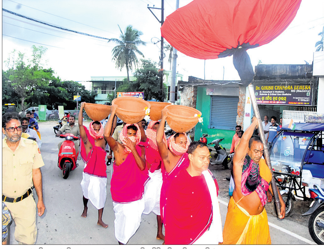
ଆଲାମତଖା ମନ୍ଦିରକୁ ଶ୍ରୀମନ୍ଦିରକୁ ସପ୍ତପୁରୀ ଚାଡ଼କୁ ପାରମ୍ପରିକ ରିତ୍ୟାଚିତ୍ରେ ନିଆଯାଉଛି ।

ପବିତ୍ର ଭାବେ ମାସ ଅମାବାସ୍ୟାକୁ ସପ୍ତପୁରୀ ଅମାବାସ୍ୟା ଭାବରେ ବିବେଚନା କରାଯାଇଥାଏ। ସପ୍ତପୁରୀ ଅମାବାସ୍ୟାରେ ଶ୍ରୀମନ୍ଦିରରେ ମହାପ୍ରଭୁଙ୍କୁ ମାଟିରେ ନିର୍ମିତ ଚାଡ଼ ମଧ୍ୟରେ ସାତପୁରୀ ଦିଆ ଯାଏ। ଆଜି ଭୋଗ ହୋଇଥାଏ। ଶୁକ୍ରବାର ସପ୍ତପୁରୀ ଅମାବାସ୍ୟା (ମଳ) ପଡ଼ୁଥିବାରୁ ଶ୍ରୀମନ୍ଦିର ପରମ୍ପରା ଅନୁଯାୟୀ ଗୁରୁବାର ଆଲାମତଖା ମନ୍ଦିରକୁ ଶ୍ରୀମନ୍ଦିରକୁ ସପ୍ତପୁରୀ ଚାଡ଼ ବିଜେ ହୋଇଛି। ଗୁରୁବାର ଶ୍ରୀମନ୍ଦିରରେ ମହାପ୍ରଭୁଙ୍କୁ ବ୍ରହ୍ମହର ଧୂପପରେ ଶ୍ରୀମନ୍ଦିରକୁ ପଞ୍ଚ ଛତା, କାହାଳି ଅଠରନକାନ୍ଥ ଆଲାମତଖା ମନ୍ଦିରକୁ ଯାଇଥିଲେ। ମା'ଙ୍କ ନିକଟରେ ବିଶେଷ ନୀତି ସମ୍ପନ୍ନ ହେବାପରେ କୁନ୍ଦାର ବିଶୋଳ ସେବକମାନେ ବାସ୍ତୁହାସି ବାସି ଆଲାମତଖା ଠାକୁରାଣୀଙ୍କ ପୀଠକୁ ୪ଟି ସାତପୁରୀ ଚାଡ଼ ଶ୍ରୀମନ୍ଦିରକୁ ବିଜେ କରିଥିଲେ। କୁନ୍ଦାର ବିଶୋଳମାନେ ପୁଣିରେ ଚାଡ଼ଗୁଡ଼ିକୁ ମୁଣ୍ଡାଇ ଚାଲିଗଲି ଘଣ୍ଟ, ଓଲାର କାହାଳୀ ସହ ଶ୍ରୀମନ୍ଦିରକୁ ଆସିଥିଲେ। ଚାଡ଼ଗୁଡ଼ିକ ଶ୍ରୀମନ୍ଦିର ପରିସରରେ ପହଞ୍ଚିବା ପରେ ଶ୍ରୀମନ୍ଦିର ଭିତର ବେଢ଼ାରେ ସେଗୁଡ଼ିକୁ ଗୋଟିଏ ଥର ବୁଲାଇ