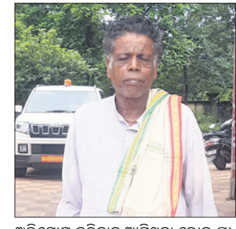
ଅଭିଯୋଗ କରିବାକୁ ଆସିଥିବା ଭୋଇ ପ୍ରଧାନ

୧୫୩୨୭୭୧୭୧୭। ବର୍ତ୍ତମାନ ପୁଣି ତାଙ୍କ ବ୍ୟାଙ୍କ ଆକାଉଣ୍ଟକୁ ପ୍ରଥମ କିସ୍ତି ଆସିନାହିଁ। ଏନେଇ ସେ ପଞ୍ଚାୟତ ଅଧିକାରୀଙ୍କୁ ବ୍ଲକ୍ କାର୍ଯ୍ୟାଳୟକୁ ଚାଲି ଚାଲି ନିୟତ ହେଲେଣି। କେବଳ ପ୍ରତିଷ୍ଠିତ ଦିଆଯାଉଛି, ଓଡି/୨୩/୦୦୯/୯୩୦୫/୨୧-୨୨/ ରେଜିଷ୍ଟ୍ରେସନ ନଂ.୭୫୫୫ ଅଭିଯୋଗ କରିଛନ୍ତି। ଏପରିକି ଏନେଇ