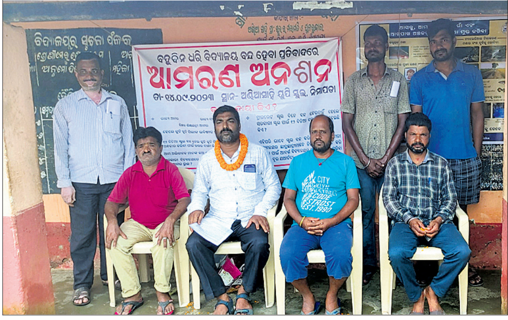
ଅଖିଆ ସାହି ଉ.ପ୍ରା. ବିଦ୍ୟାଳୟରେ ଅନଶନରେ ବସିଥିବା ଅଭିଭାବକ ।

କାକଟପୁର, ୧୫ (ଶୁଭବର୍ଷନ ମିଶ୍ର) ଦିନକୁ ଦିନ ରାଜ୍ୟରେ ଦୁର୍ଘଟଣାର ହାର ବଢ଼ିବାରେ ଲାଗିଛି। ବେପାରୀ ଆଡ଼ିତାଳନା ଆଉ ବିନା ହେଲମେଟ୍, ଦ୍ରୁତଗତିରେ ଗାଡ଼ି ଚାଳନା ଆଦି ଘଟଣାକୁ ଦୃଷ୍ଟିରେ ରଖି କାକଟପୁର ଥାନା ଅଧିକାରୀ ଉପେଶ ସାହୁଙ୍କ ନେତୃତ୍ୱରେ କାକଟପୁର ପୋଲିସର ସ୍ୱତନ୍ତ୍ର ଟିମ୍ କାକଟପୁର ନୂଆ ବସଷ୍ଟାଣ୍ଡ ସମ୍ମୁଖରେ ଗୁରୁବାର ଏକ ଗ୍ରାଉଁଜ ସଚେତନତା କାର୍ଯ୍ୟକ୍ରମ କରିଛନ୍ତି। ୨ ଚକିଆ ଗାଡ଼ି ଚାଳକଙ୍କୁ ହେଲମେଟ୍ ପିନ୍ଧି ଗାଡ଼ି ଚଳାଇବା ଓ ୪ ଚକିଆ ଯାନ ଚାଳକଙ୍କୁ ସିଟବେଲ୍ଟ ବାନ୍ଧି ଗାଡ଼ି ଚଳାଇବାକୁ ତାରିବା କରିଥିଲେ। ଯେଉଁମାନେ ହେଲମେଟ୍ ବ୍ୟବହାର କରି ଗାଡ଼ି ଚଳାଉଥିଲେ, ସେମାନଙ୍କୁ କାକଟପୁର ପୋଲିସ ପକ୍ଷରୁ ଏକ ଗୋଲାପ ଫୁଲ ଦିଆଯାଇ ସ୍ୱାଗତ କରାଯାଇଥିଲା। ଆଉ ଯେଉଁମାନେ ବିନା ହେଲମେଟ୍ ଆଉ ସିଟବେଲ୍ଟରେ ଗାଡ଼ି ଚଳାଉଛନ୍ତି, ସେମାନଙ୍କୁ ସଚେତନତା କରାଯାଇଥିଲା। କାକଟପୁର ପୋଲିସର ସ୍ୱତନ୍ତ୍ର ଟିମ୍, କାକଟପୁର ଥାନା ପକ୍ଷରୁ ଏହି ସଚେତନତା କାର୍ଯ୍ୟକ୍ରମ କୁ ବିଭିନ୍ନ ମହଲରେ ପ୍ରଶଂସା ମିଳିଛି।