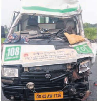
ବୋଲଗଡ଼, ୧୪୯୯ (ଦେବଦ୍ରତ ହୋତା)

ତ୍ରିକ ପଛକୁ ଧକାଦେଲା ଆୟୁଲାନୁ ଡ୍ରାଇଭର, ସହାୟକ ଗୁରୁତର