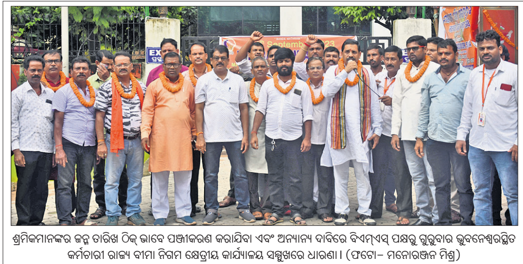
ଶ୍ରମିକମାନଙ୍କର ଜନ୍ମ ତାରିଖ ଠିକ୍ ଭାବେ ପଞ୍ଜୀକରଣ କରାଯିବା ଏବଂ ଅନ୍ୟାନ୍ୟ ଦାବିରେ ବିଏମ୍ଏସ୍ ପକ୍ଷରୁ ଗୁରୁବାର ଭୁବନେଶ୍ୱରସ୍ଥିତ କର୍ମଚାରୀ ରାଜ୍ୟ ବାମା ନିଗମ କ୍ଷେତ୍ରୀୟ କାର୍ଯ୍ୟାଳୟ ସମ୍ମୁଖରେ ଧାରଣା।