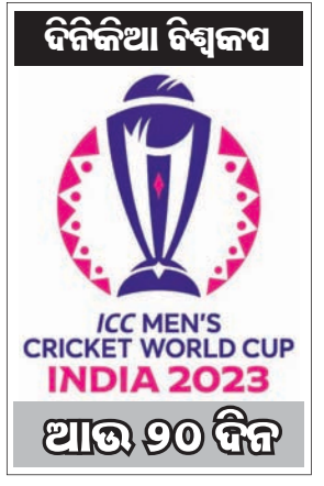
ଆଉ ୨୦ ଦିନ