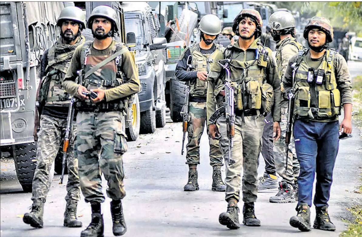
ଜଣ୍ଠା-କଣ୍ଠାର ଅନନ୍ତନାଗପୁର କୋକେନାଗରର ଶୁକ୍ରବାର ଆତଙ୍କବାଦୀଙ୍କ ସହ ଯବାନଙ୍କ ଭୁଲି ବିନିମୟବେଳେ ମାର୍ଚ୍ଚ ପାଖ।

ବାଂଲାଦେଶ ବିପକ୍ଷ ଏସିଆକପ୍ ସୁପର-୪ ମ୍ୟାଚରେ ଶତକ ହାସଲ କରିଛନ୍ତି ଭାରତୀୟ ବ୍ୟାଟର ଶୁଭମନ ଗିଲ୍ଟ।