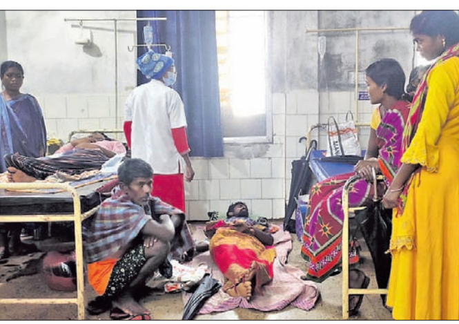
ଡାକ୍ତରଖାନାରେ ଚିକିତ୍ସିତ ହେଉଥିବା ଆକ୍ରାନ୍ତ।