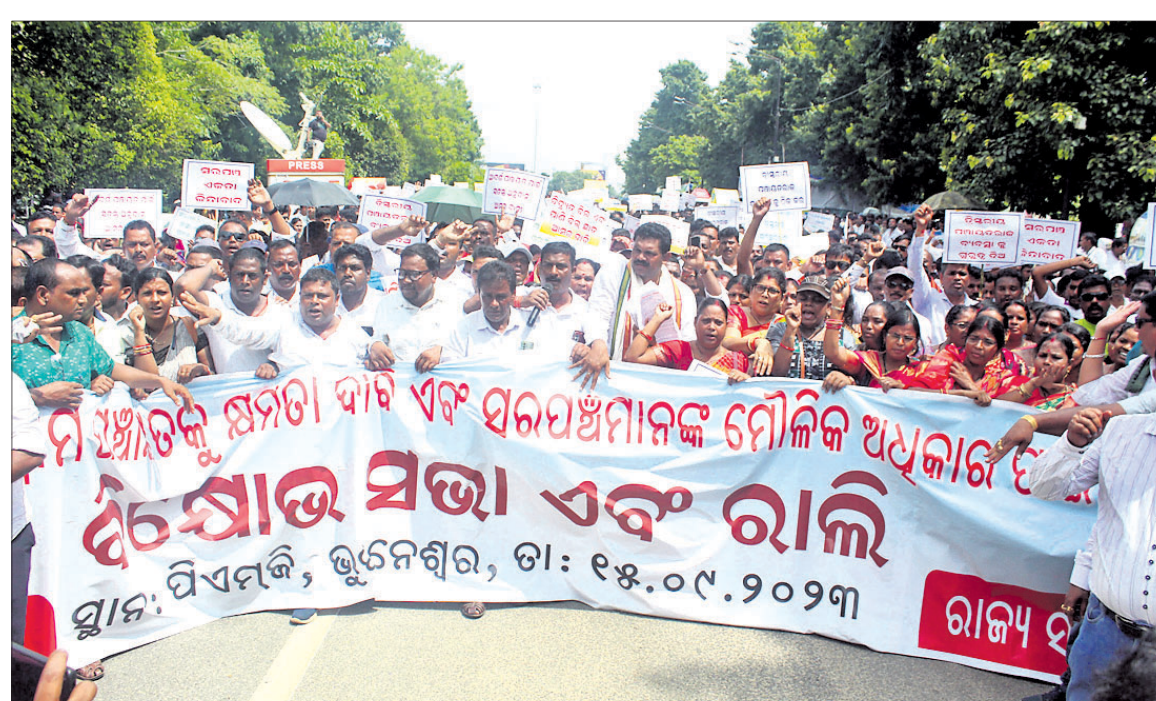
୧୫ ଦିନ ବାଦି ନେଇ ରାଜ୍ୟ ସରପଞ୍ଚ ମହାସଂଘ ପକ୍ଷରୁ ଶୁକ୍ରବାର ଭୁବନେଶ୍ୱର ମାଷ୍ଟରକ୍ୟାଣ୍ଟିନକୁ ବିଧାନସଭା ଅଭିମୁଖେ ବାହାରିଥିବା ଶୋଭାଯାତ୍ରା।