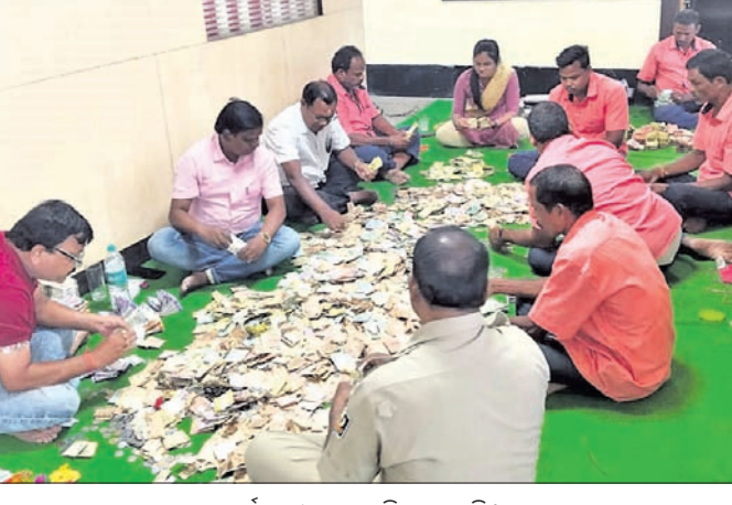
କର୍ମଚାରୀମାନେ ଗଣିତ କରୁଛନ୍ତି।