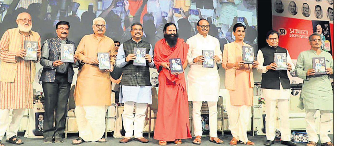
ପୁସ୍ତକ ଉଦ୍ଘାଟନ ଅବସରରେ କେନ୍ଦ୍ରମୁକ୍ତା ଧର୍ମେନ୍ଦ୍ର ପ୍ରଧାନ, ଯୋଗଗୁରୁ ବାବା ରାମ ଦେବ ଓ ଅନ୍ୟମାନେ।