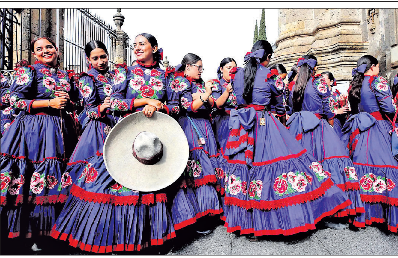
ମେକ୍ସିକୋର ଗୁଆତାଲାକାରାରେ ଅନ୍ତର୍ଜାତୀୟ ଚାରୋ ଦିବସ ପାଇନ ବେଳେ ପାରମ୍ପରିକ ବେଶଭୂଷାରେ ନୃତ୍ୟ କରୁଛନ୍ତି ମହିଳା।

ସହ ତୁଳନା କରିଥିଲେ। ତେବେ ଉକ୍ତ ଚର୍ଚ୍ଚା ଉପରେ ଚାଇନା ସରକାରୀ ସୂଚନା ପ୍ରତିରକ୍ଷା ମନ୍ତ୍ରାଳୟ ପକ୍ଷରୁ କୌଣସି ମତବ୍ୟ ଦିଆଯାଇ ନାହିଁ। ଲି ଶେଷ ଅର ପାଇଁ ଅଗଷ୍ଟ ୨୯ରେ ବେଞ୍ଜିଂରେ ଦେଖାଯାଇଥିଲେ। ଆଫ୍ରିକୀୟ ଦେଶଗୁଡ଼ିକର ସୁରକ୍ଷା ଫୋରମ୍‌କୁ ସେ ଉଦ୍‌ବୋଧନ ଦେଇଥିଲେ। ଅନ୍ୟ ଏକ ରିପୋର୍ଟ ଅନୁଯାୟୀ ଚାଇନା ପ୍ରତିରକ୍ଷା ମନ୍ତ୍ରୀଙ୍କ ବିରୋଧରେ ତଦନ୍ତ ଚାଲିଥିବା ଆମେରିକା ସରକାର ବିଶ୍ୱାସ କରୁଛନ୍ତି। ତେବେ କି ପ୍ରକାର ତଦନ୍ତ ଚାହା କ୍ଷେତ୍ର ଭାବେ ଜଣାପଡ଼ିନାହିଁ। ଚାଇନା ପ୍ରତିରକ୍ଷା ମନ୍ତ୍ରୀଙ୍କ ରହସ୍ୟମୟ ଉତ୍ତରକୁ ନେଇ ରାଷ୍ଟ୍ରପତି ଶି ଜିନ୍‌ପିଙ୍ଗ୍ ପ୍ରତି ଅଲୁକ୍ତ ରହିଛି।