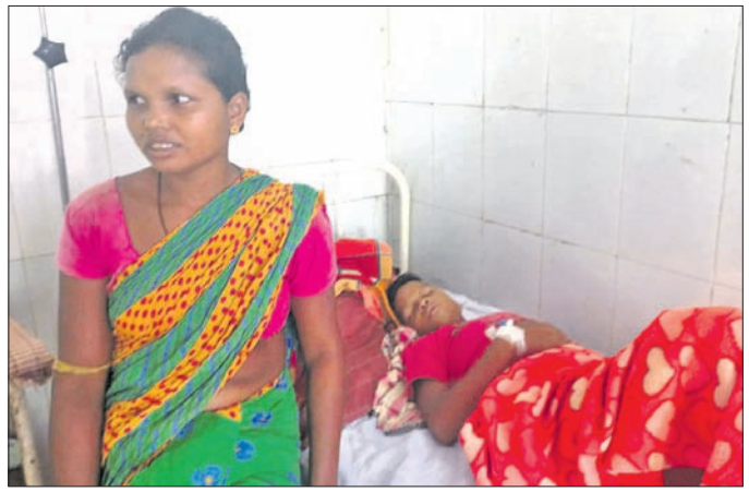
ଡାକ୍ତରଖାନାରେ ଚିକିତ୍ସାଧୀନ ଜଣେ ରୋଗୀ।