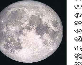
ଆମେରିକାର ହାୱାଉ ଯୁନିଭର୍ସିଟିର ଚନ୍ଦ୍ରଯାନ-୧

ବେଙ୍ଗାଳୁରୁ, ୧୫: ପୃଥିବୀର ଉଚ୍ଚ ଶକ୍ତିମୁକ୍ତ ଲାଇଫ୍‌ଲାଇନ୍‌କୁ ଚନ୍ଦ୍ର ସୃଷ୍ଟିରେ ଜଳ ପ୍ରସ୍ତୁତ କରାଯାଇପାରେ। ବୈଜ୍ଞାନିକମାନଙ୍କର ଏକ ନି୍ତ ଭାରତର ଚନ୍ଦ୍ରଯାନ-୧ ଲୁନାର ମିଶନ ପଠାଇଥିବା ରିପୋର୍ଟ ସେନ୍‌ସିଟିଭ ତଥ୍ୟ ଅନୁସାରେ ଏହା ଖଣିଜକୁ ପାଇଛନ୍ତି। ଉକ୍ତ ଆବିଷ୍କାର ନେତର ଆଷ୍ଟ୍ରେଲୋଇଡି ପତ୍ରିକାରେ ପ୍ରକାଶ ପାଇଛି।