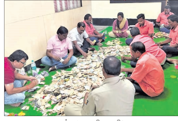
କର୍ମଚାରୀମାନେ ଗଣିତ କରୁଛନ୍ତି।