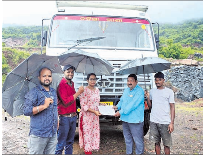
ଖଣି ଅଧିକାରୀଙ୍କ ପଥର ପରିବହନ ପାଇଁ ଟ୍ରକ ମାଲିକଙ୍କୁ ଇ-ପାସ ପ୍ରଦାନ କରୁଛନ୍ତି ।

ବାଲେଶ୍ୱର ଜିଲ୍ଲା ଖଇରା ତହସିଲ ଅଧୀନ ଶାରୀଶୁଆ ପାହାଡ଼ରେ ବିଭିନ୍ନ ପଥର ଖଣି ଦୀର୍ଘଦିନ ଧରି ବନ୍ଦ ରହିବା ପରେ ଏବେ ଖଣି ଓ ଇସ୍ପାତ ବିଭାଗ ଅଧୀନରେ ୩ଟି ଖଣିର ପୁନଃ ଚଳାଇ ପାଇଁ ଧୀରେ ଧୀରେ ବାଟ ପରିଷ୍କାର ହେଉଛି । ପ୍ରଥମ ପର୍ଯ୍ୟାୟରେ ଶାରୀଶୁଆ ବନ୍ଧନଟା ମୌଜାର ୫୧,୭୫ ଓ ୭୭ନମ୍ବର ଖଣିଗୁଡ଼ିକ ଚଳାଇବାକୁ ଜିଲ୍ଲାପାଳଙ୍କଠାରୁ ଅନୁମତି ମିଳିଛି । ତେବେ ମାନ୍ୟତାପ୍ରାପ୍ତ ଚାଲଣା ପରିବର୍ତ୍ତେ ଇ-ପାସ ଚାଲଣା କଟାଯାଇ ଏହି ଲଗୁକାର ଖଣିକ ପଦାର୍ଥ ବିକ୍ରୀ ପାଇଁ ଖଣି ଓ ଇସ୍ପାତ ବିଭାଗ ପକ୍ଷରୁ ନିର୍ଦ୍ଦେଶ ଦିଆଯିବା ପରେ ରୁକୁବାର ବାଲେଶ୍ୱର ଜିଲ୍ଲାରେ ପ୍ରଥମ