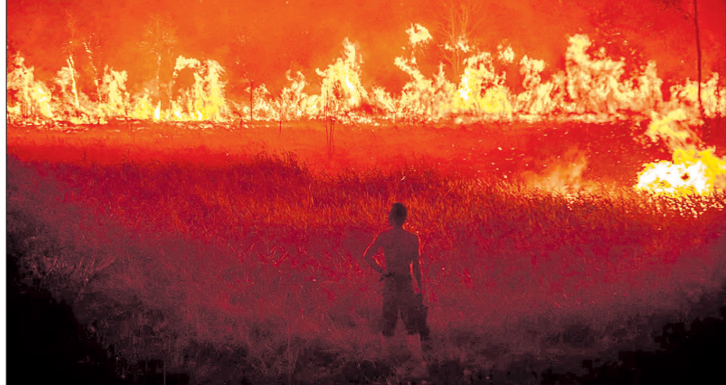
ଇଣ୍ଡୋନେସିଆର ଦକ୍ଷିଣ ସୁମାତ୍ରା ପ୍ରଦେଶରୁ ଉତ୍ତର ଇଣ୍ଡୋନେସିଆକୁ ଜଳାଇବାକୁ ଚାଲିଛି।

ନୂଆଦିଲ୍ଲୀ/ଓଶିଂଗନ, ୧୫ (ପ୍ରସ୍ତୁତ: ବୃତ୍ତାନ୍ତାଧିକାରୀ ମିଶ୍ର)