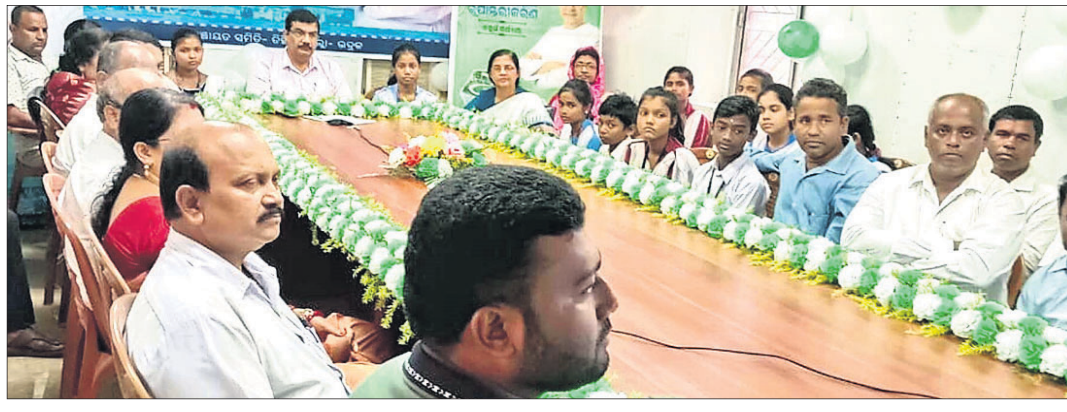
ରୁକ କାର୍ଯ୍ୟାଳୟରେ ଭିଡିଓ କନ୍ଫରେନ୍ସରେ ୫-ଟି ସଚିବଙ୍କ ସହ ବାର୍ତ୍ତାଳାପ ।