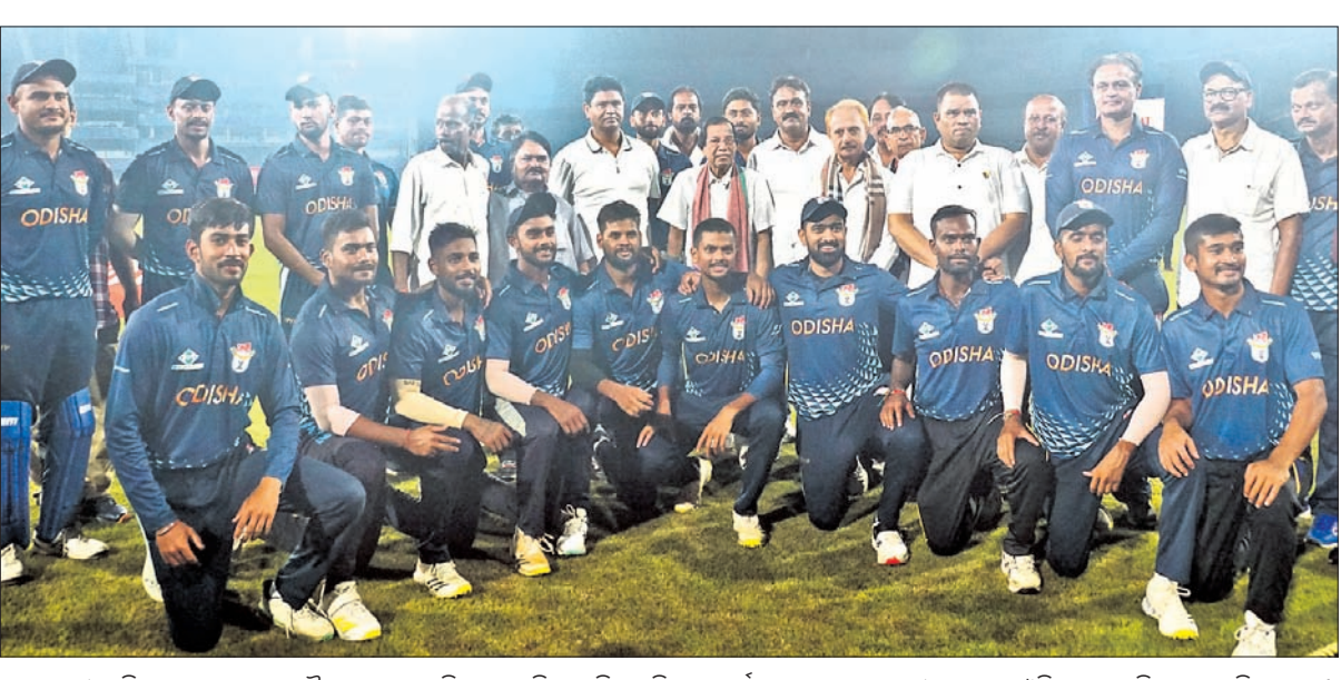
ଭାରତୀୟ ଷ୍ଟାଫ୍‌ରେ ଶୁକ୍ରବାର ଭେରବ ଚନ୍ଦ୍ର ମହାନ୍ତି ମେନୋରିଆଲ ଟି୨୦ କ୍ରିକେଟ ଚୁନାମେଣ୍ଟର ଉଦ୍‌ଘାଟନା ଉତ୍ସବରେ ଓଡ଼ିଶା ଖେଳାଳିଙ୍କ ସହ ଅତିଥିମାନେ।