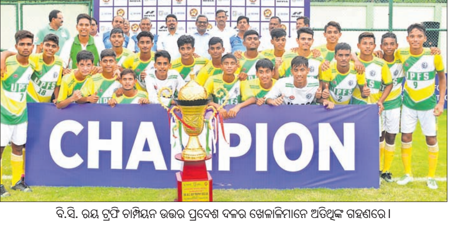
ବି.ସି. ରୟ ଟ୍ରଫି ଚାମ୍ପିୟନ ଉତ୍ତର ପ୍ରଦେଶ ଦଳର ଖେଳାଳିମାନେ ଅତିଥିଙ୍କ ଗହଣରେ।