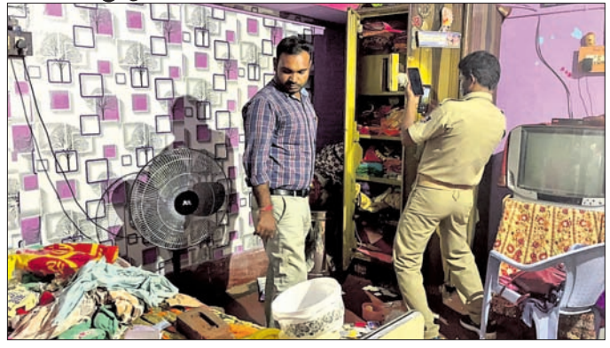
ଫୋଟୋଗ୍ରାଫିକ୍ ଚିତ୍ର ଚୋରି ଘଟଣାର ତଦନ୍ତ କରୁଛି।