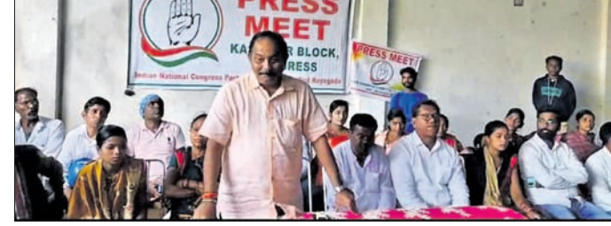
ଖବରଦାତା ସମ୍ମିଳନୀରେ ବରିଷ୍ଠ କଂଗ୍ରେସ ନେତା ଓ କର୍ମୀ।

ରାୟଗଡ଼ା/ଚିକିରି, ୧୫:୩୯ (ଅଗଷ୍ଟ ରଞ୍ଜନ ପଣ୍ଡା/ପ୍ରଭାତ କୁମାର ବେହେରା)