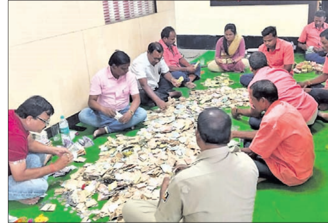
କର୍ମଚାରୀମାନେ ଗଣିତ କରୁଛନ୍ତି।