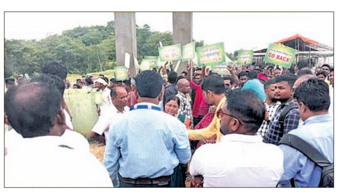
ଜନଶୁଣାଣି ସ୍ଥଳରେ ବିରୋଧର ସମ୍ମୁଖୀନ ହେଉଛନ୍ତି ଅଧିକାରୀ।

ସମ୍ବଲପୁର, ୧୫୩୯(ଶୁଭାଶିଷ ପାଠୀ) ଖାରସୁରୁ ଜିଲ୍ଲା ଲକ୍ଷ୍ମୀନଗର ବ୍ଲକ ବାଣିଜ୍ୟରେ ବର୍ଦ୍ଧିତ ପରିଚାଳନା ପୁଣ୍ୟ ପାଲି ରାମକା ଏନ୍ଡ୍ରେସୋ ସଭିସେସ ନାମକ କମ୍ପାନୀକୁ ଜମି ଦେବା ଲାଗି ଶୁକ୍ରବାର ପ୍ରଶ୍ନାସନ ପକ୍ଷରୁ ଆୟୋଜିତ ଜନଶୁଣାଣି ବାଟିଲ ହୋଇଛି।