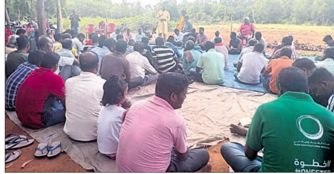
ନିବାକରପୁର, ୧୫।୯ (ମନସ ଚନ୍ଦ୍ର ପଟ୍ଟନାୟକ)

ଖୋର୍ଦ୍ଧା ଜିଲ୍ଲା ଟାଙ୍ଗା ବ୍ଲକ୍ ବଡ଼ପୋଖରିଆ ମଞ୍ଚଳ କମାଗୁରୁ ପଞ୍ଚାୟତର ଏକ ଫାର୍ମ ହାଉସିଓରେ ଶୁକ୍ରବାର ଭାଜପାର ୧୬୫ ଓ ୧୬୬ ରୁଥ୍ କମିଟି ଗଠନ ଏବଂ ରୁଥ୍ ସଶକ୍ତୀକରଣ ଦୈଓକ ଅନୁଷ୍ଠିତ ହୋଇଯାଇଛି। ଏହି କାର୍ଯ୍ୟକ୍ରମ ଆରମ୍ଭ ହେବା ପୂର୍ବରୁ ରାଜ୍ୟ କାର୍ଯ୍ୟକାରୀଣା ସଦସ୍ୟ କାଳୁଚରଣ