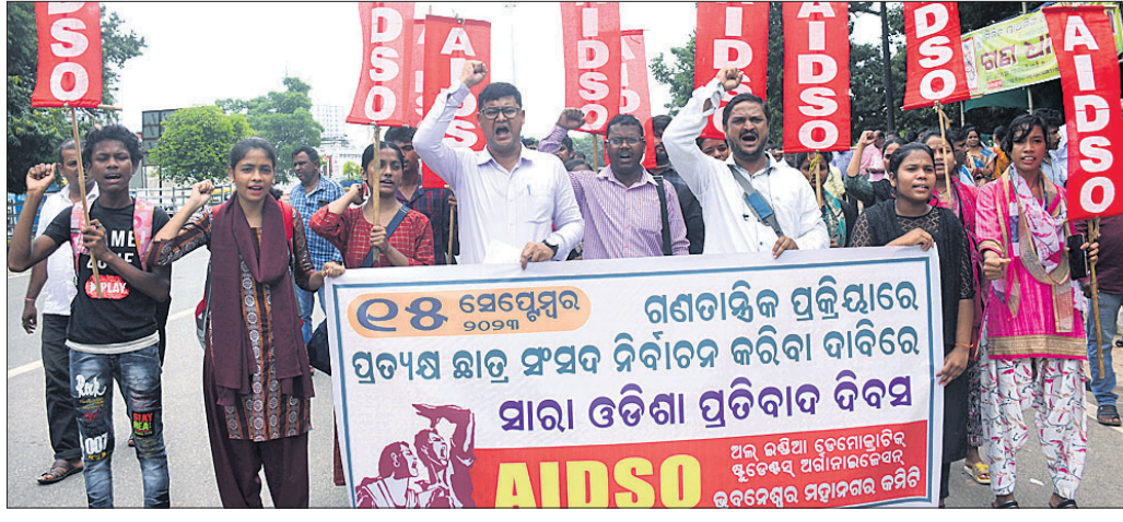
ଛାତ୍ରଛାତ୍ରୀ ଓ ଏଆଇଡିଏସ୍ କର୍ମଚାରୀଙ୍କ ପକ୍ଷରୁ ଲୋକସଭା ପିଏମ୍‌ଜିରେ ବିକ୍ଷୋଭ ପ୍ରଦର୍ଶନ କରାଯାଇଛି।