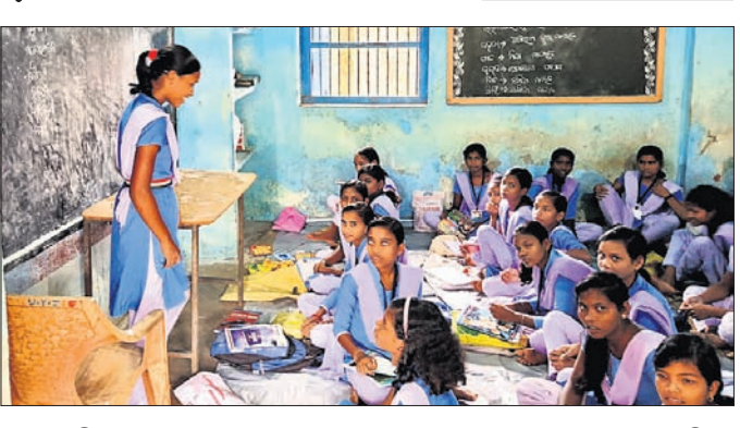
ଆଠମଲିକ ବ୍ଲକର ଏକ ସ୍କୁଲରେ ସହପାଠୀମାନଙ୍କୁ ଜଣେ ମେଧାବୀ ଛାତ୍ରୀ ପଢ଼ାଉଛନ୍ତି।