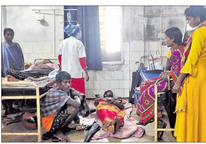
ଡାକ୍ତରଖାନାରେ ଚିକିତ୍ସିତ ହେଉଥିବା ଆକ୍ରାନ୍ତ।

ଦଶମକ୍ରମ, ୧୫୩୯(ଅରବିନ୍ଦ ନାୟକ) କୋରାପୁଟ ଜିଲ୍ଲା ଦଶମକ୍ରମର ଚଳଣି ୨ ପଞ୍ଚାୟତରେ ଖାତାବାଦି ଦେଖାଦେଇଛି। ଏଥିରେ ୨ ଜଣଙ୍କ ମୃତ୍ୟୁ ଘଟିଛି।