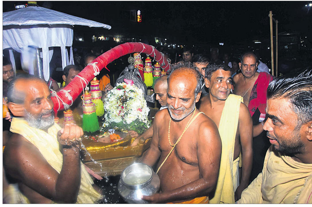
ଶୁକ୍ରବାର ଶ୍ରୀମନ୍ଦିରରେ ନାତି ବିକ୍ରମ ଯୋଗୁ ରାତିରେ ଅମାବାସ୍ୟା ନାରାୟଣଙ୍କ ସାଗରବିଜେ ନାତି ସମ୍ପନ୍ନ କରାଯାଇଛି।

ଘରୋଇ ହସ୍ତିଚାଳରେ ଚାକିରି ନାଁରେ ୧୦ ଲକ୍ଷରୁ ଅଧିକ ଟଙ୍କା ଠକେଇ ହୋଇଛି। ଠକାମିର ଶିକାର ହୁଏତାମୁବକ ଏନେଇ ନୟାପଲ୍ଲୀ ଥାନାରେ ଆଣିଷ୍ଠ କୁମାର ନାୟକ ଅଭିଯୋଗ କରିଛନ୍ତି। ଗତ କିଛି ମାସ ତଳେ ଆଣିଷ୍ଠ ସିଆରପିଏସ୍ ଛକ ନିକଟରେ ଏକ ଅଫିସ ଖୋଲି ଚାକିରି ଦେବାକୁ ଅନ୍ୟାୟନରେ ବିଜ୍ଞାପନ ଦେଇଥିଲେ। ଏହାକୁ ଦେଖି ବେକାର ହୁଏତାମୁବକ ଉକ୍ତ ବିଜ୍ଞାପନରେ ଦିଆଯାଇଥିବା ନମ୍ବରରେ ଉକ୍ତ ହୁଏତାମୁବକ ଯୋଗାଯୋଗ କରିଥିଲେ। ବିଭିନ୍ନ ଘରୋଇ ହସ୍ତିଚାଳରେ ଚାକିରି କରାଇବାକୁ ପ୍ରତିଶ୍ରୁତି ଦେଇ ଲକ୍ଷାଧିକ ଟଙ୍କା ଠକେଇ ଅଫିସ ବନ୍ଦ କରିଦେଇଥିଲେ।