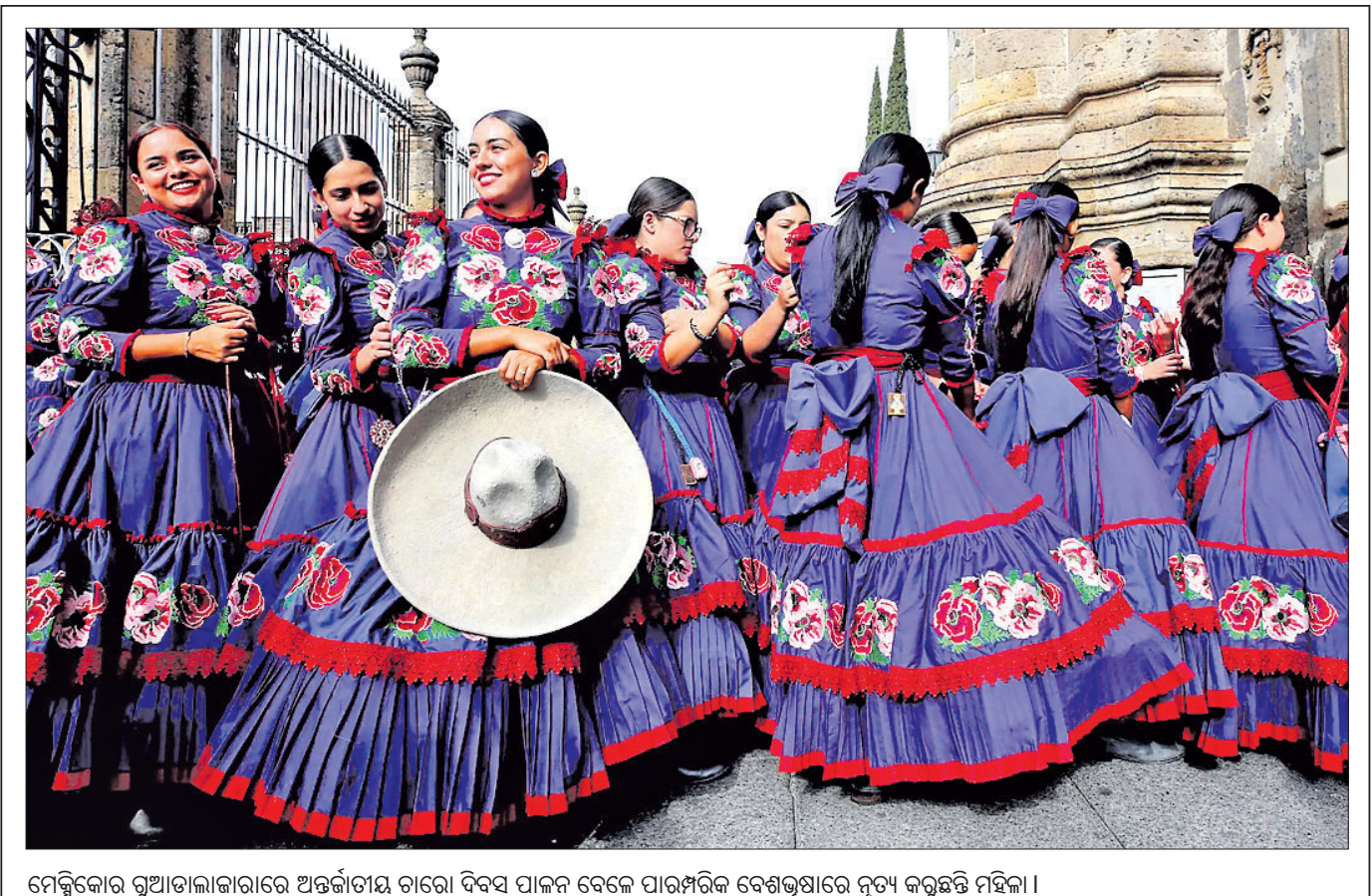
ମେକ୍ସିକୋର ଗୁଆତାଲାକାରାରେ ଅନ୍ତର୍ଜାତୀୟ ଚାରୋ ଦିବସ ପାଳନ ବେଳେ ପାରମ୍ପରିକ ବେଶଭୂଷାରେ ନୃତ୍ୟ କରୁଛନ୍ତି ମହିଳା।

ଦେଉଛନ୍ତି। ପ୍ରଧାନ ବିଚାରପତି ଡି.ଓ.ଲ. ଚନ୍ଦ୍ରଚୂଡ଼ଙ୍କ ଖଣ୍ଡପାଠ କହିଛନ୍ତି, ଏକ ଲେଖାରେ ଭୁଲ୍ ବିବୃତି ରହିବା ୧୫୩୩ ମଧ୍ୟରେ ଶତ୍ରୁତା ବଢ଼ାଇବା କିପରି ବୋଲି ସୁପ୍ରିମକୋର୍ଟ ଶୁକ୍ରବାର ପ୍ରଶ୍ନ କରିଛନ୍ତି।