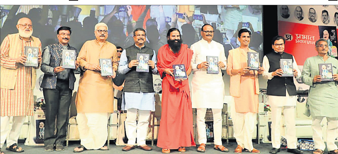
ପୁସ୍ତକ ଉଦ୍ଘାଟନ ଅବସରରେ କେନ୍ଦ୍ରମନ୍ତ୍ରୀ ଧର୍ମେନ୍ଦ୍ର ପ୍ରଧାନ, ଯୋଗରାଜ ବାବା ରାମ ଦେବ ଓ ଅନ୍ୟମାନେ।