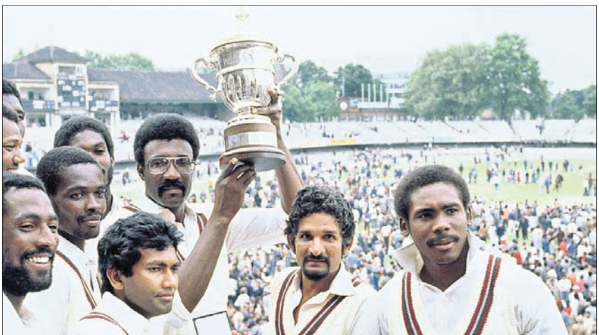
୧୯୭୯ରେ ବିଶ୍ୱକପ ବିଜୟୀ ଷ୍ଟେସ୍‌କ୍ରିକେଟ ଦଳ ।

ଆଇସିସି ଦିନକିଆ କ୍ରିକେଟ ବିଶ୍ୱକପର ଦ୍ୱିତୀୟ ସଂସ୍କରଣ ସେହି ଇଂଲଣ୍ଡରେ ୧୯୭୯ରେ ଅନୁଷ୍ଠିତ ହୋଇଥିଲା । ୯ରୁ ୨୩ ଜୁନ ପର୍ଯ୍ୟନ୍ତ ଅନୁଷ୍ଠିତ ପ୍ରତିଦିନିଆ କପରେ ଷ୍ଟେସ୍‌କ୍ରିକେଟ ଆଧିପତ୍ୟ ବଜାୟ ରଖି ପୁଣି