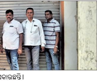
ବିଦ୍ୟୁତ୍ କାର୍ଯ୍ୟାଳୟରେ ସରପଞ୍ଚମାନେ ତାଲା ପକାଇଛନ୍ତି