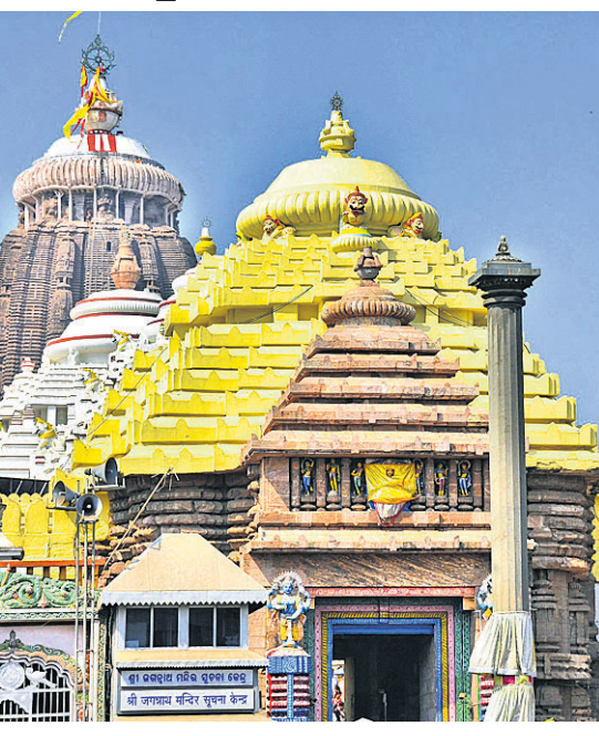
ତେବେ ସକାଳ ୮ଟାରେ ଗୋପାଳବଲ୍ଲଭ ନୀତି ହେବା ପରିବର୍ତ୍ତେ ବହୁ ବିଳମ୍ବରେ ଅର୍ଥାତ୍ ସନ୍ଧ୍ୟା ୫ଟା ପରେ ହୋଇଥିଲା। ସେହିପରି ଅନ୍ୟାନ୍ୟ ନୀତିରେ ମଧ୍ୟ ବିଳମ୍ବ ଘଟିଥିଲା। ସପ୍ତପୁରୀ ନୀତି ଦିନ ପରିବର୍ତ୍ତେ ରାତି ପ୍ରାୟ ୭ଟାରେ ହୋଇଥିଲା। ଅପରାହ୍ଣ ୨ଟାରେ