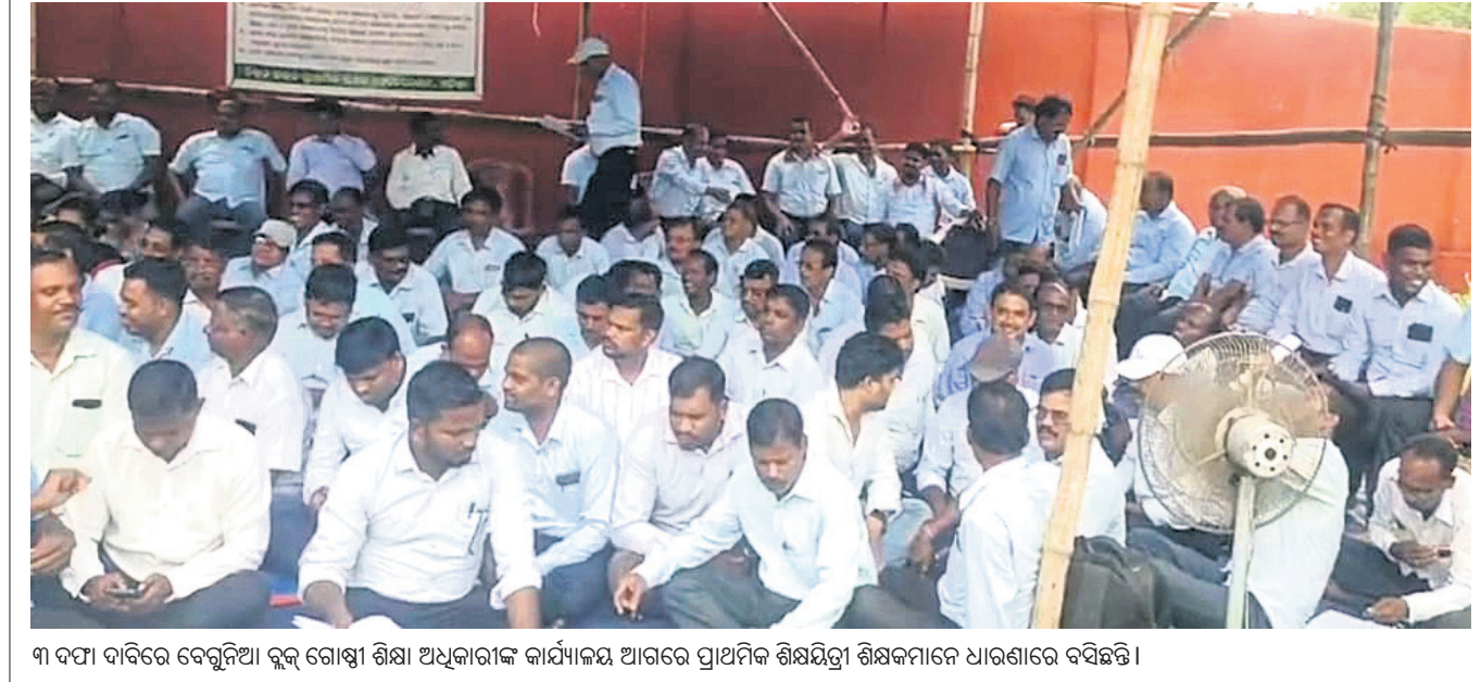
୩ ଦମ୍ପା ଦାବିରେ ବେଗୁନିଆ ବୁକ୍ ଗୋଷ୍ଠୀ ଶିକ୍ଷା ଅଧିକାରୀଙ୍କ କାର୍ଯ୍ୟାଳୟ ଆଗରେ ପ୍ରାଥମିକ ଶିକ୍ଷୟିତ୍ରୀ ଶିକ୍ଷକମାନେ ଧାରଣାରେ ବସିଛନ୍ତି।

କରି ବର୍ଷକ ପରିବାର ଚଳାଇବା କଷ୍ଟକର ହୋଇପଡ଼ୁଛି। ଏବେ ମଧ୍ୟ ଏହି ବିଭାଗରେ ସେବା ଯୋଗାଇଥିଲେ ମଧ୍ୟ ୬ମାସ କାମ କରି ଆଉ ୬ମାସ ବେକାର ରହିଥିବା କର୍ମଚାରୀଙ୍କୁ ଓଡ଼ିଶା ସରକାରଙ୍କ ସ୍ୱତନ୍ତ୍ର ବିକ୍ଷୋଭ ପ୍ରଦର୍ଶନରେ ଅଧୀନରେ ୧୯ ଜିଲ୍ଲାର କାର୍ଯ୍ୟାଳୟରୁ ୫୦୮ ଲାଜ୍ଜିତ୍ରାଜ୍ଜିତର ଓ ଖଲାସୀ ବର୍ଷ ବର୍ଷ ଧରି ୬ ମାସିଆ ଠିକା କର୍ମଚାରୀ ଭାବେ ବନ୍ୟା ଓ ବାତ୍ୟା ଭଳି ପ୍ରାକୃତିକ ବିପର୍ଯ୍ୟୟ ସମୟରେ କାମ କରୁଛନ୍ତି। ଜଣେ ତ୍ରାଜ୍ଜିତର ୧୧, ୧୦୦ ଟଙ୍କା ଓ ଖଲାସୀ ୧୦, ୧୦୦ ଟଙ୍କା ଦରମା ପାଉଛନ୍ତି। ୬ ମାସ କାମ