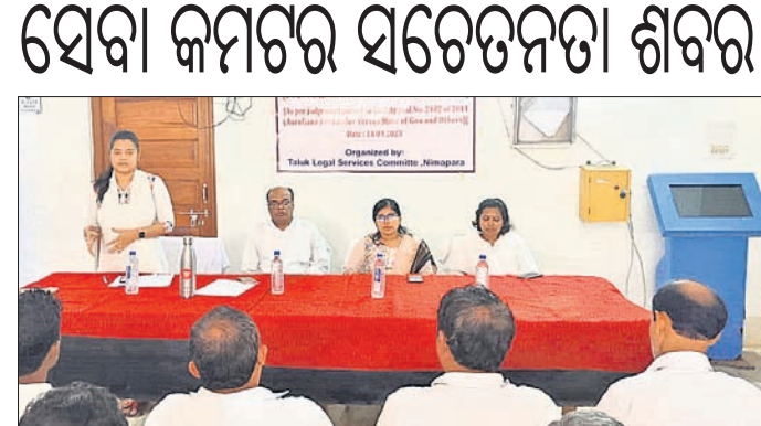
ଶିବିରରେ ବିଚାରବିଭାଗୀୟ ଅଧିକାରୀମାନେ ।