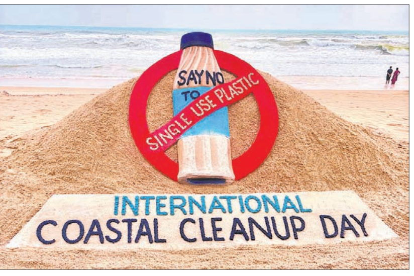
ଅନ୍ତର୍ଜାତୀୟ ଉପକୂଳ ସ୍ୱଚ୍ଛତା ଦିବସ ଉପଲକ୍ଷେ ଶୁକ୍ରବାର ପୁରୀ ବେଳାକୁମ୍ଭିରେ ପଦ୍ମଶ୍ରୀ ସୁଦର୍ଶନ ପଟ୍ଟନାୟକଙ୍କ ସତେଜତା ବାଣୀ ସମ୍ବଳିତ ବାଲୁକା କଳା।