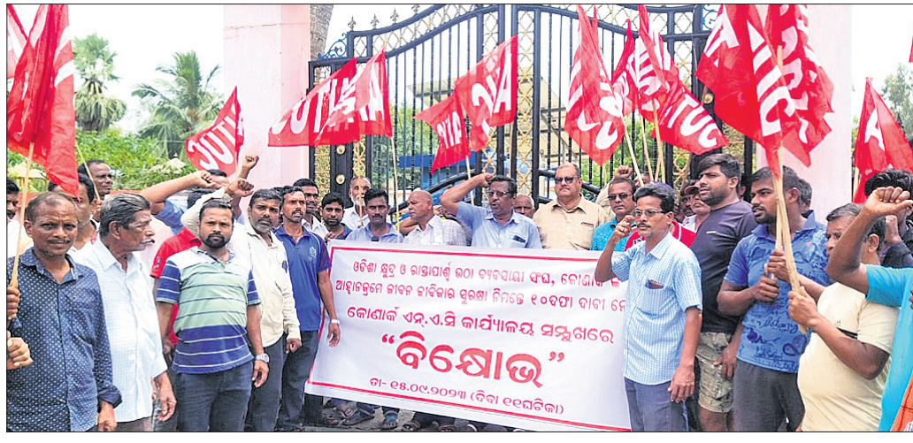
ଏନ୍ଏସି କାର୍ଯ୍ୟାଳୟ ଆଗରେ ଓଡ଼ିଶା ଛୁଦ୍ଦ ଓ ରାସ୍ତାପାର୍ଶ୍ୱ ଉଠା ବ୍ୟବସାୟୀ ସଂଘ କୋଣାର୍କ ଶାଖା ପକ୍ଷରୁ ବିକ୍ଷୋଭ ପ୍ରଦର୍ଶନ କରାଯାଇଛି ।

ଭେଣ୍ଟି ଜୋନ ପ୍ରତିଷ୍ଠା କରିବା, ପର୍ଯ୍ୟଟକଙ୍କ ହିତ ନିମନ୍ତେ ରାସ୍ତାର ମଧ୍ୟ ଭାଗରେ ବ୍ୟବସାୟ କରୁଥିବା ବ୍ୟବସାୟୀମାନଙ୍କୁ ସଂଘ କୋଣାର୍କ ଶାଖାର ଅନୁମତ ଗଲଣ କରିବା, ବ୍ୟବସାୟୀଙ୍କୁ ତ୍ରେଡ୍ ଲାଇସେନ୍ସ ଓ ପରିଚୟ ପତ୍ର ପ୍ରଦାନ, ବ୍ୟବସାୟୀଙ୍କୁ ସୁଧ ମୁକ୍ତ ରଖି ପ୍ରଦାନ ଏବଂ ଯେଉଁ ବ୍ୟବସାୟୀଙ୍କଠାରୁ ନିୟମିତ ଟିକସ ଆଦାୟ ଆଦି ଦାବି ପୂରଣ କରିବା ପାଇଁ