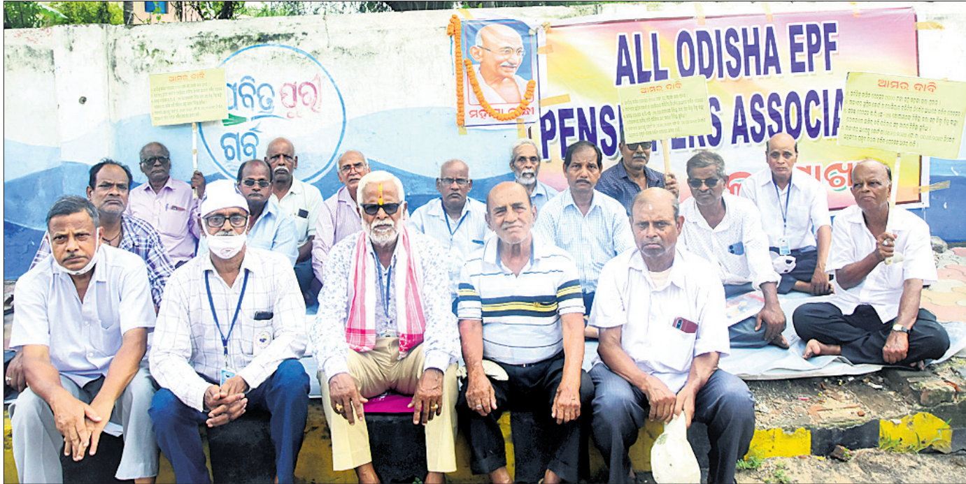
ବରିଷ୍ଠ ଉପିଏସ୍ ଫେଲୋସାରି ସଂଘର ସଭାସମାଜେ ବିଭିନ୍ନ ଦାବିନେଇ ଶୁକ୍ରବାର ପୂରୀ ଜିଲ୍ଲାପାଳଙ୍କ କାର୍ଯ୍ୟାଳୟ ସମ୍ମୁଖରେ ଧାରଣା ଦେଇଛନ୍ତି ।

କରାଯାଇଛି। ତେବେ ତାଙ୍କୁ ନିଲମ୍ବନ କରାଯାଇଥିବା ନେଇ କୌଣସି ସୂଚନା କିମ୍ବା ଚିଠି ନିଯୋଗ ପକ୍ଷରୁ ଦିଆଯାଇନାହିଁ। ସେହିପରି ସେ ଅନ୍ୟ ଜାତିରେ ବିବାହ କରିଥିବା କଥାକୁ ଅସ୍ୱୀକାର କରିଛନ୍ତି। ସେ ଶାନ୍ତିବନ୍ଧୁ ସେବକଙ୍କ ଉପରେ ବିବାହ ଅନୁଯାୟୀ ତାଙ୍କର ଆଜି ପାଳି ରହିଥିଲା। ତେଣୁ ସେ ପାଳି ଖଟିବାକୁ ନିର୍ଦ୍ଦିଷ୍ଟ କରାଯାଇଛି। ସମସ୍ତ ସେବାୟତ ପାଇଁ ଏହା ଶୁଭାକାଂକ୍ଷୀୟ। ସମସ୍ତ ସେବାୟତ ତାଙ୍କୁ ସହଯୋଗ କରିଥିଲେ। ତେଣୁ କ'ଣ ମାଲକମ ସାରି ପ୍ରାୟ ୩ ଘଣ୍ଟା ବସିବା ପରେ କେତେଜଣ ସେବାୟତ ଆସି ତାଙ୍କୁ ନିଯୋଗ ପକ୍ଷରୁ ସେବାରୁ ନିଲମ୍ବନ କରାଯାଇଥିବା କହିଥିଲେ। ପୂଜାପଣ୍ଡା ସେବକମାନଙ୍କ ପକ୍ଷରୁ ତାଙ୍କୁ ବିରୋଧ