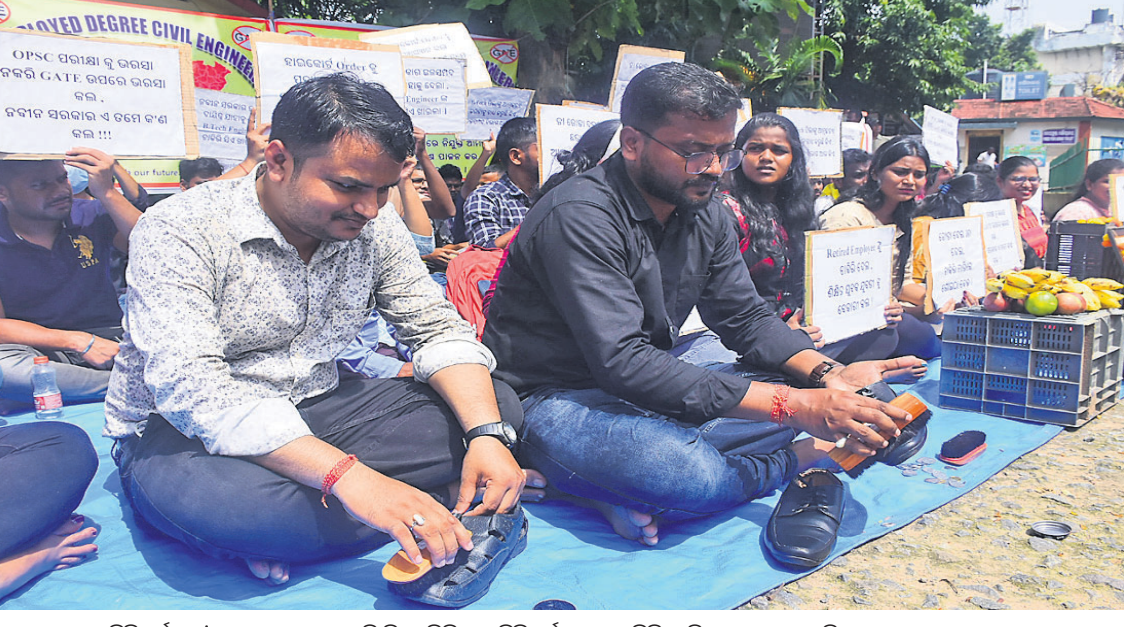
ଇଞ୍ଜିନିୟରିଂ ଡିପ୍ଲୋମା ବେକାରୀ ତ୍ରାପ୍ତ ସିଦ୍ଧିଲ୍ ଇଞ୍ଜିନିୟରିଂମାନେ ବାକି ଦାବିରେ ଭୁବନେଶ୍ୱରସ୍ଥିତ ସେବ ସଦନ ସମ୍ମୁଖରେ ଜୋରୀ ସମା କରିବା ସହ ପରିବା ବିକି ଅଭିଭବ ପ୍ରତିବାଦ କରୁଛନ୍ତି।