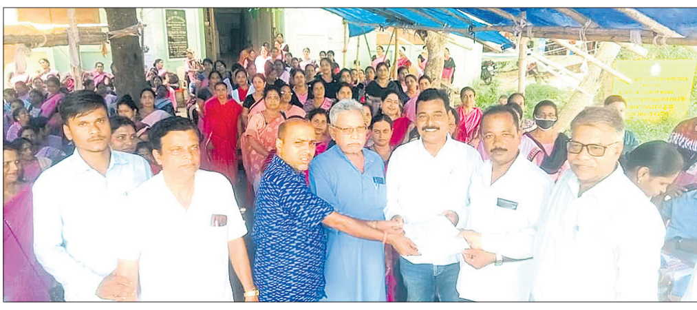
ପିପିଲିରେ ଧାରଣାତ ଶିକ୍ଷକମାନେ ବିଧାୟକଙ୍କ ପ୍ରତିନିଧିତ୍ୱ ଦାବିପତ୍ର ପ୍ରଦାନ କରୁଛନ୍ତି ।