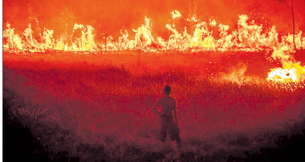
ଇଣ୍ଡୋନେସିଆର ଦକ୍ଷିଣ ସୁମାତ୍ରା ପ୍ରଦେଶରେ ଉତ୍ତର ଇନ୍ଦ୍ରାଜୟ ଜଙ୍ଗଲ ଜଳୁଛି।

ନୂଆଦିଲ୍ଲୀ/ଓଶିଂଗନ, ୧୫/୯ (ସ୍ପେଷ୍ଟି-ଭୁବନେଶ୍ୱର ସମ୍ବାଦକ)