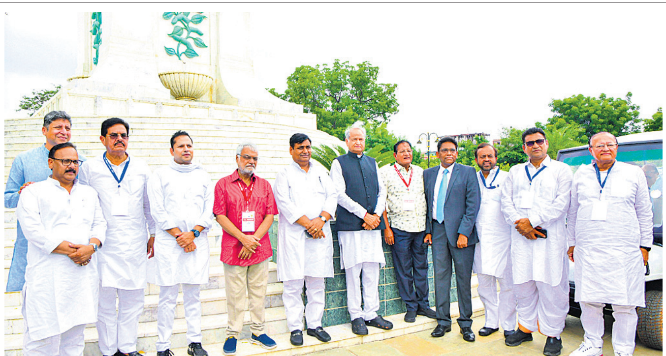
ରାଜସ୍ଥାନର କୋଟାଠାରେ ୧୨୦ କୋଟି ଟଙ୍କା ଏବଂ ପ୍ରାୟ ୩୦ ଏକର ପରିସୀମା ଜମିରେ ନିର୍ମିତ 'ଦି ଅକ୍ସିଜେନ ସିଟ୍ ପାର୍କ' (ଦି ଗାର୍ଡେନ ଅଫ୍ ଜୟ)କୁ ନିକଟରେ ରାଜସ୍ଥାନ ମୁଖ୍ୟମନ୍ତ୍ରୀ ଅଶୋକ କେହରବର ଆନୁଷ୍ଠାନିକ ଭାବେ ଲୋକାର୍ପଣ କରିଛନ୍ତି।

ବ୍ୟାଙ୍କ ଅଫ୍ ମହାରାଷ୍ଟ୍ରର ସମସ୍ତ ୪୯ଟି ଶାଖା ରହିଛି ଏବଂ ବ୍ୟାଙ୍କ ଅନୁକ୍ରମେ ୨୦୨୩ ବୁକ୍ସା ୩ଟି ଶାଖା ଏବଂ ଆର୍ଥିକ ବର୍ଷ ୨୦୨୩-୨୪ ବୁକ୍ସା ୯ ଶାଖା ଖୋଲିବାକୁ ଯୋଜନା ରହିଛି।