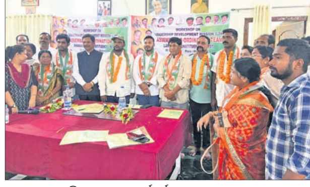
କଂଗ୍ରେସରେ ସାମିଲ ହୋଇଥିବା କର୍ମକର୍ତ୍ତା।