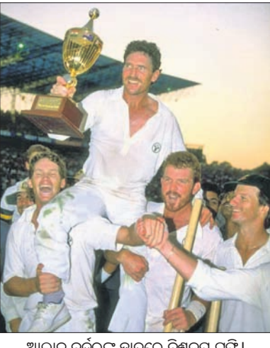
ଆଲାନ ବର୍ଡରଙ୍କ ହାତରେ ବିଶ୍ୱକପ୍ ଟ୍ରଫି ।

ଦିନିକିଆ କ୍ରିକେଟ ପୁରସ୍କାର ବିଶ୍ୱକପ୍ ଟ୍ରଫିରେ ଏସିଆନ୍ ଗ୍ରାଉଣ୍ଡମ୍ୟାନଙ୍କୁ ପୁରସ୍କାର ଦିଆଯାଇଥିଲା । ଏସିଆ ମହାଦେଶର ଦୁଇ ପଡୋଶୀ ରାଷ୍ଟ୍ର ଭାରତ ଓ ପାକିସ୍ତାନ ମିଳିତ ଭାବେ ଏହି ଟ୍ରଫିରେ ଅଧିକାର କରିଥିବା ବେଳେ ଏକ ନୂଆ ବିଶ୍ୱ ଚାମ୍ପିୟନ ଅଷ୍ଟ୍ରେଲିଆର ଆବିର୍ଭାବ ଘଟିଥିଲା । ରିଲ୍ୟାଏନ୍ ଏହି ବିଶ୍ୱକପ୍ ପ୍ରାୟୋଜକ ରହିଥିବା ବେଳେ ୮ ଦଳ ଅଂଶଗ୍ରହଣ କରି ୨୭ ମ୍ୟାଚ ଖେଳିଥିଲେ । ପ୍ରଥମ ଥର ପାଇଁ କ୍ରିକେଟ ବିଶ୍ୱକପ୍ ୫୦ ଓଭର ବିଶିଷ୍ଟ ମଧ୍ୟ କରାଯାଇଥିଲା । ଭାରତ, ଅଷ୍ଟ୍ରେଲିଆ, ନ୍ୟୁଜିଲାଣ୍ଡ ଓ ଜିମ୍ବାୱେ ଗ୍ରୁପ୍ ଏରେ ସ୍ଥାନ ପାଇଥିବା ବେଳେ ଗ୍ରୁପ୍ ବିରେ ସ୍ଥାନ ପାଇଥିଲେ ପାକିସ୍ତାନ, ଇଂଲଣ୍ଡ, ଦକ୍ଷିଣାଫ୍ରିକା ଓ ଶ୍ରୀଲଙ୍କା । ପୂର୍ବ ସଂସ୍କରଣ ଭଳି ଏହା ମଧ୍ୟ ଡଲାର ରାଉଣ୍ଡ ରବିନ୍ ଲିଗ୍ ଓ ନକ୍ସାଭିତ୍ତ ଫର୍ମାଟରେ ଖେଳା ଯାଇଥିଲା । ଗ୍ରାହାମ ଗୁରୁ ୪୭୧ ରନ ସହିତ