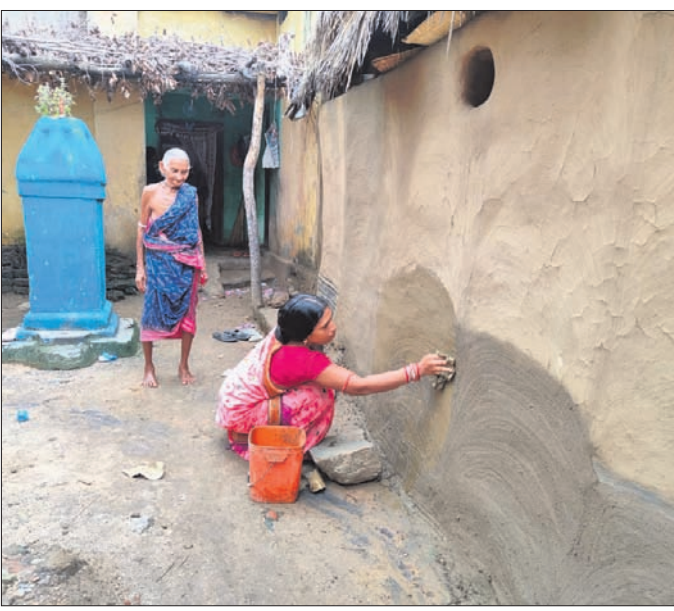
ପୁରୁଣାପାଣି ଗାଁରେ ନୂଆଁଖାଇ ପାଇଁ ମହିଳାମାନେ କାନ୍ଧ ଲିପା କାମରେ ଲାଗିଛନ୍ତି। ନୂଆଁଖାଇ ପ୍ରସ୍ତୁତି ଆରମ୍ଭ ହୋଇଛି। ମୟଙ୍କ ମାତା ବଢ଼ିଆ ପ୍ରଧାନାଙ୍କ କନ୍ଧିବା ଆଦିବାସୀ ନେତା ମଧ୍ୟ ପ୍ରଧାନାଙ୍କ ଘରେ

ପଶ୍ଚିମ ଓଡ଼ିଶାର ଗଣପର୍ବ ନୂଆଁଖାଇ ତିହାର ପାଇଁ ଘରେ ଘରେ ପ୍ରସ୍ତୁତି ଆରମ୍ଭ ହୋଇଯାଇଛି। ଆସନ୍ତା ୨୦ ତାରିଖ (ରଷି ପଞ୍ଚମୀ) ଦିନ ତିହାର ପାଳନ କରାଯିବ। ଏଥିପାଇଁ ଗାଁ, ସହରରେ ଉତ୍ସାହ ଓ ଉତ୍ସାହୀତା ପରିଲକ୍ଷିତ ହେଉଛି। ମହିଳାମାନେ ଘର ସଫେଇ କାମ ଆରମ୍ଭ କରିଦେଇଛନ୍ତି। ପାରମ୍ପରିକ ପୂଜା ଉପକରଣ, ବାସନକୁସନ ସଫେଇ କାମ ଆରମ୍ଭ ହୋଇଛି। ଗାଁ, ଘର ଲକ୍ଷ୍ମଦେବୀ କୋଠି ଚିତ୍ର, ରଙ୍ଗ କାମ ମଧ୍ୟ କରାଯାଉଛି। ସବୁଠି ନୂଆଁଖାଇର ନୂଆ ଉତ୍ସାହ ଦେଖାଯାଉଛି। ଦେଖିବାକୁ ସୁଗନ୍ଧାପାଣି ଗାଁରେ ଲୋକେ ନୂଆଁଖାଇ ପାଇଁ ସଜବାଜ ହୋଇଯାଇଛନ୍ତି। ମହିଳାମାନେ ଘରସ୍ୱାଚ୍ଛତା ଯୋଗ୍ୟ କରିବା ପରେ ପାରମ୍ପରିକ ମାଟିଘରେ ମାଟି ଲିପାପୋଛା କରିଛନ୍ତି। ଗାଁର ଆଦିବାସୀ ନେତା ମଧ୍ୟ ପ୍ରଧାନାଙ୍କ ଘରେ