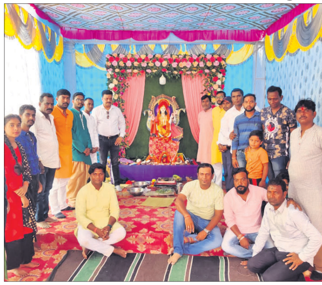
ବନ୍ଧମୁଣ୍ଡା ଲକ୍ଷ୍ମୀ ଅଫିସ ।