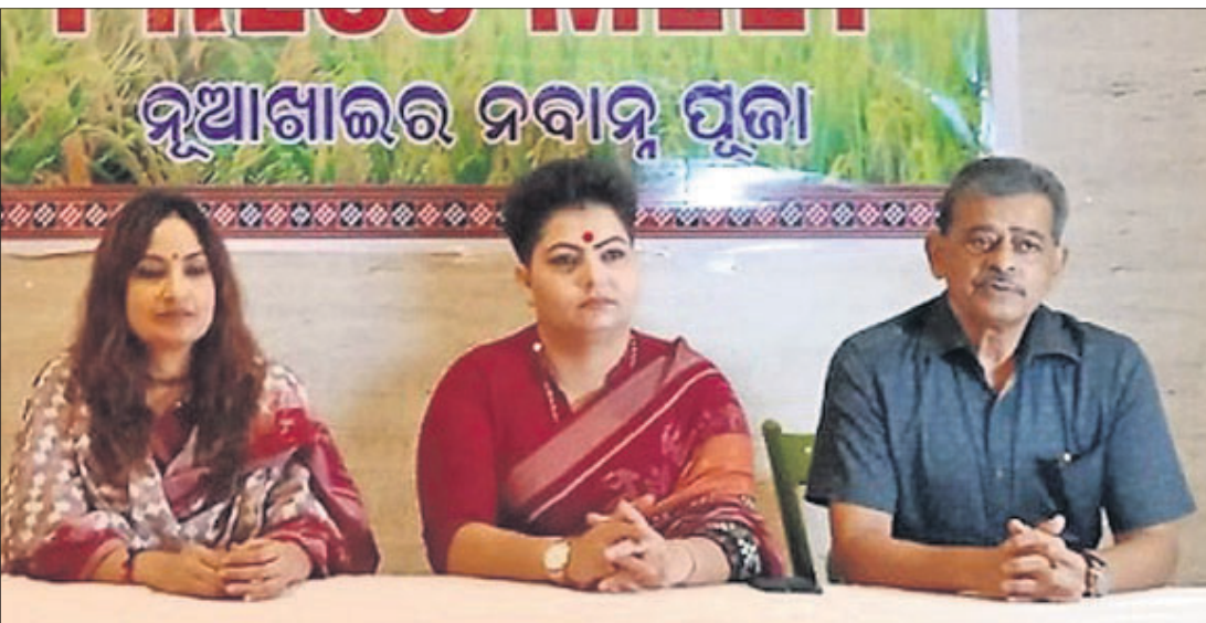
ନୂଆଁଖାଇ ପାଳନ ନେଇ ଅନୁଷ୍ଠାନ ପକ୍ଷରୁ ସୂଚନା ଦିଆଯାଇଛି ।