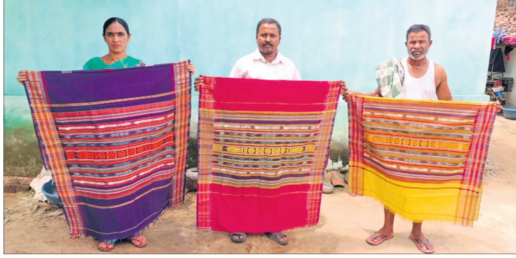
ପୂର୍ବରୁ ରୁଖାକାରମାନେ ହାବସପୁରୀ ଶାଢ଼ି ଚାହୁଁଥିଲେ।

ପଶ୍ଚିମ ଓଡ଼ିଶାର ବିଭିନ୍ନ ସ୍ଥାନରେ ଶାଢ଼ି ପ୍ରସ୍ତୁତ କରାଯାଏ। ସେଗୁଡ଼ିକ ହେଲା ବରପାଲି ଶାଢ଼ି, ସୋନପୁରୀ ଶାଢ଼ି, ବାନ୍ଧ ଶାଢ଼ି, ବଉଳ ଶାଢ଼ି, ସମଲପୁରୀ ଶାଢ଼ି ନିଜର ସ୍ୱତନ୍ତ୍ର ପରିଚୟ ସୃଷ୍ଟି କରିଛି। ସେଥି ମଧ୍ୟରୁ କଳାହାଣ୍ଡି ଜିଲାର ହାବସପୁରୀ ଶାଢ଼ି ମଧ୍ୟ ଜିଲା, ରାଜ୍ୟ, ଦେଶ ତଥା ଦେଶବାହାରରେ ନିଜର ସ୍ୱତନ୍ତ୍ର ପରିଚୟ ସୃଷ୍ଟି କରିଛି। ଏପରିକି ରାଜ୍ୟ ସରକାର ଏହାକୁ ଜିଆଇ ଟେଗ ମାନ୍ୟତା ଦେଇସାରିଛନ୍ତି। ସେହିପରି ଭାରତର ପ୍ରସିଦ୍ଧ ଗାତା ଚି 'ଗା' ର ଖୋଲରେ ମଧ୍ୟ ହାବସପୁରୀ ଶାଢ଼ିର ବାନ୍ଧ କଳା ଦେଖିବାକୁ ମିଳେ। ତେବେ ହାବସପୁରୀ ଶାଢ଼ିର ପ୍ରଚାର ଓ ପ୍ରସାର ପାଇଁ ସରକାର କିମ୍ବା ପ୍ରଶାସନ ଆଗଭର ହେଉନାହିଁ। ତେଣୁ ଏହି ଶାଢ଼ି ଏବେ ବିଲୁପ୍ତ ହେବାକୁ ବସିଥିବା ବେଳେ ରୁଖାକାରମାନେ ମଧ୍ୟ ରୋଜଗାର ହରାଇ ବସିଛନ୍ତି। କଳାହାଣ୍ଡି ଜିଲାର ଉତ୍ତର-ପଶ୍ଚିମ ଶତାଦେଶୀୟ କଣ୍ଠେଇ ନୋକାମାନେ ହାବସପୁରୀ ଶାଢ଼ି ଚାହୁଁଛନ୍ତି। ପରବର୍ତ୍ତୀ ସମୟରେ ଉତ୍ତର-ପଶ୍ଚିମ ପ୍ରାନ୍ତର ଲୋକମାନେ ଏହାକୁ କୌଳିକ ବୃତ୍ତି ହିସାବରେ ଗ୍ରହଣ କଲେ ବୋଲି କୁହାଯାଏ। ବର୍ତ୍ତମାନ ଯୁଗରେ ବିଭିନ୍ନ ଶାଢ଼ି ବଜାରକୁ ଆସିବା ଯୋଗୁ ହାବସପୁରୀ ଶାଢ଼ିର ଦାମ କମି ଲାଗିଲା। ରୁଖାକାରମାନେ ବେପାର କରିବାକୁ ଶାଢ଼ିକୁ ଶାଢ଼ି ଖାତାରେ ଗଢ଼ି ଅନ୍ୟ କାମରେ ସମୟ ଦେଇ ପରିବାର ପ୍ରତିପୋଷଣ କଲେ।