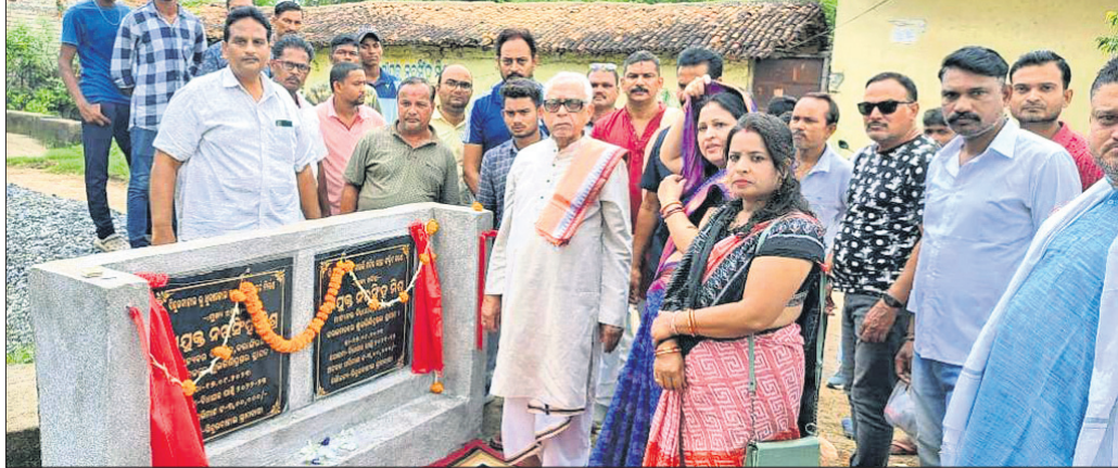
ବଲାଙ୍ଗୀର ବିଧାୟକ ନରସିଂହ ମିଶ୍ର ବିଭିନ୍ନ ପ୍ରକଳ୍ପର ଶିଳାନିଧାନ ଏବଂ ଉଦଘାଟନ କରୁଛନ୍ତି।