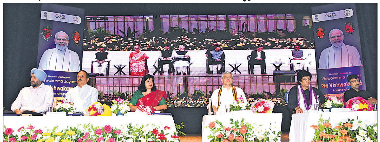
ଭୁବନେଶ୍ୱର ରେଳ ଅତିଗୋରିୟାଠାରେ 'ପିଏମ୍ ବିଶ୍ୱକର୍ମା ଯୋଜନା' ଶୁଭାରମ୍ଭ କାର୍ଯ୍ୟକ୍ରମରେ ରେଳମନ୍ତ୍ରୀ ଅଶ୍ୱିନୀ ବୈଷ୍ଣବ ଓ ଅନ୍ୟ ଅତିଥିମାନେ।