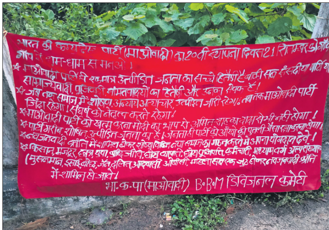
ଲାଲ୍ଲନଦୀ ତ୍ରିକ୍ତରେ ଲାଗିଥିବା ବ୍ୟାନର।

ବଲାଙ୍ଗୀର ଜିଲ୍ଲା ଲାଠୋର ଲାଲ୍ଲନଦୀ ତ୍ରିକ୍ତର ଉଭୟ ପାର୍ଶ୍ୱରେ ମାଓବାଦୀ ବ୍ୟାନର ଲଗାଇ ସେମାନଙ୍କ ଉପସ୍ଥିତି ଜାହିର କରିଛନ୍ତି। ରବିବାର ସକାଳେ ୨ଟି ବ୍ୟାନର ଲାଗିଥିବା ନକରକୁ ଆସିଥିଲା। ହିନ୍ଦୀରେ ଲେଖାଥିବା ବ୍ୟାନରରେ ମାଓବାଦୀଙ୍କ ୨୦୦ଟି ସ୍ଥାପନା ଦିବସ ଆସନ୍ତା ୨୧ ସେପ୍ଟେମ୍ବରରେ ଗାଁଗାଁରେ ପାଳନ କରିବାକୁ ନିବେଦନ କରାଯାଇଛି। ସମାଜରେ ଶୋଷଣ, ଅନ୍ୟାୟ, ଅତ୍ୟାଚାର, ଉପାଡ଼ନ ଜାରି ରହିଥିବା ଯାଏ ମାଓବାଦୀ ପାର୍ଟି କାଟିବ ରହିଥିବ ଏବଂ ସଂଘର୍ଷର ନେତୃତ୍ୱ ନେଉଥିବ।