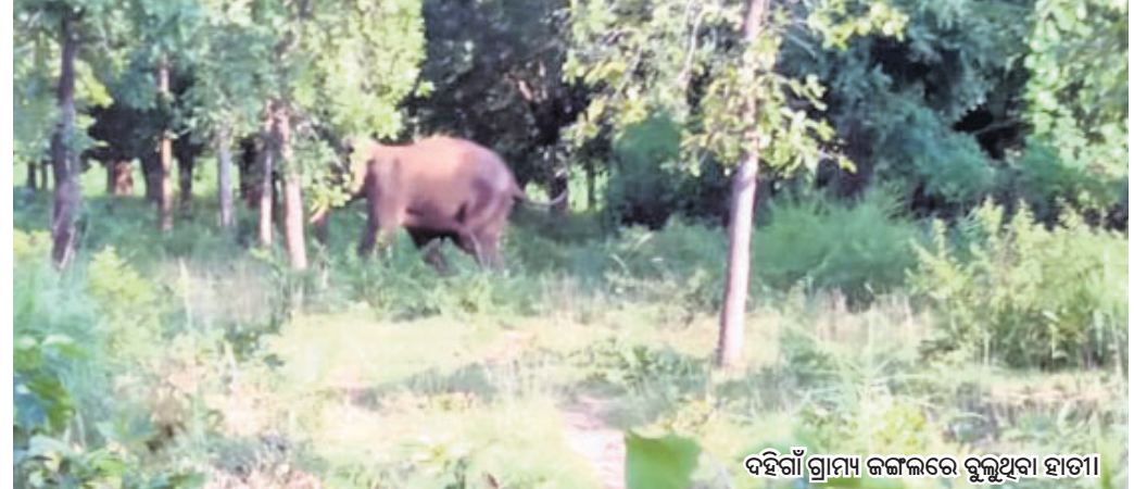
ଦହିଗାଁ ଗ୍ରାମ୍ୟ ଜଙ୍ଗଲରେ ବୁଲୁଥିବା ହାତୀ ।