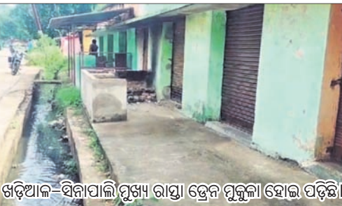
ଖଡ଼ିଆଳ-ବିନାପାଲି ମୁଖ୍ୟ ରାସ୍ତା ଡ୍ରେନ୍ ମୁକୁଳା ହୋଇ ପଡ଼ିଛି।

ନାହିଁ ନ ଥିବା ଅସୁବିଧାର ସମ୍ମୁଖୀନ ହେଉଛନ୍ତି। ଖଡ଼ିଆଳ ପୂର୍ବ ବିଭାଗ ଅଧିକାରୀଙ୍କ ସହାୟତା ପାଇଁ ପୂର୍ବ ବିଭାଗ ଅଧିକାରୀଙ୍କୁ ପରାମର୍ଶ ଦେଇ ପୂର୍ବ ଆସିବା ପାଇଁ, ଯଥାଶୀଘ୍ର ସମସ୍ୟା ସମାଧାନ କରାଯିବ ବୋଲି କହିଛନ୍ତି। ଅତିଶୀଘ୍ର ଡ୍ରେନ୍ ଉପରେ ସ୍ଳାପ କିମ୍ବା ଜଳାକୃଷି ଦିଆଯାଇ ବୋଲି ସହରବାସୀ ଦାବି କରିଛନ୍ତି।