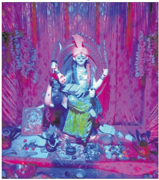
ବିଶ୍ୱା ଚାହାର ରୋଡ୍ ।