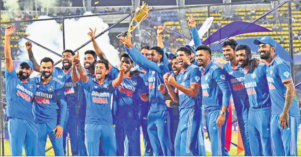
ଏସିଆ କପ୍ ଟ୍ରଫି ସହ ଚମ୍ପିୟାନ ଭାବେ ଗ୍ରୀଟିଂ ହେଉଛନ୍ତି ଇଣ୍ଡିଆନ୍ ଟିମ୍ ।

କଳ୍ପଦିନ, ୧୭। ବର୍ଷା ଜନିତ ପାଗ ଓ ପରିବେଶ ଯୋଗୁ ଏସିଆ କପ୍ ୧୬ଶ ସଂସ୍କରଣରେ ଅନେକ ମ୍ୟାଚ ପ୍ରଭାବିତ ହୋଇଥିଲା । ଭାରତ-ପାକିସ୍ତାନ ଲିଗ୍ ମ୍ୟାଚ ସମ୍ପୂର୍ଣ୍ଣ ହୋଇପାରି ନ ଥିବାବେଳେ ସୁପର-୪ ମ୍ୟାଚ ଶେଷ ହେବାକୁ ୨ ଦିନ ଲାଗି ଯାଇଥିଲା । ସମାନ ପରିସ୍ଥିତି ପାଇଁ ଅନ୍ୟ କେତେକ ମ୍ୟାଚର ଓଭର କମାଇବାକୁ ବାଧ୍ୟ ହୋଇଥିଲେ ଆୟୋଜକ । ମାତ୍ର ଉଦ୍ଦେଶ୍ୟ ଭାରତ-ଶ୍ରୀଲଙ୍କା ମ୍ୟାଚରେ ବର୍ଷା ନ ଥିଲା କି ତଦ୍ୱଳ୍ପନିତ ପରିବେଶ । ଆଉ ପ୍ରେମଦାସୀ ଷ୍ଟାଡ଼ିୟମରେ ଆସିଥିଲା ସିରାଜ ଝଡ଼ । ଏହି ଝଡ଼ରେ ଶ୍ରୀଲଙ୍କା ଇନିଂସ ଧସି ହୋଇ ଯାଇଥିଲା । କ୍ୟାପ୍ଟେନରେ ପ୍ରଥମଥରପାଇଁ ୬ ଉଇକେଟ ସଫଳତା ପାଇଥିଲେ ସିରାଜ । ମ୍ୟାଚ ୫୦ ଓଭର ବିଶିଷ୍ଟ ହୋଇଥିଲେ ହେଁ ୨ଟି ଯାକ ଇନିଂସ ୧୫.୨ ଓ ୬.୧ ଓଭରରେ ଶେଷ ହୋଇ ଯାଇଥିଲା । ଘରୋଇ ପରିବେଶରେ ଖେଳିଥିଲେ ହେଁ ଶ୍ରୀଲଙ୍କା ପାଇଁ କିଛି ବି ଭଲରେ ଯାଇ