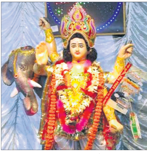
ବନ୍ଧମୁଣ୍ଡା କୋଇଲା ଗେଟ୍ ।