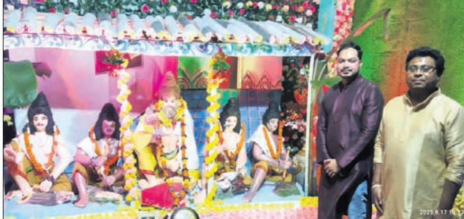
ଖପ୍ରାଖୋଲ ବ୍ଲକ ସଦର ମହକୁମାରେ ଥିବା ପାନୀୟ ଜଳ ଯୋଗାଣ ବିଭାଗ ମଣ୍ଡପରେ ପଞ୍ଚ ବିଶ୍ୱକର୍ମା ମୂର୍ତ୍ତି।

ପୁରୁବାହାଲ/ଖପ୍ରାଖୋଲ, ୧୭୩୯ (ଶ୍ରୀବନ୍ଧ ବେହେରା/ଅଭୟ ତ୍ରିପାଠୀ)