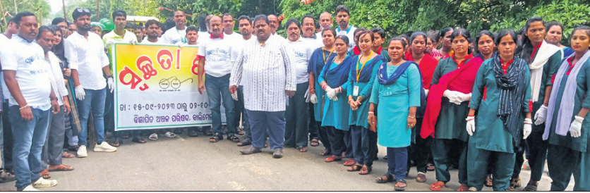
ସ୍ୱଚ୍ଛତା ପକ୍ଷ ଅବସରରେ ବାହାରିଥିବା ବାଲି ।

ବାଲିମେଳା, ୧୭୯୯ (ଶିବବର ପାତ୍ର) ମାଲକାନଗିରି ଜିଲ୍ଲା ବାଲିମେଳା ଏନ୍.ଏସିରେ ରବିବାର ସ୍ୱଚ୍ଛତା ପକ୍ଷ ପାଳିତ ହୋଇଯାଇଛି । ସେପ୍ଟେମ୍ବର ୧୫ ଓ ୧୬ରେ ପାଳିତ ହୋଇଥିବା ସ୍ୱଚ୍ଛତା ପକ୍ଷ ପାଳନ କରାଯିବ । ଏହି ପରିବେଶରେ ଏନ୍.ଏସିରେ ସ୍ୱଚ୍ଛତା ପକ୍ଷର ଉଦ୍ଦେଶ୍ୟ ଠାକୁର ମାନ୍ୟତା ପ୍ରଦାନ କରିବା, ନିର୍ଦ୍ଦିଷ୍ଟ ଅଧିକାରୀଙ୍କୁ ପ୍ରମୁଖ ଉପସ୍ଥିତ ଥିଲେ । ଆଗକୁ ପାର୍ବଣ ସମୟ ନଗରବାସୀଙ୍କ ସାହାଯ୍ୟ ନିହାତି ଆବଶ୍ୟକ । ଯାହାଦ୍ୱାରା ସହର ସ୍ୱଚ୍ଛତା ହୋଇପାରିବ ବୋଲି ନଗରପାଳ ନାୟକ କହିଛନ୍ତି ।