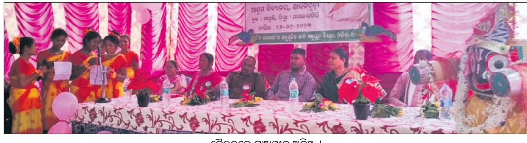
ବୈଠକରେ ମଞ୍ଚାସୀନ ଅତିଥି ।

ମାଲକାନଗିରି, ୧୭୯୯ (ଭୂର୍ଯ୍ୟାଧନ ପାତ୍ର) ମାଲକାନଗିରି ଜିଲ୍ଲା ମାଧ୍ୟମିକ ବ୍ଲକ ସାଉଁଜିଲଗୁଡ଼ା ଆଶ୍ରମ ବିଦ୍ୟାଳୟରେ ରବିବାର ଆମେ ଜାଣିବା ଆମେ ଜିଣିବା କାର୍ଯ୍ୟକ୍ରମ ଅନୁଷ୍ଠିତ ହୋଇଯାଇଛି । ଏଥିରେ ପୁଞ୍ଜ୍ୟ ଅଭିଭାବକମାନଙ୍କୁ ନିଜ ନିଜ ବିଭାଗରେ ଜନସଚ୍ଚକର କାର୍ଯ୍ୟ ସମ୍ବନ୍ଧରେ ବୁଝାସା ପ୍ରଦାନ କରିଥିଲେ । ପରେ ଅଭିଭାବକଙ୍କ ମଧ୍ୟରେ ମୁଖ୍ୟ ଉପାଧିକାରୀ ଆଦି ପ୍ରତିଯୋଗିତା ଯୋଗୁ ମାଲକାନଗିରି ଜିଲ୍ଲାରେ ଶିକ୍ଷାର ଉନ୍ନତି ଓ ଉତ୍ତମ ଭବିଷ୍ୟତ ସୃଷ୍ଟି ହୋଇଛି । ଅଭିଭାବକମାନେ ନିଜର ସହାୟତାକୁ ଉକ୍ତ ଶିକ୍ଷା ଗ୍ରହଣ କରିବା ପର୍ଯ୍ୟନ୍ତ ପ୍ରୋତ୍ସାହନ ଯୋଗାଇବା ସହ ସେମାନଙ୍କ ପ୍ରତି ସହନଶୀଳତା ପ୍ରଦର୍ଶନ କରିବା ଉଚିତ । ପିତାମାତାଙ୍କ ସ୍ନେହ ଓ ସହାୟ ସମ୍ପାଦନାକୁ ଶିକ୍ଷା ଗ୍ରହଣ କରିବାରେ ପ୍ରେରଣା ଯୋଗାଇଥାଏ । ଏହି କାର୍ଯ୍ୟକ୍ରମରେ ଯୋଗ ଦେଇଥିବା ବିଭିନ୍ନ ବିଭାଗର ପଦାଧିକାରୀମାନେ ନିଜ ନିଜ ବିଭାଗରେ ଜନସଚ୍ଚକର କାର୍ଯ୍ୟ ସମ୍ବନ୍ଧରେ ବୁଝାସା ପ୍ରଦାନ କରିଥିଲେ । ପରେ ଅଭିଭାବକଙ୍କ ମଧ୍ୟରେ ମୁଖ୍ୟ ଉପାଧିକାରୀ ଆଦି ପ୍ରତିଯୋଗିତା ଅନୁଷ୍ଠିତ ହୋଇଥିଲା । ଛାତ୍ରମାନଙ୍କ ଦ୍ୱାରା ବିଭିନ୍ନ ସାଂସ୍କୃତିକ କାର୍ଯ୍ୟକ୍ରମ ଦର୍ଶନମାନଙ୍କ ମନ ମୋହିଥିଲା । ପ୍ରଧାନ ଶିକ୍ଷୟିତ୍ରୀ ମାତା ଧନ୍ୟବାଦ ଅର୍ପଣ କରିଥିଲେ ।