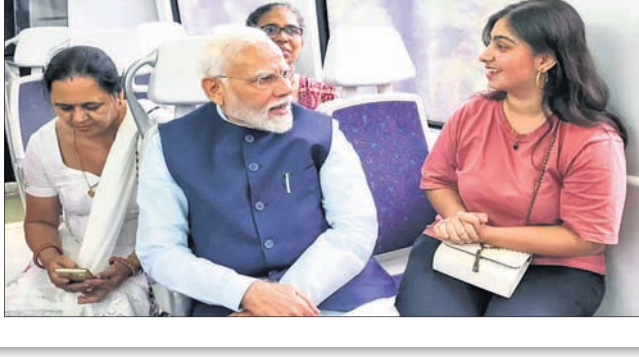
ଦିଲ୍ଲୀ ମେଟ୍ରୋ ଏୟାରପୋର୍ଟ ସମ୍ପ୍ରସାରଣ ଉଦ୍‌ଘାଟିତ।