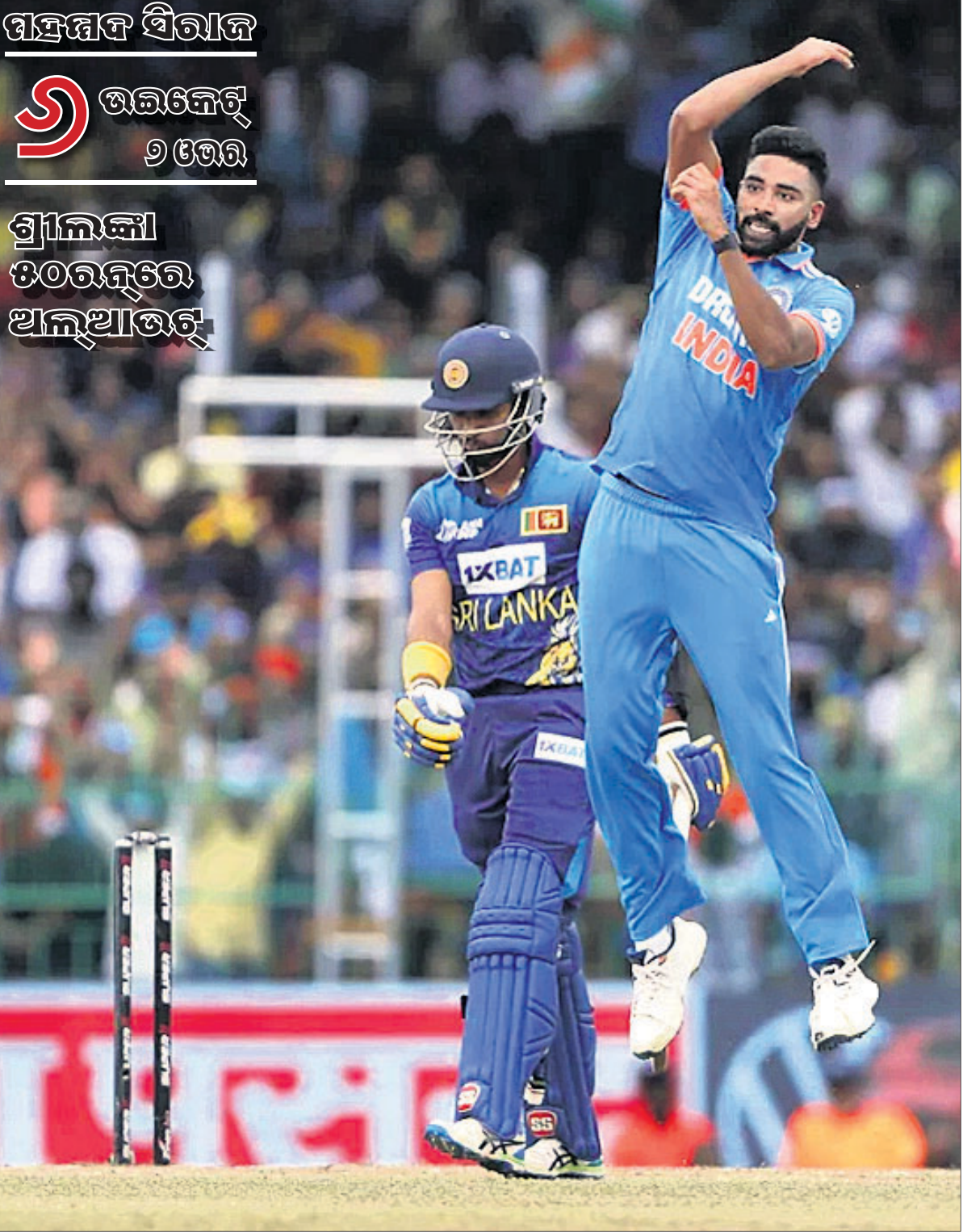
କଲମ୍ବୋରେ ରବିବାର ଅନୁଷ୍ଠିତ ଏସିଆ କପ୍ ଫାଇନାଲରେ ଉଇକେଟ୍ ନେବା ପରେ ଉଲ୍ଲସିତ ଭାରତର ବୁଟ ବୋଲର ମହମ୍ମଦ ସିରାଜ।