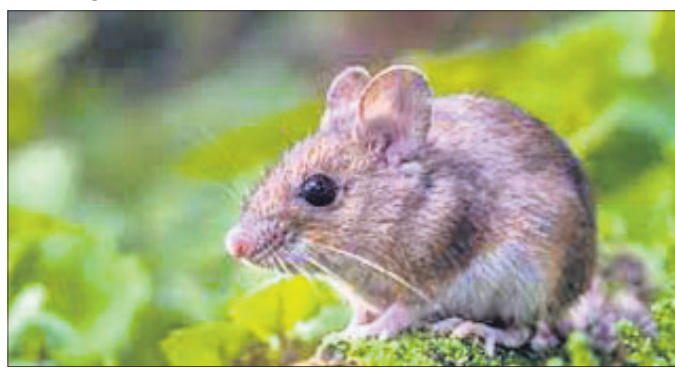
ବର୍ଷ ମଧ୍ୟରେ ୧୬୮ଟି ମୂଷା ଧରାଯାଇଛି।

ମୂଷା ଧରିବା ପାଇଁ ନର୍ଦ୍ଦେନ ରେଲ୍‌ଫ୍ରେର ୨୯ ଲକ୍ଷ ଖର୍ଚ୍ଚ କରିଥିବା ନେଇ ସୂଚନା ଅଧିକାରୀ ଆଇନର ତଥ୍ୟକୁ ଜଣାଇଛନ୍ତି। ୨୦୨୦ରୁ ୨୦୨୨ ମଧ୍ୟରେ ଏହି ଟଙ୍କା ଖର୍ଚ୍ଚ କରାଯାଇଥିବା ଦର୍ଶାଯାଇଥିବାବେଳେ ଭାରତୀୟ ରେଲ୍ ବିଭାଗରେ ବ୍ୟାପକ ଦୁର୍ଗତି ହେଉଛି। ଏହା ଏହି ଘଟଣାରୁ ପ୍ରମାଣିତ ହୋଇଛି ବୋଲି କଂଗ୍ରେସ ଅଭିଯୋଗ କରିଛି।