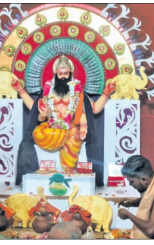
ଚିତ୍ରକୋଣ୍ଠାରେ ପୂଜା ପାଉଥିବା ବିଶ୍ୱକର୍ମା ।