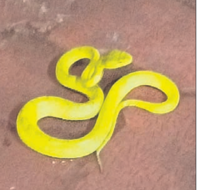
ଅରନେଟ ଫ୍ଲାଉଁ ସ୍ନେକ୍ ବା ଉଡ଼ୁଛା ସାପ ।