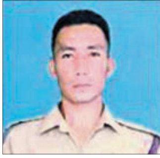
ସେଗେ ଆଜ୍ଞାଙ୍କ କୋମ୍