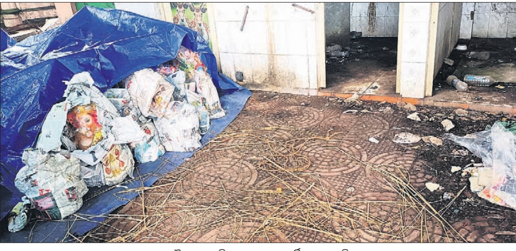
ଶୈଳାଳୟ ପରିସରରେ ମୃଣ୍ମୟ ମୂର୍ତ୍ତି ରଖାଯାଇଛି ।