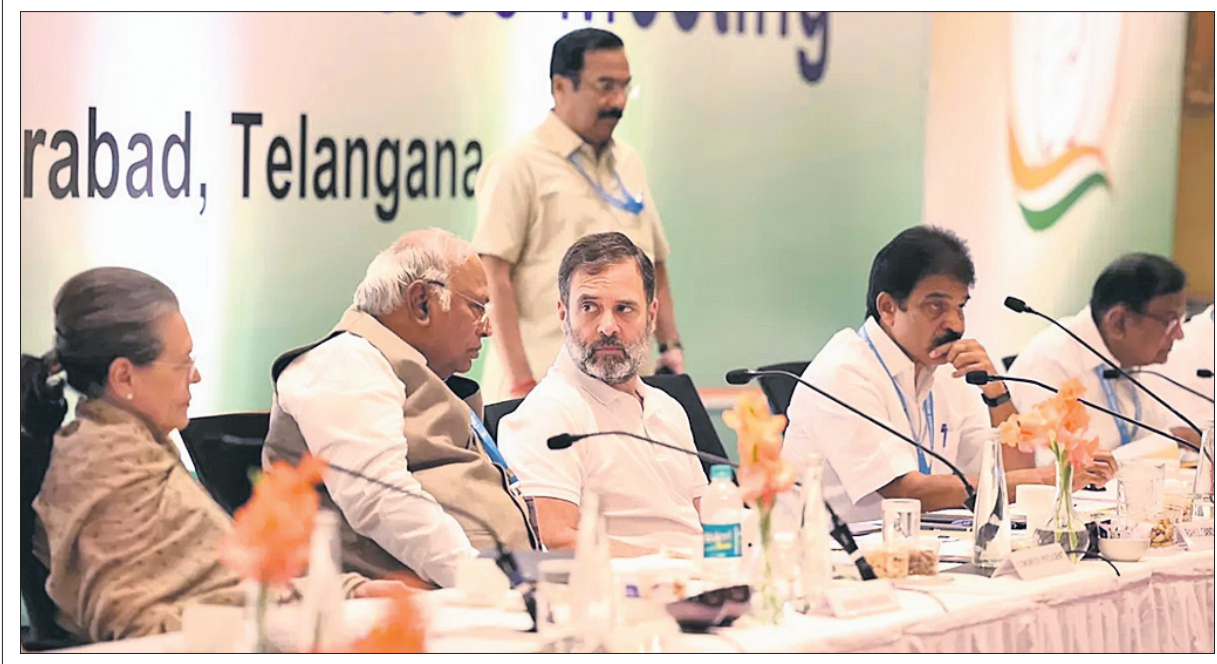
ହାଇଦ୍ରାବାଦରେ ଅନୁଷ୍ଠିତ କମିଶନରୀର କାର୍ଯ୍ୟକ୍ରମରେ ଉପସ୍ଥିତ ଓଡ଼ିଶା କମିଶନରୀର କାର୍ଯ୍ୟକ୍ରମ...