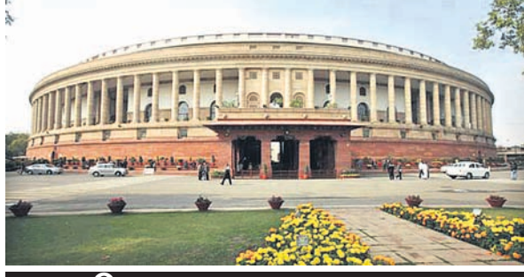
ଆଜିରୁ ସଂସଦର ସ୍ୱତନ୍ତ୍ର ଅଧିବେଶନ

ସଂସଦର ୫ ଦିନିଆ ସ୍ୱତନ୍ତ୍ର ଅଧିବେଶନ ସୋମବାର ଆରମ୍ଭ ହେବା ସେପ୍ଟେମ୍ବର ୨୨ ଯାଏ ଚାଲିବାକୁ ଥିବା ଏହି ଅଧିବେଶନରେ କେନ୍ଦ୍ର ସରକାର ବିସ୍ଥିତ କରିଦେବା ଭଳି କେତୋଟି ବିଲ୍ ଆଣିପାରିବ। ୨୦୨୪ ସାଧାରଣ ନିର୍ବାଚନ ପାଖେଇ ଆସୁଥିବାରୁ ମହିଳା ଭୋଟରଙ୍କୁ ଆକର୍ଷିତ କରିବା ପାଇଁ ୨୦୧୦ରେ ରାଜ୍ୟ ସଭାରେ ଗୃହୀତ ହୋଇଥିବା ମହିଳା ସଂରକ୍ଷଣ ବିଧେୟକକୁ ଲୋକ ସଭାରେ ପାରିତ କରିପାରିବି ବୋଲି ମନେକରାଯାଉଛି। ଅଧିବେଶନର ଅନ୍ୟତମ ପୂର୍ବରୁ ରବିବାର ଅନୁଷ୍ଠିତ ସର୍ବଦଳୀୟ ବୈଠକରେ ମୁଖ୍ୟ ବିରୋଧୀ କଂଗ୍ରେସ ସମେତ ବିଜୁ ଜନତା ଦଳ (ବିଜେଡି) ଏବଂ ଭାରତ ରାଷ୍ଟ୍ର ସମିତି (ବିଆର୍ଏସ୍) ଭଳି କେତେକ ଆଞ୍ଚଳିକ ଦଳ ମହିଳା ସଂରକ୍ଷଣ ବିଲ୍ ଆଣିବା ପାଇଁ ଦାବି କରିଛନ୍ତି।