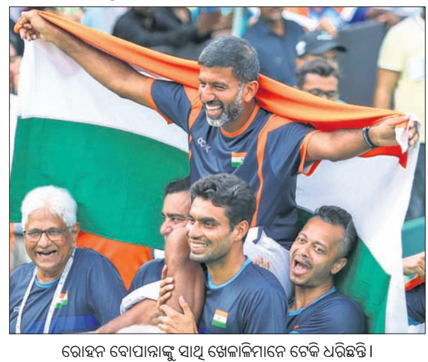
ରୋହନ ବୋପାନ୍ନାଙ୍କୁ ସାଥୁ ଖେଳାଳିମାନେ ଚେକି ଧରିଛନ୍ତି।

କଲମ୍ବୋ, ୧୭୯ (ପି.ଟି.) ଭାରତର ଷ୍ଟାର ଟେନିସ୍ ଖେଳାଳି ରୋହନ ବୋପାନ୍ନା ଡେଭିସ୍ କପ୍ କ୍ୟାରିୟରକୁ ଅଲଟିବା ଜଣାଇଛନ୍ତି। ବୋପାନ୍ନା ନିଜ କ୍ୟାରିୟରର ଅନ୍ତିମ ମ୍ୟାଚ ଜିତିବା ଫଳରେ ଭାରତ ୩-୧ରେ ମରକ୍କୋକୁ ପରାସ୍ତ କରିଛି। ଲକ୍ଷ୍ନୌର ମିନି