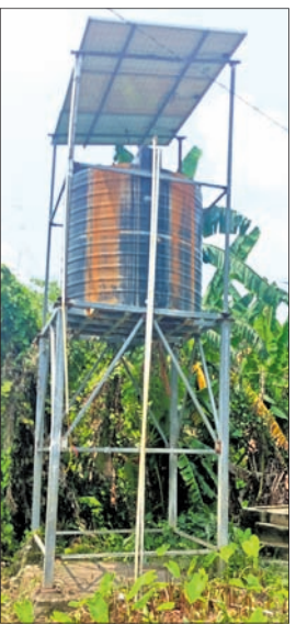
ଅଚଳ ଯୋଲାର ପାଣି ପମ୍ପ।