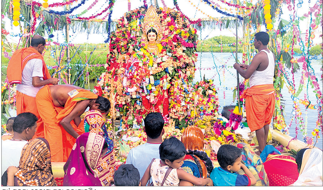
ମା' ମନସା ଦେବୀଙ୍କୁ ପୂଜା କରାଯାଇଛି।

ସର୍ପସଂଗ୍ରହ ପୂଜା ପାଇଁ ବଙ୍ଗାୟ ଲୋକମାନେ ମା' ମନସା ମୂଣ୍ଡାୟୀ ଦେବୀ ଚରଣରେ ଶରଣାପନ ହୁଅନ୍ତି। ବିଶ୍ୱାସ ରହିଛି ମା' ମନସା ଦେବୀଙ୍କୁ ନଦୀରେ କଦଳୀଭେଳା କରି ପୂଜାର୍ଚ୍ଚନା କଲେ ପରିବାରରେ ବିପତ୍ତି ପଡ଼େନାହିଁ। ମା'ଙ୍କ ମସ୍ତକରେ ଅଷ୍ଟନାଗ ଧାରଣ କରିଥାନ୍ତି। ସେମାନେ ହେଲେ ବାସୁକି, ପଦ୍ମ, ମହାପଦ୍ମ, ତନ୍ଦ୍ର, କୁଳିର, କର୍କଟ, ଶଙ୍ଖ ଓ ଅନନ୍ତ ଦଶାୟନ।