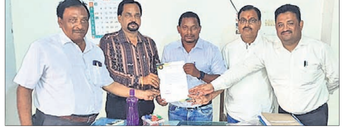
ଜିଲା କ୍ରୀଡ଼ା ଅଧିକାରୀ ଅନୁମତି ପତ୍ର ପ୍ରଦାନ କରୁଛନ୍ତି।

ଯାଜପୁର ଗାଉନ, ୧୮୮୯ (ପ୍ରସନ୍ନା ପ୍ରିୟଦର୍ଶିନୀ ମହାନ୍ତି) ଯାଜପୁର ଜିଲା ପ୍ରଶାସନ ପକ୍ଷରୁ ଯାଜପୁର ସ୍କୋର୍ସ୍ କ୍ଲବ୍‌ରୁ ଜିଲାର ସମସ୍ତ କ୍ରୀଡ଼ା ଭିତ୍ତିକ୍ରମି ଓ ସ୍ତ୍ରୀତିୟମ ହସ୍ତାନ୍ତର କରାଯାଇଛି। ଯାଜପୁର ସ୍କୋର୍ସ୍ କ୍ଲବ୍ ଗଠନ ହେବାପରେ ଯାଜପୁରରେ ଥିବା ବିଭିନ୍ନ ସ୍ତ୍ରୀତିୟମ ଓ କ୍ରୀଡ଼ା ଭିତ୍ତିକ୍ରମିକୁ ହସ୍ତାନ୍ତର କରିବା ପାଇଁ ଜିଲା ପ୍ରଶାସନକୁ ଅନୁରୋଧ କରାଯାଇଥିଲା। ଏହି ଅନୁରୋଧ କ୍ରମେ ଜିଲାପାଳ ସମସ୍ତ ସ୍ତ୍ରୀତିୟମ ଓ କ୍ରୀଡ଼ା ଭିତ୍ତିକ୍ରମି ହସ୍ତାନ୍ତର କରିଛନ୍ତି। ଏଥିରେ ଯାଜପୁର ସହରରେ ଥିବା ହରି ସ୍ତ୍ରୀତିୟମ, ଇନ୍ଦ୍ରଦୋର ସ୍ତ୍ରୀତିୟମ, ପୁରୁବଲ ସ୍ତ୍ରୀତିୟମ, ସିମିଟ୍ ପୁଲ୍ ଆଦି ସ୍ତ୍ରୀତିୟମରେ ବାସ୍ତବିକ କୋର୍ଟ, ଭଲିବଲ୍ କୋର୍ଟ, ପୁରୁବଲ୍, ବ୍ୟାଡ୍ମିନ୍ଟନ, ଖୋଖୋ, କବାଡି, ଚେସ,