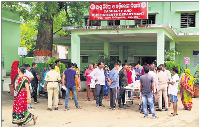
ନୟାଗଡ଼ ଜିଲ୍ଲା ମୁଖ୍ୟ ଚିକିତ୍ସାଳୟ।

ନୟାଗଡ଼ ଜିଲ୍ଲାରେ ସ୍ୱାସ୍ଥ୍ୟସେବା ସୁଧୁରୁଦ୍ଧ ରାଜ୍ୟରେ ମେଡିକାଲ କଲେଜ ସଂଖ୍ୟା ବହୁଥିଲେ ମଧ୍ୟ ଏହାର ସୁବିଧା ସାଧାରଣ ଲୋକ ନେଇ ପାରୁନାହାନ୍ତି ବୋଲି ଅଭିଯୋଗ ରହିଛି। କେବଳ ସ୍ୱାସ୍ଥ୍ୟସେବା କ୍ଷେତ୍ରରେ ବାହାବା ନିଆଯାଉଛି। କିନ୍ତୁ ଗ୍ରାଉଣ୍ଡ ଜିରୋ ରିପୋର୍ଟ କରୁଛି ସାଧାରଣ ଲୋକ ଠିକ୍ରେ ସ୍ୱାସ୍ଥ୍ୟସେବା ପାଇନାହାନ୍ତି। କେଉଁଠି ଡାକ୍ତର ପାଲିରେ ଆସୁଛନ୍ତି ତ ଆଉ କେଉଁଠାରେ ଡାକ୍ତର ଆସିବାରେ ବିଳମ୍ବ ହେଉଛି। ଆଉ କେହି ସ୍ଥାନରେ ଡାକ୍ତର ଥାଇ ନ ଥିଲେ ପରି। ତେବେ ସବୁଠି ସମାନ ଅଭିଯୋଗ ଖାଲିଥିବା ଡାକ୍ତର ପଦବୀ ଖାଲି ପଡ଼ିଛି। ନୟାଗଡ଼ରେ ଜିଲ୍ଲା ମୁଖ୍ୟ ଚିକିତ୍ସାଳୟ, ୧ ଉପଖଣ୍ଡ ଚିକିତ୍ସାଳୟ, ୧୨ଟି ରୋଷ୍ଟା ସ୍ୱାସ୍ଥ୍ୟକେନ୍ଦ୍ର, ୩୭ ପ୍ରାଥମିକ ସ୍ୱାସ୍ଥ୍ୟକେନ୍ଦ୍ର ରହିଛି। ଜିଲାର ବିଭିନ୍ନ ସ୍ୱାସ୍ଥ୍ୟକେନ୍ଦ୍ର ପାଇଁ ୪୩୪ ଡାକ୍ତର ପଦବୀ ଥିବାବେଳେ ୨୮୯ ପଦବୀ ଖାଲି ପଡ଼ିଛି। ମାତ୍ର ୧୪୪ ଡାକ୍ତର ଜିଲ୍ଲାରେ ଅଛନ୍ତି। ଅନ୍ୟପକ୍ଷେ ଆୟୁଷ ଡାକ୍ତର ପଦବୀ ୪୦ ଥିବାବେଳେ ୩୯ ଡାକ୍ତର ଅଛନ୍ତି। କେବଳ ଜଣେ ମାତ୍ର ଆୟୁଷ ଡାକ୍ତର ପଦବୀ ଖାଲି ପଡ଼ିଛି।