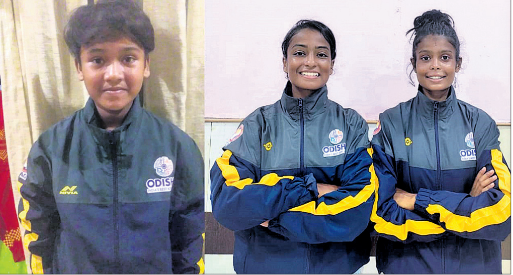
ଆଜିର ୩ ମହିଳା ପୁଟ୍‌ବଲ ଖେଳାଳି ।