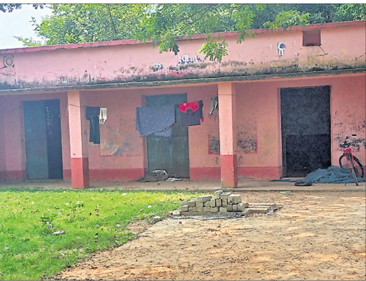
ବନ୍ଦ ହୋଇଥିବା ସ୍କୁଲ।