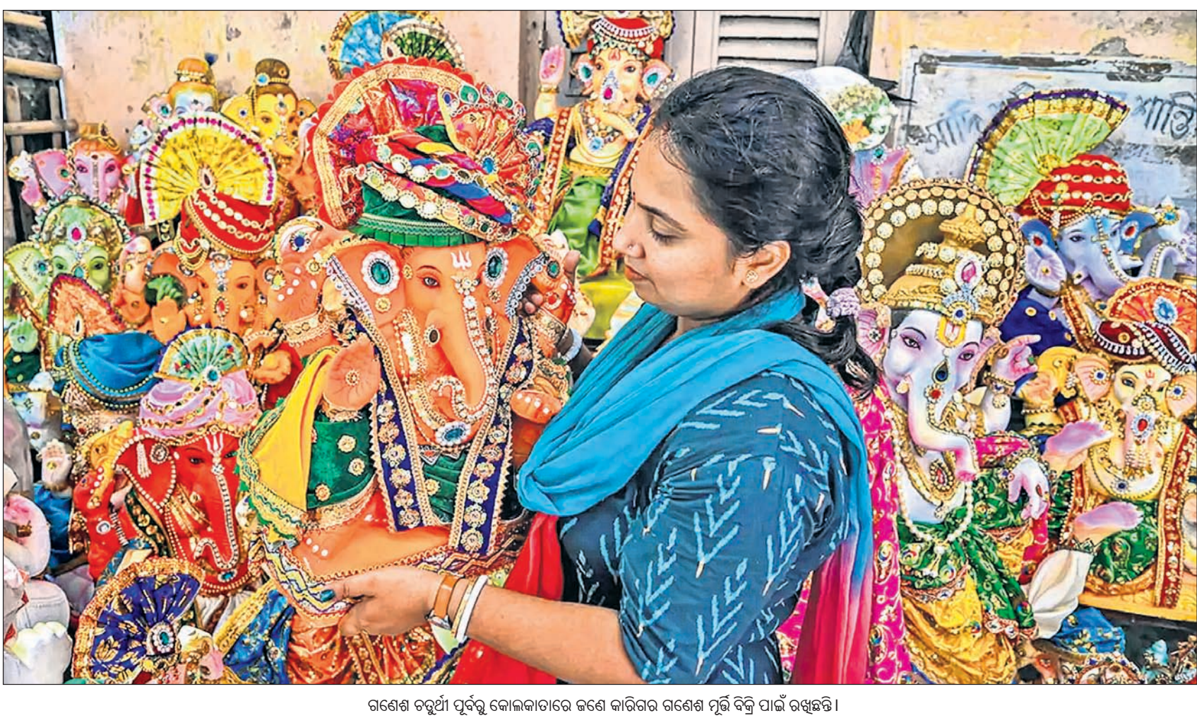
ଗଣେଶ ଚତୁର୍ଥୀ ପୂର୍ବରୁ କୋଲକାତାରେ ଜଣେ କାରିଗର ଗଣେଶ ମୂର୍ତ୍ତିକୁ ପାଇଁ ରଖୁଛନ୍ତି।