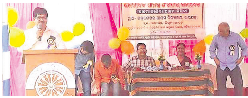
ଅଭିଭାବକ ସମ୍ମିଳନୀରେ ଉପସ୍ଥିତ କର୍ମକର୍ମୀ।