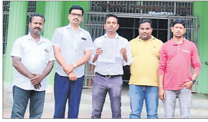
ଭୋଟରମାନେ ଲିମାପାଳଙ୍କୁ ଦାବି ପତ୍ର ଦେବାକୁ ଯାଉଛନ୍ତି।