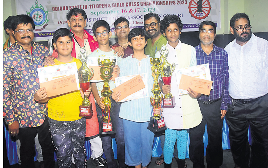
ରାଜ୍ୟ ଚେସ୍ କୃତୀ ପ୍ରତିଯୋଗୀମାନେ ପୁରସ୍କାର ସହ ଅତିଥିଙ୍କ ସମ୍ମୁଖରେ।