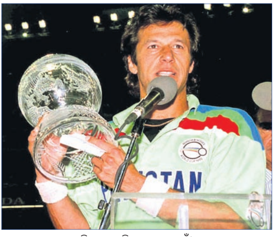
ବିଶ୍ୱକପ୍ ଗ୍ରୁପ୍ ସହ ଇମ୍ପାନ ଖାଁ।

ଦିନିକିଆ କ୍ରିକେଟ ପୁରୁଷ ବିଶ୍ୱକପ୍ରେ ପ୍ରଥମ ସଂସ୍କରଣରେ ରାମ୍ପିୟନ ଆଖ୍ୟା ଅର୍ଜନ କରିଥିଲା ପାକିସ୍ତାନ। ଇମ୍ପାନ ଖାଁଙ୍କ ନେତୃତ୍ୱରେ ଦଳ ତୃତୀୟ ବିଶ୍ୱକପ୍ ଖେଳିଥିବା ବେଳେ ଇଂଲଣ୍ଡକୁ ହରାଇ ଦଳ ହାସଲ କରିଥିଲା ଏହାର ପ୍ରଥମ ଚାଲଟଲ। କ୍ରମାଗତ ଥର ପାଇଁ ଫାଇନାଲରେ ପହଞ୍ଚିଥିବା ଇଂଲଣ୍ଡକୁ ଆଉ ଥରେ ନିରାଶ ହେବାକୁ ପଡ଼ିଥିଲା। ବେନସନ୍ ଆଣ୍ଡ ହେଲେକ୍ସ୍ ଏହି ବିଶ୍ୱକପ୍ରେ ପ୍ରାୟୋକ୍ତ ରହିଥିଲେ। ୧୯୯୧ ପରିବର୍ତ୍ତେ ଏକ ବର୍ଷ ବିଳମ୍ବରେ ଏହି ବିଶ୍ୱକପ୍ ଆୟୋଜିତ ହୋଇଥିଲା। ପ୍ରଥମ ଥର ପାଇଁ କଳା ଧଳା ପରିବର୍ତ୍ତେ ରଙ୍ଗିନ ପୋଷାକରେ ଦିନିକିଆ କ୍ରିକେଟ ଦେଖିବାକୁ ମିଳିଥିଲା। ୮ ପରିବର୍ତ୍ତେ ୯ ଦଳ ଅଂଶଗ୍ରହଣ କରିଥିବା ବେଳେ ସମୁଦାୟ ୩୯ ମ୍ୟାଚ୍ ଖେଳ ହୋଇଥିଲା। ଏହା ସହିତ ଏହି ବିଶ୍ୱକପ୍ ଅନେକ କାରଣରୁ ସ୍ୱତନ୍ତ୍ର ରହିଥିଲା। ରେନ୍ ଡୁଲ୍ ପ୍ରଥମ ଥର ଲାଗୁ କରାଯାଇଥିବା ବେଳେ ଦକ୍ଷିଣ ଆଫ୍ରିକା ସେମି ଫାଇନାଲରେ ପାରାଜିତ ହୋଇଥିଲା। ଏହା ସହିତ ସିନି ବୋଲରଙ୍କ ଜରିଆରେ ଓପନ କରିବା ଓ ପିଞ୍ଚ ହିଟରଙ୍କ ବ୍ୟବହାର ପ୍ରଥମ ଥର କରିଥିଲା ଖୁଲିଆଣ୍ଡ। ପାକିସ୍ତାନ ଏହି ସଂସ୍କରଣରେ ବର୍ଷା କାରଣରୁ ସବୁଠାରୁ ଅଧିକ ଲାଭବାନ ହୋଇଥିଲା। ଦଳ ଇଂଲଣ୍ଡ ବିପକ୍ଷ ଲିଭି ମ୍ୟାଚରେ ୭୪ ରନ୍‌ରେ ଅଲଆଉଟ୍ ହୋଇଥିବା ବେଳେ ବର୍ଷାକାରଣରୁ ୧୧ ଉଇକେଟ୍ ନେଇଥିଲେ।