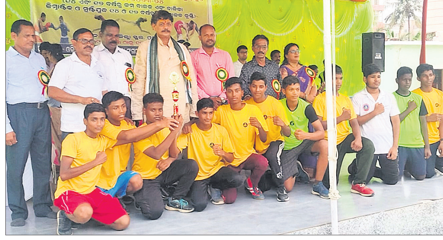
ଅତିଥିଙ୍କ ସହ ବାଳକ ବିଭାଗ ଚାମ୍ପିୟନ ପୁରୀ ଦଳ।