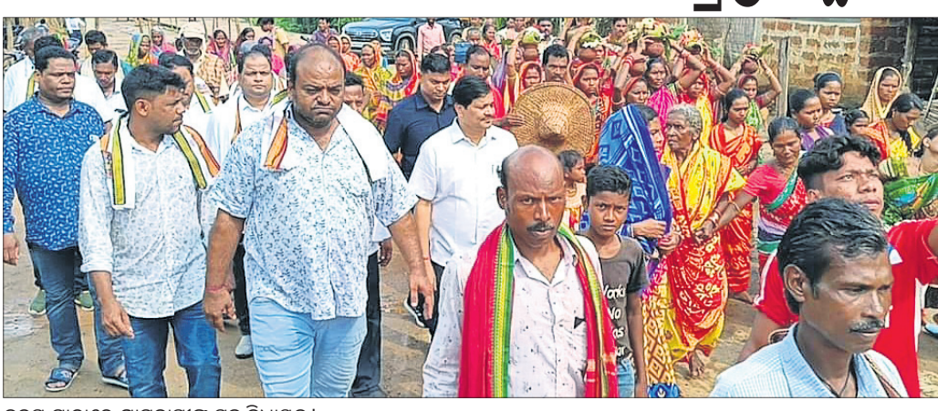
କଳସ ଯାତ୍ରାରେ ଗ୍ରାମବାସୀଙ୍କ ସହ ବିଧାୟକ।