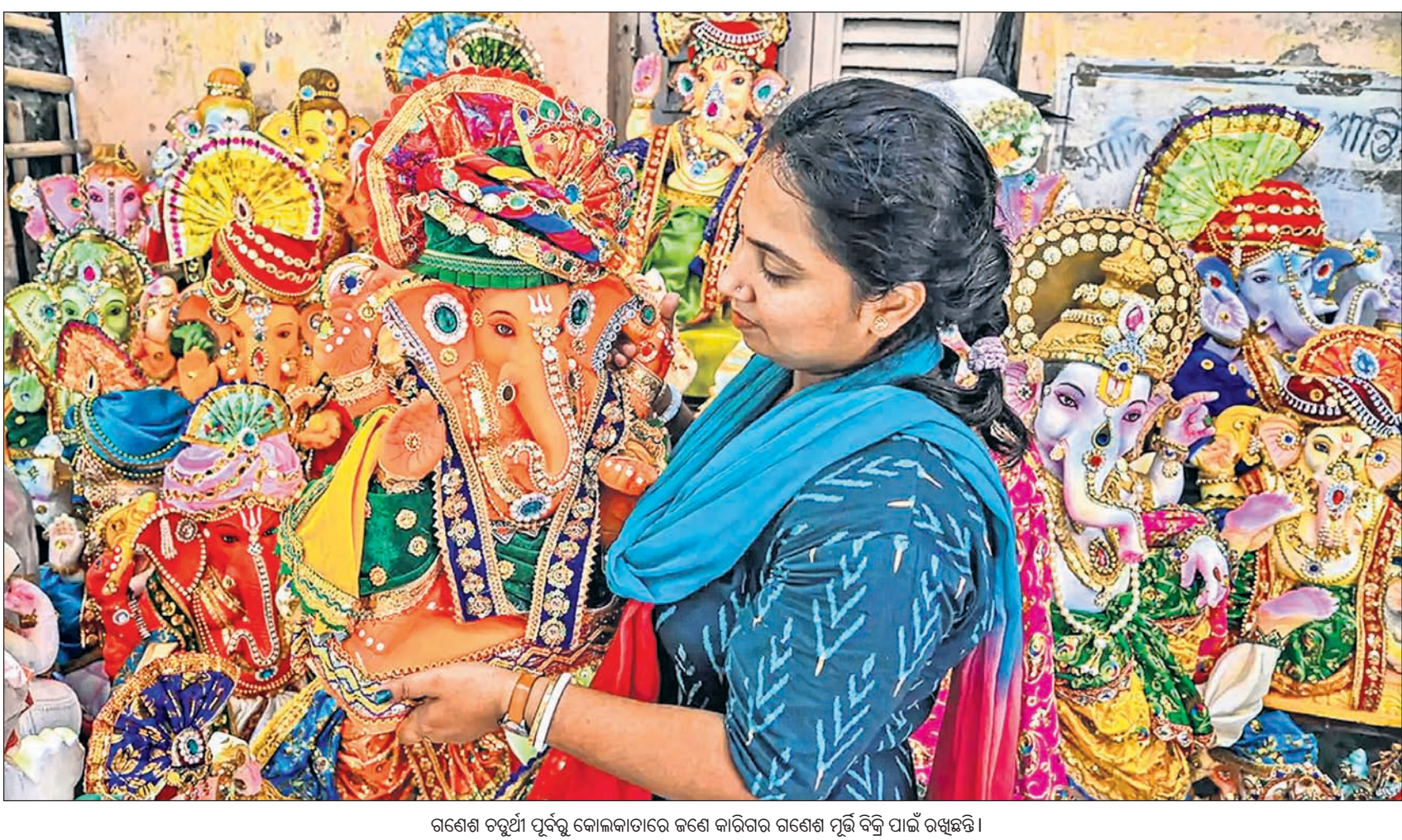
ଗଣେଶ ଚତୁର୍ଥୀ ପୂର୍ବରୁ କୋଲକାତାରେ ଜଣେ କାରିଗର ଗଣେଶ ମୂର୍ତ୍ତି ବିକ୍ରି ପାଇଁ ରଖିଛନ୍ତି।