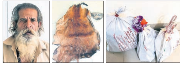
ଭୁବନେଶ୍ୱର, (ପୂର୍ଣ୍ଣକାନ୍ତ ବେହେରା)/ବୌଦ୍ଧ, ୧୮ (ଅଧିକ କୁମାର ବାରିକ)

ଚିଠି 'ଗାପରେ ଅଛି' ବୋଲି କନକ ଟିଭିରେ ଖବର ପ୍ରସାରଣ ହୋଇଥିଲା। ହେଲେ 'ଗାପ କିଛି ନାହିଁ'। ଉକ୍ତ ଟିଭି ଚ୍ୟାନେଲ୍ ତଥ୍ୟକୁ ବିକୃତ କରି ମିଥ୍ୟା ପ୍ରଚାର କରୁଥିବା ଇଓଡ଼ିଆ ପକ୍ଷରୁ କୁହାଯାଇଛି। ଏହି ଚଢ଼ାଉ ତଥା ଯାଞ୍ଚ ସମୟରେ ଇଓଡ଼ିଆ ଅଧିକାରୀମାନେ ସମାଜ କର୍ମଚାରୀଙ୍କ ପ୍ରତି ନିମ୍ନ ବ୍ୟବହାର କରିଥିଲେ। କର୍ମଚାରୀଙ୍କୁ କୌଣସି ଅଧିକାର କରାଯାଇନାହିଁ ଏବଂ ଖବରକାଗଜର ଦୈନିକ କାର୍ଯ୍ୟରେ ବ୍ୟାଘାତ ନ କରି ଯାଞ୍ଚ ପ୍ରକ୍ରିୟା ହୋଇଥିବା ଇଓଡ଼ିଆ ପକ୍ଷରୁ କୁହାଯାଇଛି। ପୂର୍ତ୍ତାଧାର କି ରବିବାର ସମାଜର ପ୍ରକାଶନ ତଥା ସିଓଓ କମଳାକାନ୍ତ ମହାପାତ୍ରଙ୍କୁ ଇଓଡ଼ିଆ ପ୍ରାୟ ଅଢ଼େଇ ଘଣ୍ଟା କେରା କରିଥିଲା।