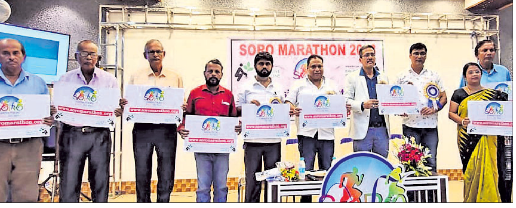
ଖେବସାଇଟ୍ ଉନ୍ମୋଚନ ଅବସରରେ ଉପସ୍ଥିତ ବିଧାୟକ ପର୍ଶୁରାମ ଧଡ଼ା ଓ ଅନ୍ୟମାନେ।

ଖବରଦାତା ସମ୍ବଳନାରେ ସୁବନା ଦିଆଯାଇଛି। ଏଥିରେ ମୋଟ ୬ଟି ଗ୍ରୁପ୍ କରାଯାଇଛି। ମହିଳାଙ୍କ ପାଇଁ ଗୋଟିଏ ଗ୍ରୁପ୍, ପୁରୁଷଙ୍କ ପାଇଁ ୪ଟି ଗ୍ରୁପ୍ ଏବଂ ଦମ୍ପତିଙ୍କ ପାଇଁ ସ୍ୱତନ୍ତ୍ର ଗ୍ରୁପ୍ ଆୟୋଜନ କରାଯାଇଛି। ପ୍ରତିଯୋଗୀମାନେ ଆସନ୍ତା ୨୫ରୁ ଅକ୍ଟୋବର ୩୧ ତାରିଖ ପର୍ଯ୍ୟନ୍ତ ସୋର ମାରାଥନ ଖେବସାଇଟ୍ ମାଧ୍ୟମରେ ପଞ୍ଜିକରଣ କରିପାରିବେ ବୋଲି କମିଟି ସୂଚନା ଦେଇଛି।