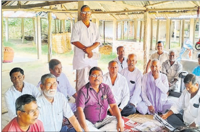
ବୈଠକରେ ପାନ ଗଣାସଂଘର କର୍ମକର୍ମୀ।

ପାନଗଣକୁ କୃଷିର ମାନ୍ୟତା ଦେବା ଓ ଆର୍ଥିକ ସହାୟତା ଯୋଗାଇ ଦେବାକୁ ଦାବିକାରୀ ଧରି ପାନ ଗଣାମାନେ ରାଜ୍ୟ ଓ କେନ୍ଦ୍ର ସରକାରଙ୍କଠାରେ ଦାବି କରିଆସୁଛନ୍ତି। ଏହି ଦାବି ପ୍ରତି କଂଗ୍ରେସ ଅଫିସରଙ୍କୁ ଅବ୍ୟବଧି ବିଧାନସଭାରେ ଜନପ୍ରତିନିଧିମାନେ ରାଜ୍ୟର ସ୍ୱର ଉଠାଇବା ପରେ ରାଜ୍ୟ ସରକାର ପାନ ଓ କିଆପୁଲ ଗଣାକୁ ସ୍ୱତନ୍ତ୍ର ଆର୍ଥିକ ସହାୟତା ଯୋଗାଇ ଦିଆଯିବ ବୋଲି ଘୋଷଣା କରିଛନ୍ତି। ରାଜ୍ୟ ସରକାର ପାନକୁ ପ୍ରତିଯୋଗ୍ୟତା ଯୁକ୍ତ ପାଇଁ ୨୫୫ ବର୍ଗମିଟର ପରିଧିର ପାନବରକ ଥିବା ଗଣାକୁ ସହାୟତା ରାଶି ଲାଗି ଯୋଗାଯିବେଦିତ ହେବେ ବୋଲି ଘୋଷଣାକରିଛନ୍ତି। ଏଥିପାଇଁ ପ୍ରତି ଯୁକ୍ତକୁ ୨୫ ଶହ ଟଙ୍କା ଗଣାକୁ ଯୋଗାଇ ଦେବା ସହ କିଷାନ କ୍ରେଡିଟ କାର୍ଡରେ ବିନା ସୁଧରେ ୧ ଲକ୍ଷ ଟଙ୍କା ପର୍ଯ୍ୟନ୍ତ ରଣ ଦିଆଯିବ ବୋଲି ସଚିବଙ୍କ ନିଷ୍ପତ୍ତି ଘୋଷଣା ପରେ ବାଲେଶ୍ୱର ଜିଲ୍ଲା ଭୋଗରାଇ ଓ ବାଲିଆପାଳ ପାନଗଣାଙ୍କ ମଧ୍ୟରେ ମିଶ୍ର ପ୍ରତିକ୍ରିୟା ପ୍ରକାଶ ପାଇଛି।