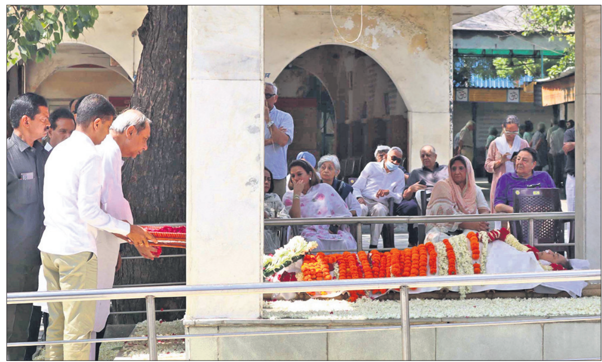
ନୂଆଦିଲ୍ଲୀ ଲୋଧି ରୋଡ୍‌ସ୍ଥିତ ଶ୍ମଶାନରେ ବଡ଼ ଭଉଣୀ ଗୀତା ମେହେଟାଙ୍କ ମରଣରାତରେ ମୁଖ୍ୟମନ୍ତ୍ରୀ ନବୀନ ପଟ୍ଟନାୟକ ଶ୍ରଦ୍ଧାଞ୍ଜଳି ଅର୍ପଣ କରୁଛନ୍ତି।