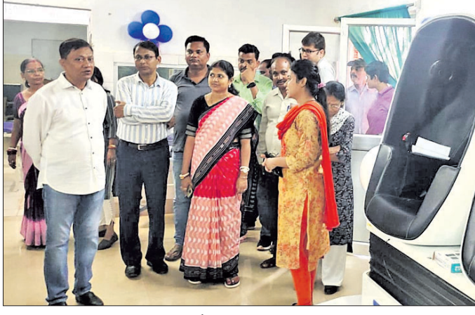
ଅପରେଶନ ଥିଏଟର ଉଦ୍‌ଘାଟନ କାର୍ଯ୍ୟକ୍ରମରେ ଉପସ୍ଥିତ ଅତିଥିମାନେ।