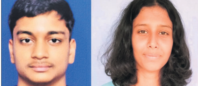
ରାଜ୍ୟସ୍ତରୀୟ ମନୋନୀତ ୨ ଛାତ୍ରୀଛାତ୍ର।

ଖୁଣ୍ଟା, ୧୮୮୯ (ଦେବରଞ୍ଜନ ଦେହେରା) - ୧୬ ବର୍ଷରୁ କମ୍ ରାଜ୍ୟସ୍ତରୀୟ ଦଳରେ ମୟୂରଭଞ୍ଜ ଜିଲ୍ଲା ଖୁଣ୍ଟା ବୁକରୁ ୨ ଛାତ୍ରୀଛାତ୍ର ସ୍ଥାନ ପାଇଛନ୍ତି। ଉକ୍ତ ମାଧ୍ୟମିକ ଶିକ୍ଷା ପରିଷଦ ଆନୁକୂଲ୍ୟରେ ଅନୁଷ୍ଠିତ ୧୬ ବର୍ଷରୁ କମ୍ ଉତ୍ତମ ବାଳକ ଓ ବାଳିକା ବର୍ଗର ରାଜ୍ୟସ୍ତରୀୟ ଶ୍ରୀତ୍ରୀ ପ୍ରତିଯୋଗିତାରେ