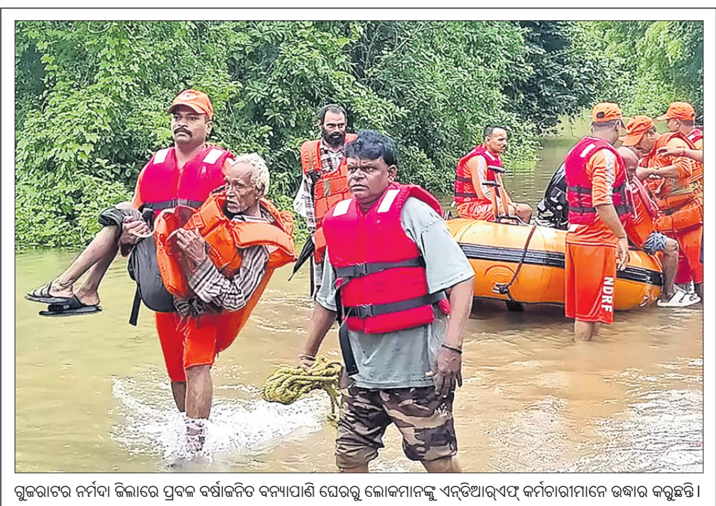
ଗୁଜରାଟର ନର୍ମଦା ନଦୀରେ ପ୍ରବଳ ବର୍ଷାକରିତ ବନ୍ୟାପାଣି ଘେରୁ ଲୋକମାନଙ୍କୁ ଏନ୍ତୁଆରଏଫ୍ କର୍ମଚାରୀମାନେ ଉଦ୍ଧାର କରୁଛନ୍ତି।