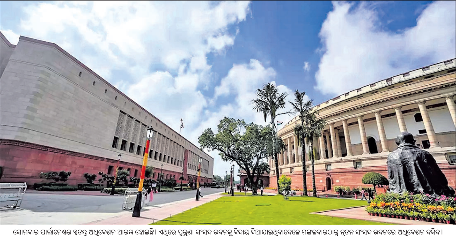
ସୋମବାର ପାର୍ଲିମେଣ୍ଟର ସ୍ୱତନ୍ତ୍ର ଅଧିବେଶନ ଆରମ୍ଭ ହୋଇଛି। ଏଥିରେ ପୁରୁଣା ସଂସଦ ଭବନକୁ ବିଦାୟ ଦିଆଯାଇଥିବାବେଳେ ମଙ୍ଗଳବାରଠାରୁ ନୂତନ ସଂସଦ ଭବନରେ ଅଧିବେଶନ ବସିବ।

ଏବଂ ଅର୍ଜୁନ ରାମ ମେଘାଲୀ ପ୍ରମୁଖ ଉପସ୍ଥିତ ଥିଲେ। ପାର୍ଲିମେଣ୍ଟର ସ୍ୱତନ୍ତ୍ର ଅଧିବେଶନରେ ଏହି ବିଧେୟକ ନିଷ୍ପତ୍ତି ନିଆଯିବ ବୋଲି ପ୍ରଧାନମନ୍ତ୍ରୀ ପୂର୍ବରୁ କହିଥିଲେ। ଇତିମଧ୍ୟରେ ବାଣିଜ୍ୟ ଓ ଶିଳ୍ପ ମନ୍ତ୍ରୀ ପାଣ୍ଡେ ଗୋୟଲ ଏବଂ ସଂସଦୀୟ ବ୍ୟାପାର ମନ୍ତ୍ରୀ ପ୍ରହାଦ ଗୋଷ୍ଠୀଙ୍କ ନେତୃତ୍ୱରେ ଏକାଧିକ ବୈଠକ ବସିଥିଲା। ସେଥିରେ ଭାଜପା ଅଧ୍ୟକ୍ଷ ଜେ.ପି. ନନ୍ଦା ଉପସ୍ଥିତ ଥିଲେ। ସ୍ୱତନ୍ତ୍ର ଅଧିବେଶନର କାର୍ଯ୍ୟକ୍ରମ ସମ୍ପର୍କରେ ସରକାର ପୂର୍ବରୁ କୌଣସି ସୂଚନା ଦେଇ ନ ଥିବାରୁ ମହିଳା ସଂରକ୍ଷଣ ବିଲ୍ କିମ୍ବା 'ଗୋଟିଏ ରାଷ୍ଟ୍ର ଏକ ନିର୍ବାଚନ' ପ୍ରସଙ୍ଗ ଉପରେ ଆଲୋଚନା ହୋଇପାରେ ବୋଲି କଳ୍ପନା କଳ୍ପନା ପ୍ରକାଶ ପାଇଥିଲା। ତେବେ ଚଳିତ ସ୍ୱତନ୍ତ୍ର ଅଧିବେଶନରେ ଏହି ବିଲ୍ ପାର୍ଲିମେଣ୍ଟରେ ଉପସ୍ଥାପିତ ହେବ ବୋଲି ସୂଚନା ମିଳିଛି।