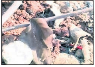
ମାଲକାନଗିରି, ୧୮୮୯ (ଦୁର୍ଯ୍ୟୋଧନ ପାତ୍ର)

ସିଆରପିଏଫ୍, କୋଗ୍ରା, ତିଆରକି ବାହିନୀ ପ୍ରାମାଣିକତା ଆଇଲଡି ଉଦ୍ଧାର