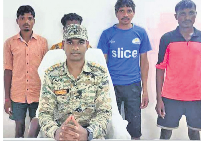
ଆତ୍ମସମର୍ପଣ କରିଥିବା ୪ ମାଓବାଦୀ।