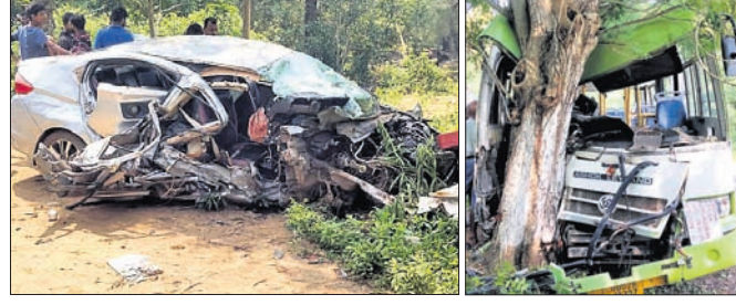
ଦୁର୍ଘଟଣାଗ୍ରସ୍ତ କାର୍ ଓ ବସ୍।

ପୁରୀ (ଅଭିଜିତ ମହାନ୍ତି)/ କୋଣାର୍କ (କୋଷାଧିକାରୀ ମହାନ୍ତି) ୧୮୮୯ ପୁରୀ ବାଲିଯାଇ ଛକ ନିକଟରେ ସୋମବାର ଏକ ମର୍ତ୍ତ୍ୟୁହତ ବସ୍ ଚାଳକଙ୍କୁ ଦେଖିବାକୁ ମିଳିଥିଲା। ପୁର୍ଣ୍ଣାମୁହିଁ ଧକ୍କା ହେବା ପରେ ବସ୍ ଚାଳକଙ୍କୁ ଚିକିତ୍ସା ପାଇଁ ଡାକିଥିଲେ। କର୍ମସୂଚିର ପରେ ସୁନ୍ଦରଗଡ଼ ସୁବର୍ଣ୍ଣ କଲ୍ୟାଣମଣ୍ଡପ ନିକଟରେ ୨/୩ଟି ଗାଡ଼ିରେ ବଡ଼ଧରଣର କର୍ମସୂଚିର ପରିଚାଳନା ହେଉଥିବା ଖବର ମିଳିଥିଲା। ସ୍ୱତନ୍ତ୍ର ପୋଲିସ୍ ଚିନ୍ତା ଉକ୍ତ ସ୍ଥାନରେ ଚଢ଼ାଇ କରି ସେଠାରେ ଥିବା ଦୁଇ କାର (ନିସାନ୍ ଓଡିଏଫଏଲଏ୨୭୨ ଏବଂ ବାଲେଶା ଓଡିଏଫଏଏ୪୨୯) ଏବଂ ତିନୋଟି ବାଇକକୁ ଅଟକ ରଖି ସଂଗ୍ରହ କରିଥିଲା। ଉକ୍ତ କାରକୁ କର୍ମସୂଚିର ଜବତ ହୋଇଥିଲା। ଏହାପରେ ବଲାଙ୍ଗୀର ପୋଲିସ୍ ବିଭିନ୍ନ ସ୍ଥାନରେ