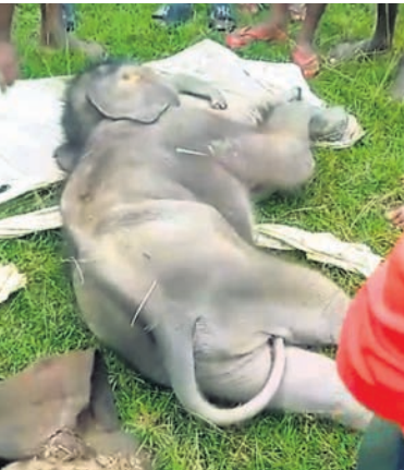
ଖାଲରୁ ଉଦ୍ଧାର ହୋଇଥିବା ଛୁଆହାତୀ ।

ପ୍ରାଣୀ ଚିକିତ୍ସକ ଚିନ୍ତା ଚାହାର ଚିକିତ୍ସାରେ ଲାଗିଛନ୍ତି । ଏନେଇ କରଞ୍ଜିଆ ଡିଏଫ୍ଓଙ୍କୁ ପଚାରିବାରୁ ହାତୀ ଛୁଆଟି ସୁରକ୍ଷିତ ଅଛି । ଦୁଇଟି ଡାକ୍ତରାଗିମାଙ୍କ ଦ୍ୱାରା ଚିକିତ୍ସା ପରେ ସେ ସୁସ୍ଥ ହୋଇ ଖେଳାବୁଲା କରୁଛି । ସମ୍ପୂର୍ଣ୍ଣ ସୁସ୍ଥ ହୋଇଯିବା ପରେ ତାହାକୁ ଅଇଥାନ କରାଯିବ ବୋଲି ସେ କହିଛନ୍ତି । ତେବେ କୋଲେ ଘଉଡ଼ାଉଥିବାରୁ ହାତୀ ପଲରେ ଥିବା ୫/୬ ମାସର ଦୁଇଟି ଛୁଆ ହାତୀକୁ ନେଇ ବନ ବିଭାଗର ଚିଠି ପଡ଼ିଛି । ହାତୀକୁ ନ ଘଉଡ଼ାଳିବା ପାଇଁ ବନ ବିଭାଗ ପକ୍ଷରୁ ଲୋକଙ୍କୁ ନିବେଦନ କରାଯାଉଥିଲେ ମଧ୍ୟ କେହି ଶୁଣୁନାହାନ୍ତି । ଏଣୁ ହାତୀ ପଲ ଗୋଟିଏ ସ୍ଥାନରୁ ଅନ୍ୟସ୍ଥାନକୁ ଧାଉଁଥିବା ବେଳେ ବିଶ୍ରାମ ନେଇ ପାରୁନାହାନ୍ତି । ଫଳରେ ସେମାନଙ୍କ ଜୀବନ ପ୍ରତି ବିପଦ ରହିଛି । ଉଲ୍ଲେଖଯୋଗ୍ୟ, ହାତୀମାନଙ୍କୁ ଘଉଡ଼ାଳିବା ବେଳେ ସେମାନେ ଏଣେତେଣେ ଧାଉଁଛନ୍ତି । ଅନେକ ସମୟରେ ଖାଲଖାମାରେ ପଡ଼ି କ୍ଷତବିକ୍ଷତ ହେବା ସମ୍ଭାବନା ରହିଛି । ଏଣୁ ସେମାନଙ୍କ ସ୍ୱାସ୍ଥ୍ୟ ପାଇଁ ବନବିଭାଗ ଚିକିତ୍ସା ରହିଥିବା ବେଳେ ସେମାନଙ୍କ ଗତିପଥ ନିରୀକ୍ଷଣ କରିବା ସହ ସ୍ୱାସ୍ଥ୍ୟ ସମସ୍ୟା ଉପରେ ନଜର ରଖିବାକୁ ପଡ଼ୁଛି ବୋଲି ବନ ବିଭାଗ ଅଧିକାରୀମାନେ କହୁଛନ୍ତି ।