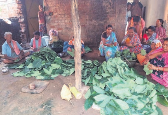
ମହିଳାମାନେ ନୂଆଖାଇ ପାଇଁ କୁରେପତ୍ରର ଖଳିଦାନା ଚିପାରେ ଲାଗିଛନ୍ତି।

ବଲାଙ୍ଗୀର, ୧୮ (ବାରେନ୍ଦ୍ର କୁମାର ଝାଙ୍କର) ପଶ୍ଚିମ ଓଡ଼ିଶାର ଗଣପର୍ବ ନୂଆଖାଇ ଚିହାର ଲାଗି ପୁରପଲ୍ଲୀରେ ଉତ୍ସାହ ଓ ଭିତ ଦେଖାଦେଖାଣି ଆସନ୍ତା ୨୦ ଚାରିଖରେ ନୂଆଖାଇ ପାଳନ ହେବ। ନୂଆଖାଇ ଚିହାର ପାଳନକୁ ପୁରପଲ୍ଲୀରେ ଲୋକେ ନିଜ ନିଜ ଘରକୁ ଫେରୁଛନ୍ତି। ରାସ୍ତାଘାଟରେ ସ୍ୱତନ୍ତ୍ର ଦେଖାଯାଉଛି ଭିତ। ଯାନବାହନରେ ଲୋକେ ଘରକୁ ଆସୁଥିବା ଦେଖାଯାଉଛି।