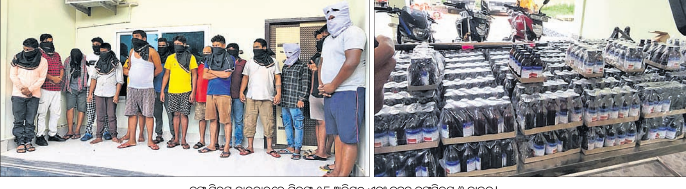
କର୍ମସୂଚିର ପରିଚାଳନାରେ ଗିରଫ ୧୮ ଅଭିଯୁକ୍ତ ଏବଂ ଜବତ କର୍ମସୂଚିର ଓ ବାଉନ୍ଦ।