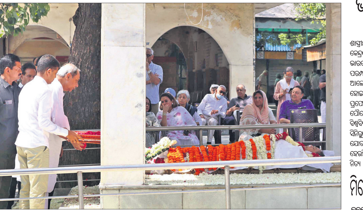
ନୂଆଦିଲ୍ଲୀ ଲୋଧି ରୋଡ଼ସ୍ଥିତ ଶ୍ମଶାନରେ ବଡ଼ ଭଉଣୀ ଗୀତା ମେହେଟାଙ୍କ ମରଣୋତ୍ସବରେ ମୁଖ୍ୟମନ୍ତ୍ରୀ ନବାନ ପଟ୍ଟନାୟକ ଶ୍ରଦ୍ଧାଞ୍ଜଳି ଅର୍ପଣ କରୁଛନ୍ତି।