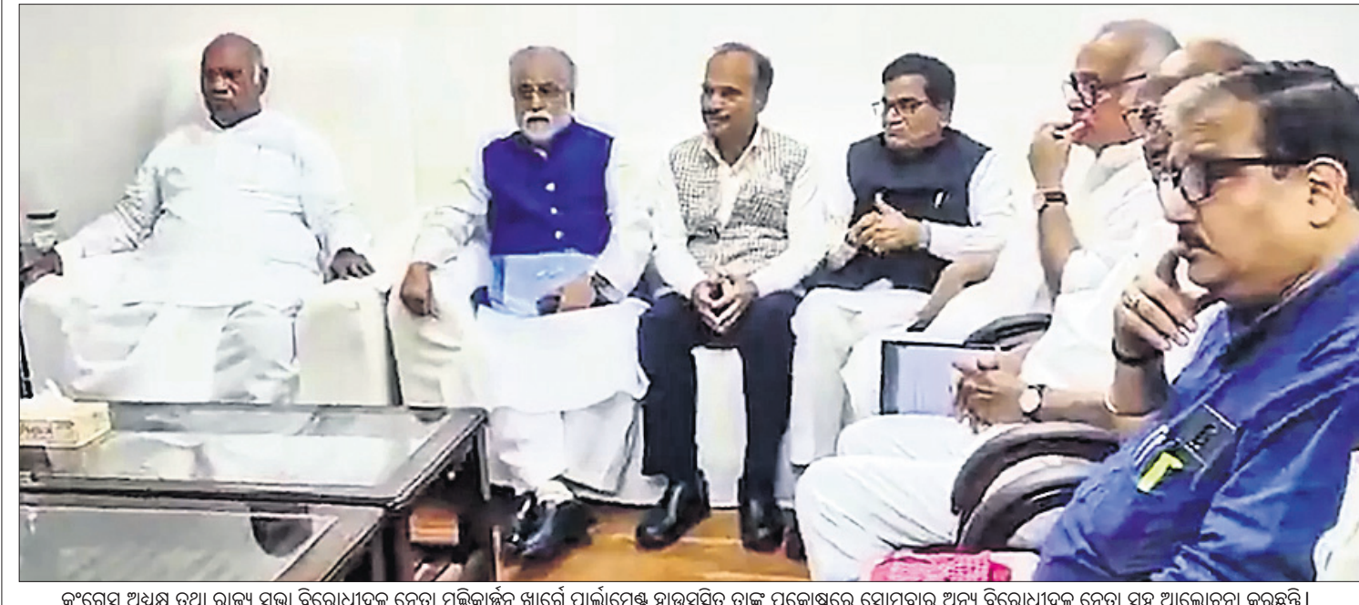
କଂଗ୍ରେସ ଅଧ୍ୟକ୍ଷ ତଥା ରାଜ୍ୟ ସଭା ବିରୋଧୀଦଳ ନେତା ମଲ୍ଲିକାର୍ଜୁନ ଖାର୍ଯ୍ୟେ ପାର୍ଲିମେଣ୍ଟ ହାଲ୍ ସମ୍ମିତ ତାଙ୍କ ପ୍ରକାଶରେ ସୋମବାର ଅନ୍ୟ ବିରୋଧୀଦଳ ନେତା ସହ ଆଲୋଚନା କରୁଛନ୍ତି।