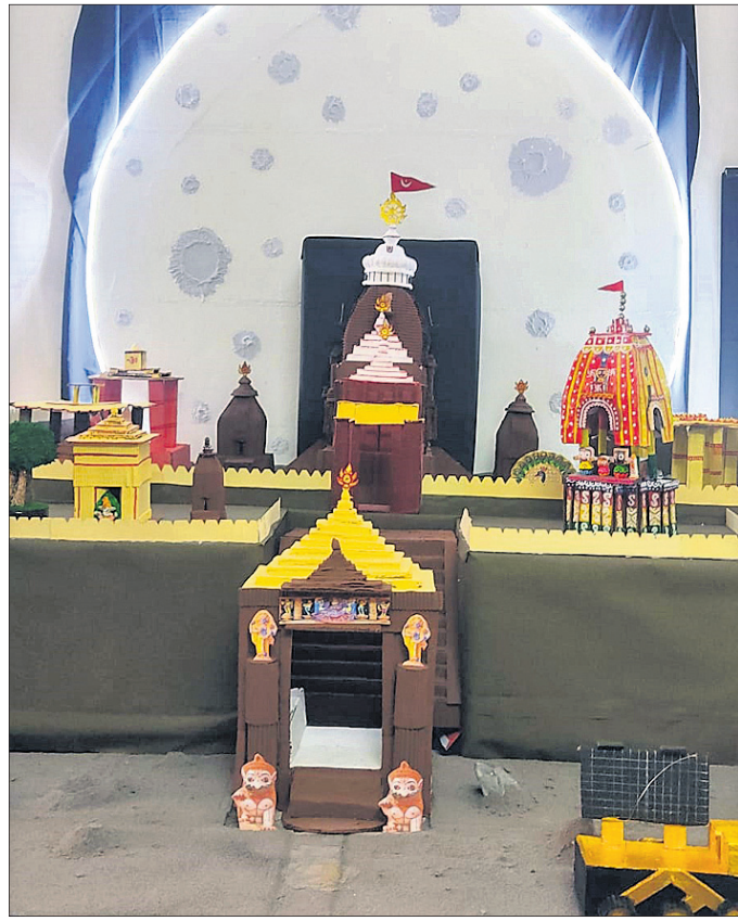
କଟକର ପୁରୀ ଗୁରୁତାଳୟରେ ପ୍ରସ୍ତୁତ ଚନ୍ଦ୍ରଯାନ-୩ର ପେଣ୍ଡାଲ।

ବଣିଆସାହିରେ ମଦନମୋହନ ସମିତି ପକ୍ଷରୁ ପୂଜା ପାଠକରି ସହରର ସର୍ବପୁରାତନ ତଥା ପ୍ରଥମ ବୁଢ଼ା ଗଣେଶ।