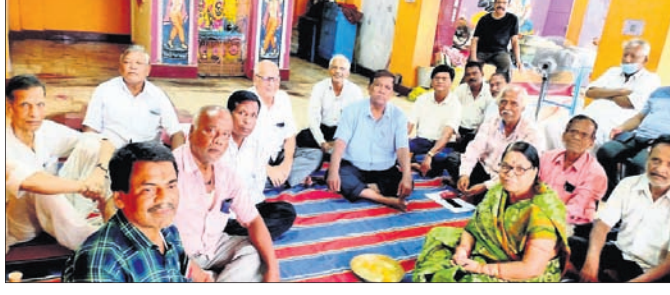
ବୈଠକରେ ଯୋଗଦେଇଥିବା ଅବସରପ୍ରାପ୍ତ ଶିକ୍ଷକସଂଘର ସଦସ୍ୟମାନେ।

ଚୈତ୍ୟର ଅବସରପ୍ରାପ୍ତ ଶିକ୍ଷକ ସଂଘର ବୈଠକ କଲିଙ୍ଗ ଛକସ୍ଥିତ ସାହୁଙ୍କ ଚକ୍ରାଧିକାରରେ ଜିଲା ପରିଷଦ ଜ୍ଞାନ ଅର୍ଜୁନ ସାନକାରସିଂହ ପଞ୍ଚାୟତ କାର୍ଯ୍ୟାଳୟ, ମାଣିଆବନ୍ଧ ବୋଲମଣ୍ଡପ ଓ ଅଭିମାନପୁର ପଞ୍ଚାୟତ କର୍ମାଣୀ ମଣ୍ଡପରେ ପୂର୍ଣ୍ଣ ଭାବେ ଏହି କାର୍ଯ୍ୟକ୍ରମ ଆୟୋଜନ କରାଯାଇଥିଲା।