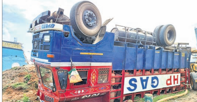
ଏଲ୍ପିଜି ସିଲିଣ୍ଡର ବୋଝେଇ କରି ଯାଉଥିବା ଏକ ଟ୍ରକ ଯୋଗବାନ ସକାଳେ ୧୬ ନମ୍ବର ଜାତୀୟ ରାଜପଥର ଶିଖରପୁର ଛକରେ ଦୁର୍ଘଟଣାଗ୍ରସ୍ତ ହୋଇଛି।

ହରାଇ ଓଲଟିପଡ଼ିଥିଲା। ଟ୍ରକ ତାଲାକୁ ଶତାଧିକ ସିଲିଣ୍ଡର ବାହାରି ବିଛାଡ଼ି ଦୁର୍ଘଟଣାଗ୍ରସ୍ତ ହୋଇଛି।