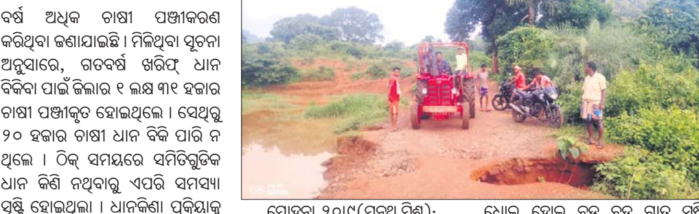
ମୋହନା,୨୦୧୯(ମନୁଜ ମିଶ୍ର): ଧୋଇ ହୋଇ ବଡ଼ ଗାଡ଼ ସୃଷ୍ଟି ହୋଇଛି।

ଲଗାଣ ବର୍ଷାରେ ଧୋଇଗଲା ରାସ୍ତା। ଫଳରେ ୧୫ ଖଣ୍ଡ ଗାଁକୁ ଯାତାୟତ ବାଧ୍ୟପ୍ରାପ୍ତ ହୋଇଛି।