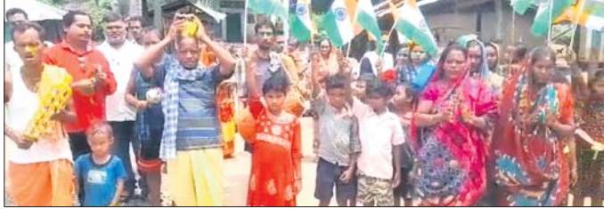
ପଞ୍ଚାୟତ ସଭାପତିଙ୍କ ସହିତ ସରାଧିକ ମହିଳା ପୁରୁଷ ମାଟି ସଂଗ୍ରହ କରିବାକୁ ଯାଉଛନ୍ତି।

ମୋହନା,୨୦୧୯(ମନୁଜ ମିଶ୍ର): ଗଜପତି ପ୍ରସାଦ ନିକଟରେ ଗଜପତି ଜିଲ୍ଲା ମୋହନା ନିର୍ବାଚନ ମଣ୍ଡଳୀର ଭାରତୀୟ ଜନତା ପାର୍ଟି ରାଷ୍ଟ୍ରୀୟ ଅଧ୍ୟକ୍ଷ