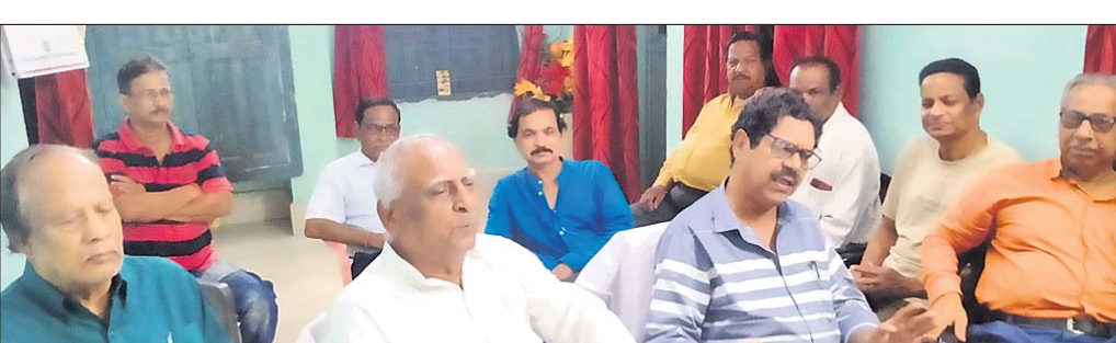
ମିଳିତ ନାଗରିକ କମିଟି କର୍ମକର୍ତ୍ତା।

ପୁଲବାଣୀ ପୌର ପରିଷଦର ହୋଇଛି ଚ୍ୟାକ୍ସ ଚୁଡ଼ିପୂର୍ଣ୍ଣ ମୂଲ୍ୟାୟନକୁ ସଂଶୋଧନ କରିବାକୁ ଜିଲ୍ଲା ମିଳିତ ନାଗରିକ କମିଟି ପକ୍ଷରୁ ଦାବି କରାଯାଇଛି।