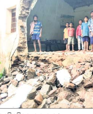
ଭୁଣ୍ଡିତପଡ଼ିଥିବା ସ୍କୁଲ କାନ୍ଦୁ।

ପାରଳାଖେମୁଣ୍ଡି/ରାୟଗଡ଼, ୨୦୧୯ (ଗିରିଧାରୀ ପରିଜା/କ୍ୟୋତିପ୍ରକାଶ ପାଣି): ଗଜପତି ଜିଲ୍ଲାରେ ଗତ ଦୁଇଦିନ ଧରି ବନ୍ଦୋଧପାତ୍ରରେ ସୃଷ୍ଟି ଲାଗୁତାପ ପ୍ରଭାବରେ ଲଗାଣ ବର୍ଷା ଲାଗି ରହିଛି।