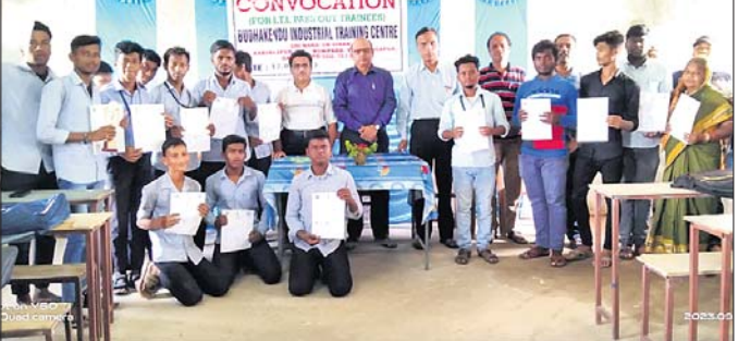
ସମାରୋହରେ ଉପସ୍ଥିତ ଅତିଥି।

ବେଲଗୁଣା,୨୦୧୯(କୃଷ୍ଣ ଚନ୍ଦ୍ର ପଟ୍ଟନାୟକ) ବେଲଗୁଣା ବ୍ଲକ ଅନ୍ତର୍ଗତ କବିରାଜପୁର ଗ୍ରାମ ପଞ୍ଚାୟତର ଶିଳ୍ପ ଡାଲିମ କେନ୍ଦ୍ରରେ କୌଶଳ ଦୀକ୍ଷାନ୍ତ ସମାରୋହ କାର୍ଯ୍ୟକ୍ରମ ଅନୁଷ୍ଠିତ ହୋଇଯାଇଛି।