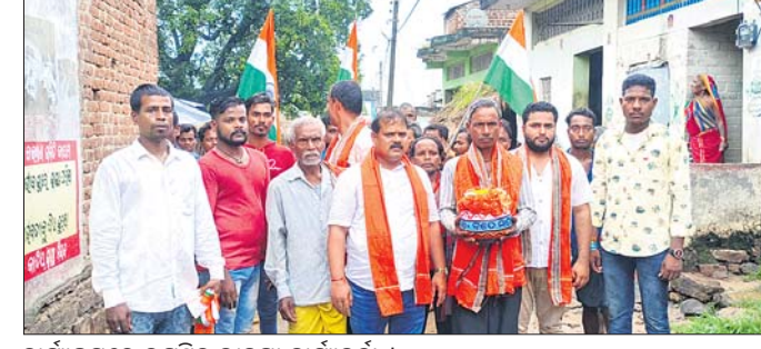
କାର୍ଯ୍ୟକ୍ରମରେ ଉପସ୍ଥିତ ଭାବପା କାର୍ଯ୍ୟକର୍ତ୍ତା।

ବେଗୁନିଆପଡ଼ା,୨୦୧୯(ପ୍ରଶାନ୍ତ କୁମାର ପଟ୍ଟନାୟକ) ମୋଦିଙ୍କ ଆହ୍ୱାନ କ୍ରମେ ମାଟି ସଂଗ୍ରହ କରାଯାଇ ଦିଲ୍ଲୀଠାରେ ନିର୍ମାଣ ରାଜିଥିବା ଅନୁଷ୍ଠାନକୁ ପ୍ରେରଣ କରାଯିବ।