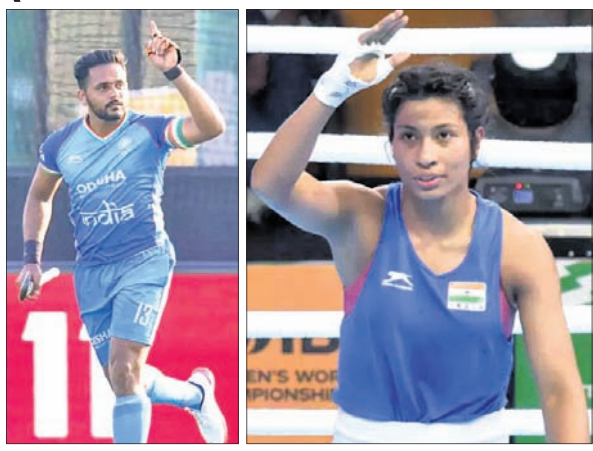
ହରମନ୍‌ପ୍ରାଡ଼ ସି ଓ ଲଭଲିନା ବୋର୍ନୋହେନ।

ଏସିଆନ୍ ଗେମ୍ସ ୨୦୨୩ ଚାଲିନାରି ହାରମନ୍‌ପ୍ରାଡ଼ ହେଉଛି। ସେପ୍ଟେମ୍ବର ୨୩ରୁ ଏହି ଇଭେଣ୍ଟ ଅନୁଷ୍ଠିତ ହେବାକୁ ଥିବା ବେଳେ ପୁରୁଷ ହକି ଦଳର ଅଧିନାୟକ ହରମନ୍‌ପ୍ରାଡ଼ ସି ଓ ମହିଳା ବକ୍ସର ଲଭଲିନା ବୋର୍ନୋହେନକୁ ଭାରତର ଧୂଜାବାହକ ଭାବରେ ଯୋଗଣା କରାଯାଇଛି। ରୁଧିବାର ଭାରତୀୟ ଅଲିମ୍ପିକ୍ ମହାସଂଘ(ଆଇଓଏ) ପକ୍ଷରୁ ଏହି ଯୋଗଣା କରାଯାଇଛି। ଫଳରେ ଉତ୍ସାହୀନ ଉତ୍ସବରେ