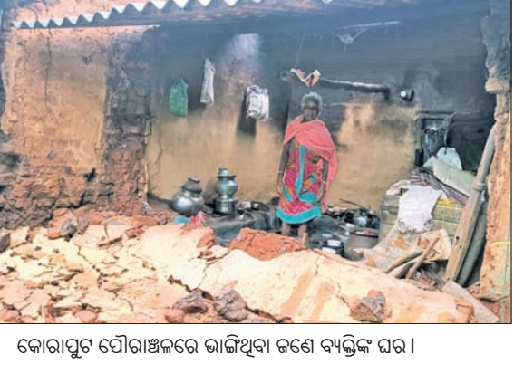
କୋରାପୁଟ ପୌରାଜିକରେ ଭାଙ୍ଗିଥିବା ଜଣେ ବ୍ୟକ୍ତିଙ୍କ ଘର।