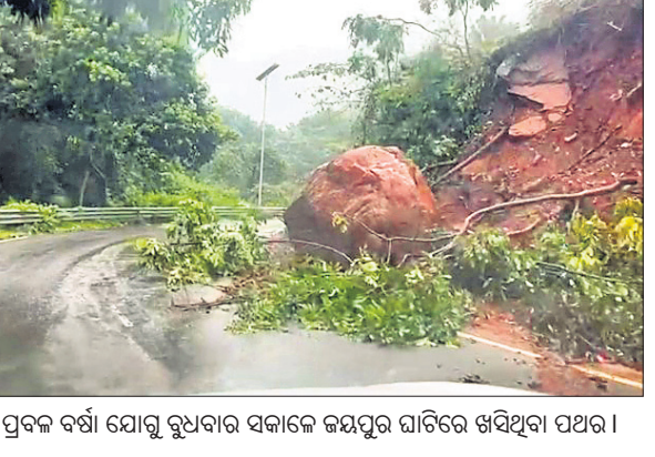
ପ୍ରବଳ ବର୍ଷା ଯୋଗୁ ଗୁପ୍ତାବାର ସକାଳେ ଜୟପୁର ଘାଟିରେ ଖସିଥିବା ପଥର।

କୋରାପୁଟ ନିୟମାବଳୀ/ ବର୍ଷାପ୍ରସଙ୍ଗ/ ଜୟପୁର, ୨୦।୯ (ଅନିତା କୁମାର) କୋରାପୁଟ ପୌରାଜିକରେ ପ୍ରବଳ ବର୍ଷାରେ ୧୪ ଘର ଭାଙ୍ଗି ଯାଇଛି। କୋରାପୁଟ ପୌରାଜିକରେ ପ୍ରବଳ ବର୍ଷାରେ ୧୪ ଘର ଭାଙ୍ଗି ଯାଇଛି। କୋରାପୁଟ ପୌରାଜିକରେ ପ୍ରବଳ ବର୍ଷାରେ ୧୪ ଘର ଭାଙ୍ଗି ଯାଇଛି। କୋରାପୁଟ ପୌରାଜିକରେ ପ୍ରବଳ ବର୍ଷାରେ ୧୪ ଘର ଭାଙ୍ଗି ଯାଇଛି। କୋରାପୁଟ ପୌରାଜିକରେ ପ୍ରବଳ ବର୍ଷାରେ ୧୪ ଘର ଭାଙ୍ଗି ଯାଇଛି। କୋରାପୁଟ ପୌରାଜିକରେ ପ୍ରବଳ ବର୍ଷାରେ ୧୪ ଘର ଭାଙ୍ଗି ଯାଇଛି।