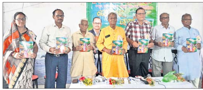
ଜୀବନ ପ୍ରୟୋଗ କଲ୍ୟାଣ ମଣ୍ଡପାଠରେ ଅତିଥି ପୁସ୍ତକ ଉନ୍ମୋଚନ କରୁଛନ୍ତି ।