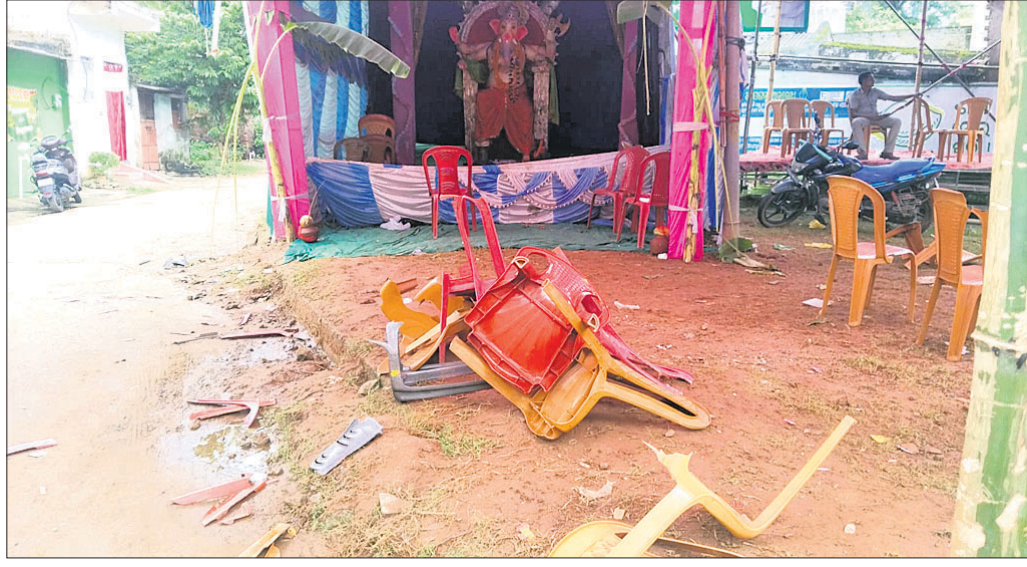
ଗଣେଶ ପରେ ଭଙ୍ଗାଗୁଡ଼ା ଅବଶେଷ ପଡ଼ିଥିବା ଦୃଶ୍ୟକୁ ଦେଖାଉ ।

■ ଉଭୟ ପକ୍ଷର ୩ ଗୁରୁତର, ୭ ଜେଲ ଗଲେ ■ ପୋଲିସ୍ ଉପସ୍ଥିତିରେ ଗୋଡ଼େଇ ଗୋଡ଼େଇ ପିଟିଲେ