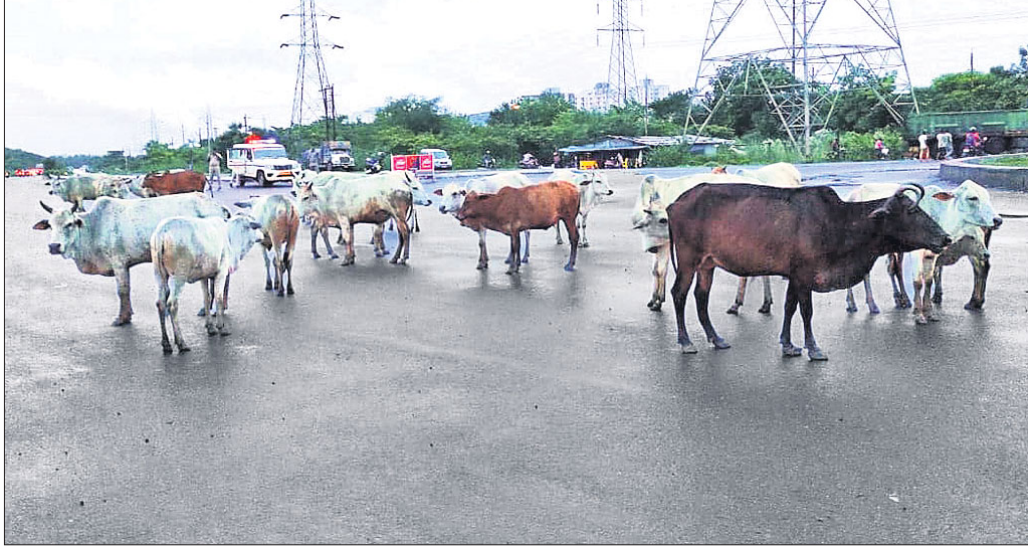
ରାସ୍ତା ଉପରେ ଗୋରୁପଲ ଚଳୁଛନ୍ତି ।

କଳିଙ୍ଗନଗର ଶିଳ୍ପାଞ୍ଚଳରେ ପ୍ରତିଦିନ ହଜାରହଜାର ଗୋରୁ ଚଳାଚଳ କରୁଛି । ସମସ୍ତ ଓ ଖାଲ ପୂର୍ଣ୍ଣ ରାସ୍ତା ସାଙ୍ଗକୁ ବନ୍ଦାୟ ମାନପୁର ରେଳ ଉତ୍ତରଦିଗ ପାଇଁ ଶିଳ୍ପାଞ୍ଚଳ ରାସ୍ତା ବ୍ୟବହାର କରୁଥିବା ଯାନବାହନ ଚାଳକ ପ୍ରତ୍ୟହ ଦୁର୍ଘଟଣାର ସାମ୍ମୁଖିକ ହୁଏ । ଏକ ସମୟରେ ପରିସ୍ଥିତିକୁ ବୁଝିପାରୁ ନଥିବା ଯାନବାହନ ଚାଳକ ଗୋରୁଙ୍କ ଗହଳି । ଶିଳ୍ପାଞ୍ଚଳରେ ଗୋରୁ ପାଲିକମାନେ ଗୋରୁଙ୍କୁ ଗୋରୁଙ୍କୁ ଚଢ଼ି ଦେଇ ଯେତେ ଶୁଣିକଳ ରହିବା ପାଇଁ ଭଡ଼ା ଘର ପ୍ରସ୍ତୁତ କରିଛନ୍ତି । ଫଳରେ ଗୋରୁଙ୍କୁ ନ ଥିବାରୁ ଗାଈ, ବଳଦ, ବାହୁରି ଓ ଷଣ୍ଢ ରାଜରାସ୍ତାକୁ ନିକଟ ଆଶ୍ରୟସ୍ଥଳ ଭାବେ ବାଛି ନେଇଛନ୍ତି । ଦିନଟମା ଦଳଦଳ ହୋଇ ରାସ୍ତା ଉପରେ ଛିଡ଼ା ହେଉଥିବା ଗାଈପଲ ରାତିରେ ମଝି ରାସ୍ତାରେ ଶୋଇ ପଡ଼ୁଛନ୍ତି । ଫଳରେ ଅନେକ ସମୟରେ ଏହି କାରଣରୁ ଦୁର୍ଘଟଣାମାନ ଘଟୁଛି । ଏହି ପରିସ୍ଥିତି ମିଳିତାଗା ଛକଠାରୁ ପୂର୍ବ ଦିଗର ରାସ୍ତାର ଗ୍ରାମିଣ ସମସ୍ୟା ନିୟନ୍ତ୍ରଣ ପାଇଁ କୌଣସି ଦାନନଦି ବଜାର, ସିଙ୍ଗାପୁରା, କୁନ୍ତଳି ଓ ବାରଗାଡ଼ିଆ ଛକ ନିକଟରେ ଦେଖିବାକୁ ମିଳୁଛି । ସେହିପରି ଚଳାଚଳ କରୁଥିବା ଗୋରୁଙ୍କୁ କୋର କୋର ରାସ୍ତାରେ ହାଟକରେ ମଧ୍ୟ ଦେଖିବାକୁ ମିଳୁଛି । ଏହି ଦୁର୍ଘଟଣା କାରଣ ସାଙ୍ଗରେ ଶିଳ୍ପାଞ୍ଚଳର ରାସ୍ତା ଉପରେ ଗୋରୁ ପଲକୁ ନିୟନ୍ତ୍ରଣ କରାଯିବ ଯେପରିକି ପ୍ରଶାସନ ଦୃଷ୍ଟିଦେବାକୁ ଗୋରୁଙ୍କୁ ରାସ୍ତା ଉପରେ ନ ଥିବା ବ୍ୟବସ୍ଥା ନାହିଁ । ଯାହା ଶିଳ୍ପର ରାଜଧାନୀଭାବେ ଏଥିପାଇଁ ମହାବେଶରେ ପରିଚୟ ଲାଭ କରିଥିବା ଏହି କଳିଙ୍ଗନଗର ଶିଳ୍ପାଞ୍ଚଳର ରାସ୍ତା ଉପରେ ଗୋରୁ ପଲକୁ ନିୟନ୍ତ୍ରଣ କରାଯିବ ଯେପରିକି ପ୍ରଶାସନ ଦୃଷ୍ଟିଦେବାକୁ ଗୋରୁଙ୍କୁ ରାସ୍ତା ଉପରେ ନ ଥିବା ବ୍ୟବସ୍ଥା ନାହିଁ । ଯାହା ଶିଳ୍ପର ରାଜଧାନୀଭାବେ ଏଥିପାଇଁ ମହାବେଶରେ ପରିଚୟ ଲାଭ କରିଥିବା ଏହି କଳିଙ୍ଗନଗର ଶିଳ୍ପାଞ୍ଚଳର ରାସ୍ତା ଉପରେ ଗୋରୁ ପଲକୁ ନିୟନ୍ତ୍ରଣ କରାଯିବ ଯେପରିକି ପ୍ରଶାସନ ଦୃଷ୍ଟିଦେବାକୁ ଗୋରୁଙ୍କୁ ରାସ୍ତା ଉପରେ ନ ଥିବା ବ୍ୟବସ୍ଥା ନାହିଁ ।