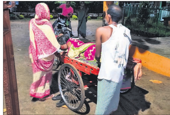
ରୋଗୀଙ୍କୁ ଚାଲିରେ ବୁହାହେଲା ନିଆଯାଇଛି ।