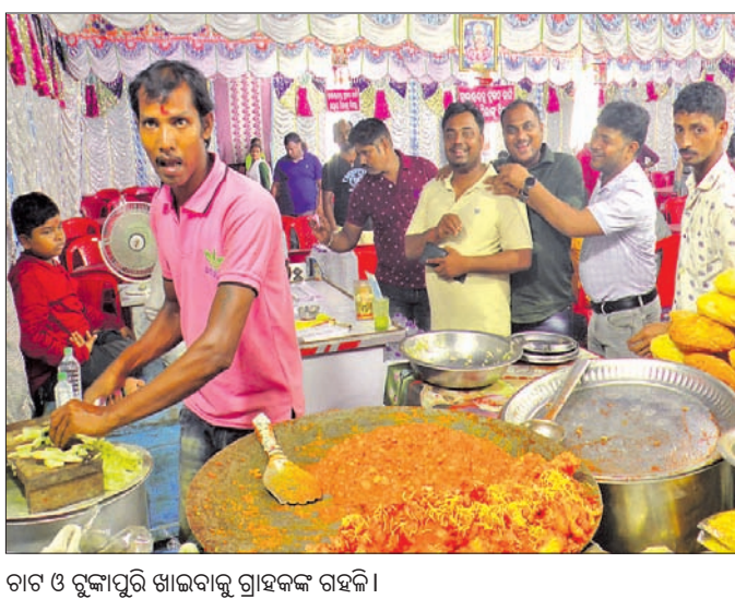
ଗଡ଼ ଓ ବୁଲ୍‌ପୁର ଖାଇବାକୁ ଗ୍ରାହକଙ୍କ ଗହଳି।