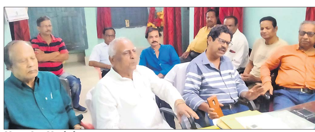
ମିଳିତ ନାଗରିକ କମିଟି କର୍ମକର୍ତ୍ତା।

ପୁଲବାଣୀ, ୨୦୧୮(ରାଜେଶ କୁମାର ରାଉତ): ପୁଲବାଣୀ ପୌର ପରିଷଦର ହୋଲ୍ଡିଂ ଟ୍ୟାକ୍ସ ସଂଗ୍ରହ ପୂର୍ବରୁ ଡୁଇପ୍ଲ୍ୟୁ ମୂଲ୍ୟାୟନକୁ ସଂଶୋଧନ କରିବାକୁ ଜିଲ୍ଲା ମିଳିତ ନାଗରିକ କମିଟି ପକ୍ଷରୁ ଦାବି କରାଯାଇଛି।