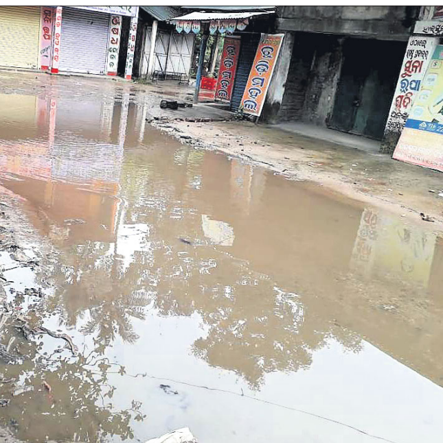
ସିଂହପୁର ବଜାର ରାସ୍ତାରେ ବର୍ଷା ପାଣି ଲହଡ଼ି ମାଉଛି ।

ସିଂହପୁର, ୨୦୧୯ (ଅନଳ ଉଦୟ ବେହେରା): ସିଂହପୁର ବଜାର ପ୍ରମୁଖ ବ୍ୟବସାୟୀ କେନ୍ଦ୍ର ସିଂହପୁର ବଜାର ରାସ୍ତାରେ ବର୍ଷା ପାଣି ଲହଡ଼ି ମାଉଛି । ସାମାନ୍ୟବର୍ଷାରେ ମଧ୍ୟ ପାଣି ଜମି ରହୁଛି । ବଜାରର ମୁଖ୍ୟ ରାସ୍ତାଠାରୁ ସିଂହପୁର ହାଲସ୍କୁଲ ଓ ତାଳଘର ରାସ୍ତାରେ ଦୀର୍ଘ ଦିନହେବ ଏହି ସମସ୍ୟା ଲାଗି ରହିଛି । ହେଲେ ଏହାର ପ୍ରତିକାର କରାଯାଉନାହିଁ । ଫଳରେ ଲୋକେ ଏହି ଦୃଷ୍ଟି ପାଣିରେ ବାଧ୍ୟ ହୋଇ ଯାହା ଯାତ କରୁଛନ୍ତି । ମୁଖ୍ୟତଃ ଝୁଲ ଓ କଲେଜ ଛାତ୍ରଛାତ୍ରୀ ବହୁ ହାନିପ୍ରାପ୍ତ ହେଉଥିବା ଦେଖିବାକୁ ମିଳୁଛି । ସେଠାରେ ଆରବି ବିଭାଗ ଉକ୍ତ କର୍ତ୍ତୃପକ୍ଷ ତୁରନ୍ତ ରାସ୍ତା ପ୍ରତି ଦୃଷ୍ଟି ଦେବାକୁ ଜନସାଧାରଣଙ୍କ ପକ୍ଷରୁ ଦାବି ହୋଇଛି ।