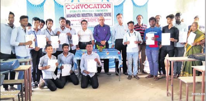
ସମାରୋହରେ ଉପସ୍ଥିତ ଅତିଥି।

ବେଲଗୁଣ୍ଡା,୨୦୧୮(କୃଷ୍ଣ ଚନ୍ଦ୍ର ପଟ୍ଟନାୟକ): ବେଲଗୁଣ୍ଡା ବ୍ଲକ ଅନ୍ତର୍ଗତ କବିରାଜପୁର ଗ୍ରାମ ପ୍ରଶାସନରୁ ଶିଳ୍ପ ଡାଲିମ କେନ୍ଦ୍ରରେ କୌଶଳ ଦୀକ୍ଷାନ୍ତ ସମାରୋହ କାର୍ଯ୍ୟକ୍ରମ ଅନୁଷ୍ଠିତ ହୋଇଯାଇଛି।