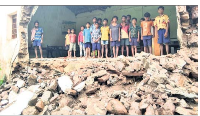
ଭୁଣ୍ଡିଡିଥିବା ସ୍କୁଲ କାନ୍ଧ।

ପାରଳାଖେମୁଣ୍ଡି/ରାୟଗଡ଼, ୨୦୧୮ (ଗିରିଧାରୀ ପରିଜା/କ୍ୟୋଟିପ୍ରକାଶ ପାଣି): ଗଜପତି ଜିଲ୍ଲାରେ ଗତ ଦୁଇଦିନ ଧରି ବନ୍ତୋପସାଗରରେ ସୃଷ୍ଟି ଲାଗୁତାପ ପ୍ରଭାବରେ ଲଗାଣ ବର୍ଷା ଲାଗି ରହିଛି।