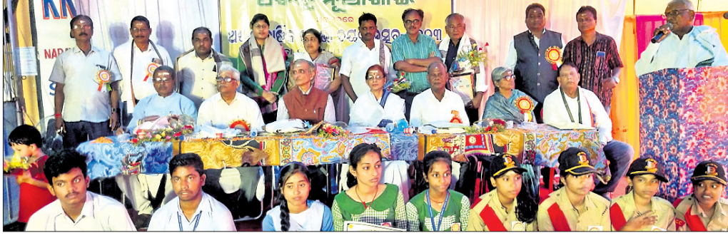
ରଘୁନାଥପୁର, ୨୦୧୯