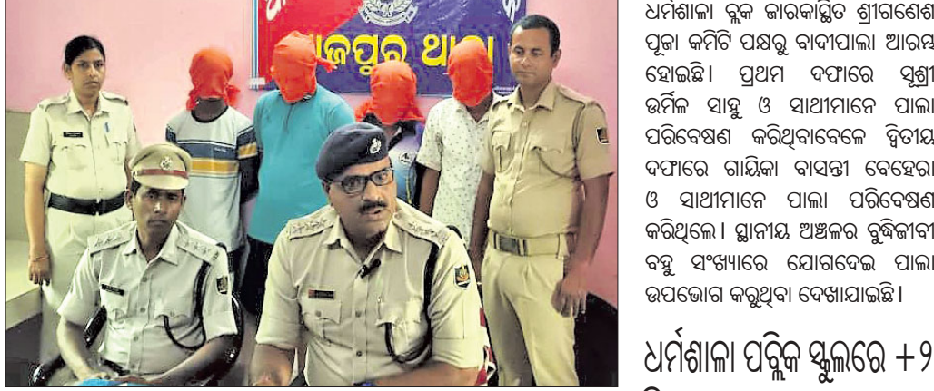
ଗିରଫ ୪ ଅଭିଯୁକ୍ତଙ୍କ ସମ୍ପର୍କରେ ପୋଲିସ୍ ସୂଚନା ଦେଇଛି ।

ଯାଜପୁର ଗଢନ, ୨୦୧୯ (ପ୍ରସାନ୍ନ ପ୍ରିୟଦର୍ଶିନୀ ମହାନ୍ତି):