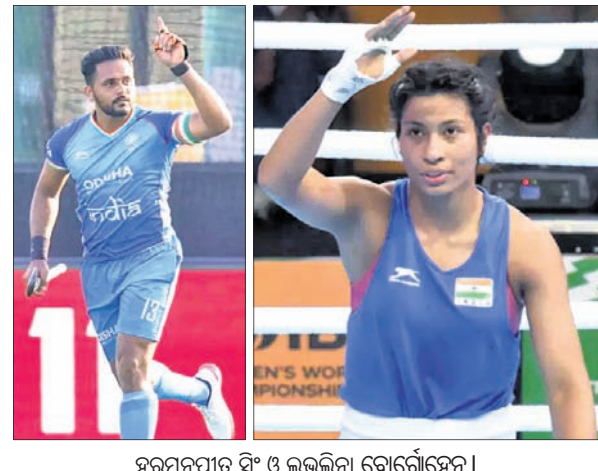
ହରମନ୍‌ପ୍ରୀତ ସିଂ ଓ ଲଭଲିନା ବୋର୍ନୋହେନ।

ବୃଥାବିକା, ୨୦୧୯ (ପି.ଟି.) ଏସିଆନ୍ ଗେମ୍ସ ୨୦୨୩ ଚାଇନାର ହାଙ୍ଗଝୋରେ ଅନୁଷ୍ଠିତ ହେଉଛି। ସେପ୍ଟେମ୍ବର ୨୩ରୁ ଏହି ଇଭେଣ୍ଟ ଅନୁଷ୍ଠିତ ହେବାକୁ ଥିବା ବେଳେ ପୁରୁଷ ହକି ଦଳର ଅଧିନାୟକ ହରମନ୍‌ପ୍ରୀତ ସିଂ ଓ ମହିଳା ବକ୍ସର ଲଭଲିନା ବୋର୍ନୋହେନକୁ ଭାରତର ଧୂଜାବାହକ ଭାବରେ ଘୋଷଣା କରାଯାଇଛି। ରୁଧିର ଭାରତୀୟ ଅଲିମ୍ପିକ୍ ମହାସଂଘ(ଆଇଓଏ) ପକ୍ଷରୁ ଏହି ଘୋଷଣା କରାଯାଇଛି। ଫଳରେ ଉଦ୍‌ଘାଟନା ଉତ୍ସବରେ