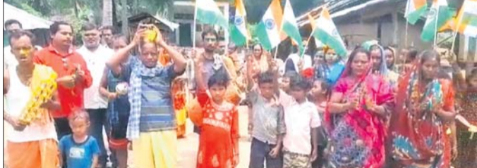
ପଞ୍ଚାୟତ ସଭାପତିଙ୍କ ସହିତ ସରାଧିକ ମହିଳା ପୁରୁଷ ମାଟି ସଂଗ୍ରହ କରିବାକୁ ଯାଉଛନ୍ତି।