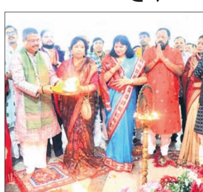
ଦିଲ୍ଲୀରେ ନୂଆଁଖାଇ ପାଳନ ଅବସରରେ ମନ୍ତ୍ରୀ ଓ ଏମ୍ପିମାନେ।