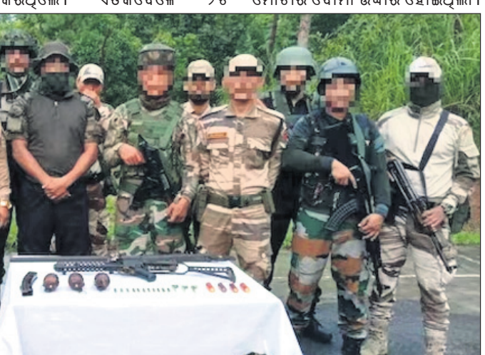
ମଣିପୁରରେ ସୁରକ୍ଷା କର୍ମୀ ସର୍ଚ୍ଚ ଅପରେଶନରେ ବିପୁଳ ପରିମାଣର ଅସ୍ତ୍ରଶସ୍ତ୍ର ଜବତ କରିଛନ୍ତି।

ଆଇନ ଅମାନ୍ୟ ଅଭିଯୋଗରେ ୮୭୩ ଜଣଙ୍କୁ ଅଟକ ରଖାଯାଇଛି। ସୁରକ୍ଷାକର୍ମୀମାନେ ହିଂସା ପ୍ରଭାବିତ ପଶ୍ଚିମ ଇମ୍ଫାଲ, ଅଉବାଲ, ବିଶୁପୁର, କଙ୍ଗାପୋକପି ଏବଂ ବୁରାପୁରରେ ତଳାସି ଅଭିଯାନ କରିଥିଲେ। ଏଥିରେ ୧୨୭ଟି ଚେକ୍ ପୋଷ୍ଟ ନିର୍ମାଣ କରାଯିବ ବୋଲି କହିଛନ୍ତି। ଏଥିରେ ୧୨୭ଟି ଚେକ୍ ପୋଷ୍ଟ ନିର୍ମାଣ କରାଯିବ ବୋଲି କହିଛନ୍ତି।