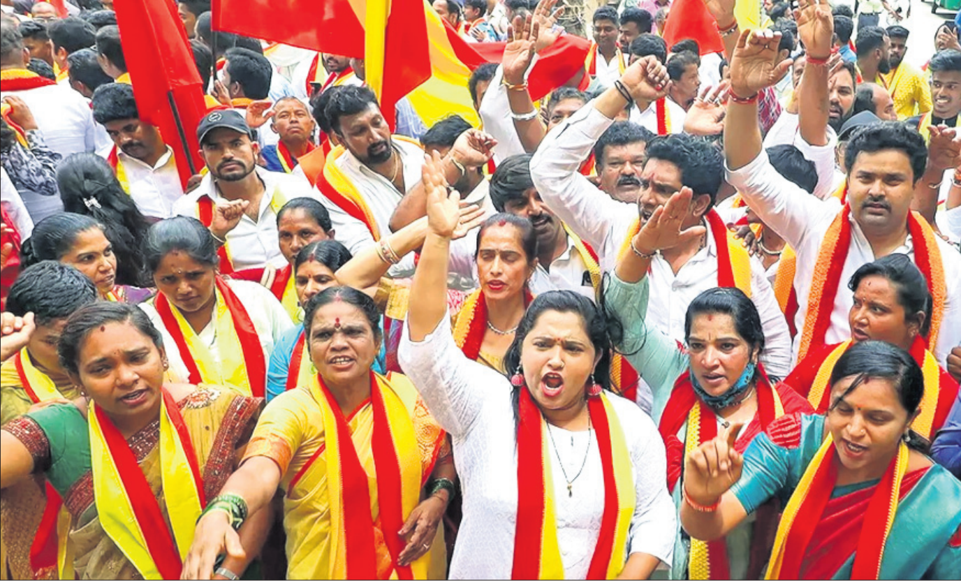
ଆସନ୍ତା ୨୯ ପର୍ଯ୍ୟନ୍ତ କାବେରୀ ନଦୀରୁ ୫,୦୦୦ କ୍ୟୁସେକ୍ ଜଳ ତାମିଲନାଡୁକୁ ଛାଡ଼ିବା ପାଇଁ କାବେରୀ ଜଳ ପରିଚାଳନା କର୍ତ୍ତୃପକ୍ଷ (ସିଡକ୍ୟୁଏମ୍ଏ) ପକ୍ଷରୁ ନିଆଯାଇଥିବା ନିଷ୍ପତ୍ତି ପ୍ରତିବାଦରେ ବେଙ୍ଗାଲୁରୁରେ ଗୁରୁବାର କର୍ମାଚର ରକ୍ଷଣ ବେଦିକେ ସବସ୍ୟମାନେ ବିରୋଧ ପ୍ରଦର୍ଶନ କରୁଛନ୍ତି।

ଅପରାଧର ଚାର୍ଜ ଉଠାଇବା ପରେ ପାକିସ୍ତାନରେ ପାକିସ୍ତାନ ନିର୍ବାଚନ ଅନୁଷ୍ଠିତ ହେବ ବୋଲି ପାକିସ୍ତାନ ନିର୍ବାଚନ କମିଶନ ଗୁରୁବାର ଘୋଷଣା କରିଛନ୍ତି। ପାକିସ୍ତାନରେ ବର୍ତ୍ତମାନ ଅର୍ଥନୈତିକ ଅସ୍ଥିରତା ଲାଗି ରହିଥିବାବେଳେ ଠିକଣା ସମୟରେ ନିର୍ବାଚନ କରାଯାଇପାରିବ ବୋଲି କମିଶନ କହିଛନ୍ତି। ନିର୍ବାଚନ ପ୍ରକ୍ରିୟା ସମାପ୍ତ ହେବା ପରେ ପୁନଃ ନିର୍ବାଚନ ସମାପ୍ତ ହେବ। ଏହାର ତାଲିକା ସେପ୍ଟେମ୍ବର ୨୭ତାରିଖରେ ପ୍ରକାଶ ପାଇବ। ଏହାପରେ ରାଜନୈତିକ ଦଳଗୁଡ଼ିକ ସେମାନଙ୍କ ଅଭିଯୋଗ ଦାଖଲ କରିପାରିବେ। ଅଭିଯୋଗଗୁଡ଼ିକର ଶୁଣାଣି ପରେ ନଭେମ୍ବର ୩୦ତାରିଖରେ ପ୍ରକାଶ ପାଇବ। ଏହା ନିର୍ବାଚନପୂର୍ବ ଅନୁସାରେ ଅନୁଷ୍ଠିତ ହେବ। ସାମାଜିକ ନିର୍ବାଚନ ପରେ ୫୪ ଦିନିଆ ନିର୍ବାଚନ କାର୍ଯ୍ୟକ୍ରମ ଘୋଷଣା କରାଯିବ ଏବଂ ସେଗର ସାଧାରଣ ନିର୍ବାଚନ ୨୦୧୪ ଜାନୁଆରୀ ଶେଷ ସମୟରେ ଅନୁଷ୍ଠିତ ହେବ ବୋଲି କମିଶନ କହିଛନ୍ତି।