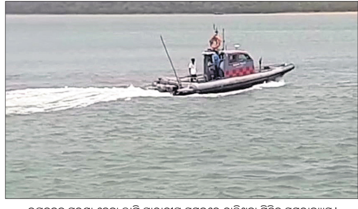
ଉପକୂଳକୁ ସୁରକ୍ଷା ଦେବା ଲାଗି ପାରାଦୀପ ସମୁଦ୍ରରେ ଚାଲିଥିବା ମିଳିତ ସମରାଜ୍ୟସ୍ୱ।

ଓଡ଼ିଶାର ୪୮୨ କିମି ପୂର୍ବ ଉପକୂଳରେ ସୁରୁବାରଠାରୁ ଆରମ୍ଭ ହୋଇଛି ମିଳିତ ସମରାଜ୍ୟସ୍ୱ ଚଳିତଥର ଓଡ଼ିଶା ଓ ପଶ୍ଚିମବଙ୍ଗର ସୁରକ୍ଷା ଏକେଡ଼ିଭିଭିକ ମିଳିତ ଭାବେ ଏହି ସମରାଜ୍ୟସ୍ୱ କରୁଛନ୍ତି। ଏହାର ସରକାରୀ ନାମ ସାଗର କବଚ-୨ ରହିଛି। ଏଥିରେ ନୌସେନା, କୋଷ୍ଠଗାର୍ଡ, ଓଡ଼ିଶା ପୋଲିସ, ମେରାଇନ ପୋଲିସ, ମସ୍ୟ ବିଭାଗ, ବନ ବିଭାଗ, ଇମିଗ୍ରେସନ, ସିଆଇଏସ୍‌ଏସ୍, କଷ୍ଟସ୍, ପାରାଦୀପ ବନ୍ଦର ସମେତ ଅନ୍ୟ ସୁରକ୍ଷା ଏକେଡ଼ି ସାମିଲ ହୋଇଛନ୍ତି। ଏହିସବୁ ସୁରକ୍ଷା ବଳ ୨ଦିନ ପୂର୍ବ ଉପକୂଳରେ ମିଳିତ ପାଟ୍ରୋଲିଂ କରିବେ। ଏଥିରେ ୨ଟି ଟିମ୍