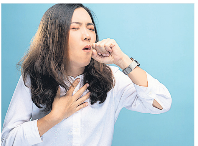
ସେଭେର ଆକ୍ରମ୍ଭ ରେଷ୍ଟିରେଟରା ସିଣ୍ଡ୍ରମ୍ (ଏସ୍ଏଆର୍ଏସ୍-୨) ଭାରିଆଣ୍ଡ ବୃଦ୍ଧକା ସହ ନିମୋନିଆ ଲକ୍ଷଣ ବି ପ୍ରଭାବ ପକାଇବାର ଲାଗିଛି। ସିଣ୍ଡ୍ରମ୍ (ଏସ୍ଏଆର୍ଏସ୍-୨) ଭାରିଆଣ୍ଡ ବୃଦ୍ଧକା ସହ ନିମୋନିଆ ଲକ୍ଷଣ

ଲୋକଙ୍କ ସ୍ୱାସ୍ଥ୍ୟ ଉପରେ କୋଭିଡ୍ ପ୍ରଭାବ ଦୀର୍ଘଦିନ ଧରି ରହିଛି। ବୈଜ୍ଞାନିକ ଓ ସ୍ୱାସ୍ଥ୍ୟ ବିଶେଷଜ୍ଞମାନେ କୋଭିଡ୍ କିପରି ଲୋକଙ୍କ ସ୍ୱାସ୍ଥ୍ୟ ଉପରେ ଦୀର୍ଘ ଦିନ ଧରି ପ୍ରଭାବ ପକାଇଛି ସେନେଇ ଆଲୋଚନା କରିବା ସହ ଏଥିପାଇଁ ଲୋକଙ୍କୁ ସଚେତନ ମଧ୍ୟ କରିଛନ୍ତି। ବର୍ତ୍ତମାନ କୋଭିଡ୍ ବି.ଏ.ଏ.୧ ଓ ଇ.ଏ.ଏ.୫ ଭାରିଆଣ୍ଡ ଅଧିକ ସଂକ୍ରମିତ କରୁଛି। ଏହି ଭାରିଆଣ୍ଡ ଓଡ଼ିଗୁଜର ଅପଭାରିଆଣ୍ଡ। ଏହି ଦୁଇ ଭାରିଆଣ୍ଡ ନିୟମିତ ଭାବରେ ଅପେକ୍ଷା ଲୋକଙ୍କୁ ଅଧିକ ସଂକ୍ରମିତ କରୁଛି। ଯଦିଓ କୋଭିଡ୍-୧୯ ସଂକ୍ରମିତ ଲୋକଙ୍କ ମଧ୍ୟରେ ସାଧାରଣ ରୋଗ ଲକ୍ଷଣ ଦେଖାଯାଇ ଏବଂ ସେମାନେ ସମ୍ପୂର୍ଣ୍ଣ ପୁସ୍ତ ହେଉଛନ୍ତି, ତେବେ