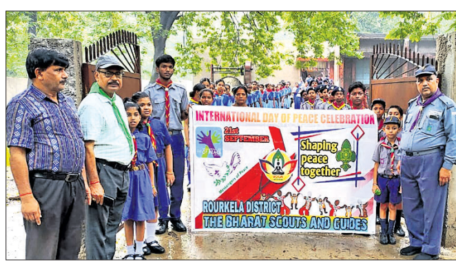
ସ୍ୱାଭିଭି ଗାଇଡ୍ ପକ୍ଷରୁ ଶୋଭାଯାତ୍ରା ବାହାରିଛି।