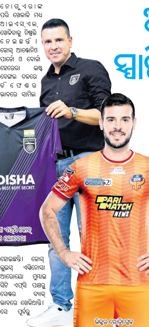
ଓଡ଼ିଶା ଏସିଆନ୍ ଗେମ୍ସ ଖେଳାଳି

ଭାରତୀୟ ପୁରୁଷମାନଙ୍କୁ ଏକ ନୂତନ ଦିଗରେ ଦେବାରେ ଏହାର ଖେଳାଳି ଓ କୋଚ୍ମାନଙ୍କର ଭୂମିକା ଗୁରୁତ୍ୱପୂର୍ଣ୍ଣ ରହିଛି। ୨୦୧୬ରେ ଲାଲିଗାର ପକ୍ଷରୁ ଭାରତର ରାଜଧାନୀ ନୂଆଦିଲ୍ଲୀରେ ଏହାର ପ୍ରଥମ କାର୍ଯ୍ୟକ୍ରମ ଖୋଲିଥିଲା। ବିଶ୍ୱରେ ଭାରତ ଏକ ପୁରୁଷ ମହାଶକ୍ତି ଭାବରେ ନିଜକୁ ପ୍ରତିଷ୍ଠିତ କରିବା ଦିଗରେ ଭାରତ ଅଗ୍ରସର ହେଉଥିବା ବେଳେ ଏହା ପଛରେ ସାମାଜିକ କର୍ମ ତଥା ଲାଲିଗାର ଅବଦାନ ଅତୁଳନୀୟ।