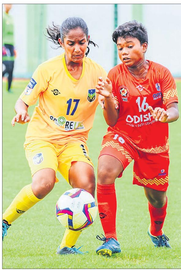
ଓଡ଼ିଶା ଓ କେରଳ ମଧ୍ୟରେ ଅନୁଷ୍ଠିତ ମ୍ୟାଚ୍ ଏକ ସଂଘର୍ଷପୂର୍ଣ୍ଣ ମୁହୂର୍ତ୍ତ।

ଏଠାରେ ଚାଲିଥିବା ଜାତୀୟ ଛୁନିୟର ବାଲିକା ପୁରବଳ ଚାମ୍ପିୟନଶିପ୍ରେ ବିଜୟ ସହ ଓଡ଼ିଶା ଅଭିଯାନ ଆରମ୍ଭ କରିଛି। ଛୁନିୟ-୩୫ର କ୍ୟାମ୍ପରେ ଆରମ୍ଭରେ ଅପରାହ୍ଣ ୩ଟାରେ ଅନୁଷ୍ଠିତ ମ୍ୟାଚରେ ଓଡ଼ିଶା ୧-୦ ଗୋଲରେ କେରଳକୁ ପରାସ୍ତ କରିଛି। ମ୍ୟାଚଟି ଡ୍ରା ସଂଘର୍ଷପୂର୍ଣ୍ଣ ହୋଇଥିଲା। ୯୦ ମିନିଟ୍ ପର୍ଯ୍ୟନ୍ତ ମ୍ୟାଚ ଗୋଲଶୂନ୍ୟ ରହିଥିଲା। ତେବେ ଇଣ୍ଡିଆ ଟାଲମ୍ ୯୦+୩ ମିନିଟ୍ରେ ପ୍ରଥମ ସମୟରେ ଯୋଗାଣ କରି ଓଡ଼ିଶାକୁ ବିଜୟୀ