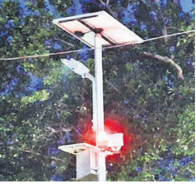
ହାତୀ ଉପଦ୍ରବରୁ ରକ୍ଷା ପାଇବା ପାଇଁ ଲାଗାଯାଇଥିବା ସାଇରନ ଓ ସିଗ୍ନାଲ ବ୍ୟବସ୍ଥା ।

ତେଜନୀଳ, ୨୧୯ (ରତନ ନାୟକ) ତେଜନୀଳ ଜିଲାର ବିଭିନ୍ନ ରାସ୍ତା ପାଇଁ ହାତୀ ଗୋଟିଏ ଜଙ୍ଗଲରୁ ଅନେକ ଜଙ୍ଗଲକୁ ଯାଉଛନ୍ତି । ଏପରି କି ୫୫୯ ନଂ. ଜାତୀୟ ରାଜପଥ ଉପରେ ମଧ୍ୟ ଅନେକ ସମୟରେ ହାତୀ ଚାଲି ହୋଇ ରହୁଥିବାରୁ ଗାଡ଼ି ଚଳାଚଳ ବାଧାପ୍ରାପ୍ତ ହେବା ସହ ଯାତ୍ରୀଙ୍କ ମଧ୍ୟରେ ଭୟର ବାତାବରଣ ସୃଷ୍ଟି ହେଉଛି । ଭାରିପାନ ଧରାରେ ମଧ୍ୟ ହାତୀଙ୍କ ମୃତ୍ୟୁ ଘଟଣା ବାରମ୍ବାର ଦେଖିବାକୁ ମିଳୁଛି । ତେଣୁ ରାସ୍ତା ପାଇଁ ହେଉଥିବା ହାତୀଙ୍କ ସମ୍ପର୍କରେ କିପରି ଗାଡ଼ି ଚଳାଚଳ, ଯାତ୍ରୀ ଓ ନିକଟସ୍ଥ ଅଞ୍ଚଳବାସୀ ସୂଚନା ପାଇପାରିବେ ଏବଂ ସତର୍କ ହୋଇପାରିବେ ସେ ନେଇ ତେଜନୀଳ ଜିଲାର ବନ ବିଭାଗ ପକ୍ଷରୁ ଗୁରୁତ୍ୱପୂର୍ଣ୍ଣ ଚେଷ୍ଟା କରାଯାଇଛି । ମୋବାଇଲ୍ ଦ୍ୱାରା ପରିଚାଳିତ ଏହି ବ୍ୟବସ୍ଥା ରାଜ୍ୟରେ ପ୍ରଥମ କରି ତଥା ତେଜନୀଳ ଜିଲାରେ ଆରମ୍ଭ ହୋଇଥିବା ସୂଚନା ମିଳୁଛି । ତେଜନୀଳ ଜିଲାରେ ପ୍ରଥମ ପର୍ଯ୍ୟାୟରେ ବିଭିନ୍ନ ରେଞ୍ଜରେ ମୋଟ ୨୫ଟି ରେଡ୍‌ଲାଇଟ୍ ଓ ସାଇରନ ବ୍ୟବସ୍ଥା କରାଯିବ । ସେଥିରୁ ପ୍ରାୟ ୨୨ଟି ରେଡ୍ ଲାଇଟ୍ ଓ ସାଇରନ କେବଳ ହିସାବ ଓ ସଦର ରେଞ୍ଜରେ ଲାଗିବ । ସଦର ରେଞ୍ଜ ଅଧୀନ ତେଜନୀଳ-କପିଳାସ ରାସ୍ତାର ନେପା ଜଙ୍ଗଲ କଡ଼ରେ ଏହି ରେଡ୍ ଲାଇଟ୍ ଓ ସାଇରନ ବ୍ୟବସ୍ଥାର ଶୁଭାରମ୍ଭ କରାଯାଇଛି । ବିଦ୍ୟୁତ୍ ଖୁଣ୍ଟଭଳି ଏକ