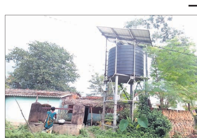
ଅଟଳ ହୋଇପଡ଼ିଥିବା ସୋଲାର।

ସୁନ୍ଦରଗଡ଼ ଜିଲ୍ଲା ସାମାନ୍ତ ବିଶ୍ୱା ବ୍ଲକ ଦରେଇକେଲା ପଞ୍ଚାୟତ ଯୋଡ଼ବନ୍ଧ କରାଗୋଲି ଗ୍ରାମବାସୀ ପାଣି ପାଇଁ ତହଲ ଦିକଳ ହେଉଛନ୍ତି। ଏକ ବର୍ଷଧରି ସୋଲାର ପ୍ୟାନେଲ ଅଟଳ ହୋଇପଡ଼ିବା ସହ ନଳକୂପ ମରାମତି ଅଭାବରୁ ସେତୁଡିକରୁ ଅନେକ ସମୟରେ ମଇଳା ପାଣି ବାହାରିଛି। ଫଳରେ ଗ୍ରାମବାସୀ ବାଧ୍ୟ ହୋଇ ପୋଖରୀ, ନଈ, କୁଆଁ, କୁଅରୁ ଦୂରତ ପାନୀୟ ଜଳ ପିଇବା ପାଇଁ ବାଧ୍ୟ ହୋଇଛନ୍ତି। ଧର୍ମାନ୍ତ କୋଟି ଚକ୍କା ବ୍ୟୟରେ ତେଡ଼େକେଲା ନଦୀରୁ ପାଣି ପାଇଁ ଘରେ