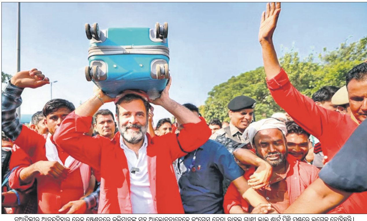
ନୂଆଦିଲ୍ଲୀର ଆନନ୍ଦବିହାର ରେକ୍ ଷ୍ଟେଶନରେ କୁଲିମାନଙ୍କ ସହ ଆଲୋଚନାବେଳେ କଂଗ୍ରେସ ନେତା ରାହୁଲ ଗାନ୍ଧୀ ଲାଲ ଶାର୍ଟ ପିନ୍ଧି ପୁଣି ଉପରେ ଲଗେଇ ଦେଇଛନ୍ତି।

ହାଇଦ୍ରାବାଦରୁ ଆସାମର ଗୁଆହାଟୀ ଦେଇ ଡ୍ରାପ୍‌ଓଉଟ ଅଗରତାଳା ଅଭିଯୁକ୍ତେ ଯାତ୍ରା କରୁଥିବା ଏକ ଇଣ୍ଡିଗୋ ବିମାନରେ ଗୁରୁବାର ଜଣେ ଯୁବକ ଡୋର୍ ଖୋଲିବାକୁ ଉଦ୍ୟମ କରିଛନ୍ତି।