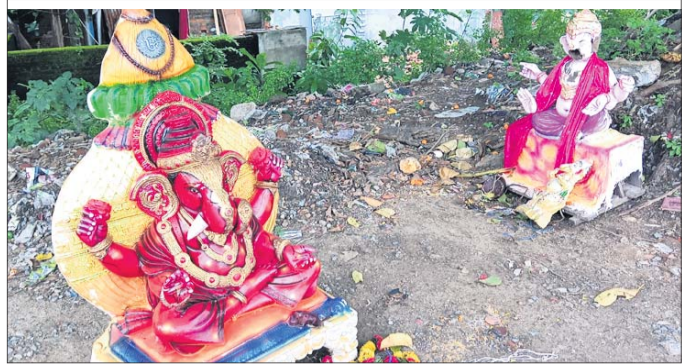
ପୋଖରୀ ଭୂମିରେ ପଡି ରହିଥିବା ମୂର୍ତ୍ତି।