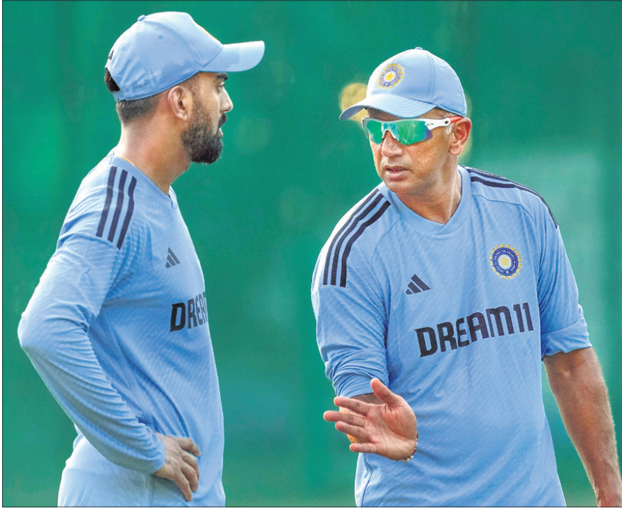
ରୁତ୍ୱରାଜ ନେହେରୁ ଅଧିନାୟକ ଲୋକେଶ ରାହୁଲ ଓ କୋର୍ଟ ରାହୁଲ ଡ୍ରାଭିଡ଼।

ଦିନିଆଁ କ୍ରିକେଟ ବିଶ୍ୱକପର ଅନ୍ତିମ ପ୍ରସ୍ତୁତି ଭାବରେ ଅଷ୍ଟ୍ରେଲିଆ ବିପକ୍ଷରେ ୩ ମ୍ୟାଚ୍ ବିଶିଷ୍ଟ ସିରିଜ୍ ଖେଳିବ ଭାରତ। ଶୁକ୍ରବାର ଠାରୁ ଏହି ସିରିଜ୍ ଆରମ୍ଭ ହେଉଥିବା ବେଳେ ଶ୍ରେୟସ୍ ଆୟର ଓ ସୂର୍ଯ୍ୟଙ୍କୁ ମଧ୍ୟ ଯତ୍ନ ଦେବାକୁ ନିର୍ଦ୍ଦେଶ ଦିଆଯାଇଛି। ଏହି ସିରିଜ୍ ଆରମ୍ଭ ହେଉଥିବା ବେଳେ ଶ୍ରେୟସ୍ ଆୟର ଓ ସୂର୍ଯ୍ୟଙ୍କୁ ମଧ୍ୟ ଯତ୍ନ ଦେବାକୁ ନିର୍ଦ୍ଦେଶ ଦିଆଯାଇଛି। ଏହି ସିରିଜ୍ ଆରମ୍ଭ ହେଉଥିବା ବେଳେ ଶ୍ରେୟସ୍ ଆୟର ଓ ସୂର୍ଯ୍ୟଙ୍କୁ ମଧ୍ୟ ଯତ୍ନ ଦେବାକୁ ନିର୍ଦ୍ଦେଶ ଦିଆଯାଇଛି।