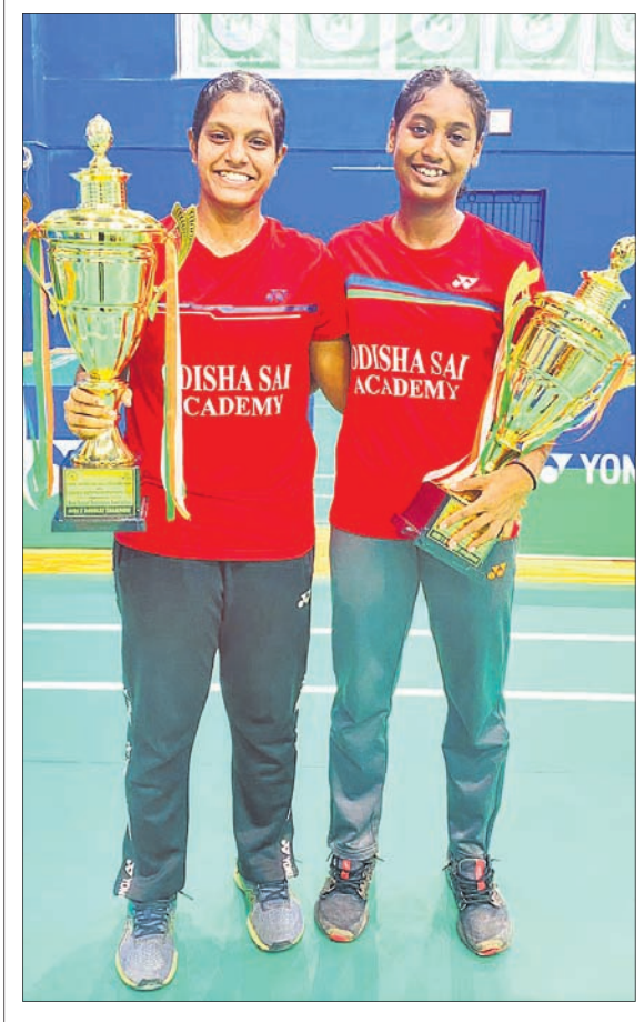
୩୫ ତମ ଜାତୀୟ ସର୍ବ ଛୁନିୟର ମହିଳା ଚେମ୍ପିୟନ ଓଡ଼ିଶାର ପ୍ରତିଯୋଗୀ (ବାମ) ଓ ବିଶାଖା ଚେମ୍ପିୟନ ଟ୍ରଫି ସହ। ମିଳିତ ଚେମ୍ପିୟନ ମଧ୍ୟ ପ୍ରତି ଓ ଭାରତ ରାମ ସର୍ବ ପଦକ ଲାଭ କରିଥିଲେ।

ଭୁବନେଶ୍ୱର, ୨୧୯ (ତପନ ସାହୁ): ସ୍ୱର୍ଣ୍ଣଶ୍ରୀ ଆକ୍ଟିଭିଟି ହିଁ ଅନୁକୂଳ୍ୟରେ ଅଲ୍ ଓଡ଼ିଶା ଓପନ ଚେମ୍ପିୟନ ୨୪ ଚାରିଖରେ ଅନୁଷ୍ଠିତ ହେବ। ଏହି ପ୍ରତିଯୋଗିତା ପାଇଁ ମୋଟ ୧୩,୦୦୦ ଟଙ୍କାର ପୁରସ୍କାର ରାଶି ରଖାଯାଇଛି। ଚାମ୍ପିୟନ ପ୍ରତିଯୋଗୀଙ୍କୁ ଟ୍ରଫି ସହ ୫,୦୦୦, ରନର ଅପ୍ଲୁ ୩୦୦୦ ଟଙ୍କା ପ୍ରଦାନ କରାଯିବ। ଅଂଶଗ୍ରହଣ ପାଇଁ ଲକ୍ଷ୍ମୀ ପ୍ରତିଯୋଗୀଙ୍କୁ ୫୦୦ ଟଙ୍କା ଏଣ୍ଟ୍ରୀ ଫେଜ୍ ନାମ ପଞ୍ଜୀକରଣ କରିବାକୁ ହେବ। ୨୩ ତାରିଖ ରାତି ୧୨ଟା ପ୍ରତିଯୋଗୀମାନେ ନିଜ ନାମ ପଞ୍ଜୀକରଣ କରିପାରିବେ। ୨୯-୧୦ ପ୍ରତିଯୋଗୀଙ୍କୁ ଆର୍ଥିକ ପୁରସ୍କାର ବ୍ୟତୀତ ୬୦ ଲକ୍ଷ ଟ୍ରଫି ଫେଜ୍ ସମ୍ପାଦନ କରାଯିବ। ମୁଖ୍ୟ ପୁରସ୍କାର ବ୍ୟତୀତ ୫୦୦ ୧୩ ବର୍ଷ ବୟସ ବର୍ଗର ୩ ଲକ୍ଷ ଲେଖାଏ ବାଲିକା ଓ ବାଳକଙ୍କୁ ଏବଂ ୧୨ ଓ ୧୩ ବର୍ଷରୁ କମ୍ ବର୍ଗରେ ଲେଖାଏ ଶ୍ରେଣୀ ବାଲିକା ଓ ବାଳକ ପ୍ରତିଯୋଗୀଙ୍କୁ ଟ୍ରଫି ପ୍ରଦାନ କରାଯିବ। ୧୫ ବର୍ଷରୁ କମ୍ ବର୍ଷର ଶିଳ୍ପୀମାନଙ୍କୁ ଅଂଶଗ୍ରହଣ କରିପାରିବେ ବୋଲି ଆୟୋଜକ ସ୍ୱର୍ଣ୍ଣଶ୍ରୀ ମହାପାତ୍ର ପ୍ରକାଶ କରିଛନ୍ତି।