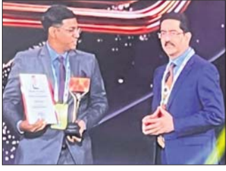
ବୁରୁଡ଼ା, ୨୧୯୯ (କାଳିଚରଣ ଦାଶ)

ଆମେରିକାରେ ପୁରସ୍କୃତ ହେଲେ ଓଡ଼ିଆ ଚାଟାଟ ଆକାଉଣ୍ଟାଣ୍ଟ