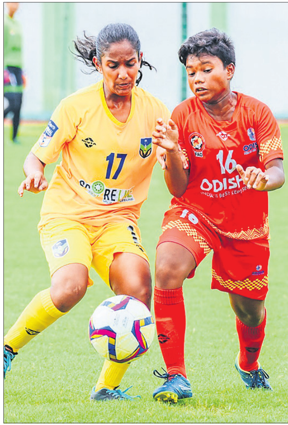
ଓଡ଼ିଶା ଓ କେରଳ ମଧ୍ୟରେ ଅନୁଷ୍ଠିତ ମ୍ୟାଚ୍ ଏକ ସଂଘର୍ଷପୂର୍ଣ୍ଣ ମୁହୂର୍ତ୍ତ।