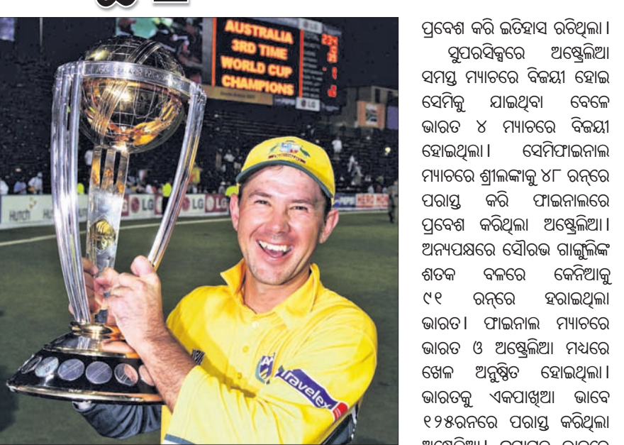
ଟ୍ରଫି ସହ ରିକି ପଣ୍ଟିଙ୍ଗ୍।

ଦିନିକିଆ କ୍ରିକେଟ୍ ପୁରୁଷ ବିଶ୍ୱକପ୍ରେ ଅଷ୍ଟ୍ରେଲିଆ ସଂସ୍କରଣ ଦକ୍ଷିଣ ଆଫ୍ରିକା, ଜିମ୍ବାୱେ ଓ କେନିଆ ମିଳିତ ଭାବରେ ଆୟୋଜନ କରିଥିଲେ। ଏହି ବିଶ୍ୱକପ୍ରେ ଜିତିବା ସହିତ ବିଶ୍ୱ କ୍ରିକେଟ୍ରେ ଏକ ମହାଶକ୍ତି ଭାବରେ ଉଭା ହୋଇଥିଲା ଅଷ୍ଟ୍ରେଲିଆ। ୧୯୯୯ରେ ଷ୍ଟୁଭ୍ ଫ୍ରେଜ୍ ନେଟ୍ରେ ଚାମ୍ପିୟନ ଅଷ୍ଟ୍ରେଲିଆ ୨୦୦୩ରେ ରିକି ପଣ୍ଟିଙ୍ଗ୍ ନେଟ୍ରେ ହାସଲ କରିଥିଲା କ୍ରମାଗତ ବିତାୟ ଚାଉଟଲ। ଏହି ବିଶ୍ୱକପ୍ଟି ଏକାଧିକ କାରଣ ପାଇଁ ଚର୍ଚ୍ଚାରେ ରହିଥିଲା। ପାକିସ୍ତାନ, ଦକ୍ଷିଣ ଆଫ୍ରିକା, ଫ୍ରେସ୍ଚୋଲଣ୍ଡ ଓ ଇଂଲଣ୍ଡ ପରି ଶକ୍ତିଶାଳୀ ଦଳ ପ୍ରଥମ ପର୍ଯ୍ୟାୟରୁ ବିଦାୟ ନେଇଥିଲେ। ଜିମ୍ବାୱେ ଓ କେନିଆରେ ହିଂସା ଚାଲିଥିବା କାରଣରୁ ଇଂଲଣ୍ଡ ଓ ନ୍ୟୁଜିଲାଣ୍ଡ ପରି ଦେଶ ମ୍ୟାଚ୍ ନ ଖେଳିବାକୁ ନିଷ୍ପତ୍ତି ନେଇଥିଲେ। ଏହା ସହିତ କିମ୍ବସନ୍ତା ଲେଗ୍ ସିନର କାରଣରୁ ଅଷ୍ଟ୍ରେଲିଆ ଫେରିବାକୁ ପଡ଼ିଥିଲା। ପାକିସ୍ତାନର କ୍ଲିଭିନ୍ସ ଶୋଏବ ଅଖତର ୧୬୧.୩ ଡି.ଟି. ବେଗରେ ବୋଲିଂ କରିବା ସହିତ ରେକର୍ଡ୍ ମଧ୍ୟ କରିଥିଲେ। ଅଷ୍ଟ୍ରେଲିଆ