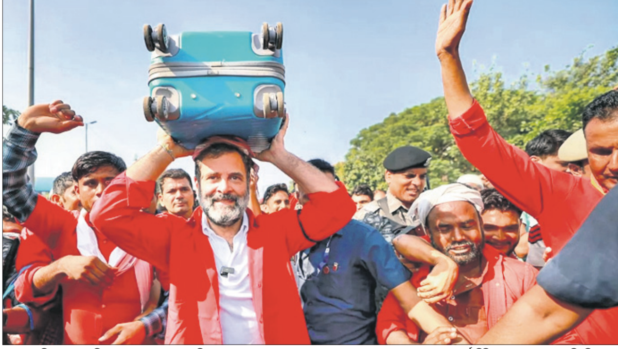
ନୂଆଦିଲ୍ଲୀର ଆନନ୍ଦବିହାର ରେକ୍ ଷ୍ଟେସନରେ କୁଲିମାନଙ୍କ ସହ ଆଲୋଚନାବେଳେ କଂଗ୍ରେସ ନେତା ରାହୁଲ ଗାନ୍ଧୀ ଘିରି ପୁଣି ଉପରେ ଲଗେଇ ଦେଇଛନ୍ତି।