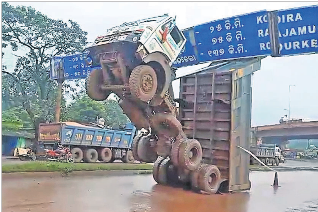
କେନ୍ଦୁଝର ଜିଲ୍ଲା ବଡ଼ବିଲ ୧୦ ନଂ ରାଜ୍ୟ ରାଜପଥଠାରେ ଗୁରୁବାର ଦେପରୁଆ ଗାଡ଼ିଚାଳନା ଯୋଗୁ ଏକ ଭାରିଯାନ ପୁରୀନା ଫଳକ ସହ ଧକ୍କା ହୋଇ ଉପରକୁ ଉଠିଯାଇଛି।