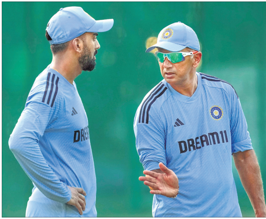
ଗୁରୁବାର ନେଟ୍ରେ ଅଧିନାୟକ ଲୋକେଶ ରାହୁଲ ଓ କୋଚ୍ ରାହୁଲ ଦ୍ରାଭିଡ଼।