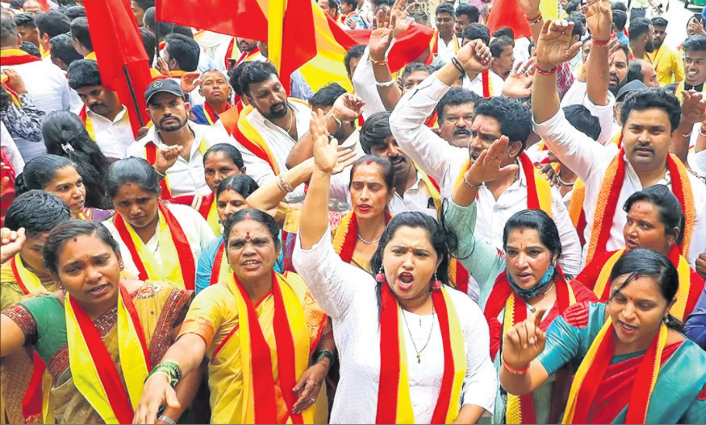
ଆସନ୍ତା ୨୯ ପର୍ଯ୍ୟନ୍ତ କାବେରୀ ନଦୀରୁ ୫,୦୦୦ କ୍ୟୁସେକ୍ ଜଳ ତାମିଲନାଡୁକୁ ଛାଡ଼ିବା ପାଇଁ କାବେରୀ ଜଳ ପରିଚାଳନା କର୍ତ୍ତୃପକ୍ଷ (ସିଡକ୍ୟୁଏମ୍) ପକ୍ଷରୁ ନିଆଯାଇଥିବା ନିଷ୍ପତ୍ତି ପ୍ରତିବାଦରେ ବେଙ୍ଗାଳୁରେ ଗୁରୁବାର କର୍ମାଚର ରକ୍ଷଣ ବେଦିକେ ସବ୍ୟସାମାନେ ବିରୋଧ ପ୍ରଦର୍ଶନ କରୁଛନ୍ତି।

ଅପରାଧର ଚାର୍ଜରେ ପାକିସ୍ତାନରେ ସାଧାରଣ ନିର୍ବାଚନ ଅନୁଷ୍ଠିତ ହେବ ବୋଲି ପାକିସ୍ତାନ ନିର୍ବାଚନ କମିଶନ ଗୁରୁବାର ଘୋଷଣା କରିଛନ୍ତି। ପାକିସ୍ତାନରେ ବର୍ତ୍ତମାନ ଅର୍ଥନୈତିକ ଅସ୍ଥିରତା ଲାଗି ରହିଥିବାବେଳେ ଠିକଣା ସମୟରେ ନିର୍ବାଚନ କରାଯିବ ବୋଲି ରାଜନୈତିକ ଦଳଗୁଡ଼ିକ ଗାଢ଼ ପ୍ରୟୋଗ କରି ଆସୁଥିଲେ ବୋଲି କମିଶନ କହିଛନ୍ତି। ନିର୍ବାଚନପନ୍ଥା ସାମାନ୍ୟତା ପୁନଃ ନିର୍ଦ୍ଧାରଣ ସମାପ୍ତ। ଏବଂ ଏହାର ଠିକଣା ସେପ୍ଟେମ୍ବର ୨୭ ତାରିଖରେ ପ୍ରକାଶ ପାଇବ। ଏହାପରେ ରାଜନୈତିକ ଦଳଗୁଡ଼ିକ ସେମାନଙ୍କ ଅଭିଯୋଗ ଦାଖଲ କରିପାରିବେ। ଅଭିଯୋଗଗୁଡ଼ିକ ଶୁଣାଣି ପରେ ନଭେମ୍ବର ୩୦ରେ ଶେଷ ଠାଳିଆ ପ୍ରକାଶ ପାଇବ। ଏହା ନିର୍ବାଚନପୂର୍ବ ଅନୁସାରେ ଅନୁଷ୍ଠିତ ହେବ। ସାମାନ୍ୟତା ନିର୍ବାଚନ ପରେ ୫୪ ଦିନିଆ ନିର୍ବାଚନ କାର୍ଯ୍ୟକ୍ରମ ଘୋଷଣା କରାଯିବ ଏବଂ ଦେଶର ସାଧାରଣ ନିର୍ବାଚନ ୨୦୨୪ ଜାନୁଆରୀ ଶେଷ ସପ୍ତାହରେ ଅନୁଷ୍ଠିତ ହେବ ବୋଲି କମିଶନ କହିଛନ୍ତି।