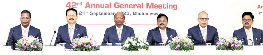
ନାଲକୋର ୪୨ ତମ ବାର୍ଷିକ ସାଧାରଣ ବୈଠକରେ କମ୍ପାନୀର ବରିଷ୍ଠ ଅଧିକାରୀ ଉପସ୍ଥିତ ଅଛନ୍ତି।

ଭାରତ ସରକାରଙ୍କ ଖଣି ମନ୍ତ୍ରାଳୟ, ଅଧିକାରୀଙ୍କ ନିର୍ଦ୍ଦେଶ କମ୍ପାନୀ ନାଲକୋର ୪୨ତମ ବାର୍ଷିକ ସାଧାରଣ ବୈଠକ ଚଳୁଥିବା ଭିଏ (ଇଉଆଇ ମୋଡ଼) ଭିତ୍ତିରେ ଅନୁଷ୍ଠିତ ହୋଇଯାଇଛି। ଏହି ପରିସ୍ଥିତିରେ କମ୍ପାନୀର ଅଂଶଧରମାନେ/ଧାରାମାନେ ଆର୍ଥିକ ବର୍ଷ ୨୦୨୨-୨୩ ନିମନ୍ତେ ୧୪,୧୪୧ କୋଟି ଟଙ୍କାର ବିକ୍ରୟ କାରବାର ସହ ୧,୫୪୪ କୋଟିର ଲାଭାଂଶ ଏବଂ ୪,୨୧୭ କୋଟି ଟଙ୍କାର ରପ୍ତାନି ସହଯୋଗ ବାର୍ଷିକ କାରବାରକୁ ଅନୁମୋଦନ କରିଛନ୍ତି। ଏଥି ସହ ଲକ୍ଷିତ ଶେୟାର ପିଇ ୧ ଟଙ୍କା ହିସାବରେ ୨୦% ବୃଦ୍ଧି ଲାଭାଂଶକୁ ମଧ୍ୟ