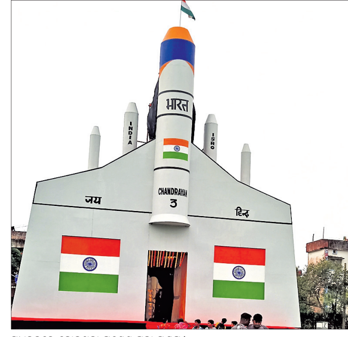
ମଧୁବନରେ ହୋଇଥିବା ଗଣେଶ ପୂଜା ମଣ୍ଡପ ।