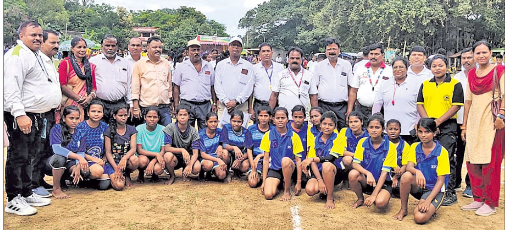
ଅତିଥି ଓ ଶିକ୍ଷକଙ୍କ ଗହଣରେ ଖୋଖୋ ଖେଳାଳିମାନେ ।