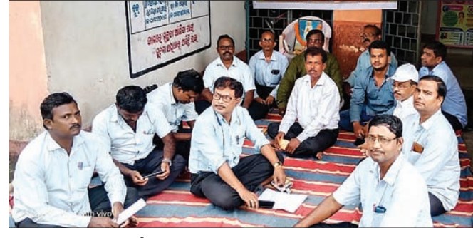
ବ୍ଲକ୍ ଶିକ୍ଷାଧିକାରୀଙ୍କ କାର୍ଯ୍ୟାଳୟ ସମ୍ମୁଖରେ ଶିକ୍ଷକମାନେ ଧାରଣା ଦେଉଛନ୍ତି ।