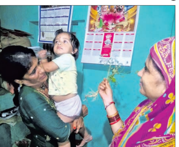
କଣେ ମହିଳା ନିଜ ପିଲାଙ୍କୁ ବଜ୍ରମୂଳିରେ ମାଡ଼ କରୁଛନ୍ତି।