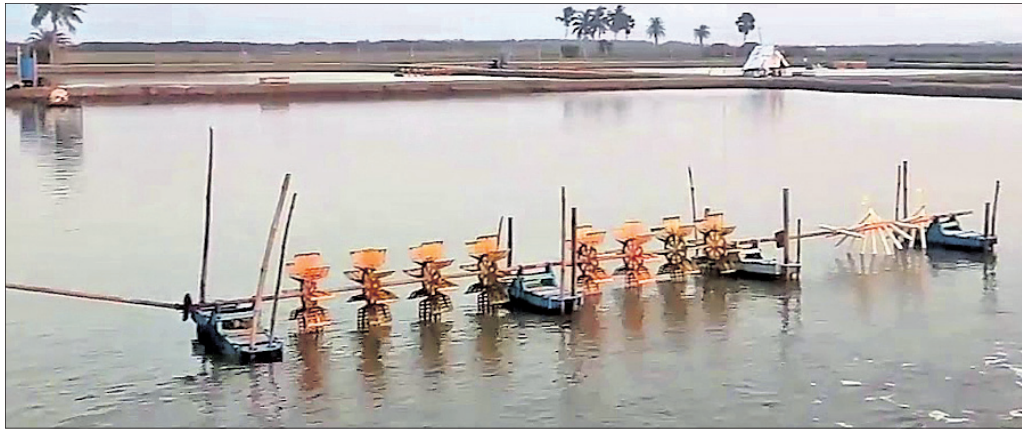
ରାଜନଗରରେ ଏକ ଚିତ୍ରକଳା ଯେଉଁରେ ଲାଗିଥିବା ଏକ ଚିତ୍ରକଳା