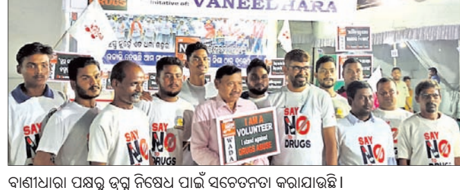
ବାଣୀଧାରା ପକ୍ଷରୁ ବ୍ରହ୍ମ ନିଷେଧ ପାଇଁ ସଚେତନତା କରାଯାଇଛି ।

ପାରାଦୀପ, ୨୧।୯ (ଶରତ ରାଉତ) ପାରାଦୀପରେ ଏକାଠାରେ ବିଶ୍ୱକର୍ମା ପୂଜା ମହୋତ୍ସବ ସହିତ ଗଣେଶ ପୂଜା ମଣ୍ଡପ ହୋଇଛି । ୩ ବର୍ଷ କରୋନା ଲାଗି ବିଶ୍ୱକର୍ମା ପୂଜା ବନ୍ଦ ରହିଥିଲା । ତେଣୁ ଚଳିତବର୍ଷ ବିଶ୍ୱକର୍ମା ପୂଜା ଆୟୋଜକ ସଂଖ୍ୟା କମିତା ସହ ପୂର୍ବବର୍ଷ କୁଳନାରେ ଅଧିକ ଜନସମାଗମ ହୋଇଛି । ସେହି ବିଶ୍ୱକର୍ମା ତୋରଣ ଭଳି ଗଣେଶ ମଣ୍ଡପ ମଧ୍ୟ ହୋଇଛି । ମଧୁବନର ୩ଟି ଓ ନ୍ୟୁଆବଜାରଠାରେ ୨ଟି ମଣ୍ଡପକୁ ବିଶ୍ୱକର୍ମା ପୂଜା ବନ୍ଦ ରହିଥିଲା । ତେଣୁ ଚଳିତବର୍ଷ ବିଶ୍ୱକର୍ମା ପୂଜା ଆୟୋଜକ ସଂଖ୍ୟା କମିତା ସହ ପୂର୍ବବର୍ଷ କୁଳନାରେ