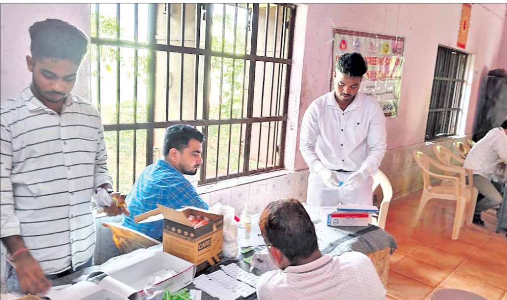
ଜେଲ ଅନ୍ତେବାସୀଙ୍କ ସ୍ୱାସ୍ଥ୍ୟ ପରୀକ୍ଷା କରାଯାଇଛି।

ନୟାଗଡ଼, ୨୧।୯ (ଲୋକନାଥ ମିଶ୍ର) ନୟାଗଡ଼ ଜିଲ୍ଲା ସ୍ୱାସ୍ଥ୍ୟ ସମିତି ପକ୍ଷରୁ ନୟାଗଡ଼ ସର୍ବଜନ ପରିସରରେ ଅନ୍ତେବାସୀଙ୍କ ପାଇଁ ଗୁରୁବାର ସ୍ୱାସ୍ଥ୍ୟ ପରୀକ୍ଷା କରାଯାଇଥିଲା। ୬୩ ଜଣଙ୍କ ସ୍ୱାସ୍ଥ୍ୟ ପରୀକ୍ଷା କରାଯାଇଥିଲା। ଜେଲ ଅଧ୍ୟକ୍ଷ ଅନ୍ତେବାସୀମାନଙ୍କୁ ଯତ୍ନ, ଏଡ଼ିଆଇଭି, ସିପିଲିଏ, ମଧୁମେହ, ହେପାଟାଇଟିସ୍ ସଂକ୍ରମରେ ସଚେତନ କରାଯାଇଛି। ଏଥିପାଇଁ ରୋଗୀମାନଙ୍କ ଆବଶ୍ୟକ ଉଦ୍‌ଗମନକୁ ନିୟନ୍ତ୍ରଣ କରାଯାଇଥିଲା। ୬୩ ଜଣଙ୍କ ସ୍ୱାସ୍ଥ୍ୟ ପରୀକ୍ଷା କରାଯାଇଥିଲା। ଜେଲ ଅଧ୍ୟକ୍ଷ ଅନ୍ତେବାସୀମାନଙ୍କୁ ଯତ୍ନ, ଏଡ଼ିଆଇଭି, ସିପିଲିଏ, ମଧୁମେହ, ହେପାଟାଇଟିସ୍ ସଂକ୍ରମରେ ସଚେତନ କରାଯାଇଛି। ଏଥିପାଇଁ ରୋଗୀମାନଙ୍କ ଆବଶ୍ୟକ ଉଦ୍‌ଗମନକୁ ନିୟନ୍ତ୍ରଣ କରାଯାଇଥିଲା।