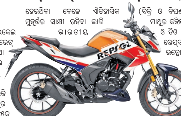
ହୋଷ୍ଟା ମୋଟରସାଇକେଲ ଆଣ୍ଡ ସ୍କୁଟର ଇଣ୍ଡିଆ ପ୍ରାଇଭେଟ୍ ଲିମିଟେଡ୍‌ର ବନ୍ଧୁ ପ୍ରତୀକ୍ଷିତ ତଥା ଅତ୍ୟାଧୁନିକ ଜ୍ଞାନକୌଶଳରେ ନିର୍ମିତ 'ରେପ୍ସଲ୍ ଏଡିସନ୍'କୁ ନିକଟରେ ସର୍ବଭାରତୀୟ ଉନ୍ମୋଚନ ହୋଇଯାଇଛି। ଏପରିକି ୨୦୨୩ ରେପ୍ସଲ୍ ଏଡିସନ୍ ହର୍ନେଟ୍ ୨.୦ ଓ ଡିଓ ୧୨୫କୁ ନିକଟରେ ଉନ୍ମୋଚନ କରାଯାଇଛି। ଏ ସମ୍ପର୍କରେ ହୋଷ୍ଟା ମୋଟରସାଇକେଲ ଆଣ୍ଡ ସ୍କୁଟର ଇଣ୍ଡିଆର ପରିଚାଳନା ନିର୍ଦ୍ଦେଶକ, ସଭାପତି ଓ ସିଲିକନ୍ ସୁସ୍ତୁ ଓଟାନି କହିଛନ୍ତି, ରେପ୍ସଲ୍ ହୋଷ୍ଟାର ହୁଡ୍‌ପିଣ୍ଡା ପ୍ରଥମ ଥର ପାଇଁ ଭାରତରେ ରେପ୍ସଲ୍ ଶିଖର ଭାବେ ପରିଚିତ ମୋଟୋ ଡିପି ପ୍ରଥମ ଥର ପାଇଁ ଭାରତରେ ଆୟୋଜନ ହେଉଥିବା ସାକ୍ଷୀ ରହିବା ଲାଗି ଭାରତୀୟ (ବିକ୍ରି ଓ ବିପଣନ) ଯୋଗେ ମାଧୁର କହିଛନ୍ତି, ହର୍ନେଟ୍ ୨.୦ ଓ ଡିଓ ୧୨୫ର ୨୦୨୩ ରେପ୍ସଲ୍ ଏଡିସନ୍କୁ ଉନ୍ମୋଚନ କରି ଆମେ ବେଶ୍ ଉତ୍ସାହିତ ଅଛୁ। ଉଭୟ ମୋଟରସାଇକେଲ ନିଜ ନିଜ କ୍ଷେତ୍ରରେ ଗ୍ରାହକଙ୍କୁ ଉଲ୍ଲେଖନୀୟ ଭାବେ ଉନ୍ମୋଚନ କରିଛନ୍ତି ଏବଂ ତାହାର ଲିମିଟେଡ୍ ଏଡିସନ୍ ଭର୍ସନ ଉନ୍ମୋଚନ କରି ଭାରତରେ ମୋଟୋଡିପି ପ୍ରଶଂସକଙ୍କ ପାଇଁ ଭାରତୀୟ ରାସ୍ତାରେ ହୋଷ୍ଟାର ରେପ୍ସଲ୍ ଏଡିସନ୍ରେ ପରିବର୍ତ୍ତନ ଆଣି ଆମେ ଆନନ୍ଦିତ। ପ୍ରଥମ ଭାରତ ଡିପି ପାଇଁ ରେପ୍ସଲ୍ ହୋଷ୍ଟା ଟିମ୍‌କୁ ଶୁଭକାମନା ଜଣାଉଛୁ।