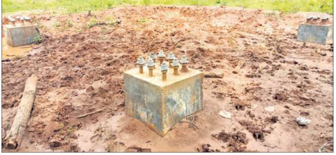
ଅଧ୍ୟାପକ୍ତରିଆ ଭାବେ ପଡ଼ି ରହିଛି ମୋବାଇଲ ଟାଓର କାମ।

ନୂଆଗାଁ, ୨୧।୯ (ଧନେଶ୍ୱର ସାହୁ) ନୟାଗଡ଼ ଜିଲ୍ଲା ନୂଆଗାଁ ବ୍ଲକ୍ ଆଦିବାସୀ ଅଧ୍ୟାପକ୍ତରିଆ ଅଞ୍ଚଳର ଅଧ୍ୟାପକ୍ତରିଆ ଗାଁ ନିର୍ମାଣ କରାଯାଉଥିବା ମୋବାଇଲ ଟାଓର କାମ ଦୀର୍ଘ ମାସ ହେଲା ଅଧ୍ୟାପକ୍ତରିଆ ଭାବେ ପଡ଼ିରହିଛି। ଏ ସଂକ୍ରମରେ ବାରମ୍ବାର ବିଭାଗୀୟ ଅଧିକାରୀଙ୍କ ନିକଟରେ ଅଭିଯୋଗ କରାଗଲେ ମଧ୍ୟ କୌଣସି କାର୍ଯ୍ୟାନୁଷ୍ଠାନ ଗ୍ରହଣ କରାଯାଇନାହିଁ। ଏଥିପାଇଁ ନୂଆଗାଁ ବ୍ଲକ୍ ଗ୍ରାମ, ଡିପିରିପଲି, ବରକୋଳା, କାସ୍ତାପଲି, ପାଞ୍ଜୁଣି, ରୁନାମାଡ଼ି ସାନ୍ତାପନାକୁ ଆଦି ଆଦିବାସୀ ଅଞ୍ଚଳବାସୀ ମୋବାଇଲ ସେବା ପାଇବାକୁ ବଞ୍ଚିତ ହୋଇଛନ୍ତି। ଉପରୋକ୍ତ ଅଞ୍ଚଳରେ ହାଇସ୍କୁଲ, ଡାକ୍ତରଖାନା, ପଞ୍ଚାୟତ କାର୍ଯ୍ୟାଳୟ ଆଦି ରହିଥିଲେ ମଧ୍ୟ ମୋବାଇଲ ସେବା ନ ଥିବାରୁ କୌଣସି ଅନୁଲୋଚନା କାମ ହୋଇପାରୁ ନାହିଁ। ଏପରି କି ସରକାରୀ କାର୍ଯ୍ୟ ମଧ୍ୟ କରାଯାଇ ପାରୁନାହିଁ। ଛାତ୍ରଛାତ୍ରୀମାନଙ୍କୁ ଡିଜିଟାଲ