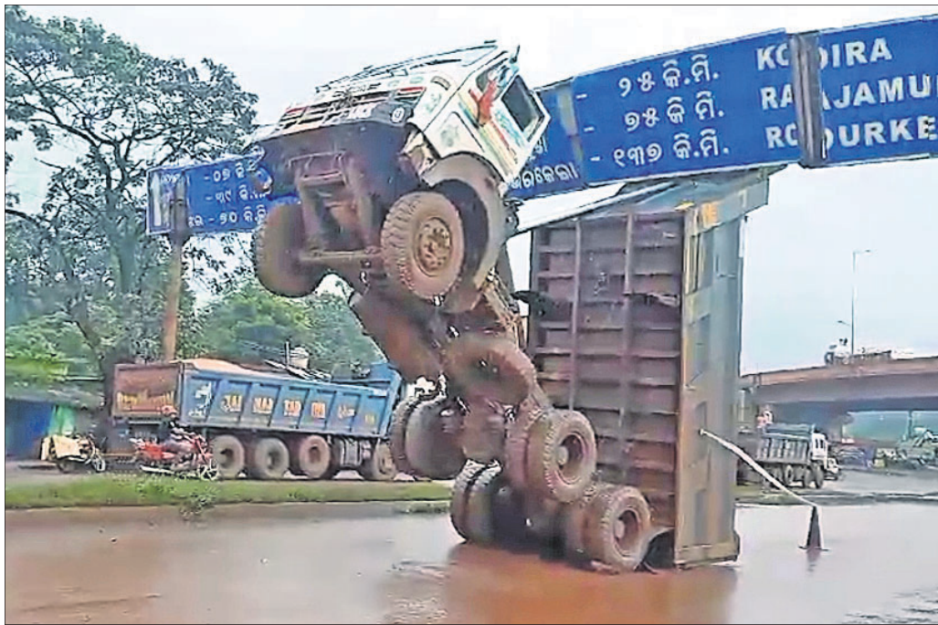
କେନ୍ଦୁଝର ଜିଲ୍ଲା ବଡ଼ବିଲ ୧୦ ନଂ ରାଜ୍ୟ ରାଜପଥଠାରେ ଗୁରୁବାର ଦେପରୁଆ ଗାଡ଼ିଚାଳନା ଯୋଗୁ ଏକ ଭାରିଯାନ ସୁତନା ଫଳକ ସହ ଧକ୍କା ହୋଇ ଉପରକୁ ଉଠିଯାଇଛି।