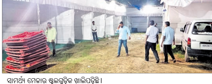
ସାମର୍ଥ୍ୟ ମେଳାରେ ଶୁଭଚୁକ୍ତି ଖାଲିପଡ଼ିଛି ।

ତୋରଣ ଆକର୍ଷଣୀୟ ହୋଇଛି । ତନ୍ତ୍ରମାନ ଭଳି ତୋରଣ ଓ ବୈଜ୍ଞାନିକଙ୍କ ଫଟୋ ମାମ ରହିଛି । ଅନ୍ୟତମ ମଧ୍ୟରୁ ଭଳି ହୋଇଛି । ନିଆରା ସେବା କରୁଛନ୍ତି ଯୁବଗୋଷ୍ଠୀ ପାରାଦୀପ ଥାନା ଛକଠାରୁ ନ୍ୟୁଆବଜାର ହୋଇଛି ଛକ ପର୍ଯ୍ୟନ୍ତ ବିଶ୍ୱକର୍ମା ତୋରଣ ହୋଇଛି । ଏହି ଅଞ୍ଚଳରେ ଲୋକଙ୍କ ଭିଡ଼ ହେବା ସହ ଉପାଧ୍ୟକ୍ଷ ସାହାଯ୍ୟ ବୋଲି ଖୋଲିଛନ୍ତି । ଏଥିରୁ ଉଦ୍ଧୃତ ଆବର୍ଜନା ସାମଗ୍ରୀ ବେଳକୁ ପୂରିବାସମୟ ପରିବେଶ ସୁସ୍ଥ କରୁଛି । ସେସବୁ ଆବର୍ଜନା ପାରାଦୀପ ପୌରପାଳିକା ସଫେଇ କରୁଛି ହେଲେ ତାହା ପର୍ଯ୍ୟାପ୍ତ ହେଉନାହିଁ । ଏଥିରେ ଆରମ୍ଭରୁ ସହଯୋଗ କରୁଛନ୍ତି ନାଳକରୁ ଯୁଧି କୁଳର ଯୁବଗୋଷ୍ଠୀ । ସମାଜ ସୁବିକଳାରେ ଲୋକମାନେ ବିଶ୍ୱକର୍ମା ତୋରଣ ଭାବି ଦେଖିବାକୁ ଯାଉଛନ୍ତି । ବିଶେଷକରି ମଧୁବନ କେନ୍ଦ୍ରୀୟ ବିଦ୍ୟାଳୟ ପାଖରେ ୨ଟି