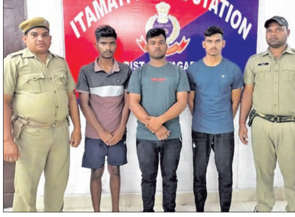
ଗିରଫ ୩ ଅଭିଯୁକ୍ତ।

■ ଲୁକ୍‌ମେଲି ଯୁବକ ଆତ୍ମହତ୍ୟା ଘଟଣା ■ ୨ ସହଯୋଗୀଙ୍କୁ ଦି ଲୋକ ପଠାଗଲା