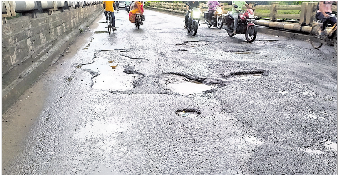
ବ୍ରିଜ ଉପରେ ସୃଷ୍ଟି ହୋଇଥିବା ଗାଡ଼।