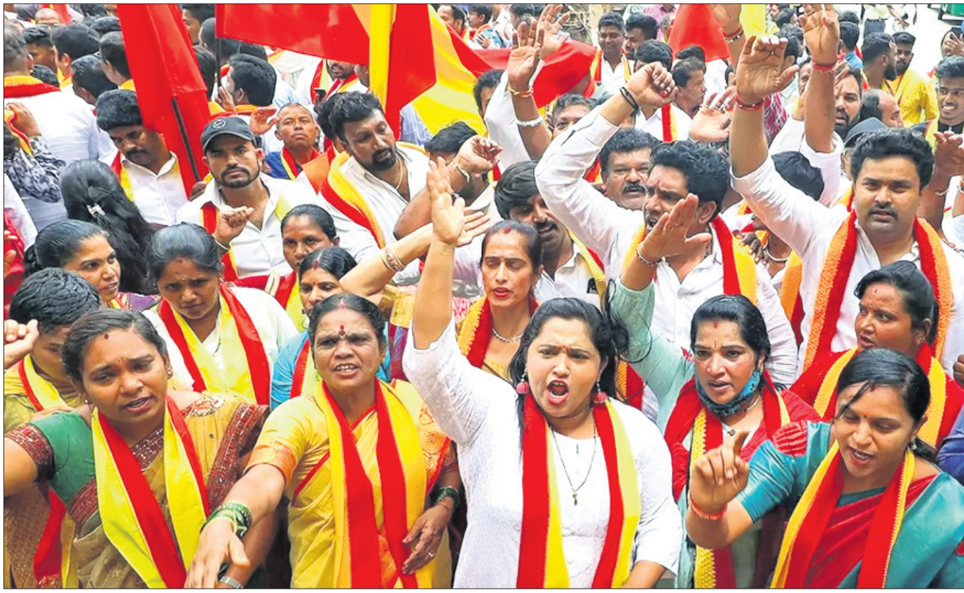
ଆସକାର୍ଯ୍ୟ ୯ ପର୍ଯ୍ୟନ୍ତ କାବେରୀ ନଦୀରୁ ୫,୦୦୦ କ୍ୟୁସେକ୍ ଜଳ ତାମିଲନାଡୁକୁ ଛାଡ଼ିବା ପାଇଁ କାବେରୀ ଜଳ ପରିଚାଳନା କର୍ତ୍ତୃପକ୍ଷ (ସିଡକ୍ୟୁଏମ୍ଏ) ପକ୍ଷରୁ ନିଆଯାଇଥିବା ନିଷ୍ପତ୍ତି ପ୍ରତିବାଦରେ ବେଙ୍ଗାଲୁରୁରେ ଗୁରୁବାର କର୍ମାଚର ରକ୍ଷଣ ବେଦିକେ ସବସ୍ୟମାନେ ବିରୋଧ ପ୍ରଦର୍ଶନ କରୁଛନ୍ତି।

କଲକାତା, ୨୧।୯ ଆସକାର୍ଯ୍ୟ ଜାନ୍ତୁନ୍ତୁ କାହାଣୀରେ ପାକିସ୍ତାନରେ ସାଧାରଣ ନିର୍ବାଚନ ଅନୁଷ୍ଠିତ ହେବ ବୋଲି ପାକିସ୍ତାନ ନିର୍ବାଚନ କମିଶନ ଗୁରୁବାର ଘୋଷଣା କରିଛନ୍ତି।