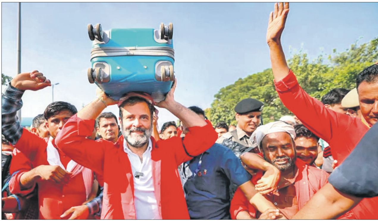
ନୂଆଦିଲ୍ଲୀର ଆନନ୍ଦବିହାର ରେଳ ଷ୍ଟେଶନରେ କୁଲିମାନଙ୍କ ସହ ଆଲୋଚନାବେଳେ କଂଗ୍ରେସ ନେତା ରାହୁଲ ଗାନ୍ଧୀ ଲାଲ ଶାର୍ଟ ପିନ୍ଧି ପୁଣି ଲଗେଇ ଦେଇଛନ୍ତି।

ହାଇଡ୍ରାବାଦରୁ ଆସାମର ଗୁଆହାଟୀ ଦେଇ ଡ୍ରାପ୍‌ଓଉଟ ଅଗରତାଳା ଅଭିଯୁକ୍ତେ ଯାତ୍ରା କରୁଥିବା ଏକ ଇଣ୍ଡିଗୋ ବିମାନରେ ଗୁରୁବାର ଜଣେ ଯୁବକ ଡୋର୍ ଖୋଲିବାକୁ ଉଦ୍ୟମ କରିଛନ୍ତି।