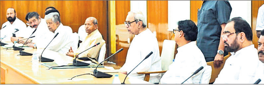
ବିଧାନସଭାର ୫୪ ନମ୍ବର ପ୍ରକାଶପତ୍ରରେ ମୁଖ୍ୟମନ୍ତ୍ରୀ ନବୀନ ପଟ୍ଟନାୟକଙ୍କ ଅଧିକାରୀଙ୍କ ଅନୁପସ୍ଥିତରେ ବିଧାୟକ ଦଳ ବୈଠକ।

ବିଧାନସଭା ମୌସୁମୀ ଅଧିବେଶନରେ ବିରୋଧୀ ଦଳ ବିଭିନ୍ନ ପ୍ରସଙ୍ଗରେ ଶାସକ ଦଳକୁ ଯେଉଁଭଳି ଭାବି ରଖିବାକୁ ପ୍ରସ୍ତୁତ କରୁଛନ୍ତି ତାହାକୁ ବିରୋଧ କରିବା ପାଇଁ ବିଧାୟକମାନେ ଆଜି ମୁଖ୍ୟମନ୍ତ୍ରୀଙ୍କୁ ନିର୍ଦ୍ଦେଶ ଦେଇଛନ୍ତି।