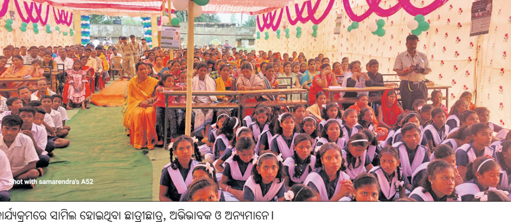
କାର୍ଯ୍ୟକ୍ରମରେ ସାମିଲ ହୋଇଥିବା ଛାତ୍ରଛାତ୍ରୀ, ଅଭିଭାବକ ଓ ଅନ୍ୟମାନେ ।