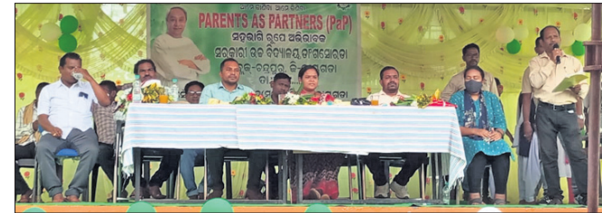
ବୈଠକରେ ମଞ୍ଚାଧୀନ ଅଭିପ୍ରାୟମାନେ।