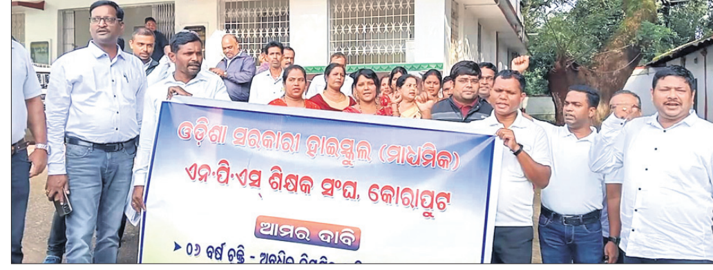
କିମ୍‌ପାଳକୁ ଦାବିପତ୍ର ଦେବାକୁ ଶିକ୍ଷକମାନଙ୍କୁ ନିର୍ଦ୍ଦେଶ ଦିଆଯାଇଥିଲା।

ବୁଲ୍ ବପା ଦାବି ପୁରଣ ପାଇଁ ଉଭୟ ପୁଷ୍ୟମନ୍ତ୍ରୀ ଓ ଗଣଶିକ୍ଷା ସଚିବଙ୍କ ଉଦ୍ଦେଶ୍ୟରେ କିଛିଦିନ ଧରି 'କିମ୍' ଶିକ୍ଷା ଅଧିକାରୀଙ୍କୁ ଶୁକ୍ରବାର ଦାବିପତ୍ର ଦେଇଛି ଓଡ଼ିଶା ସରକାରୀ ହାଇସ୍କୁଲ (ମାଧ୍ୟମିକ) ଏନ୍‌ପିଏସ୍ ଶିକ୍ଷକ ସଂଘ।