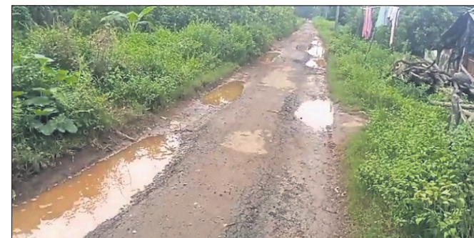
ଖାଲଖମା ଯୋଗୁଁ ରାସ୍ତାରେ ପାଣି ଜମିଛି।

ରାୟଗଡ଼ା ଜିଲ୍ଲା ଗୁଣପୁର ବ୍ଲକ ଘନାଟୀ ପଞ୍ଚାୟତ ତରାମାଳଠାରୁ ଗଙ୍ଗାପୁର ଛକ ପର୍ଯ୍ୟନ୍ତ ରାସ୍ତା ଅବସ୍ଥା ଶୋଚନୀୟ ହୋଇପଡିଛି। ଦୀର୍ଘ ୫ କିମି ରାସ୍ତାର ବିଭିନ୍ନ ସ୍ଥାନ ଖାଲଖମାରେ ଭର୍ତ୍ତି ହୋଇଥିବାରୁ ଲୋକେ ଯାତାୟତ ପାଇଁ ବହୁ ଅସୁବିଧାର ସମ୍ମୁଖୀନ ହେଉଛନ୍ତି। ଖରାପ ରାସ୍ତା ଯୋଗୁଁ ଅନେକ ସମୟରେ ଛୋଟ ବଡ଼ ଦୁର୍ଘଟଣାମାନ ଘଟୁଥିବା ଅଭିଯୋଗ ହେଉଛି। ବର୍ଷା ଦିନେ ଏହି ରାସ୍ତା ମାଟି କାଟୁଥିବାରୁ ଭର୍ତ୍ତି ହୋଇଥିବାରୁ ଛାତ୍ରଛାତ୍ରୀମାନେ ଏହି ରାସ୍ତା ଦେଇ ସ୍କୁଲକୁ ଯିବା ଆସିବା କରିବା ପାଇଁ ସମସ୍ୟା ସୃଷ୍ଟି କରୁଛି। ଏପରିକି ସେହି ରାସ୍ତା ଦେଇ ଆଲୁମିନାୟ ଯିବା ସମୟରେ