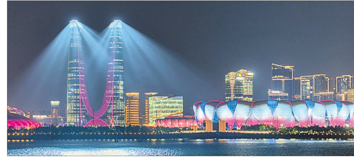
ଉଦ୍‌ଘାଟନୀ ଅପେକ୍ଷାରେ ହାଇକୋ ।

ଦଳ ପଠାଇଛି। ହାଇକୋରେ ଭାରତର ୨୫୫ ଆଧିକାର ୩୯ଟି କ୍ରୀଡ଼ାରେ ଅଂଶଗ୍ରହଣ କରିବେ। ୨୦୨୧ ଗୋଟିଏ ଅଲିମ୍ପିକ୍ ଐତିହାସିକ ପ୍ରଦର୍ଶନ ପରେ ଭାରତୀୟ ପ୍ରତିଯୋଗୀମାନେ ବିଭିନ୍ନ ଅର୍ଦ୍ଧଶତକ ଉଲ୍ଲେଖରେ ଅଧିକାର କରି ଆସୁଛନ୍ତି। ନିକଟ ଭବିଷ୍ୟତରେ ଅଲିମ୍ପିକ୍ ଆୟୋଜନର ସ୍ୱପ୍ନ ଦେଖୁଥିବା ଭାରତ ୨୦୨୮ ଏସିଆନ ଗେମ୍ସରେ ୮୮ ମ ଘ୍ନାନ ଅଧିକାର କରିଥିଲା; ଯାହା କି ସମ୍ପ୍ରତିପଦକ ନୁହେଁ। କୋଭିଡ୍