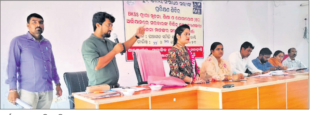
କାର୍ଯ୍ୟକ୍ରମରେ ଉପସ୍ଥିତ ଅତିଥିମାନେ ।