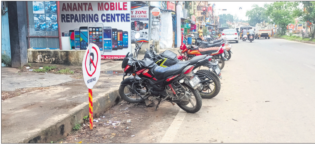
ଜାତୀୟ ରାଜପଥରେ ନୋ ପାର୍କିଂ ବୋର୍ଡ଼ ଥିଲେ ସୁଧା ଗାଡ଼ି ପାର୍କିଂ ହୋଇଛି।

ରାୟଗଡ଼ା ସହର ମଧ୍ୟଭାଗ ଦେଇ ୩୨୬ ନମ୍ବର ଜାତୀୟ ରାଜପଥ ଯାଇଛି। ଜିଲ୍ଲା ଗଠନର ୨୫ ବର୍ଷ ପରେ ୨୦୧୭ରେ