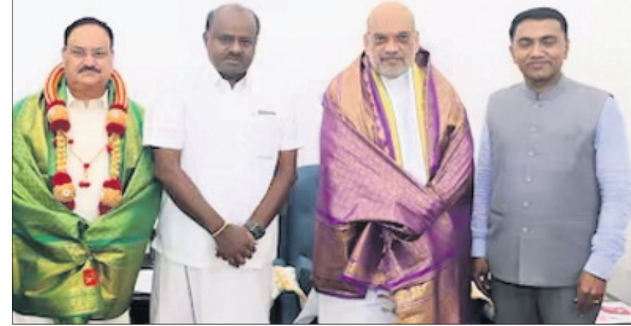
ଭାଜପା ରାଷ୍ଟ୍ରୀୟ ଅଧ୍ୟକ୍ଷ ଜେ.ପି. ନିଷ୍ଠା, ସ୍ୱରାଷ୍ଟ୍ର ମନ୍ତ୍ରୀ ଅମିତ ଶାହା ଓ ଗୋଆ ମୁଖ୍ୟମନ୍ତ୍ରୀ ପ୍ରମୋଦ ସାଢ଼େଇ ସହ ଜେଡିଏଙ୍କୁ ନେତା ଏଚ୍.ଡି. କୁମାରସାମୀ (ବାମକୁ ଦ୍ୱିତୀୟ)।

ଦୁଆବିଳା, ୨୨।୯ ୨୦୨୪ ଲୋକ ସଭା ନିର୍ବାଚନ ପୂର୍ବରୁ ପୂର୍ବତନ ପ୍ରଧାନମନ୍ତ୍ରୀ ଏଚ୍.ଡି. ଦେବେଗୋଷ୍ଠୀଙ୍କ ଧର୍ମନିରପେକ୍ଷ ଜନତା ଦଳ (ଜେଡିଏ) କର୍ମଚକରେ ଭାଜପା ସହ ମେଣ୍ଟି ଯୋଗ୍ୟ କରିଛି।