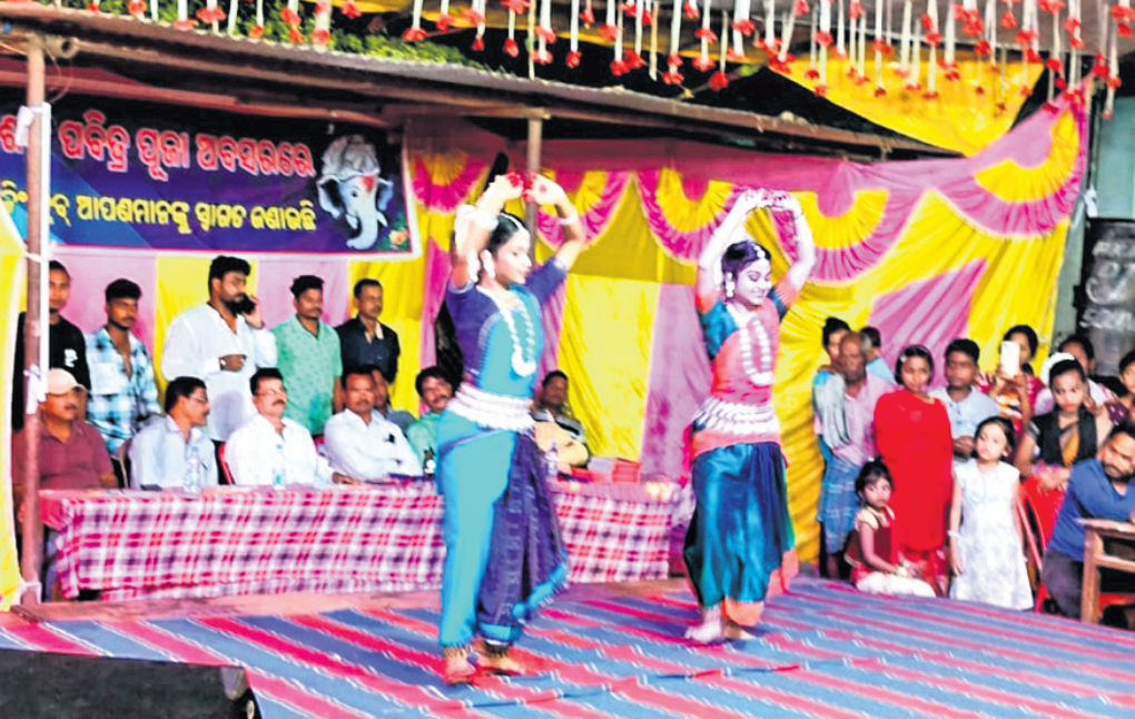
ପିଲାମାନଙ୍କ ଦ୍ୱାରା ସାଂସ୍କୃତିକ କାର୍ଯ୍ୟକ୍ରମ ପରିବେଷଣ କରାଯାଉଛି।

ମାଲକାନଗିରି, ୨୨।୯ (ଦୁର୍ଯ୍ୟୋଧନ ପାତ୍ର) ମାଲକାନଗିରି ସଦର ମହକୁମା ରିକ୍ୱାମେସନ କଲୋନୀ ଓଡ଼ିଆ ନଂ. ୧୫ରେ ରିକ୍ୱାମେସନ ରାଇଟିଂ କ୍ଲବ ଆନୁକୁଲ୍ୟରେ ଗଣେଶ ଚତୁର୍ଥୀର ତୃତୀୟ ଦିନରେ କୁନି କୁନି ଛୁଆମାନଙ୍କୁ ନେଇ ସାଂସ୍କୃତିକ କାର୍ଯ୍ୟକ୍ରମ ଅନୁଷ୍ଠିତ ହୋଇଯାଇଛି। ବିଶେଷ କରି କୁନି କୁନି ପିଲାଙ୍କ ଓଡ଼ିଶା ନୃତ୍ୟ ସମସ୍ତଙ୍କୁ ମନୁପୁତ୍ର କରିଥିଲା। ଏହି କାର୍ଯ୍ୟକ୍ରମରେ ପୁଷ୍ପ ଅତିଥି ଭାବେ ପୂର୍ବତନ ବିଧାୟକ ମାନସ ମାତକାମି ଯୋଗ ଦେଇ ପିଲାଙ୍କ ନୃତ୍ୟ ପରିବେଷଣକୁ ପ୍ରଶଂସା କରିଥିଲେ। ଅନ୍ୟମାନଙ୍କ ମଧ୍ୟରେ ପୁଷ୍ପବନ୍ତା ଭାବେ ତୃତୀୟ ଦିନରେ କୁନି କୁନି ଛୁଆମାନଙ୍କୁ ନେଇ ସାଂସ୍କୃତିକ କାର୍ଯ୍ୟକ୍ରମ ଅନୁଷ୍ଠିତ ହୋଇଯାଇଛି।