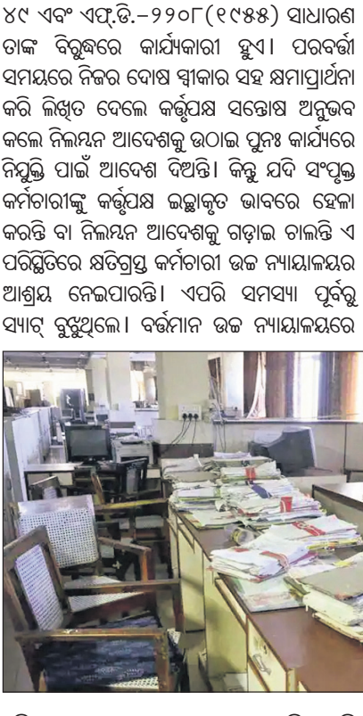
ଏହି ମାମଲା ରୁକୁ ହୋଇ ନୁହାଯାଉଛି । ଏହି ପରିସ୍ଥିତିରେ ନିଲମ୍ବିତ କର୍ମଚାରୀଙ୍କ ପିଲାମାନଙ୍କ ପାଠପଢ଼ା, ପରିବାର ସଦସ୍ୟଙ୍କ ଚିକିତ୍ସା, ଔଷଧ ଖର୍ଚ୍ଚ, ଗୃହ ଚଳାଚଳ ଖର୍ଚ୍ଚ ଆଦି ଉପରେ ସମସ୍ୟା ଆସିଥାଏ, ପରିବାରରେ ଅଶାନ୍ତି ଲାଗିରହେ । ଏହି ନିଲମ୍ବିତ ପଦବୀରୁ ପୁନଃ ନିୟୁତ ବ୍ୟବସ୍ଥାର ସମୟ ଅବଧି ଅନୁତର ବେଶାନ୍ତି, ଜନସାଧାରଣଙ୍କ ଅଭିଯୋଗ ଥାଏ, ଉପରିସ୍ଥ କର୍ତ୍ତୃପକ୍ଷଙ୍କ ଆବେଶକୁ ପାଳନ କରି ନ ଥାନ୍ତି କିମ୍ବା କୌଣସି ଅନୈତିକ କାମରେ ଲିପ୍ତ ଥାନ୍ତି ତାଙ୍କୁ କାରଣବଶୀତ ନୈତିକ ସହ କାର୍ଯ୍ୟକୁ ନିଲମ୍ବନ କରାଯାଇ ଅନୁପ୍ରସ୍ତୁତ ବଦଳି କରାଯାଏ । ସେହି ସମୟରେ ତାଙ୍କର ମୋଟ ବରମାନ ଅଧା ଶୁଖିଲା କାର୍ଯ୍ୟାଳୟରେ ସହ ମିଳିଥାଏ । ଓଡ଼ିଶା ସି.ସି.ଏ. ଭୁ-୯