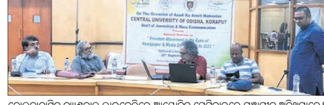
କୋରାପୁଟରୁ ନ୍ୟାସନାଲ୍ ଲାଇବ୍ରେରୀରେ ଆୟୋଜିତ ସେମିନାରରେ ମଞ୍ଚାସୀନ ଅତିଥିମାନେ।

କୋରାପୁଟ, ୨୨।୯ (ଅମିତାଭ ବେହେରା) କୋରାପୁଟରୁ ନ୍ୟାସନାଲ୍ ଲାଇବ୍ରେରୀରେ ଆୟୋଜିତ ସେମିନାରରେ ମଞ୍ଚାସୀନ ଅତିଥିମାନେ।