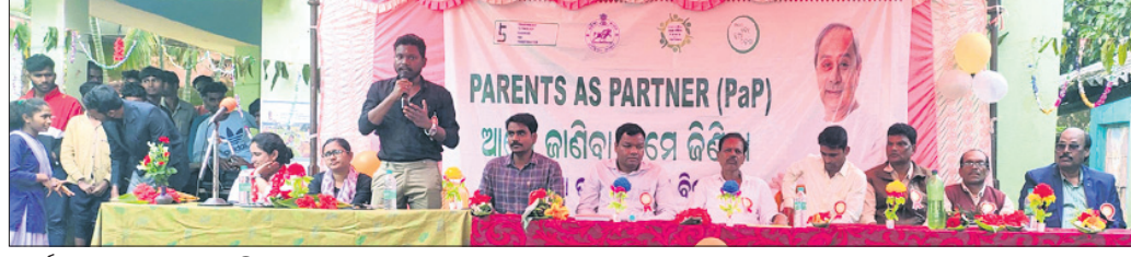
କାର୍ଯ୍ୟକ୍ରମରେ ମଞ୍ଚାସୀନ ଅତିଥି।

ବନ୍ଦଗଳ୍ପ, ୨୨।୯ (ଅରବିନ୍ଦ ନାୟକ) କୋରାପୁଟ ଜିଲ୍ଲା ବନ୍ଦଗଳ୍ପରୁ ରୁକ୍ମ ସଦର ପଞ୍ଚାୟତରେ ବଦଳିକୃତ୍ତମାନେ ଆମେ ଜାଣିବା, ଆମେ ଜିଣିବା କାର୍ଯ୍ୟକ୍ରମ ଅନୁଷ୍ଠିତ ହୋଇଥିଲା।