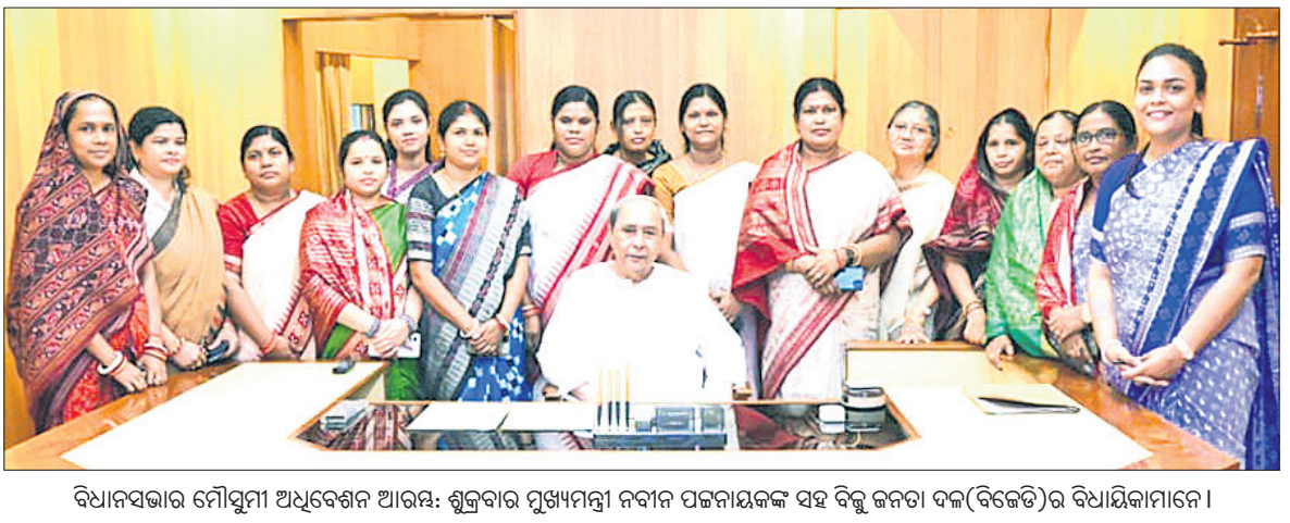
ବିଧାନସଭାର ମୁଖ୍ୟମନ୍ତ୍ରୀ ଅଧିବେଶନ ଆରମ୍ଭ: ଶୁକ୍ରବାର ମୁଖ୍ୟମନ୍ତ୍ରୀ ନବୀନ ପଟ୍ଟନାୟକଙ୍କ ସହ ବିଜୁ ଜନତା ଦଳ(ବିଜେଡି)ର ବିଧାୟକମାନେ।