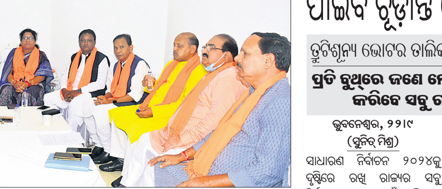
ବିରୋଧୀ ଦଳ ନେତା ଜୟନାରାୟଣ ମିଶ୍ରଙ୍କ ଅଧିକାରୀଙ୍କ ଅନୁପସ୍ଥିତରେ ଭାଜପା ବିଧାୟକ ଦଳ ବୈଠକ।

ଆଇନଶୃଙ୍ଖଳା, ଶିକ୍ଷା, ସ୍ୱାସ୍ଥ୍ୟ, ବେକାରିକୁ ପ୍ରସଙ୍ଗ କରି ଭାଜପା ବିଧାୟକମାନେ ଆଜି ମୁଖ୍ୟମନ୍ତ୍ରୀଙ୍କୁ ନିର୍ଦ୍ଦେଶ ଦେଇଛନ୍ତି।