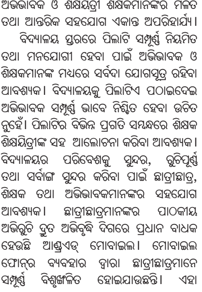
ଅଭିଭାବକ ଓ ଶିକ୍ଷୟିତ୍ରୀ ଶିକ୍ଷକମାନଙ୍କର ମିଳିତ ତଥା ଆନ୍ତରିକ ସହଯୋଗ ଏକାନ୍ତ ଅପରିହାର୍ଯ୍ୟ । ବିଦ୍ୟାଳୟ ପ୍ରସଙ୍ଗରେ ପିଲାଟି ସମ୍ପୂର୍ଣ୍ଣ ନିୟମିତ ତଥା ମନଯୋଗୀ ହେବା ପାଇଁ ଅଭିଭାବକ ଓ ଶିକ୍ଷକମାନଙ୍କ ମଧ୍ୟରେ ସର୍ବଦା ଯୋଗସୂତ୍ର ରହିବା ଆବଶ୍ୟକ । ବିଦ୍ୟାଳୟରୁ ପିଲାଟିଏ ପଠାଇଦେଇ ଅଭିଭାବକ ସମ୍ପୂର୍ଣ୍ଣ ଭାବେ ନିଶ୍ଚିତ ହେବା ଉଚିତ ରୁହେଁ । ପିଲାଟିର ବିଭିନ୍ନ ପ୍ରଗତି ସହଯୋଗ ଶିକ୍ଷକ ଶିକ୍ଷୟିତ୍ରୀଙ୍କ ସହ ଆଲୋଚନା କରିବା ଆବଶ୍ୟକ । ବିଦ୍ୟାଳୟର ପରିବେଶକୁ ସୁନ୍ଦର, ତୁଟିପୁର୍ଣ୍ଣ ତଥା ସର୍ବାଙ୍ଗ ସୁନ୍ଦର କରିବା ପାଇଁ ଛାତ୍ରଛାତ୍ରୀ, ଶିକ୍ଷକ ତଥା ଅଭିଭାବକମାନଙ୍କର ସହଯୋଗ ଆବଶ୍ୟକ । ଛାତ୍ରଛାତ୍ରୀମାନଙ୍କର ପାଠକାୟ ଅଭିଭାବକ ଦୁଃଖ ଅଭିଭାବକ ଦିଗରେ ପ୍ରଧାନ ବାଧକ ହେଉଛି ଆଶ୍ଚର୍ଯ୍ୟ ଯୋଗାଇଲା । ମୋବାଇଲ୍ ଫୋନ୍ର ବ୍ୟବହାର ଦ୍ୱାରା ଛାତ୍ରଛାତ୍ରୀମାନେ ସମ୍ପୂର୍ଣ୍ଣ ବିଶ୍ୱକୁ ନିଶ୍ଚଳ ହୋଇଯାଉଛନ୍ତି । ଏହା

ତେବେ ପ୍ରଶ୍ନ ରୁହୁଛି, ସାମ୍ପ୍ରତି ଶିକ୍ଷା ବ୍ୟବସ୍ଥାରେ ଛାତ୍ରଛାତ୍ରୀମାନେ କିଭଳି ଶୁଖିଲାକୁ ସମ୍ପୂର୍ଣ୍ଣ ରୁଚୁଛନ୍ତି ବୋଲି ତାଙ୍କର ଭବିଷ୍ୟତ ନିର୍ମାଣ କରିବେ । ପିଲାଟିଏ ଧୀରେ ଧୀରେ ବଡ଼ ହୁଏ । ସେ ପରିବାରରୁ କିଛି ଶିକ୍ଷା ଓ ସଂସ୍କାର ନେଇ ତା'ର ଛାତ୍ରଜୀବନ ଆରମ୍ଭ କରିଥାଏ । ଏଥିପାଇଁ ଛାତ୍ରଛାତ୍ରୀମାନଙ୍କର ଶୁଖିଲା ଓ ସଦାଚାର ପାଇଁ ପିତାମାତା, ସମାଜ ଯତ୍ନବାନ୍ ହେବା ଆବଶ୍ୟକ । କଥାରେ କୁହାଯାଇଛି, ପରିବାର ହେଉଛି ପିଲା ପ୍ରଥମ ବିଦ୍ୟାଳୟ ଏବଂ ମାଆ ହେଉଛି ଆଦ୍ୟ ଶିକ୍ଷକ । ଏହି ପ୍ରସଙ୍ଗରେ ଛାତ୍ରଛାତ୍ରୀମାନଙ୍କୁ ଶୁଖିଲା, ସଦାଚାର, ବିନୟନଶୀଳତା ଇତ୍ୟାଦି ଗୁଣଗୁଡ଼ିକ ଗୃହରେ ପିତାମାତା ଦାୟିତ୍ୱ ଓ ନିଷ୍ଠାର ସହ ସେମାନଙ୍କୁ ଶିକ୍ଷାଦେବା ଉଚିତ । ନୈତିକ ମୂଲ୍ୟବୋଧ, ସହନଶୀଳତା, ପରୋପକାରୀତା ଏସବୁ ମହାନ୍ ତଥା ଦେବୋପମ ଗୁଣାବଳୀର ପୂର୍ଣ୍ଣ ବିକାଶ ପାଇଁ ଅଭିଭାବକ ଗୋଷ୍ଠୀ ପ୍ରାରମ୍ଭିକ ଅଭିଭାବକ ଓ ଶିକ୍ଷୟିତ୍ରୀ ଶିକ୍ଷକମାନଙ୍କର ମିଳିତ ତଥା ଆନ୍ତରିକ ସହଯୋଗ ଏକାନ୍ତ ଅପରିହାର୍ଯ୍ୟ । ବିଦ୍ୟାଳୟ ପ୍ରସଙ୍ଗରେ ପିଲାଟି ସମ୍ପୂର୍ଣ୍ଣ ନିୟମିତ ତଥା ମନଯୋଗୀ ହେବା ପାଇଁ ଅଭିଭାବକ ଓ ଶିକ୍ଷକମାନଙ୍କ ମଧ୍ୟରେ ସର୍ବଦା ଯୋଗସୂତ୍ର ରହିବା ଆବଶ୍ୟକ । ବିଦ୍ୟାଳୟରୁ ପିଲାଟିଏ ପଠାଇଦେଇ ଅଭିଭାବକ ସମ୍ପୂର୍ଣ୍ଣ ଭାବେ ନିଶ୍ଚିତ ହେବା ଉଚିତ ରୁହେଁ । ପିଲାଟିର ବିଭିନ୍ନ ପ୍ରଗତି ସହଯୋଗ ଶିକ୍ଷକ ଶିକ୍ଷୟିତ୍ରୀଙ୍କ ସହ ଆଲୋଚନା କରିବା ଆବଶ୍ୟକ । ବିଦ୍ୟାଳୟର ପରିବେଶକୁ ସୁନ୍ଦର, ତୁଟିପୁର୍ଣ୍ଣ ତଥା ସର୍ବାଙ୍ଗ ସୁନ୍ଦର କରିବା ପାଇଁ ଛାତ୍ରଛାତ୍ରୀ, ଶିକ୍ଷକ ତଥା ଅଭିଭାବକମାନଙ୍କର ସହଯୋଗ ଆବଶ୍ୟକ । ଛାତ୍ରଛାତ୍ରୀମାନଙ୍କର ପାଠକାୟ ଅଭିଭାବକ ଦୁଃଖ ଅଭିଭାବକ ଦିଗରେ ପ୍ରଧାନ ବାଧକ ହେଉଛି ଆଶ୍ଚର୍ଯ୍ୟ ଯୋଗାଇଲା । ମୋବାଇଲ୍ ଫୋନ୍ର ବ୍ୟବହାର ଦ୍ୱାରା ଛାତ୍ରଛାତ୍ରୀମାନେ ସମ୍ପୂର୍ଣ୍ଣ ବିଶ୍ୱକୁ ନିଶ୍ଚଳ ହୋଇଯାଉଛନ୍ତି । ଏହା