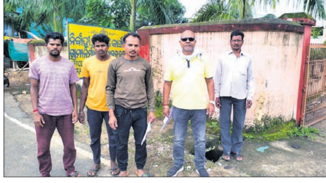
ଦାବିପତ୍ର ପ୍ରଦାନ କରିବାକୁ ଆସିଥିବା ବ୍ୟକ୍ତିମାନେ।

କରପୁର ରୁକ୍ମ ବେଳ ହାଣ୍ଡିପୁର-ସେମିକିଗୁଡ଼ା ସଂଯୋଗ କରୁଥିବା ଏମିଡିଆର-୫୫ ରାସ୍ତା ରହିଛି।