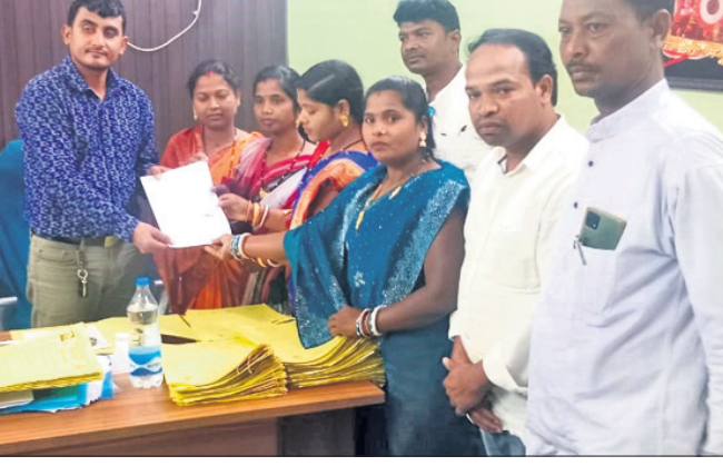
ବିତିତ ଦାବିପତ୍ର ଗ୍ରହଣ କରୁଛନ୍ତି ।