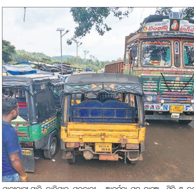
ଯାତ୍ରୀବାହୀ ଗାଡ଼ି, ଭାରିଯାନ, ସରକାରୀ କର୍ମଚାରୀ ଓ ସାଧାରଣ ଲୋକେ ଯାତାୟତ ବେଳେ ଅସୁବିଧାର ସମ୍ମୁଖୀନ ହେଉଛନ୍ତି।

କରପୁର ରୁକ୍ମ ବେଳ ହାଣ୍ଡିପୁର-ସେମିକିଗୁଡ଼ା ସଂଯୋଗ କରୁଥିବା ଏମିଡିଆର-୫୫ ରାସ୍ତା ରହିଛି।