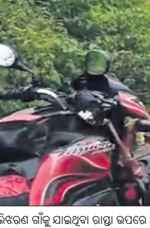
ମଲିଖରଣ ଗାଁକୁ ଯାଇଥିବା ରାସ୍ତା ଉପରେ ପାଣି।

ରାୟଗଡ଼ା ଜିଲ୍ଲା କାଶୀପୁର ବ୍ଲକ କୋଡ଼ିପାରି ପଞ୍ଚାୟତ ମଲିଖରଣ ଗାଁକୁ ଯାଇଥିବା ରାସ୍ତା ଶୋଚନୀୟ ହୋଇପଡିଛି। ରାସ୍ତା ଖାଲ ଡିପରେ ଭର୍ତ୍ତି ହୋଇଥିବାବେଳେ ସାମାନ୍ୟ ବର୍ଷା ହେଲେ ରାସ୍ତା ଉପରେ ପ୍ରାୟ ୧୦୦ ଫୁଟର ପାଣି ସୁଅ ଛୁଟୁଛି। ଫଳରେ ବର୍ଷାଦିନେ ଉଚ୍ଚ ମାଟି ରାସ୍ତାରେ ଗ୍ରାମବାସୀଙ୍କୁ ଯାତାୟତ କରିବାକୁ ବହୁତ କଷ୍ଟକର ହୋଇପଡୁଛି। ରାସ୍ତା ମରାମତି ପାଇଁ ବାରମ୍ବାର