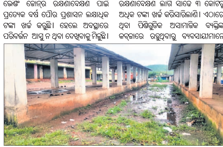
୨୨୯୯ ଜାତୀୟ ରାଜପଥ ପାର୍ଶ୍ୱରେ ପୌର ପରିଷଦ ପକ୍ଷରୁ ହୋଇଥିବା ଭେଣ୍ଟି ଜୋନ୍।

ବ୍ୟବସାୟ କରିବା ପାଇଁ ସୁରକ୍ଷିତ ମଣ୍ଡଳୀକରଣ। ଏତଦ୍ ବ୍ୟତୀତ ଏଠାରେ ପାର୍କିଂ ବ୍ୟବସ୍ଥା ନ ଥିବାରୁ ବିଭିନ୍ନ ସାମଗ୍ରୀ ଜମା କରିବାକୁ ଆସୁଥିବା ଲୋକମାନେ ରାସ୍ତାକଡ଼ରେ ଗାଡ଼ି ସାଇକେଲ ରଖିବାକୁ ବାଧ୍ୟ ହେଉଛନ୍ତି। ଫଳରେ ସାତ ଦିନ ଏହି ରାସ୍ତା ଅତି ସଂକୀର୍ଣ୍ଣ ହୋଇ ଯାତାୟତରେ ସମସ୍ୟା ସୃଷ୍ଟି ହୋଇଥାଏ। ଏ ସମ୍ପର୍କରେ ପୌର ପରିଷଦ ଉଦ୍ଦେଶ୍ୟ ପାଠୁକୁ ପରାମର୍ଶ ଦେଇଛନ୍ତି, ସେ ଅଧିକ ହେବା ପରେ ଭେଣ୍ଟି ଜୋନ୍‌ର ଅନେକ ସମସ୍ୟା ସମାଧାନ କରିଛନ୍ତି। ଆଉ ଯାହା ବାକି ଯେଉଁ ସମସ୍ୟା ରହିଛି ବର୍ଷା ଋତୁ ପରେ ସେଗୁଡ଼ିକର ସମାଧାନ କରାଯିବ। ଭେଣ୍ଟି ଜୋନ୍ ପରିସରକୁ ଅଧିକାରୀଙ୍କୁ ଅଧିକାରୀଙ୍କୁ ଅବଗତ କରାଯାଇଥିଲା। ଏହା ପ୍ରକଳ୍ପର ଅଧିକାରୀଙ୍କୁ ଅବଗତ କରାଯାଇଥିଲା। ଏହା ପ୍ରକଳ୍ପର ଅଧିକାରୀଙ୍କୁ ଅବଗତ କରାଯାଇଥିଲା।