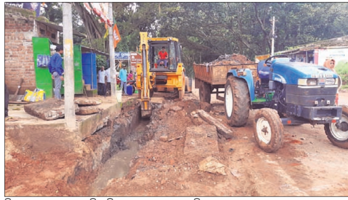
ନିଜ ଚରାବଧାନରେ ସାହିବାସିନ୍ଦା ଡ୍ରେନ୍ ସଫା କରୁଛନ୍ତି।