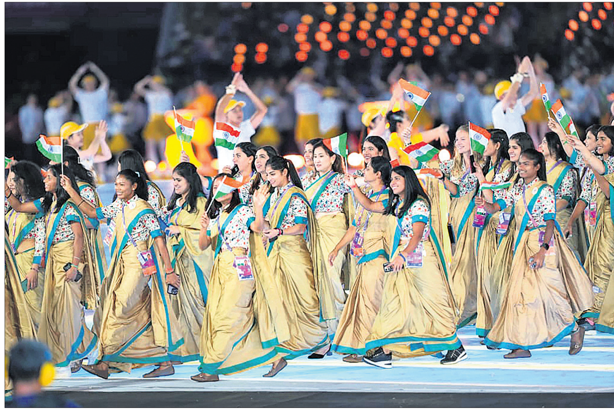
ଉଦ୍‌ଘାଟନା ସମାବେଶରେ ଭାରତୀୟ ମହିଳା ଆଧୁନିକ ଡାନ୍ସ।