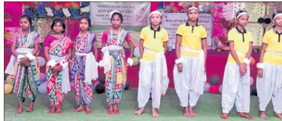
ମାଧୁଲିକେ କାର୍ଯ୍ୟକ୍ରମରେ ସାମିଲ ହୋଇଥିବା ଛାତ୍ରାମାନେ ।