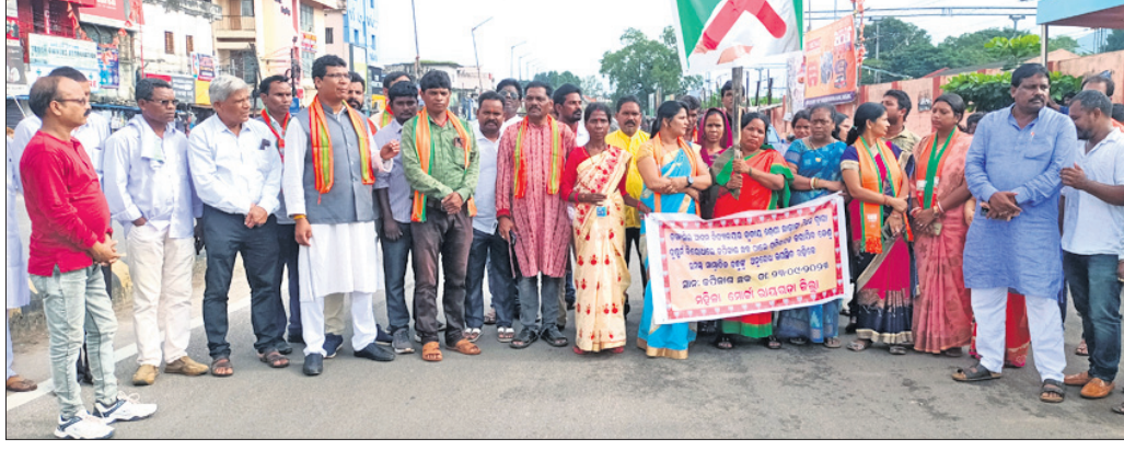
କପିଳାସ ଛକରେ ଭାଜପା କର୍ମୀମାନେ ପ୍ରତିବାଦ କରୁଛନ୍ତି ।