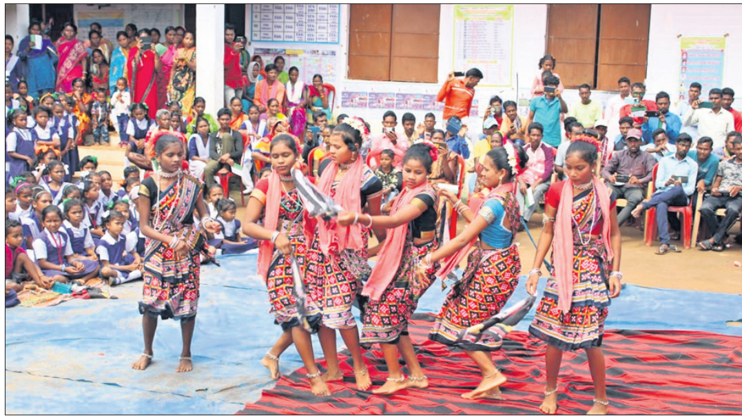
ଛାତ୍ରଛାତ୍ରୀମାନେ ସାଂସ୍କୃତିକ କାର୍ଯ୍ୟକ୍ରମ ପରିବେଷଣ କରୁଛନ୍ତି ।

ମାଲକାନଗିରି ଜିଲ୍ଲା କାଲିମେଳା ବ୍ଲକ ଅନ୍ତର୍ଗତ ମହାରାଜପଲି ପଞ୍ଚାୟତ କାର୍ଯ୍ୟାଳୟ ସମ୍ମୁଖରେ ପିଢ଼ିଏବ ଚାଉଳ ବ୍ୟବସାୟ ଚାଲିଛି । ଏଥିପ୍ରତି ପ୍ରଶଂସନ ନିରବଚ୍ୟୁତ ସାଜିଛି ସରକାରଙ୍କ ପକ୍ଷରୁ ଗରିବ ଲୋକଙ୍କ ପାଇଁ ମାସିକ ରାଶନ ଚାଉଳ ପ୍ରଦାନ କରାଯାଉଥିବା ବେଳେ ବ୍ୟବସାୟୀମାନେ ଏହାକୁ ହିତାଧିକାରୀଙ୍କଠାରୁ ସଙ୍ଗେସଙ୍ଗେ ଜଣି ନେଇ ପଞ୍ଚାୟତ କାର୍ଯ୍ୟାଳୟଠାରୁ ମାତ୍ର କିଛି ମିଟର ଦୂରରେ ଗୋଦାମ କରି କାରବାର ଚଳାଇଛନ୍ତି । ଏହି ଗୋଦାମରେ ୬୦୦୦ ଡକ୍ଟର ବସ୍ତା ଚାଉଳ ଗଚ୍ଛିତ ଥିବା ଜଣାପଡ଼ିଛି । ଏମପିଜି-୮୧ ଗ୍ରାମର ଜଣେ ବ୍ୟକ୍ତି ଏହି ଗୋଦାମ କରିଥିବା ଜଣାପଡ଼ିଛି । ପ୍ରଶଂସନ ଏଥିପ୍ରତି ଦୃଷ୍ଟି ଦେବାକୁ ଦାବି ହେଉଛି ।