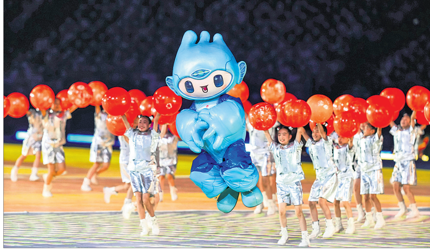
କୁନି ପିଲାଙ୍କ ସହ ଏସିଆନ୍ ଗେମ୍ସ୍‌ର ମାସ୍କଟ୍ 'ମେଗୋରିଡ୍ ଅଫ୍ ଚିଆଙ୍ଗନାନ୍' ।