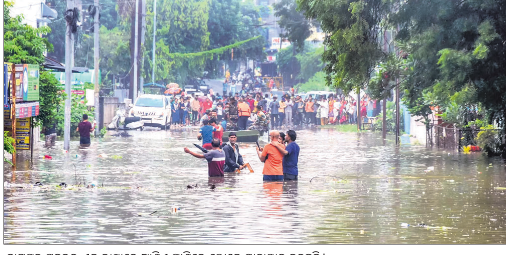
ନାଗପୁର ସହରର ଏକ ରାସ୍ତାରେ ଆଣ୍ଡିଏ ପାଣିରେ ଲୋକେ ଯାତାୟାତ କରୁଛନ୍ତି। ଶନିବାର ସକାଳ ୫.୩୦ ବୁଝା ୧୦୬.୭ ଲାଗି ରହିଥିବାରୁ ଗ୍ରାମିଣ ସେବା ପ୍ରଭାବିତ ମିଳିଚିତ ବର୍ଷା ହୋଇଛି। ସକାଳୁ ବର୍ଷା ହୋଇଥିଲା। ସେହିପରି ବର୍ଷା ଯୋଗୁ ଜଣକଙ୍କ ମୃତ୍ୟୁ ଘଟିଥିବାବେଳେ ଟ୍ରେନ୍ ବସ୍ ଓ ବିମାନ ସେବା ପ୍ରଭାବିତ ହୋଇଛି।