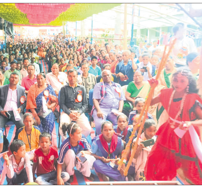
କାର୍ଯ୍ୟକ୍ରମରେ ଉପସ୍ଥିତ ଅତିଥି, ଅଭିଭାବକ ଓ ଛାତ୍ରମାନେ ।

ମଇନାପଦର ଗ୍ରାମ ଅଭିମୁଖେ ବାହାରିଥିବା ବେଳେ ରାସ୍ତା ଖରାପ ଯୋଗୁ ଏକ କିଲୋମିଟର ଦୂରରେ ଥିବା ସାପଗଣା ଏବଂ ଆୟାବୋରା ଗ୍ରାମ ଛକ ନିକଟରେ ଅଟକି ରହିଥିଲା । ପରିବାର ଲୋକ ଏକ ଗ୍ରାମ୍ୟ ଯୋଗେ ଗର୍ଭବତୀ ମହିଳାଙ୍କୁ ଆୟୁର୍ବିଦ୍ଧି ପର୍ଯ୍ୟନ୍ତ ନେଇଥିଲେ । ପରେ ଆୟୁର୍ବିଦ୍ଧି ଗୁରୁତର ଅବସ୍ଥାରେ ତାଙ୍କୁ ଝରିଗାଁ ଡାକ୍ତରଖାନାରେ ଭର୍ତ୍ତି କରାଯାଇଛି । ତାଠାରେ ସେ ଏକ ନବଜାତ ଶିଶୁ କନ୍ୟା ଜନ୍ମ ଦେଇଥିଲେ । ଉଭୟ ସୁସ୍ଥ ଥିବା ସୂଚନା ମିଳିଛି ।