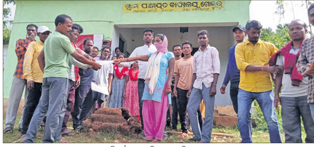
ପଞ୍ଚାୟତବାସୀ ପ୍ରଶାସନକୁ ଅବଗତ କରାଇବା ଲାଗି ଖାର୍ଚ୍ଚଭ୍ୟାସକୁ ଦାବିପତ୍ର ଦେଉଛନ୍ତି।