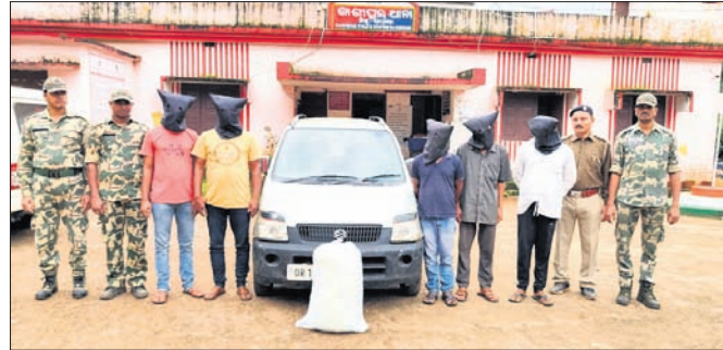
ଗିରଫ ଅଭିଯୁକ୍ତ ଓ ଜବତ ଗଞ୍ଜେଇ ।