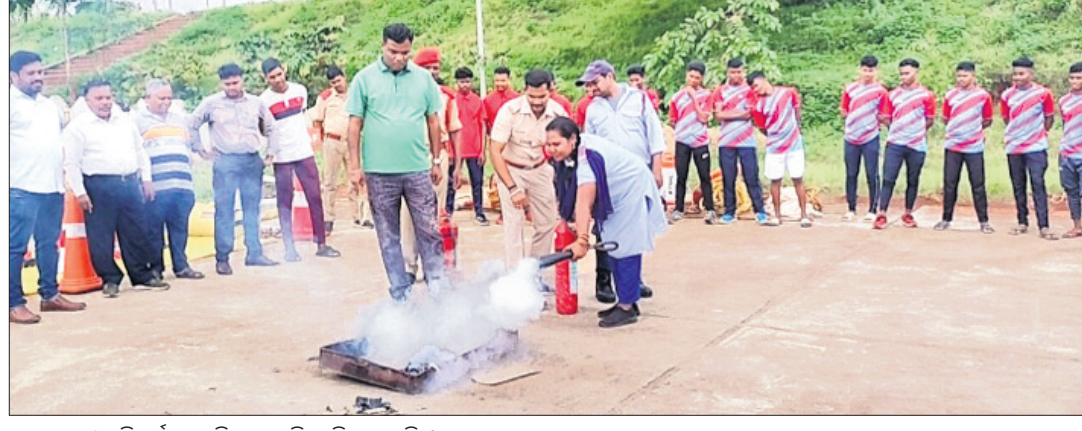
ଜଣେ ଛାତ୍ରାକୁ ବିପର୍ଯ୍ୟୟ ପରିଚାଳନା ଶିକ୍ଷା ଦିଆଯାଇଛି।

କୋରାପୁଟ ଜିଲ୍ଲା ଜାତୀୟ ଛାତ୍ରାବାସଠାରେ ଶନିବାର ୩ଟି ବିଭାଗ ପକ୍ଷରୁ ଅଗ୍ନିନିର୍ବାପକ ମକ୍ତୂଲି କାର୍ଯ୍ୟକ୍ରମ ଅନୁଷ୍ଠିତ ହୋଇଯାଇଛି। ଜିଲ୍ଲା ଜରୁରୀକାଳୀନ ଅଧିକାରୀ ଜ୍ଞାନଜିତ ତ୍ରିପାଠୀଙ୍କ ଚରାବଧାନରେ ହୋଇଥିବା ଏହି କାର୍ଯ୍ୟକ୍ରମରେ ପ୍ରାକୃତିକ ଓ ମନୁଷ୍ୟକୃତ ବିପର୍ଯ୍ୟୟ ସମୟରେ ଉଦ୍ଧାର ଏବଂ ସ୍ଥାନାନ୍ତରଣ କିପରି କରାଯିବ ଏବଂ ଏନେଇ କିପରି ଆତ୍ମା ପ୍ରସ୍ତୁତି ରହିବ ସେନେଇ ଛାତ୍ରମାନଙ୍କୁ ଅବଗତ କରାଯାଇଥିଲା। ଏହି ମକ୍ତୂଲିରେ ଓଡ୍ରାଫ, ଅଗ୍ନିଶମ, ବ୍ୟୋମାଗିକ ପ୍ରତିରକ୍ଷା ବିଭାଗର ଅଧିକାରୀ ଓ କର୍ମଚାରୀମାନେ ସାମିଲ