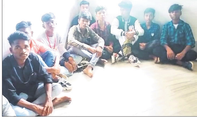
ଅଭିଯୋଗ କରିବାକୁ ଆସିଥିବା ଅନୁଷ୍ଠାନ ହସ୍ତେଇ ଛାତ୍ରମାନେ ।