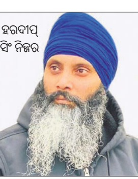
ହରଦୀପ୍ ସିଂ ନିଜର

ଖଲିସ୍ତାନୀ ବିଚ୍ଛିନ୍ନତାବାଦୀ ହରଦୀପ୍ ସିଂ ନିଜରଙ୍କ ହତ୍ୟାକୁ ନେଇ ଭାରତ ଓ କାନାଡା ମଧ୍ୟରେ ବିବାଦ ଟୀକ୍ ହୋଇଛି। ତେବେ ନିଜର ଧର୍ମୀୟ କିମ୍ବା ସାମାଜିକ ବ୍ୟକ୍ତିତ୍ୱ ନୁହେଁ, ସେ ଆତଙ୍କବାଦୀମାନଙ୍କ ପାଇଁ ତାଲିମ ଶିବିର ଚଳାଇବା ସହ ଆତଙ୍କବାଦ କାର୍ଯ୍ୟ ପାଇଁ ପାଣି ଯୋଗାଇଥିଲେ ବୋଲି ଏକ ପୂର୍ବରୁ କୁହାଯାଇଛି। ବେଆଇନ ଖଲିସ୍ତାନୀ କମାଣ୍ଡୋ ଫୋର୍ସର ଗୁରୁଦୀପ୍ ସିଂ ଓଡ଼ିଶା ଦୀପା ହେରାନ୍‌ଫୁଲାଇଁ ଘନିଷ୍ଠ ସହଯୋଗୀ ଥିଲେ ନିଜର। ନିଶା ଚୋରା କାରବାର ଏବଂ ବଟି ଆଦାୟ ଆଦି ବେଆଇନ କାର୍ଯ୍ୟରେ ସମ୍ପୃକ୍ତ ନିଜର ଗିରଫ ଭୟରେ ୧୯୯୬ରେ କାନାଡା ପଳାଇଥିଲେ। କାନାଡାରେ ସେ ଆତଙ୍କବାଦୀ କାର୍ଯ୍ୟ ପାଇଁ ପାଣି ଯୋଗାଡ଼ କରୁଥିଲେ ଓ ଭାରତରେ ଆକ୍ରମଣ ପାଇଁ ବ୍ରିଟିଶ୍ କଲମିଆରେ ହୋଇ ନ ଥିଲା। ଏନ୍‌ଆଇଏ ତାଙ୍କ ବିରୋଧରେ ଅନେକ ମାମଲା ରୁଜୁ କରିବା ସହ ଇଣ୍ଟରପୋଲ୍ ରେଡ୍ ସଂଗଠନ ଖଲିସ୍ତାନୀ ଚାଲଗର ଫୋର୍ସର ଅପରେଶନ ମୁଖ୍ୟ ଭାବେ କାର୍ଯ୍ୟ କରିଆସୁଥିଲେ। ୨୦୧୨ରେ ସେ ପାକିସ୍ତାନରେ ବାବର ଖାଲିସା କୃତନୀତିକ୍ରମମୂଳକ ଧମକ ଦେଇଥିଲେ।