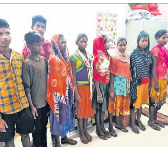
ଉଦ୍ଧାର ହୋଇଥିବା ଶିଶୁମାନେ ।