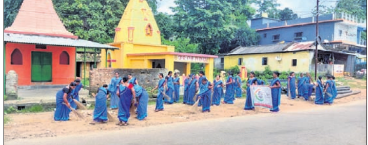
ସ୍ୱୟଂ ସହାୟକ ଗୋଷ୍ଠୀର ସଦସ୍ୟମାନେ ଶିବ ମନ୍ଦିର ନିକଟରେ ଅଳିଆ ଆବର୍ଜନା ସଫା କରୁଛନ୍ତି ।

ସ୍ୱଚ୍ଛତା ହିଁ ସେବା ଭାରତ ସରକାରଙ୍କ ସ୍ୱଚ୍ଛ ଭାରତ ମିଶନରେ ଅନୁପ୍ରାଣିତ ହୋଇ କାଲିମେଳା ସ୍ୱୟଂ ସହାୟକ ଗୋଷ୍ଠୀଗୁଡ଼ିକ ପକ୍ଷରୁ ରାସ୍ତାଘାଟ ସଫାକ କରାଯାଇଛି । କାଲିମେଳା ବ୍ଲକର ସ୍ୱାମୀ ବିବେକାନନ୍ଦ ମଞ୍ଚ ପକ୍ଷରୁ ଆୟୋଜିତ ଏହି କାର୍ଯ୍ୟରେ ୧୩ଟି ସ୍ୱୟଂ ସହାୟକ ଗୋଷ୍ଠୀ ସାମିଲ ହୋଇଥିଲେ । କାଲିମେଳାର ୩ଟି ସାହି ତେଲୁଗୁ ସାହି, ହାଟପଦା ସାହି ଓ ଶାଳବାଗାନ ସାହିରେ ସ୍ୱୟଂ ସହାୟକ ଗୋଷ୍ଠୀର ମହିଳାମାନେ ସାହିର ବିଭିନ୍ନ ସ୍ଥାନ ସଫା କରିଥିଲେ । ଏହି ଅବସରରେ ସଦସ୍ୟମାନେ ମଧ୍ୟ ହାତରେ ଝାଡୁ, ଝୁଡ଼ି,