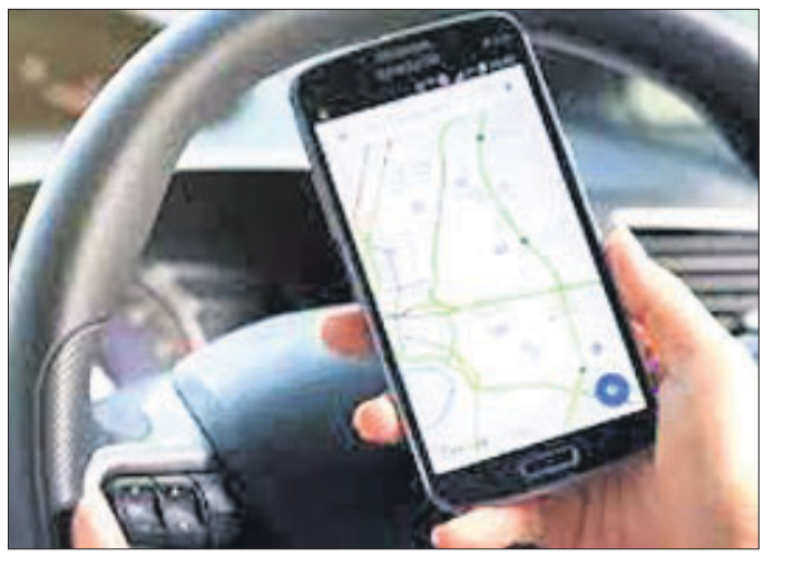
କମ୍ପାନୀ ବିରୋଧରେ ମକଦ୍ଦମା ଅଭିଯୋଗ ଅନୁଯାୟୀ, ବ୍ରିଟି ୫ ବର୍ଷ ଦାଏର କରିଛନ୍ତି। ସେମାନଙ୍କ ପୂର୍ବେ ଧୋଇଯାଉଥିବା କଥା ଗୁଗଲ୍