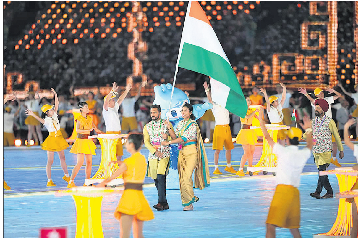
ଜାତୀୟ ପତାକା ସହ ଭାରତୀୟ ଆଧୁନିକ ଡାନ୍ସ ନେଟ୍‌ସ୍ ନେଉଛନ୍ତି ହରମନ୍‌ପ୍ରୀତ୍ ସିଂ ଓ ଲଭଲିନା ବୋର୍ଗୋହେନ୍‌।