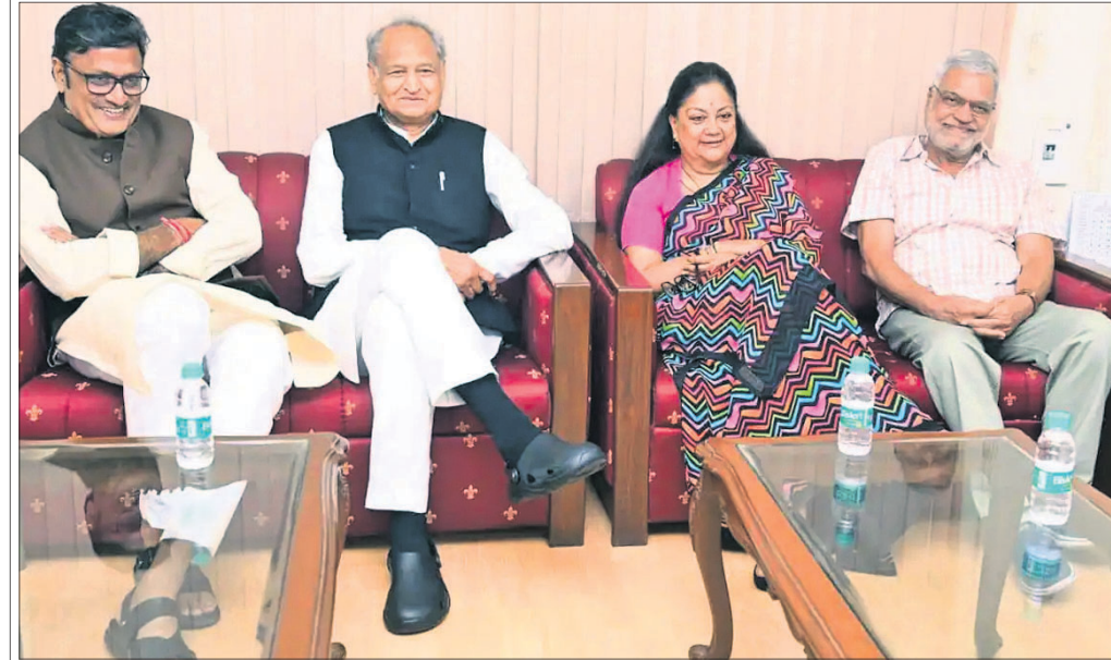
କନ୍ୟାପୁରସ୍ଥିତ କନ୍ୟାଶ୍ରମରେ କୁଳ ଉଦ୍ଘାଟନା ଉତ୍ସବ ଅବସରରେ ରାଜଗୁରୁ ମୁଖ୍ୟମନ୍ତ୍ରୀ ଅଶୋକ ଗେହଲଟଙ୍କ ସହ ପୂର୍ବତନ ମୁଖ୍ୟମନ୍ତ୍ରୀ ତଥା ଭାଜପା ନେତ୍ରୀ ବସୁନ୍ଦରା ରାଜେ ସିଦ୍ଧିଆଙ୍କୁ ଦେଖିବାକୁ ମିଳିଛି।

ହୋଇପାରନ୍ତା। କିନ୍ତୁ ସରକାର ନୂଆ ଜନଗଣନା ଏବଂ ନିର୍ବାଚନ ମଣ୍ଡଳୀ ସୀମା ପୁନଃ ନିର୍ଦ୍ଧାରଣ ଆଳରେ ଏହାକୁ ୧୦ ବର୍ଷ ଛାଡ଼ି ରଖିବାକୁ ଚାହୁଁଛନ୍ତି ବୋଲି କଂଗ୍ରେସ ନେତା ଅଭିଯୋଗ କରିଛନ୍ତି। ଆମେ ଓଡ଼ିଶାମାନଙ୍କ ଅଂଶଗ୍ରହଣ ଉପରେ ଆଲୋଚନା କରୁଥିବାବେଳେ ଜାତି ଜନଗଣନା ବିନା ଏହା କରାଯାଇପାରିବ ନାହିଁ।